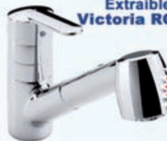
Grifo de Cocina Extraíble Victoria ROCA