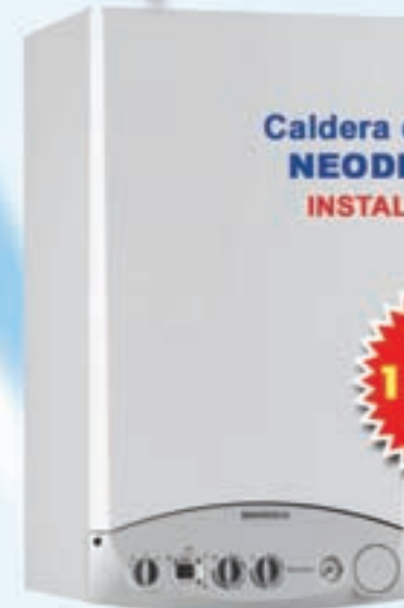
Caldera de Condensación NEODENS BAXIROCA INSTALACIÓN INCLUIDA