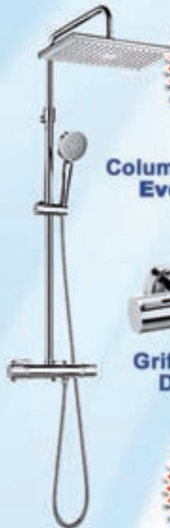
Columna Termostática Even-T Square ROCA