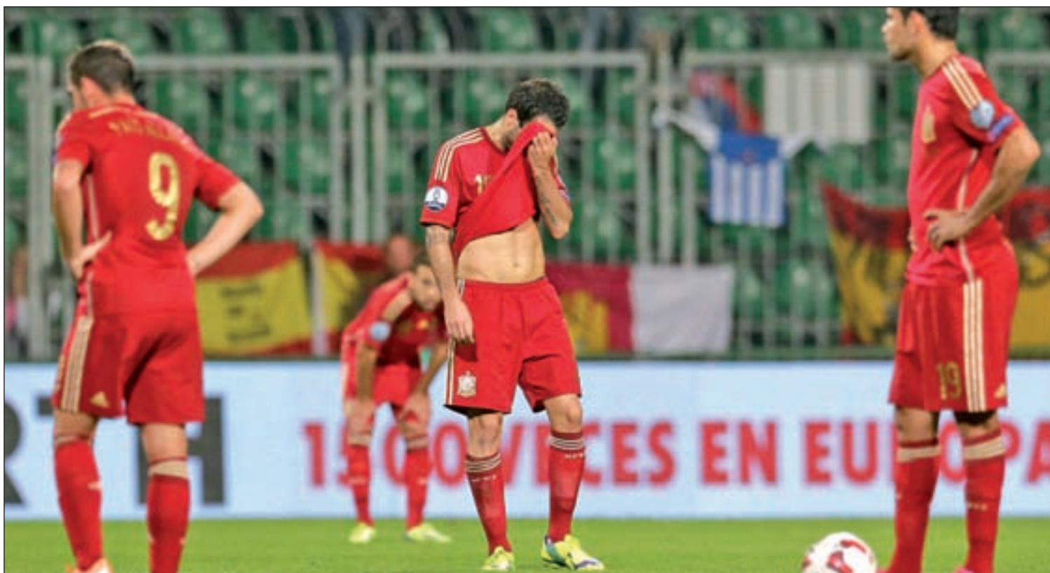
Las dudas de la selección española aumentaron con la derrota sufrida en suelo eslovaco