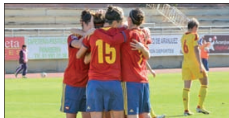
La selección española afronta con ilusión la cita de Canadá

que consideran una "discriminación de género". El abogado de las jugadoras defiende que "los veinte Mundiales masculinos que ya se han disputado fueron sobre hierba natural, y los dos próximos están planeados sobre la misma superficie. La discriminación con las mujeres es un hecho".