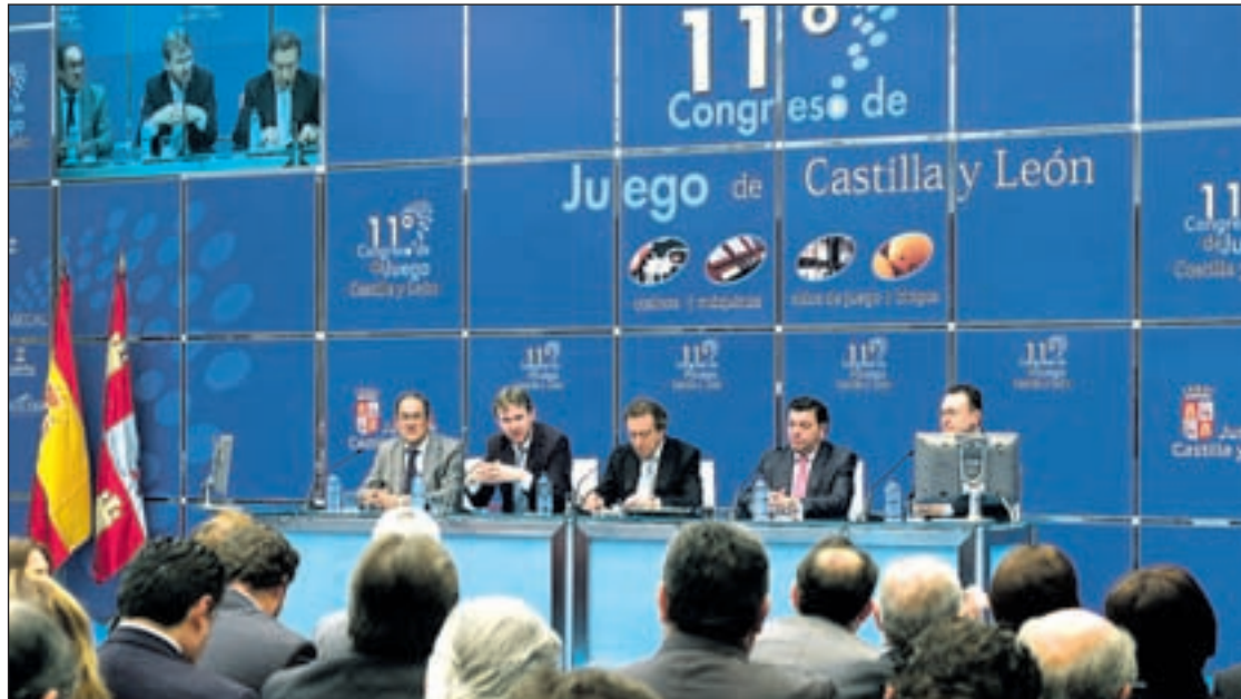
Imagen del XI Congreso de Juego Castilla y León celebrado en Burgos los días 11 y 12 de noviembre

Durante su intervención, el consejero de Presidencia afirmó que el próximo año se va a permitir la baja temporal de hasta el 20% del parque de máquinas B de cada empresario y se van a establecer cuotas reducidas por tramos para las máquinas. "El compromiso del Gobierno de la Comunidad en esta legislatura con la actividad del juego ha sido y es constante y dinámico. La Junta