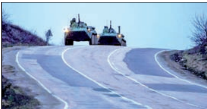
Imagen de dos tanques

"El despliegue de equipos militares y mercenarios rusos continúa en las líneas del frente", dijo Lisenko, en una comparecencia televisada en la que alertó de una supuesta incursión transfronteriza por parte de Rusia.