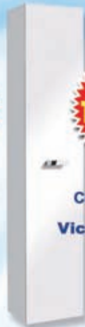
Columna de Baño Victoria Basic Blanco ROCA