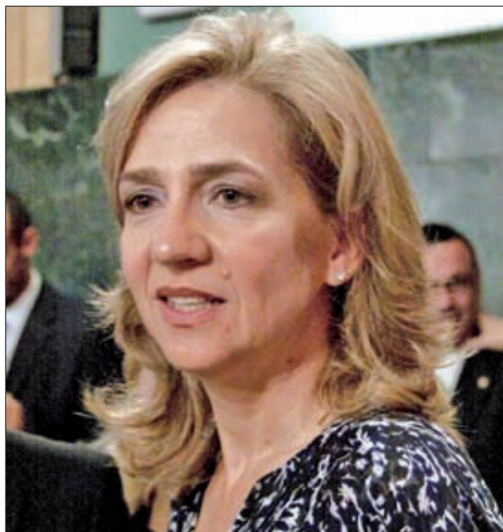
La Infanta Cristina

La infanta podría enfrentarse a una petición de hasta seis años de cárcel por los dos delitos fiscales