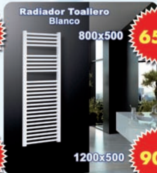
Radiador Toallero Blanco