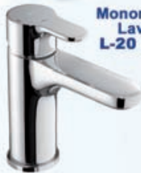
Monomando Lavabo L-20 ROCA