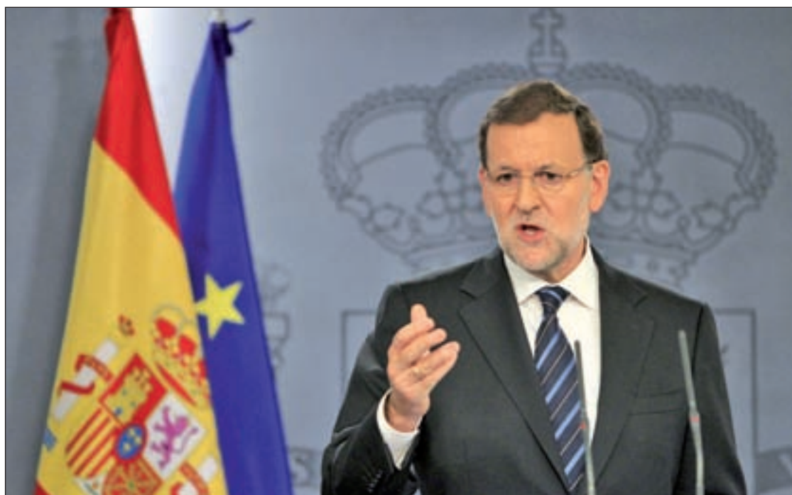
Mariano Rajoy, durante su comparecencia en el Palacio de la Moncloa

Durante su intervención, Rajoy aseguró que "no ha habido una consulta. Hemos asistido a un simulacro electoral. Ha sido un acto de propaganda política". Además, también mandó un mensaje para Artur Mas: "Quiere imponerme un referéndum de verdad