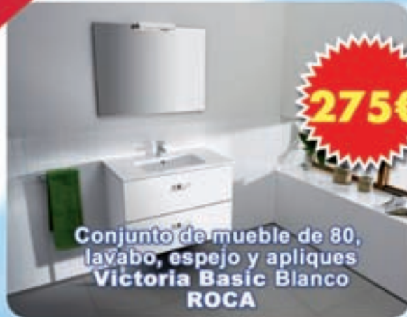
Conjunto de mueble de 80, lavabo, espejo y apliques Victoria Basic Blanco ROCA