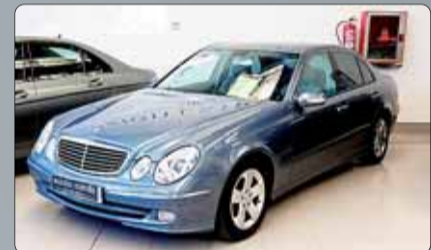
Mercedes E 270 CDI Avangarde Año 2002. 8 airbags. ABS. ESP. BASS. Climatizador bizona. Navegador. Cargador CD's. Faros Bixenon. Espejos abatibles. Partronick. Tempomat. Techo solar. Sensor de luz. Preinstalación de telefono. 1 año de garantía.