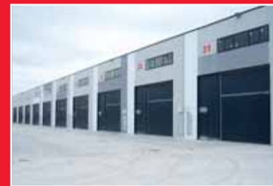
NAVES DE CASTAÑARES

Polígono Las Garzas, desde 250 m 2 construidos