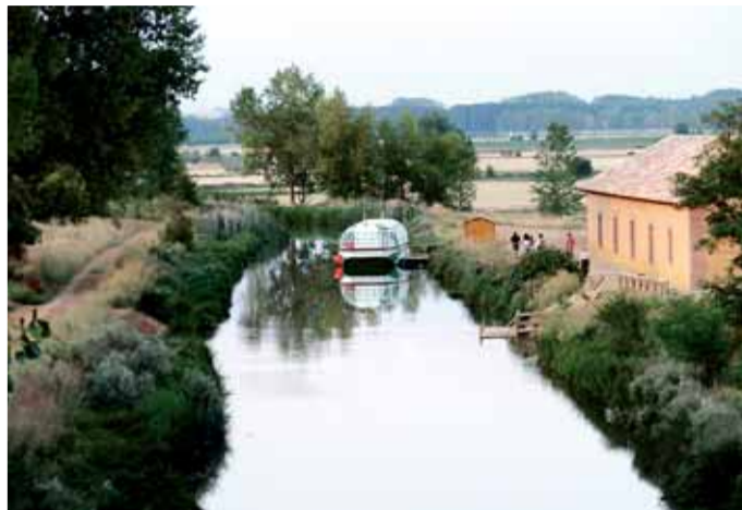
El Canal de Castilla es uno de los atractivos que aporta Melgar.

Para ello, la Diputación de Burgos presentó el martes 14 el proyecto que se ejecutará en los próximos cuatro meses, y que prevé la adecuación y puesta en servicio de 15 senderos autoguiados para que los visitantes conozcan el entorno de la Peña Amaya; así como un centro BTI, especializado para la práctica de la bicicleta de montaña, que ofrecerá 100 kilómetros de circuito diseñado para la práctica depor-