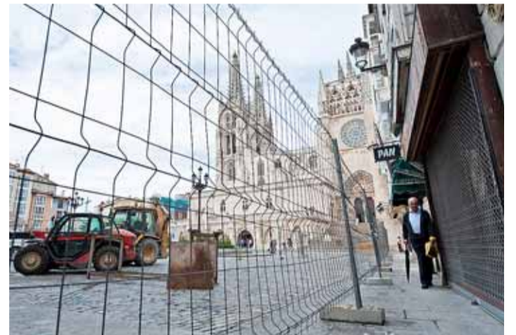
El Plan Catedral XXI supone la rehabilitación del entorno del templo, y Plaza de Felipe Abajo.

Los trabajos en la Plaza del Rey San Fernando suponen el comienzo de unas obras detalladas en el Plan Catedral XXI, que contempla diez fases de actuación distintas en el entorno del templo burgalés y una inversión de 3,5 millones. En concreto, se dividen en dos grandes bloques; el primero de ellos en la citada plaza, y el segundo en las calles Nuño Raura, Asunción de Nuestra Señora