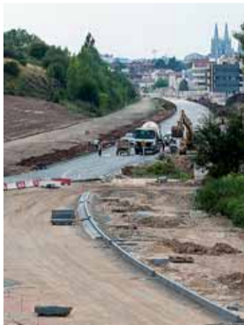
Los coches dejarán de circular por un tramo de La Quinta el día 20.

minación del entorno y se completen los trabajos, en marzo de 2011 comenzarán las obras que permitirán ampliar el trazado desde el puente Timoteo Arnáiz.