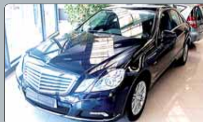
Mercedes E 250 Elegance Año 2009. 10 airbags. ESP. ABS. Climatizador bizona. RadioCD con MP3. Sensor de lluvia. Faros bixenon con luces activas. Tempomat.