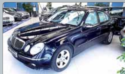
Mercedes Clase E 350 4Matic Avant Garde Año 2005. 8 airbags. ABS. ESP. Comand. Tapicería de cuero. Asientos calefactados. Faros bixenon.