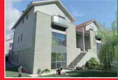
UNIFAMILIARES EN SOTOPALACIOS

Viviendas de 2 y 3 dormitorios con excelentes vistas, a su disposición en el centro de Burgos.