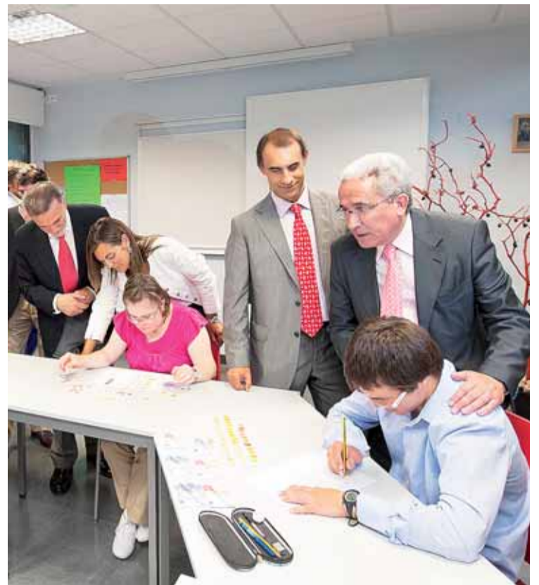
El Centro Estela capacita laboralmente a sus usuarios. En la imagen, con el consejero y el alcalde.

El objetivo de quienes trabajan con los jóvenes del Centro Estela no es otro que formar a personas que el día de mañana puedan ser autónomos e independientes. La adquisición de esta autonomía es una de las mayores preocupaciones de los progenitores de las personas con Síndrome de Down.