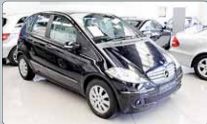
Mercedes Clase A 150 Gasolina Elegance Año 2008. Dirección asistida. Elevelunas. Cierre Centralizado. Climatizador. ABS. ESP. BASS. Alarma. 2 años de garantía.