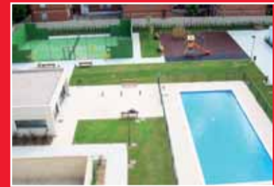
JARDINES DE LA ESTACIÓN

Polígono Las Garzas, desde 250 m 2 construidos