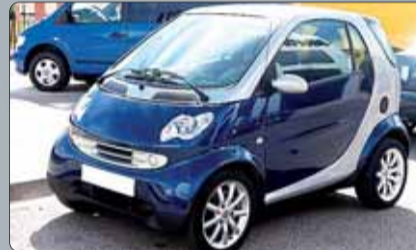
Smart Fortwo Grandstyle Año 2007. 2 airbags. ABS. ESP. Climatizador. RadioCd. Elevelunas. Pintura metalizada. Techo panorámico. 2 años de garantía.