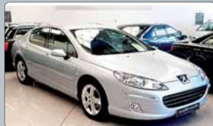
Peugeot 407 HDI Sport Pack 136 cv. Año 2007. 8 airbags. ABS. ESP. Climatizador Bizona. Faros Bixenon. Tapicería cuero Alcántara. RadioCD. MP3. Control velocidad. Sensor de luz y de lluvia. Libro de Revisiones. Pintura metalizada. 1 año de garantía.