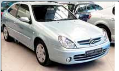
Citroën Xsara 1.9 HDI VTR Año 2003. 4 airbags. ABS. Climatizador. RadioCD. Pintura metalizada. Mandos en el volante. Asientos deportivos. Cierre centralizado. 1 año de garantía.