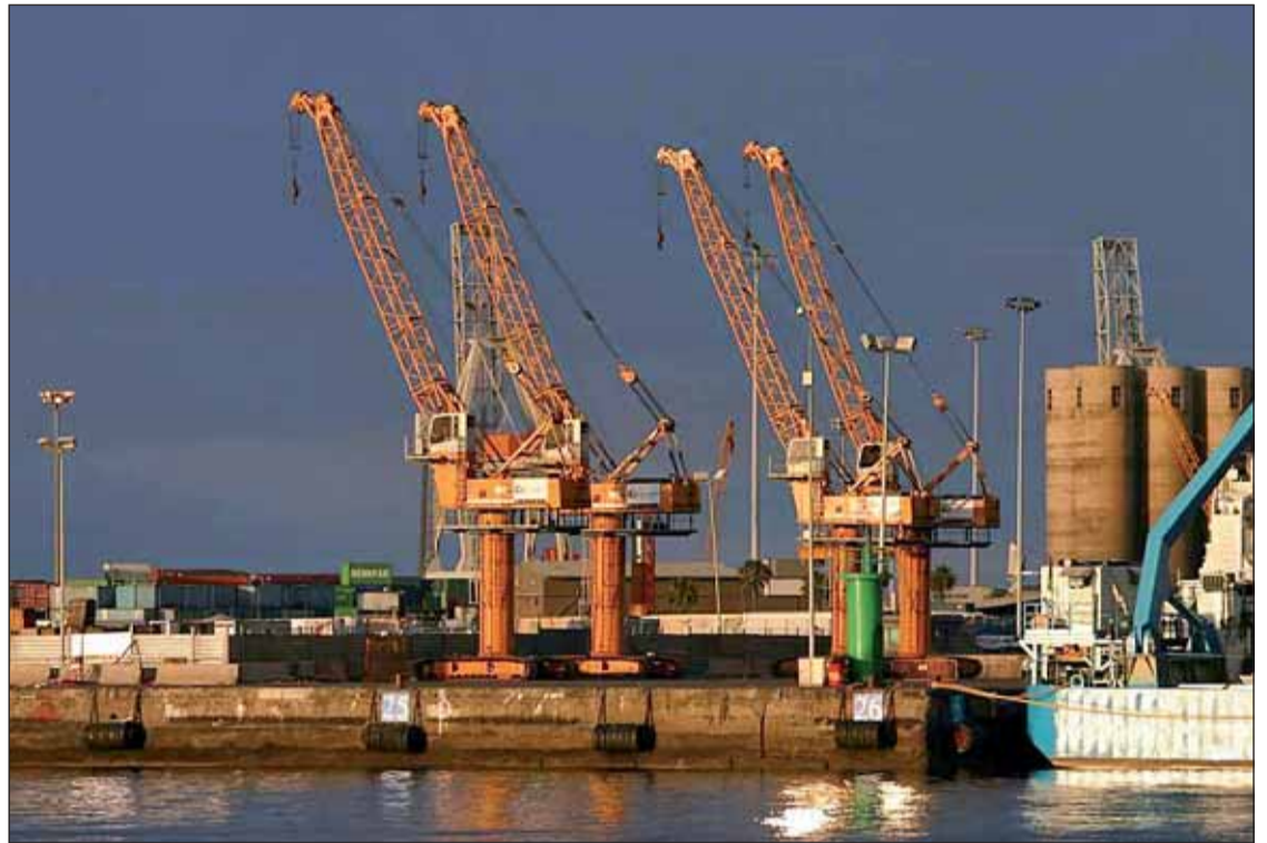
Imagen de un puerto español; la red de puertos aglutina el 80% de las importaciones y el 65% de las exportaciones.

En cuanto al destino de estos fondos, destacan los 2.520 millones de euros que se emplea-