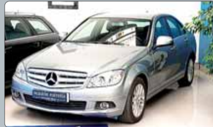
Mercedes C 200 K Elegance Año 2007. 10 airbags. ABS. ESP. Climatizador bizona. RadioCD. Elevelunas. Espejos abatibles. Tempomat. Pintura metalizada. 2 años de garantía.