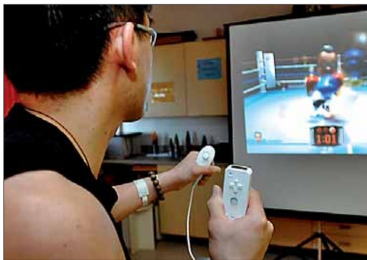
Un joven jugando a un videojuego en su casa

El informe de la UE destaca estos jóvenes que no trabajan ni estudian corren "el riesgo de quedar excluidos de forma permanente del mercado laboral ya que no están adquiriendo