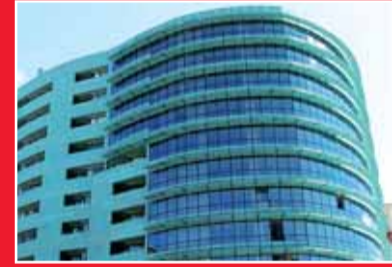
EDIFICIO PUERTA DEL REY

Viviendas de 2 y 3 dormitorios con excelentes vistas, a su disposición en el centro de Burgos.