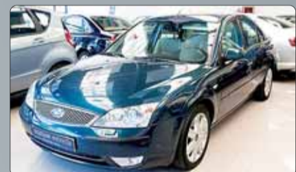
Ford Mondeo 2.0 TDCI Ghia 132 cv. Año 2003. 8 airbags. ABS. ESP. Climatizador. Cargador CD's. Tapicería cuero Alcántara. Faros Bixenon. Pintura metalizada. Llantas. Sensor de luz. Un año de garantía.