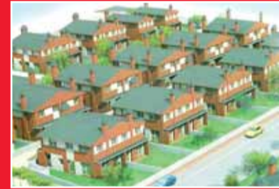
RESIDENCIAL "COSTA ZAFIRO"

Pisos, apartamentos y áticos con terraza de 1-2 y 3 dormitorios. A estrenar. Garaje y trastero. Exteriores. Urbanización privada, piscina-padel.