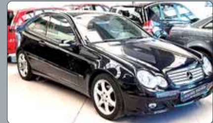
Mercedes C Sport Coupe 180 K y 230 K Año 2002/2006. Full Equip. Varias unidades.