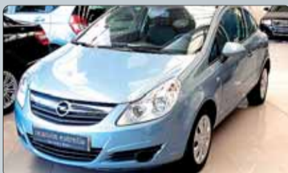
Opel Corsa 1.7 CDTI Esencia Año 2007. 8 airbags. ABS. ESP. Climatizador. Radio CD con MP3. Volante multifunción. Control de velocidad de crucero. Pintura metalizada.