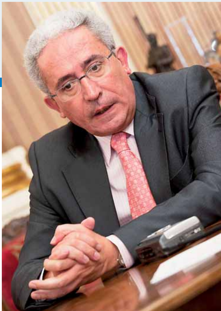
El alcalde está “volcado” en el trabajo del día a día.

Se están cumpliendo plazos, se ha podido abordar financieramente el tramo más importante, puesto que es el que afecta a más población y que había creado situación de mayor aislamiento. Desde la antigua estación de Renfe hasta prácticamente Gamonal va a quedar resuelto. Un eje nuevo de gran capacidad, gran fluidez, dotado también de transporte público, y que va a suponer un gran cambio en los usos y en las costumbres y va a mejorar la calidad de vida de muchos burgaleses. Las obras se están desarrollando con normalidad y en semanas veremos los primeros resultados con los tramos de La Quinta que se van a habilitar, con la desaparición de estorbos urbanísticos como era el paso elevado en Fuente Prior. También antes de que acabe esta legislatura tendre-