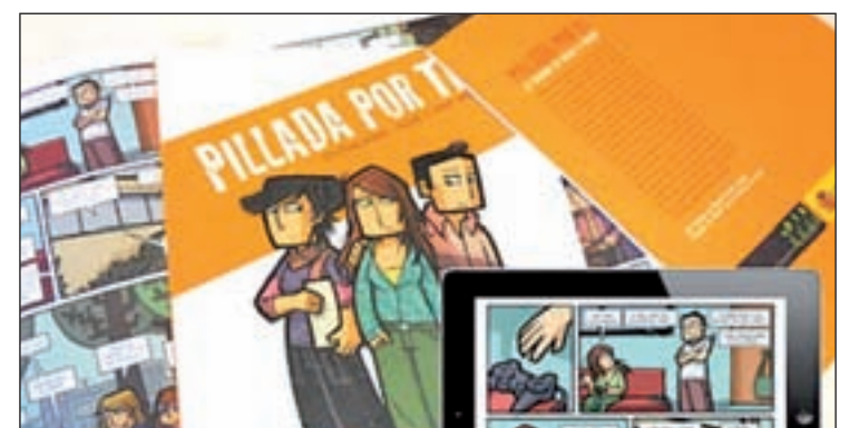
Imagen de 'Pillada por ti', 'app' del Ministerio de Sanidad

co, en Costa Rica, destaca la aplicación 'Tu novio es...' que, vía Facebook, ayuda a los jóvenes a valorar si su relación es o no saludable. Esta 'app' fue la vencedora en el 'I Hackathon contra la violencia de género' organizado en 2013 por el Banco Mundial en Washington y América Central.