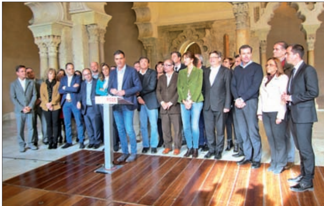
Pedro Sánchez y el resto de miembros del equipo, durante el encuentro en Zaragoza

Así, los socialistas recuperaron el pasado domingo la propuesta de abrir un debate en el Congreso de los Diputados sobre la reforma, mediante la creación de una subcomisión en la Comisión Constitucional, una iniciativa que planteó el anterior líder del PSOE, Alfredo Pérez Rubalcaba, pero que no se llegó a registrar. Ahora, Sánchez ha explicado que la llevarán próximamente al Congreso para iniciar un debate previo a la creación de una ponencia constitucional. El objetivo del PSOE es, según dicen desde el partido, "abrir un proceso de participación" en el que se escuche a expertos, ins-