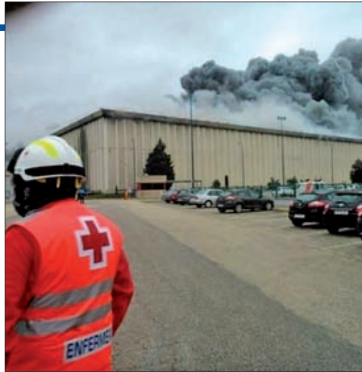
Imagen de la fábrica de Campofrío de Burgos, durante el incendio

Campofrío trasladó al Ayuntamiento de Burgos su intención de abrir una nueva planta en 2016 que dé trabajo a todos los empleados de la anterior fábrica. Así lo confirmó el alcalde de la ciudad, Javier Lacalle, quien explicó que el director general de la com-