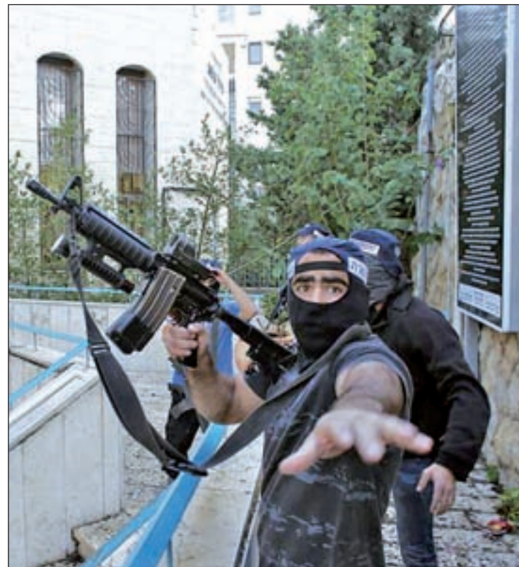
Fuerzas de seguridad durante el ataque

El texto original de los socialistas insta al Gobierno a reconocer el Estado palestino aunque no