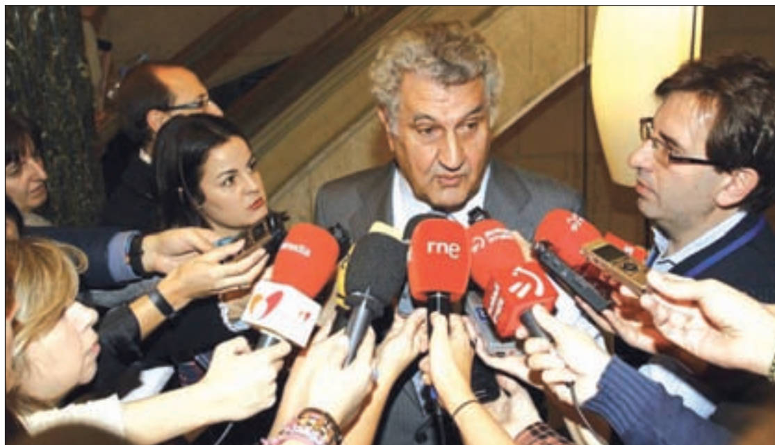
El presidente de la Cámara Baja, Jesús Posada

El Juzgado de Instrucción número 5 de Fuenlabrada ha acordado la entrada y registro en unos 150 domicilios a instancia de la Fiscalía en diferentes localidades de las Comunidades Autónomas, así como el embargo de las cuentas corrientes de los imputados.