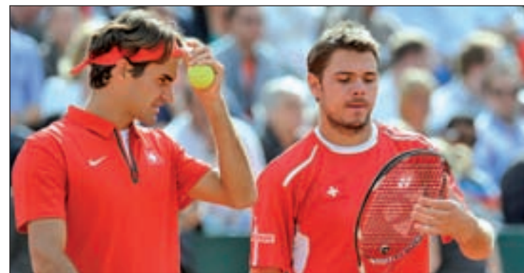
Federer y Wawrinka, ante su gran oportunidad en la Davis