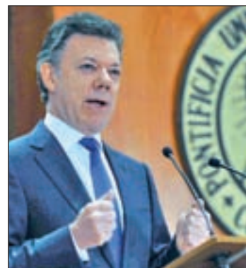
Juan Manuel Santos

Además anunció que ha ordenado al comandante general de las fuerzas militares "que haga las operaciones necesarias, como las que se están haciendo en Arauca para rescatar a los dos soldados secuestrados el mes pasado (...)