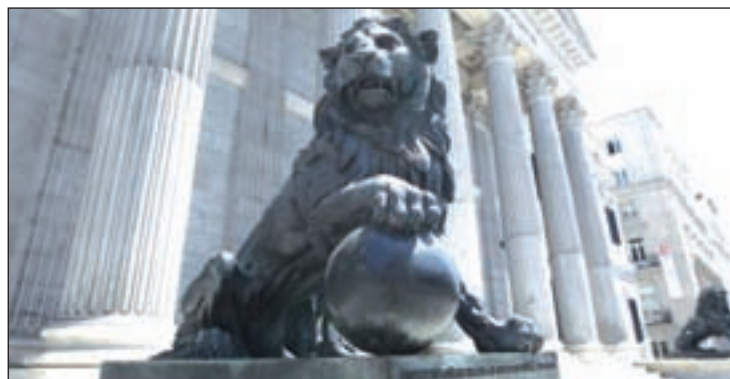
Imagen del Congreso

Desde el 18 de noviembre las cuentas han pasado a manos del Senado, donde los grupos presentarán de nuevo vetos a la totali-