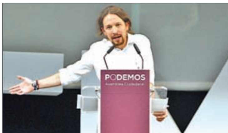
Miembros del Consejo de Coordinación

El Consejo Ciudadano de Podemos celebrará su siguiente reunión el próximo 29 de noviembre para fijar sus objetivos y elaborar "un plan de rescate ciudadano y