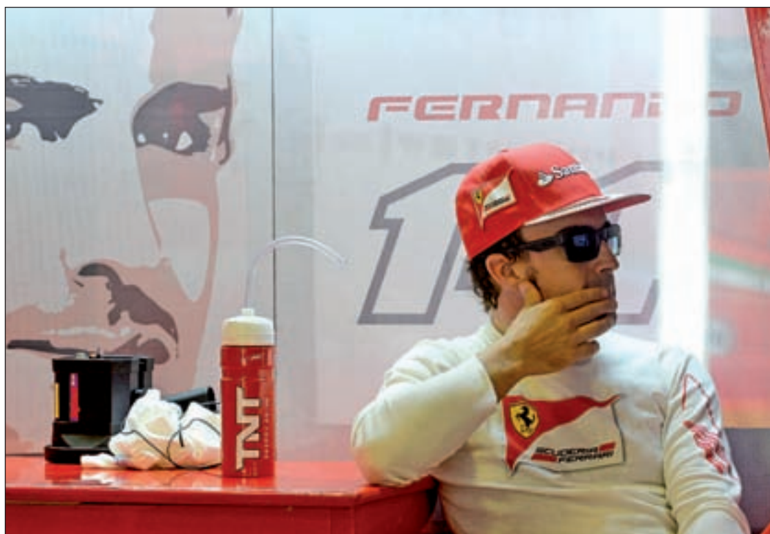
El piloto asturiano comenzará en breve una nueva etapa en su carrera deportiva

Durante este periodo de tiempo, uno de los grandes problemas con los que se han encontrado Alonso y su Ferrari ha sido la jornada de los sábados. Las sesiones de clasificación no han sido demasiado positivas para el asturiano, que sólo ha podido afrontar las carreras de los domingos desde la primera posición de la parrilla. Dicho de otra forma, Alonso