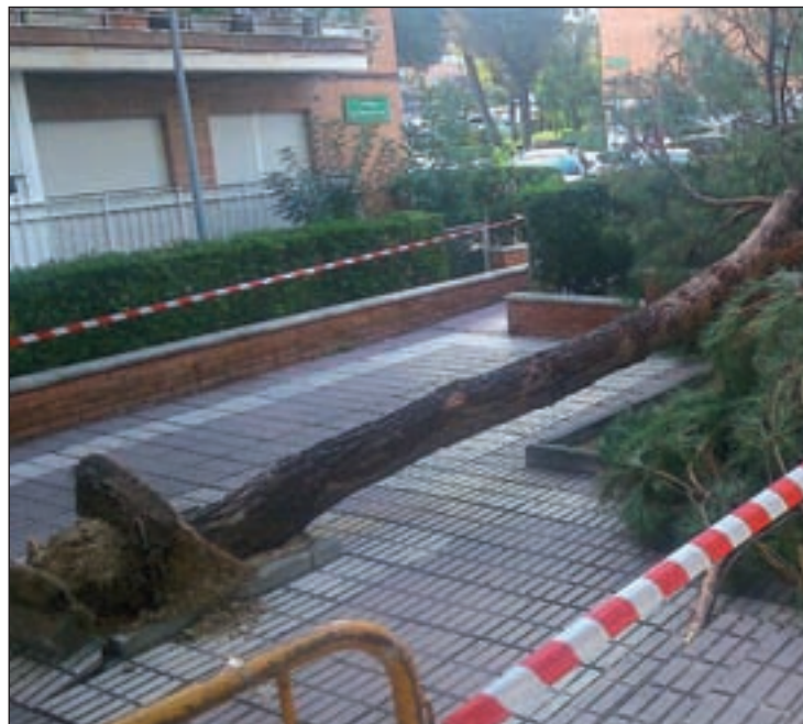
El árbol caído en la calle Celso Emilio Ferreiro

Esta inspección se centra principalmente sobre tres factores del ejemplar: la probabilidad de un fallo en el estado de su estructura, la relación entre el tamaño y la altura y la propia especie. La empresa encargada de estos trabajos será Tecnigral, que según ha puntualizado el Ayuntamiento, es experta en este tipo de actuaciones sobre el arbolado viario y cuenta en su equipo con ingenieros, biólogos y dispone de las últimas herramientas tecnológicas para el análisis de los ejemplares. Asimismo, el Ayuntamiento ha detallado que se trata de unas empresas "más punteras" en la modelización del comportamiento de los árboles y arbustos, con lo que se evitarán posibles problemas de