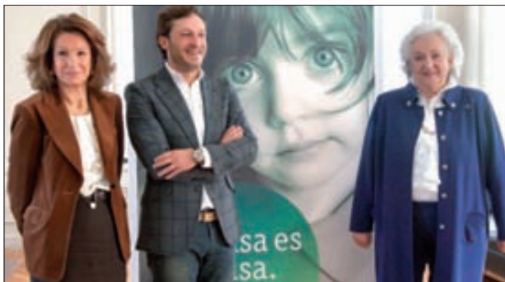
Presentación del Rastrillo de Nuevo Futuro

Nuevo Futuro ha proporcionado asistencia a más de 7.000 menores desde 1968.