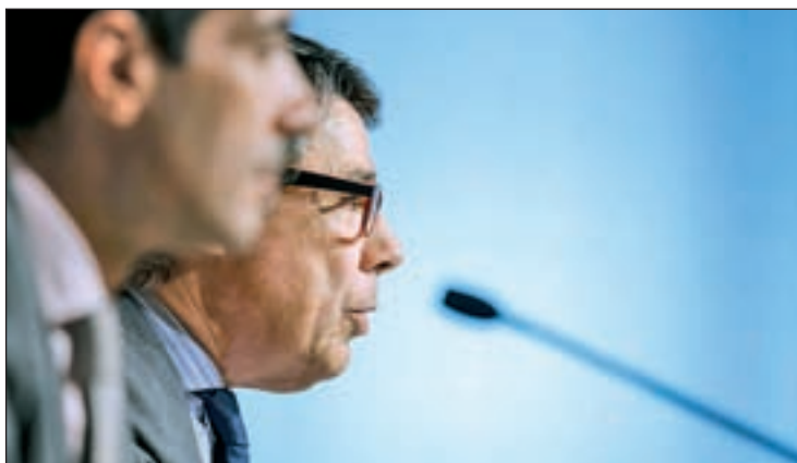
El presidente Ignacio González anunció estas medidas

Será la tercera bajada del IRPF en esta legislatura y la segunda que lleva a cabo González, e incidirá especialmente en los mileuristas y las clases medias. Además, se favorecerá a las familias mediante un importante incremento de los mínimos exentos personales y familiares. De esta manera, para el año que viene se ha creado un nuevo tramo en el IRPF para las rentas inferiores a 12.450