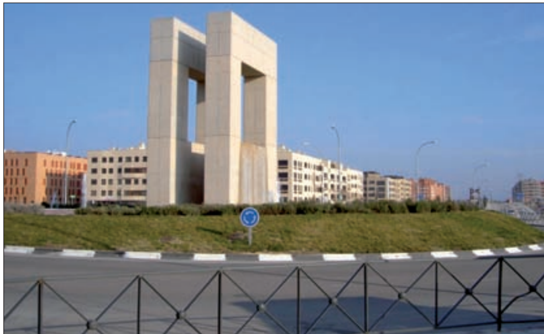
Una de las entradas al barrio de Fuentelucha de Alcobendas

Con éste, son varios los robos que se han producido en trasteros y garajes en esta zona y en Tempranales, en San Sebastián de los Reyes, en los últimos meses. Para atajar el problema, tanto la Policía Local de los dos municipios han mantenido varias reuniones, además de las de coordinación con la Policía Nacional. Precisamente, el último Balance