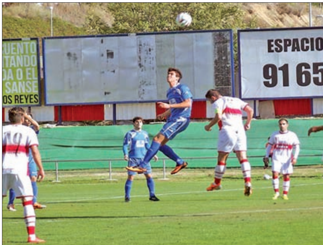
El Sanse, en el partido de la semana pasada ante el Puerta Bonita