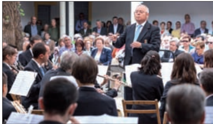
Concierto de la Banda Municipal de música de Getafe

La música centrará la programación cultural del fin de semana en el municipio. Con motivo de la festividad de Santa Cecilia, el Teatro Federico García Lorca acogerá una serie de recitales que se extenderán hasta el próximo mes de diciembre. Corales polifónicas, bandas de música, gospel, tangos o zarzuela tendrán cabida dentro de este ciclo. Este viernes 21 de noviembre, a las 19 horas, los vecinos podrán disfrutar de la ópera 'Rigoletto', en su versión musical escenificada y con un precio por entrada de 10 euros. Para el sába-