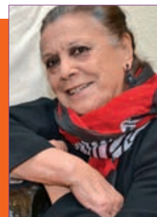
iGente TIEMPO LIBRE Pág. 16

Afectados por esta enfermedad ha continuado en días posteriores con las protestas, demandando que el tratamiento se extienda. "Cuando nos constituyamos como asociación, presentaremos una querrela criminal contra Rajoy, Ana Mato y otras autoridades", avanza. PÁG. 12