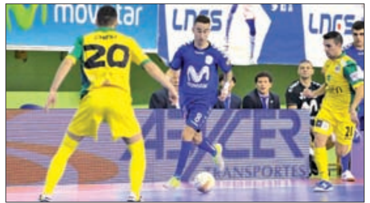
Los alcaláinos derrotaron al Jaén en su último choque

Así, dos de los madrileños que han conseguido recientemente éxitos a nivel internacional, Sandra Aguilar y Javier Fernández, encabezan esta lista, al recibir 8.000 euros cada uno.