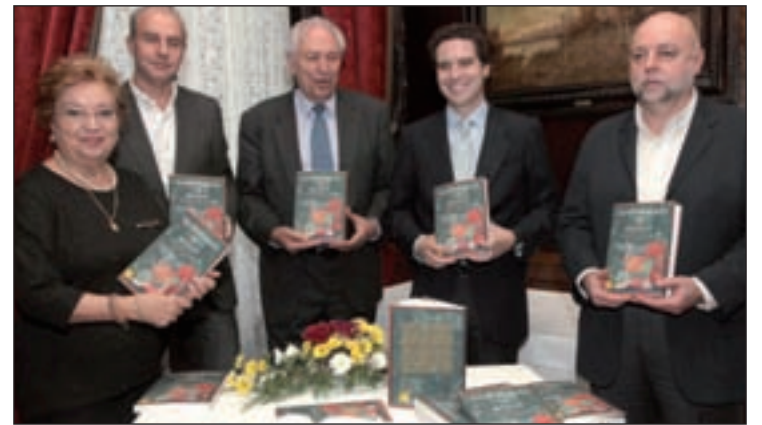
Presentación del libro

En sus páginas, se hace un recorrido por la historia de lo que se ha comido en la Comunidad, tanto en las casas como en las tabernas, los restaurantes, las pastelerías y los mercados con más tradición, al igual que se recogen las materias primas que más se han cultivado, y se siguen cultivando, en la región. Las ferias, las posadas y los hoteles, las fondas y los cafés también son los prota-