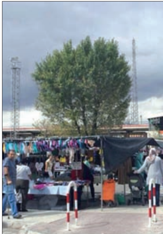
Antigua y nueva ubicación del rastro de Getafe

Otro de los asuntos que se resolvería con el traslado del rastro es la polémica de los nuevos tornos de la estación, que dejó a los vecinos de El Bercial incomunicados hace unos meses, sin poder cruzar al mercadillo si no era pagando el billete de tren. Una situación que provocó algunos altercados entre los responsables de Renfe en Las Margaritas y los vecinos, que llevaban años atravesando la estación para hacer