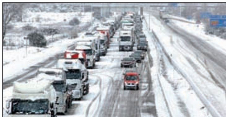
La aplicación tiene en cuenta la posición GPS del usuario GENTE

to Certificado, la nueva marca de garantía creada por el Gobierno autonómico para asegurar la calidad diferenciada de los productos agroalimentarios producidos, elaborados y transformados en la región. Esta nueva marca se pondrá en marcha en 2015 con una dotación presupuestaria de 800.000 euros, y la adhesión a la misma supondrá un incremento del valor añadido del género madrileño de calidad. Está previsto que M Producto Certificado agrupe a más de 300 empresas y hasta 1.500 referencias de productos en su fase inicial, tal y como destacó el consejero de Medio Ambiente, Borja Sarasola, en la presentación del libro gastronómico.