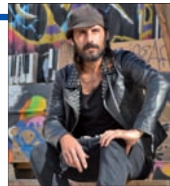
CHEMIA MARTINEZ / GENTE

prefiere "no compartir escenario con gente muy grande", porque se pondría "muy nervioso". "Por ejemplo, no compartiría escenario con los Rolling Stones".