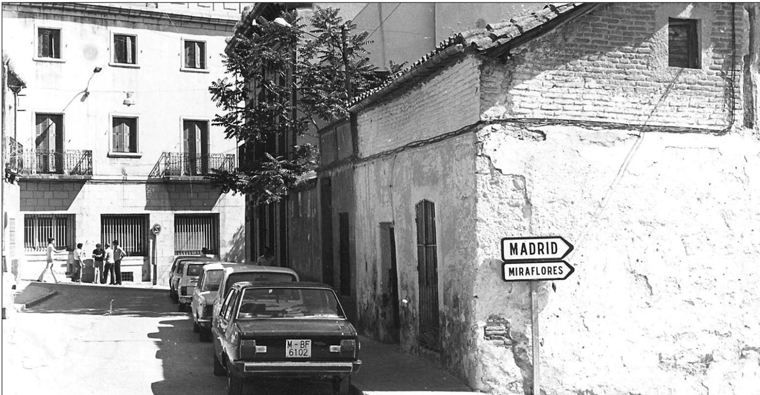
La calle de la Iglesia con el Ayuntamiento al fondo en los años 40