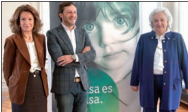
Presentación del Rastrillo de Nuevo Futuro

El Rastrillo de este año contará con unos 1.200 voluntarios y más de 70 puestos dedicados a la restauración, antigüedades, decoración y moda, entre otras temáticas. La organización Nuevo Futuro ha proporcionado asistencia a más de 7.000 menores desde que en 1968 comenzara a funcionar.