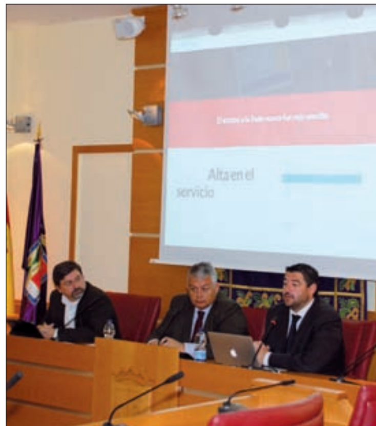
El alcalde de Colmenar un acto