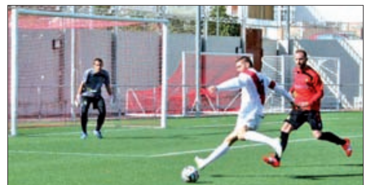
El Colmenar en un partido de esta temporada

La semana pasada, nueva derrota ante el Unión Adarve, en un encuentro en el que los visitantes pasaron por encima de los colmenareños. A pesar de que sólo fue por 0-1, el equipo local no dio muestras de recuperación para poder salir del pozo en el que se encuentra metido.