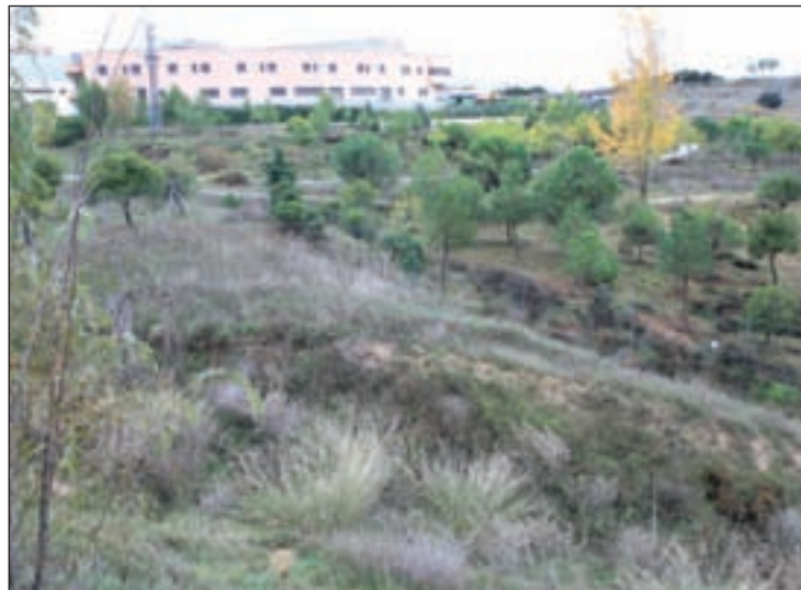
La zona donde se ubicará el parque

Hay que recordar también, que el nombre que llevará este espacio verde fue elegido durante el pasado curso escolar por todos los alumnos de sexto de Primaria de los colegios públicos de la localidad, a través de un concurso