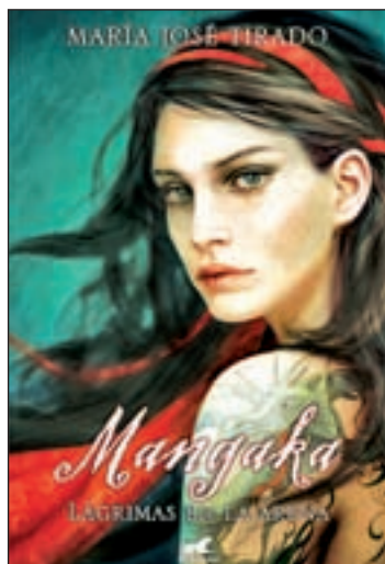
Premio Vergara en 2013