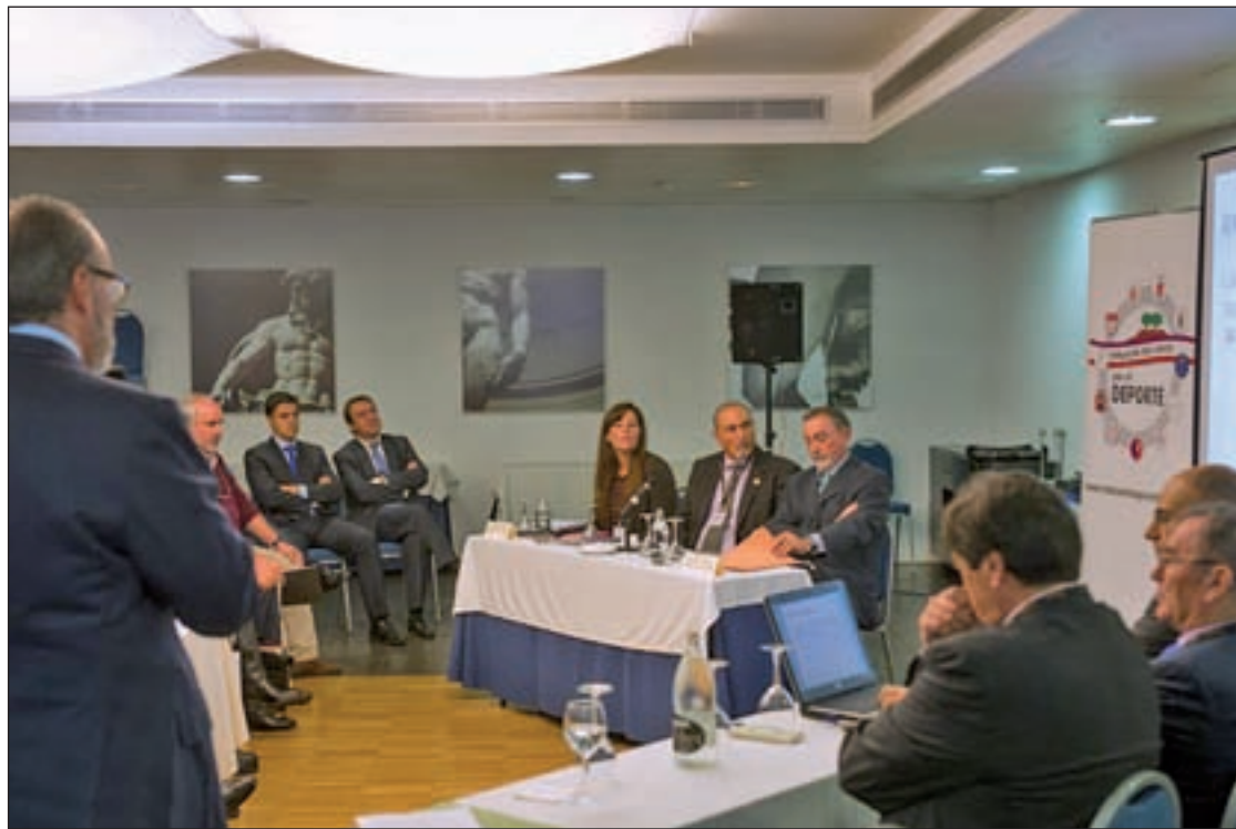
La presentación de la Fundación

Con todo puesto en marcha, y con la fundación presentada en sociedad, los objetivos ahora "vienen marcados por el plan de acción de cada temporada", y los principales, según su presidente, "son la constitución de un fondo para ayudar a los socios, y organizar unas jornadas a lo largo de