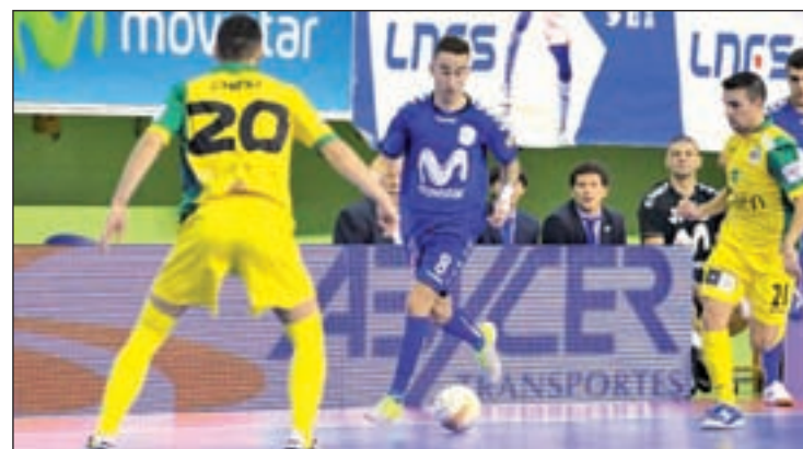
Los alcaínos derrotaron al Jaén en su último choque