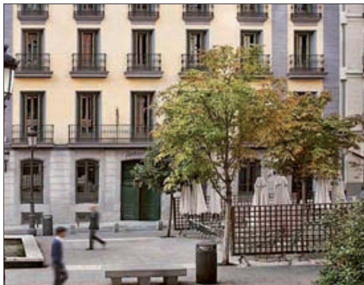
La fachada del Hotel Radisson Blu Madrid Prado

actualizado, a falta de contabilizar las reservas de última hora que se puedan producir.