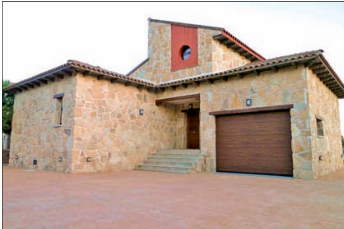
Chalet Rural Las Jaras en El Berrueco (Madrid)

La parte rural de Madrid también es una opción para disfrutar de estas mini vacaciones. El portal de turismo rural Tuscasasrurales.com ha analizado la ocupación media en España durante el puente de la Constitución, situándose la misma en un 62,8% entre los alojamientos rurales de alquiler completo que tienen el calendario de ocupación de sus fichas