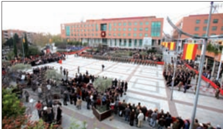
La última jura de bandera en Alcobendas

el que participarán un total de 88 personas. Los encargados de oficiar el evento volverán a ser el Ayuntamiento de la localidad y el Regimiento de Infantería Acorazada Guadarrama XII, con base en El Goloso. Asimismo, también colaborarán en la celebración las casas regionales con conciertos, teatro o degustaciones.