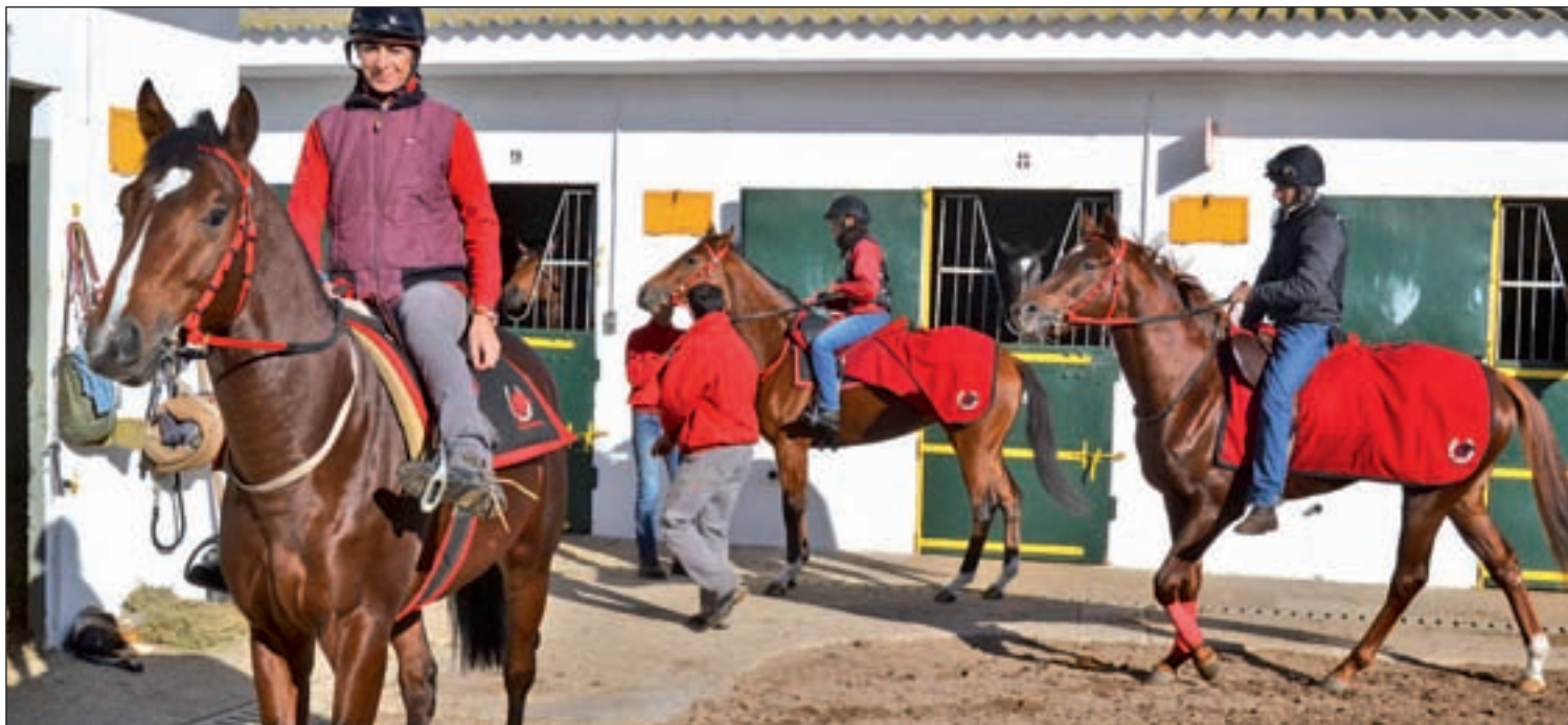
Caballos y 'jockeys' preparados en el patio antes de partir hacia las pistas del Hipódromo de La Zarzuela a entrenar