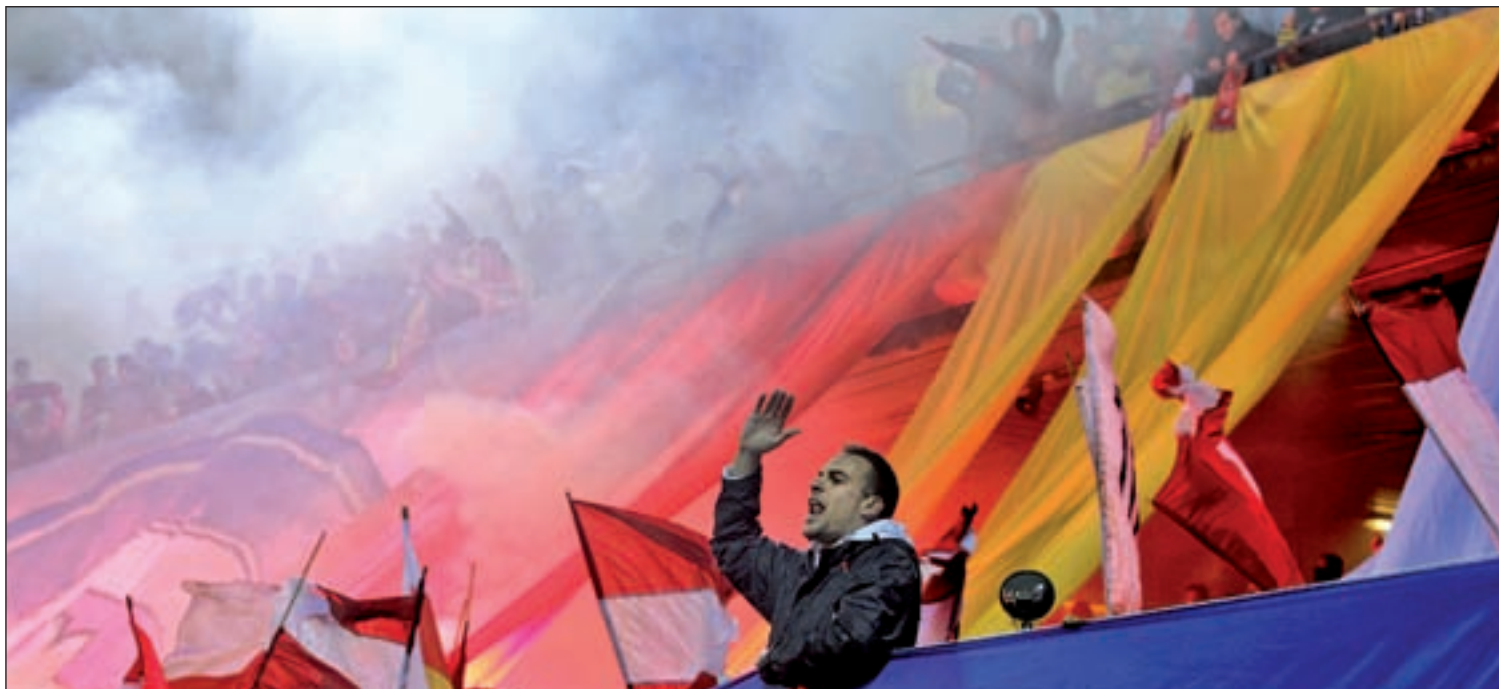
Los radicales rojiblancos han estado los últimos días en el ojo del huracán