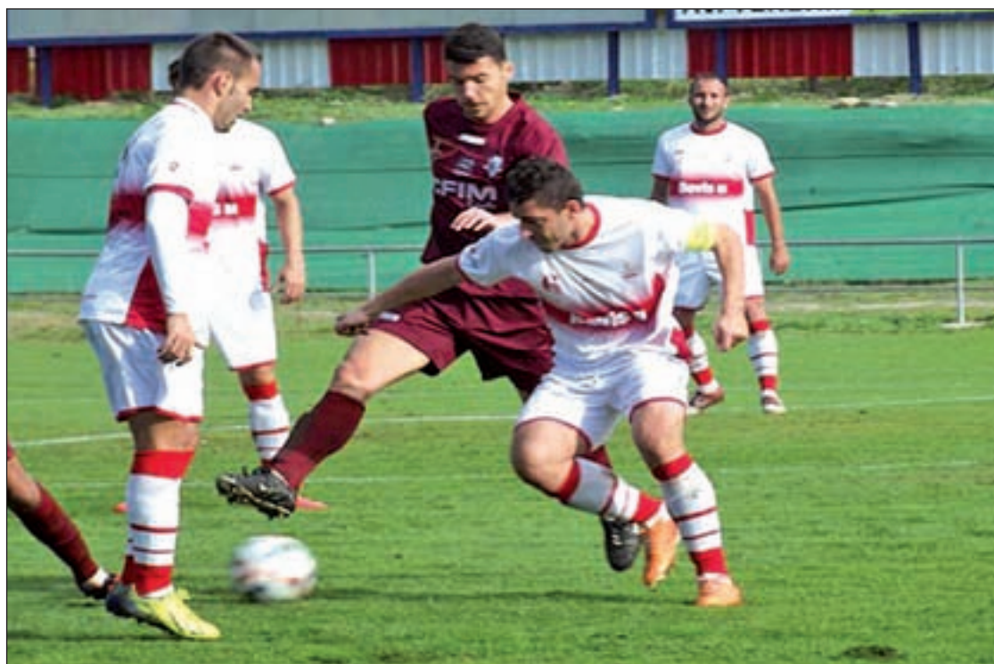
El Sanse, en un partido de esta temporada

En Alcobendas también habrá fútbol de calidad y emoción este fin de semana. El domingo el Levitt recibirá en el Luis Aragonés al CD Navalcarnero. El conjunto verde consiguió en la última jornada un buen resultado ante el Alcalá de Henares, al que ganó por 0-2 en su casa, y por ello, esta