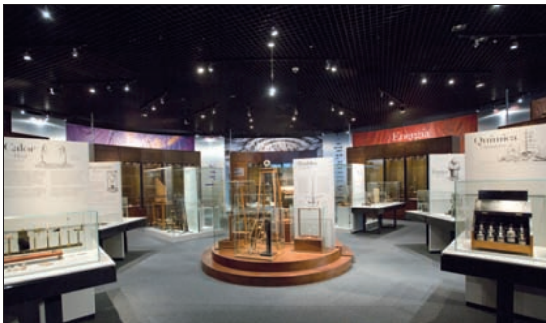
Una de las salas de la nueva sede del MUNCYT en Alcobendas

Ubicado en el antiguo Cosmo-caixa, este nuevo epicentro de conocimiento intentará suplir su falta, con un programa cargado lleno de iniciativas, a través de pro-