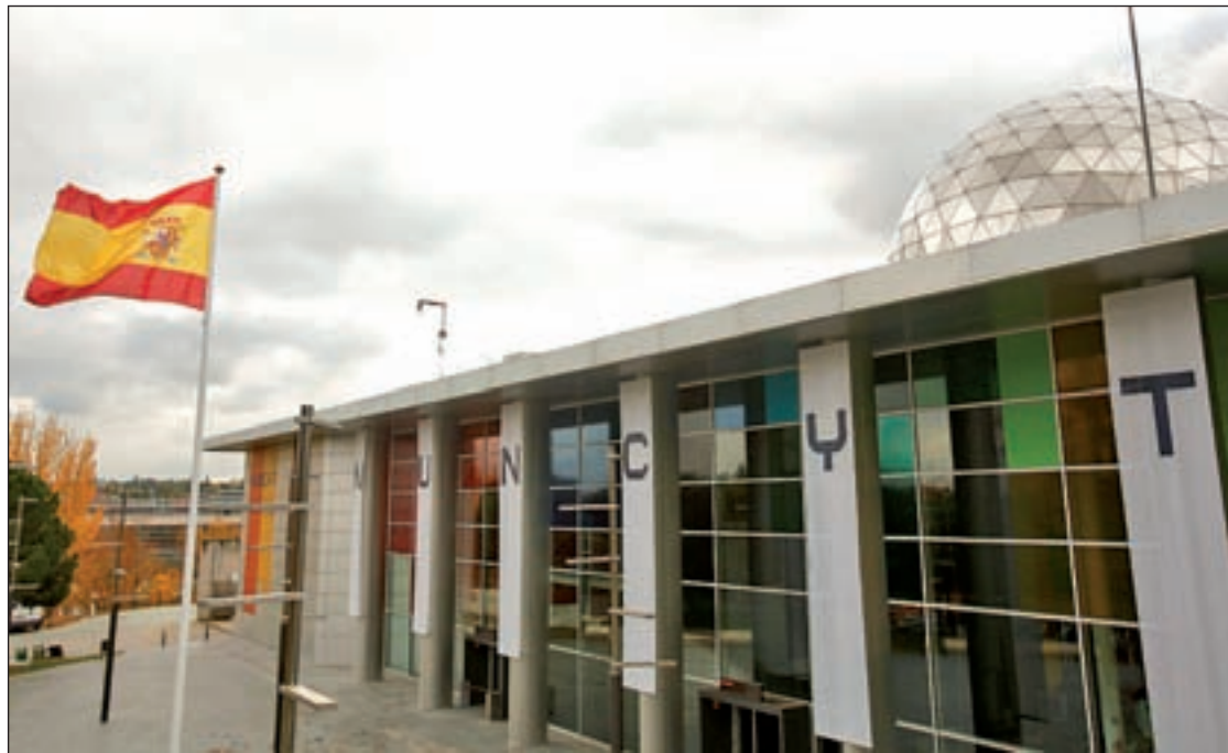
Las instalaciones de MUNCYT acogerán este peculiar espacio

Los elegidos contarán con un proceso de 'mentoring' especializado e individualizado, que incluye todas las fases necesarias para desarrollar su idea y llevarla adelante con éxito. Recibirán también un completo plan de formación adaptado a las necesidades de los