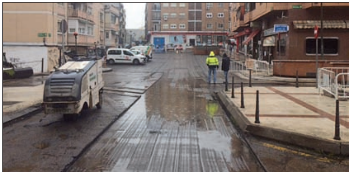
Las obras de la Plaza de la Concordia se desarrollan a buen ritmo

Los usuarios del Polideportivo Dehesa Boyal de San Sebastián de los Reyes estrenan nuevas pistas de atletismo y rugby. Se ha renovado el pavimento, instalado una nueva zona para saltos de altura y pértiga y se ha sustituido el césped natural por artificial.