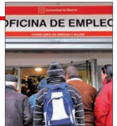
Oficina de Empleo

millones de euros. La Consejería de Empleo se centrará en el Plan de Empleo del próximo año junto a otros dos destinados a autónomos y a jóvenes, respectivamente.