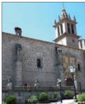
La basílica de Colmenar

La Basílica de la Asunción de Nuestra Señora, la Casa-Museo de la Villa, la Capilla de San Francisco, la Capilla de Santa Ana, la Ermita de Nuestra Señora de Los Remedios y los yacimientos de Navalvillar y Navalhija son las edificaciones y enclaves de Colmenar Viejo que los madrileños y visitantes podrán descubrir a través de la campaña regional de Renfe y la Comunidad de Madrid