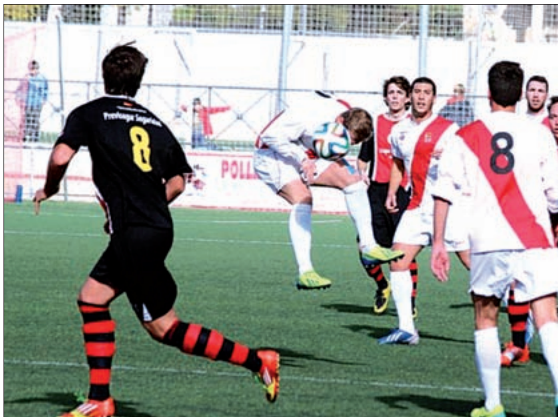
El Colmenar, en un partido de esta temporada

El partido, que se disputará este domingo en el Municipal Los Prados, será un importante duelo entre dos equipos que querrán sumar los tres puntos para alejarse de la zona baja de la tabla o, en