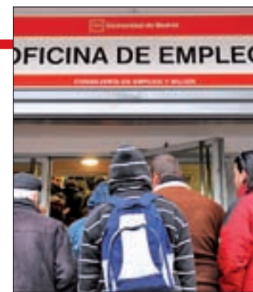
Oficina de Empleo

millones de euros. La Consejería de Empleo se centrará en el Plan de Empleo del próximo año junto a otros dos destinados a autónomos y a jóvenes, respectivamente.