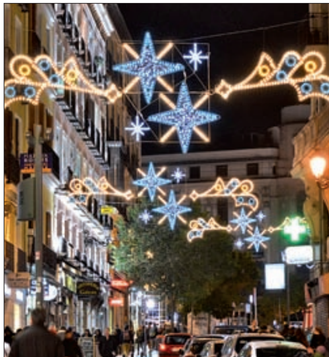
La iluminación de la calle Carretas y el Belén de los Duques de Cardona

La noche de Madrid también está vestida de Navidad desde el último jueves de noviembre. La iluminación de las calles cuenta este año con tecnología Led y con un presupuesto un 7,2% mayor que el de las navidades pasadas, lo que ha permitido iluminar nue-