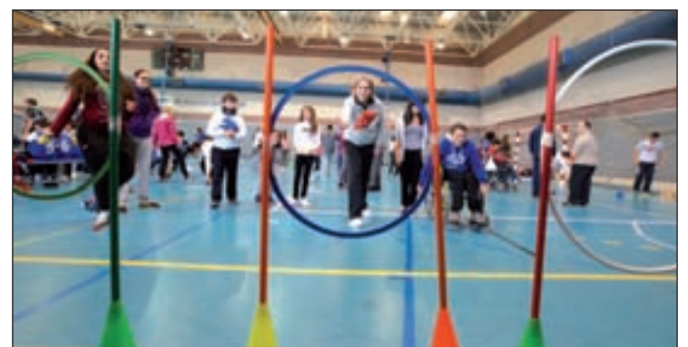
La jornada celebrada el pasado lunes

das ellas se jugaron por equipos de alumnos mezclados de todos los centros. Además, para celebrar el Día Internacional de la Discapacidad, la Concejalía ha preparado, el 11 de diciembre, una jornada jorativa para familiares y profesionales que atienden a personas con discapacidad.