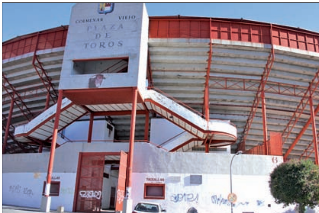
La Plaza de Toros de Colmenar Viejo

Por el momento, no se sabe qué empresario o empresarios serán los que tomen los mandos, pero lo que sí se conoce es que el Ayuntamiento les ayudará con 60.000 euros para intentar reflotar una situación que parece abocada al fracaso desde hace bastantes años.