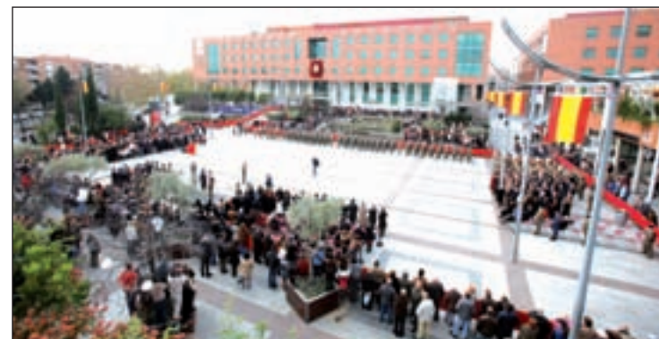
La jura de bandera del año pasado

borarán en la celebración las casas regionales con conciertos, teatro o degustaciones. La Xuntanza de Galegos de esta localidad organiza un concierto gratuito en el que actuarán los coros del centro gallego de Móstoles y de la Xuntanza, y la casa de Castilla y León representará una obra de teatro.