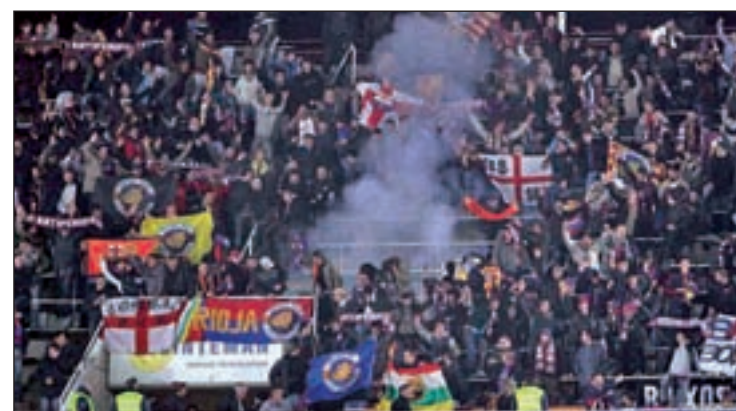
El grupo Boixos Nois fue expulsado por Joan Laporta

El Real Madrid se decidió a seguir esos mismos pasos el año pasado. La guerra interna que vivía Ultras Sur se hizo patente con enfrentamientos a las puertas del estadio en los prolegómenos de un partido liguero. Florentino Pérez ordenó la creación de la grada joven en el lugar donde se ubicaban estos radicales.