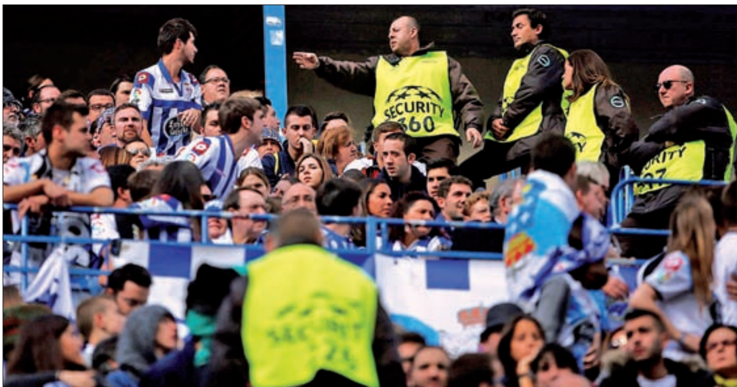
El Vicente Calderón vivió momentos de tensión el pasado domingo