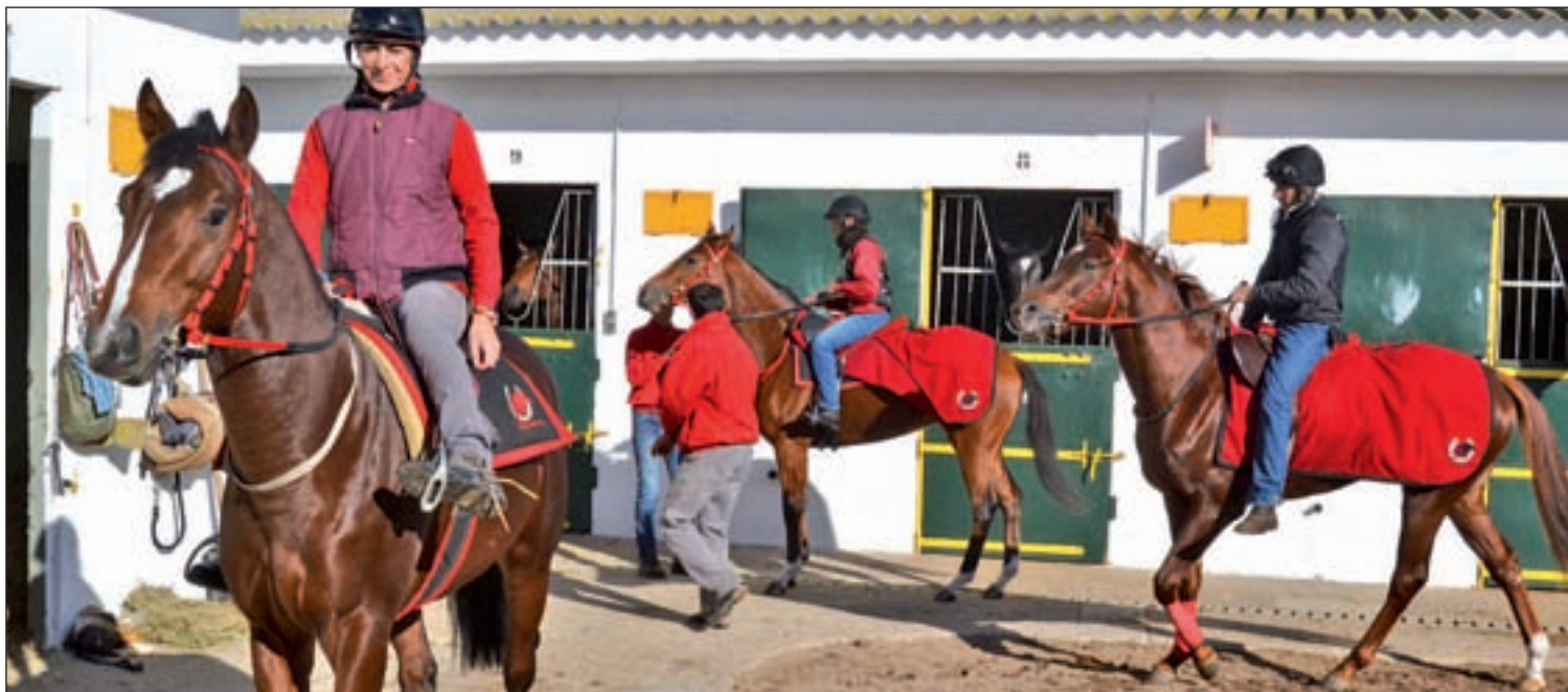
Caballos y 'jockeys' preparados en el patio antes de partir hacia las pistas del Hipódromo de La Zarzuela a entrenar