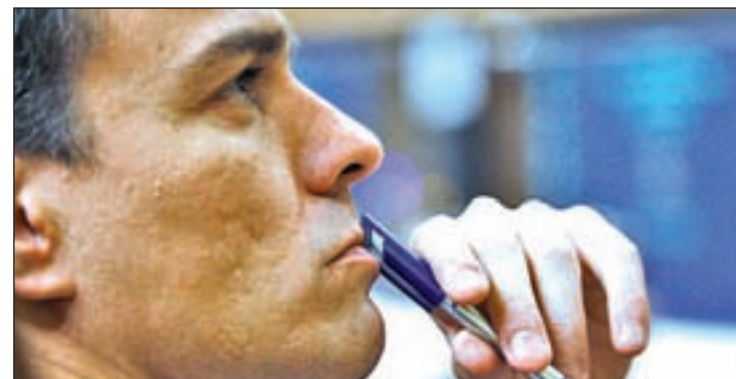
El secretario general del PSOE, Pedro Sánchez

tidario de reducir la jornada laboral a las 35 horas semanales ni de introducir un contrato único de empleo y defendió, además, la reforma del sistema público de pensiones del Gobierno de Rodríguez Zapatero, que fija la edad de jubilación en los 67 años, a alcanzar progresivamente en 2027.