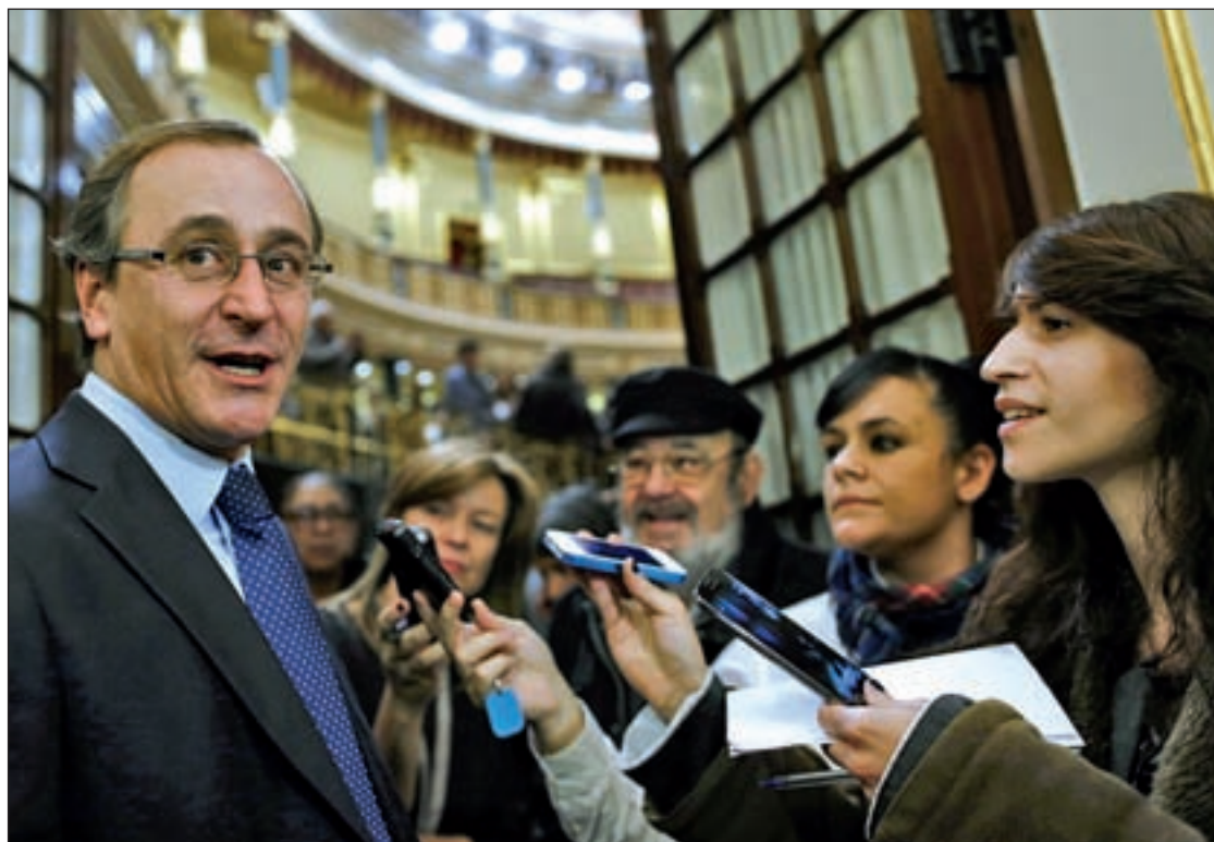
Alfonso Alonso durante su primera jornada como ministro de Sanidad, Asuntos Sociales e Igualdad

En su nuevo cargo, Alfonso Alonso tendrá que encargarse de varios retos que la anterior ministra, Ana Mato, ha dejado pendientes. Uno de ellos tiene que ver con Política Social, donde el nuevo ministro tendrá que lidiar con los