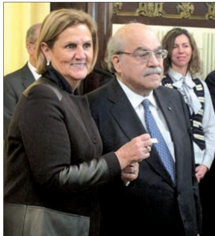
Andreu Mas-Colell, consejero de Economía

De Gispert explicó que se prevé, en el próximo mes y medio, una