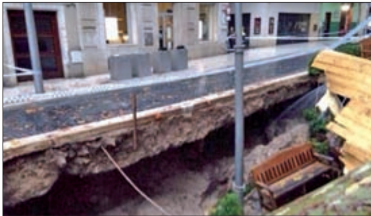
Destrozos en la Rambla

Entre los daños causados por los fuertes vientos y las abundan-