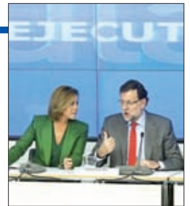
Cospedal junto a Rajoy

drid y que servirá para presentar el manifiesto electoral con el que la formación concurrirá a los comicios y, previsiblemente, lanzará algunas cabezas de cartel.