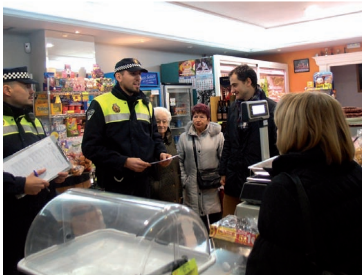
El concejal de Interior visitó un comercio con los agentes.

La campaña de refuerzo en el patrullaje a pie de las zonas comerciales nace para quedarse tras la Navidad pasando a contar con entre tres y cuatro parejas de agentes, además se han incluido nuevas zo-