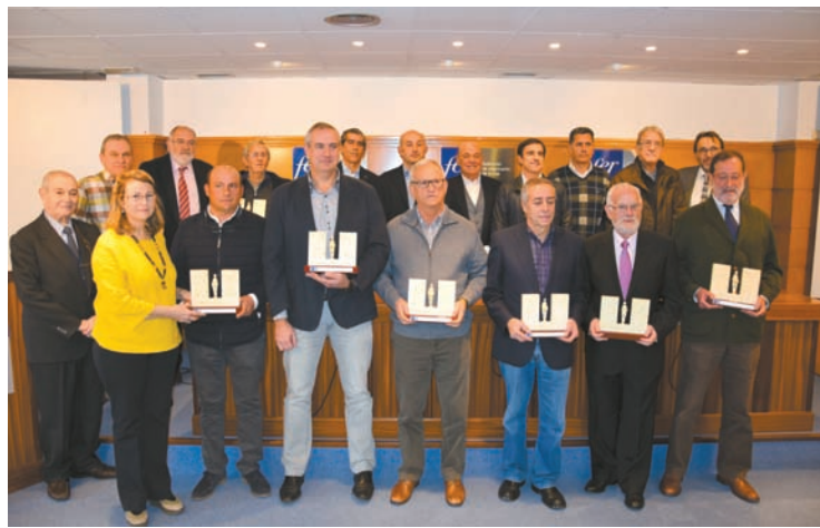
Foto de familia de los homenajeados.