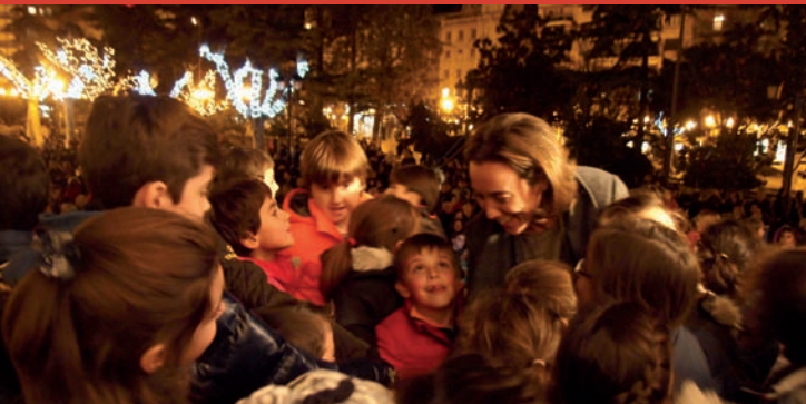
La alcaldesa de Logroño, Cuca Gamarra, acompañada por niños de la ciudad, encendió la iluminación especial de Navidad que iluminará Logroño hasta el 6 de enero. Estas luces permanecerán encendidas todos los días de 18 a 24 horas.