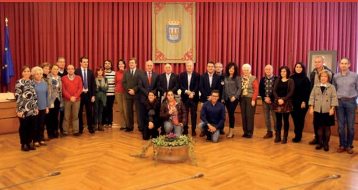
El Ayuntamiento de Logroño organizó el 10 de diciembre un acto para conmemorar el Día internacional de los Derechos Humanos en el que participaron autoridades locales y regionales, miembros del Consejo municipal de Cooperación y Solidaridad Internacional, y representantes de ONGs.

DÍA INTERNACIONAL DE LOS DERECHOS HUMANOS