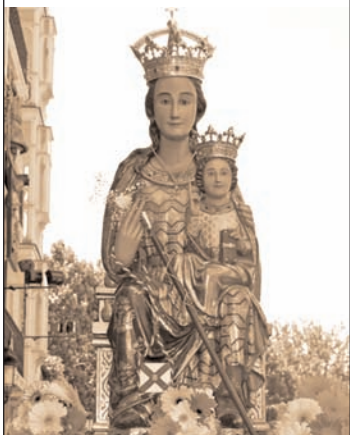
Virgen de La Esperanza.

Es probable que la percepción que yo tengo de la importancia de la Virgen de la Esperanza sea algo diferente a la de muchos de mis vecinos logroñeses. Y no es porque a ellos no les parezca importante la festividad, sino porque yo, de niño, viví en el grupo de casas Virgen de la Esperanza, así que siempre que me preguntaban mi dirección decía que vivía en la Virgen de la Esperanza. Recuerdo que, en mi barrio, la Navidad empezaba antes, el día 18, festividad de la Virgen de la Esperanza, patrona de Logroño, y que desde los años cincuenta y tantos al sesenta y algo, más o menos, fue festividad local. Como les decía, en mi barrio se montaba todo un festival con estrado, farolillos y banderitas. Por el día había juegos para los niños y por la tarde-noche, actuaciones y verbenas. Recuerdo haberle oído cantar a David Toledo, que en el barrio lo conocíamos como David Uruñuela -que era su verdadero nombre-, pues era un vecino del barrio que se fue a hacer 'las Américas', como se decía entonces. Era todo un personaje para nosotros. Lo mirábamos, más o menos, como a una estrella de cine americano. Ahora, creo yo, la festividad de nuestra patrona está cogiendo cierto auge... ¡ya era hora! El día de la misa en su honor en la iglesia de Santiago no cabe ni un alfiler y a la procesión que hay después, se apuntan numerosos logroñeses que les gusta acompañar a su Virgen en un día tan señalado. Seguro que a esto ha contribuido la cofradía que lleva su nombre.