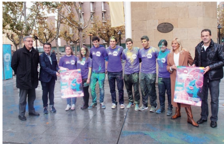
Presentación de la carrera.

En Lobete se instalará además durante los días 12 y 13 un stand oficial Holi Run donde poder