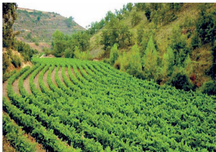
Los viñedos a más de 600 metros de altitud dan a sus vinos unos aromas, intensidad de color y una estructura característicos de la bodega.