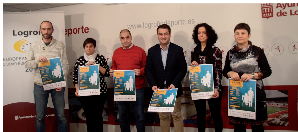
Presentación del "Día del Deporte para todos" en rueda de prensa.

En la programación que se ha desarrollado para conmemorar el reconocimiento de 'Ciudad Europea del Deporte', diciembre está dedicado al deporte y solidaridad