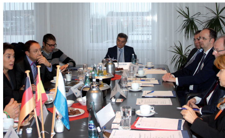
Jornada del II Encuentro para la Internacionalización de Logroño.

ALEMANIA II ENCUENTRO PARA LA INTERNACIONALIZACIÓN