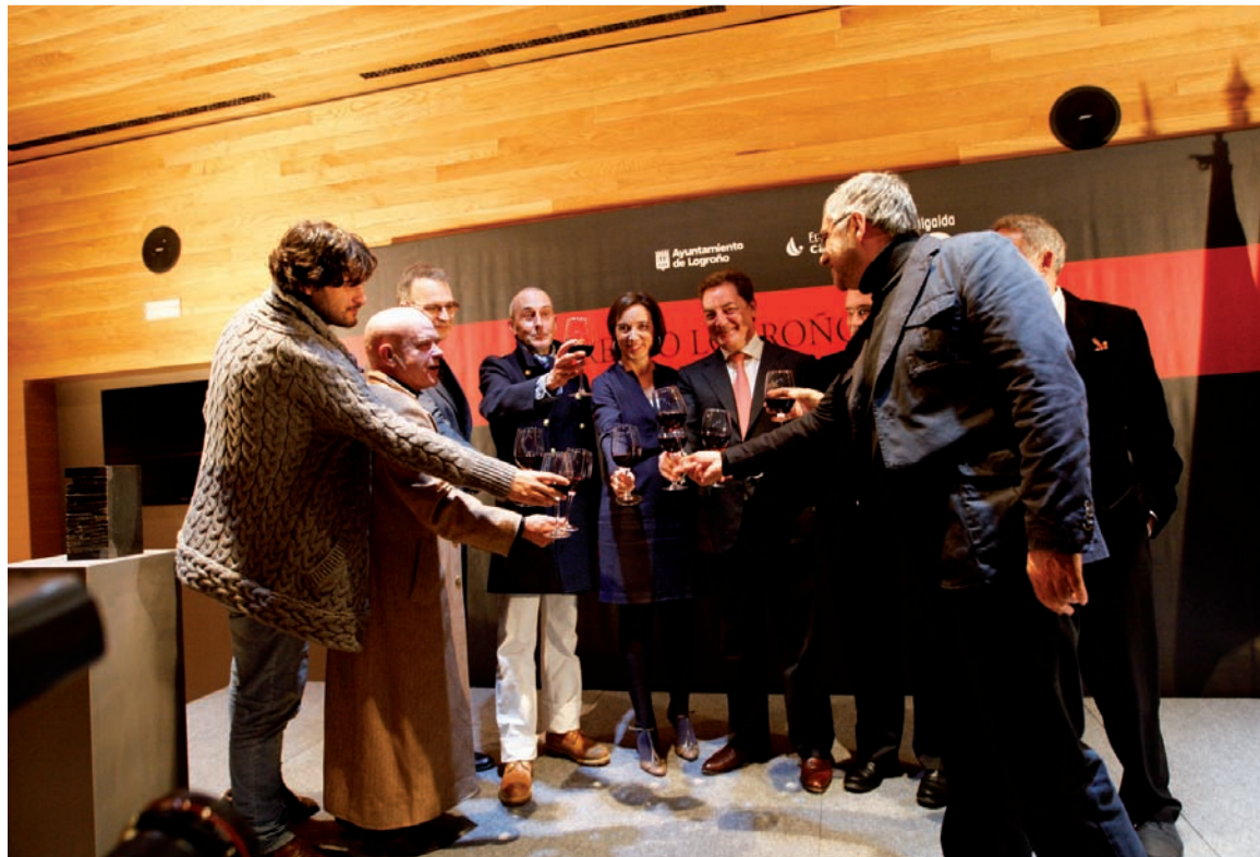
Un brindis con vino de Rioja puso el broche final a la entrega del premio.

la policiaca que cuenta "una historia de amor" a la que el escritor le ha dedicado cuatro años de trabajo.