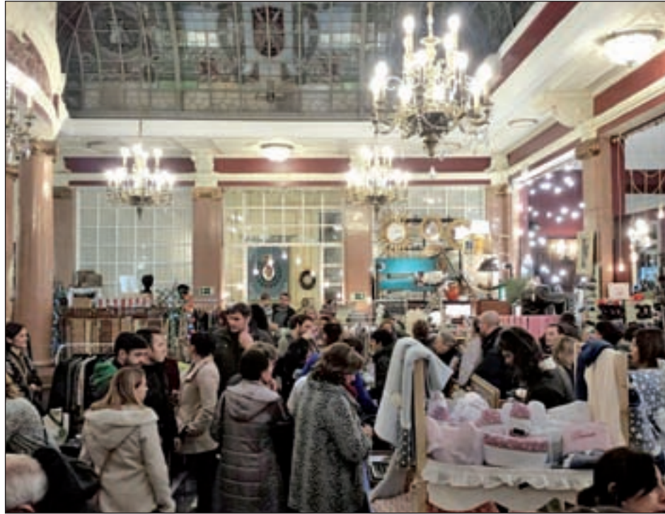
El Mercadillo del Gato a la izquierda y el escaparate de In love market a la derecha