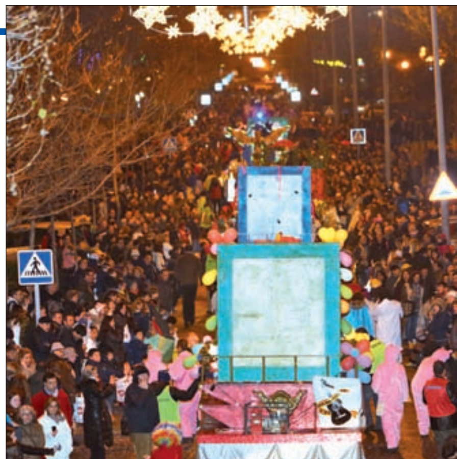
La cabalgata de Tres Cantos, y las fiestas en la carpa de Colmenar

Además de estos eventos nocturnos, la Casa de la Juventud continúa con sus talleres. El día 26 se podrá aprender repostería cocinando dulces navideños, o también habrá oportunidad para conocer el protocolo de estas fechas a la hora de poner la mesa en casa.