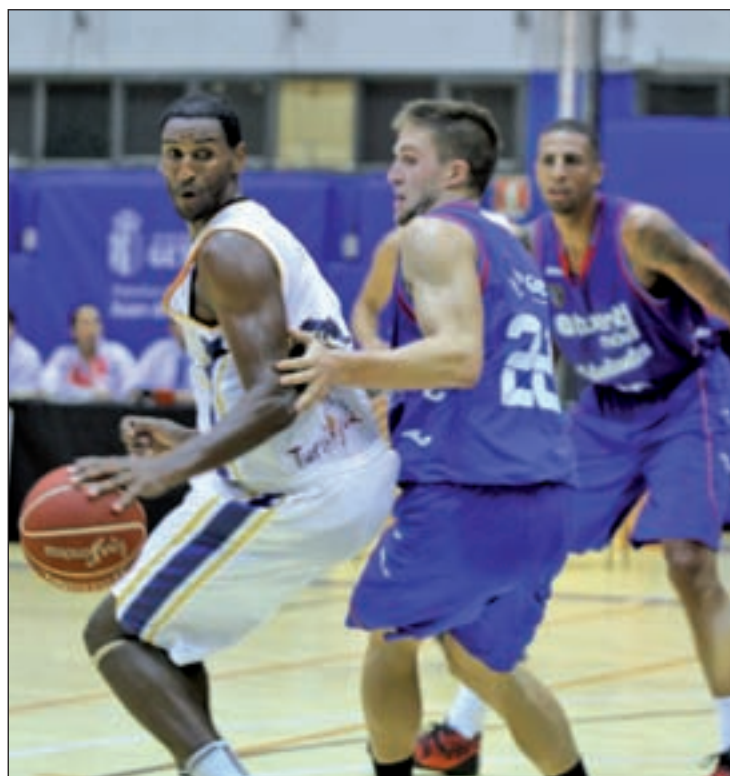
Nueva alegría para el equipo colegial

De este modo, el Movistar Estudiantes sigue con un triunfo de margen respecto a la zona de descenso, aunque este sábado deberá someterse a otro examen de altura en la cancha del segundo clasificado, el Unicaja Málaga. Laboral Kutxa Baskonia y Morabanc