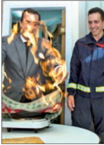
Durante la visita informativa

"Ponemos en marcha este programa para concienciar a los ciudadanos de que la mayor parte de los incidentes graves en viviendas y en lugares habitados, como en