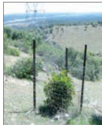
La reforestación del monte

La Comunidad de Madrid invertirá más de 250.000 euros en el proyecto de reforestación de 23 hectáreas del monte de utilidad pública denominado Cañacerral, de Colmenar Viejo, donde se plantarán más de 18.400 árboles y arbustos. La plantación de árboles forma parte de las medidas orientadas a la minimización del impacto ambiental de la obra de ampliación del vertedero de residuos