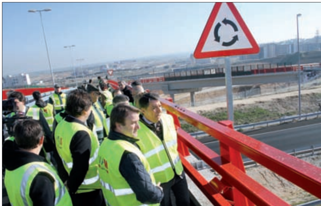
El presidente regional en la inauguración de los nuevos accesos

El presidente regional destacó durante su visita "la gran obra de ingeniería" que se ha realizado, ya que ha sido necesaria la construcción de dos enlaces para salvar los cruces con otras infraestructuras existentes, como la propia vía M-607, las líneas férreas de alta velocidad Madrid-Valladolid y de Cercanías, y los servicios de sumi-