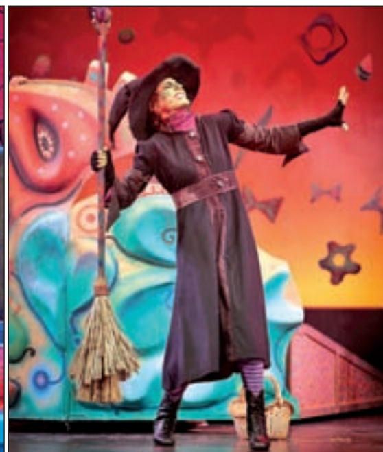
Imágenes de 'La increíble historia de un huevo frito' y de 'El Mago de Oz'