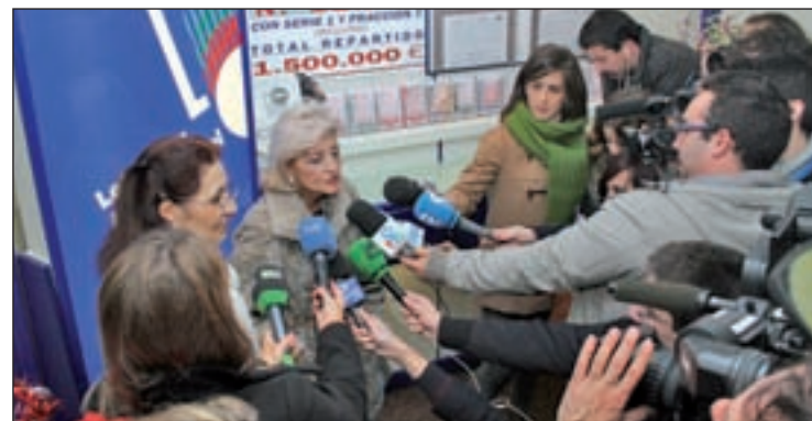
Celebración del Gordo de Navidad 2013 en Leganés

sión, sólo Getafe, que ha vendido en máquina un décimo del cuarto más madrugador con el número 7.617, o la administración nº 18 de Alcorcón, con un quinto premio para el número 67.924, han dado suerte a sus vecinos. Para Móstoles y Valdemoro es su segundo año seguido sin premio.