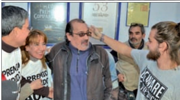
Vecinos, porteros de la finca y empresarios del barrio han resultado agraciados con un Gordo muy repartido