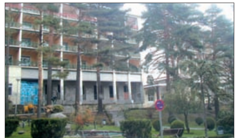
Hospital de la Fuenfría

Con estos, el anillo radiológico sumará 16 hospitales y 2 centros