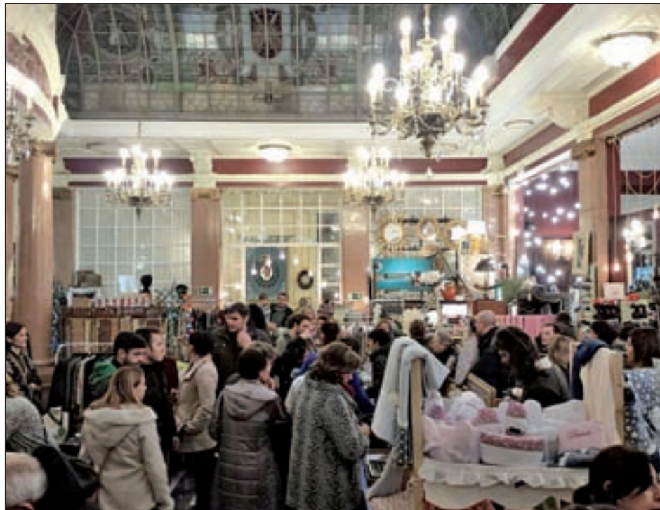
El Mercadillo del Gato a la izquierda y el escaparate de In love market a la derecha