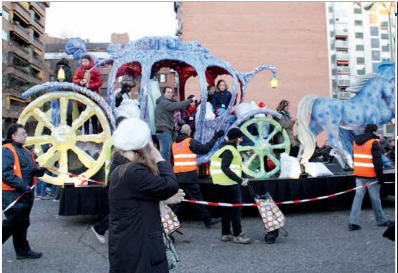
En el centro, un momento de la cabalgata de Moratalaz del pasado año. Arribas, los Reyes dan caramelos en Villa de Vallecas el pasado enero. Abajo una o

Media hora más tarde, la comitiva real recorrerá las calles de San Blas-Canillejas. Se formará en la calle de San Román del Valle, en el tramo comprendido entre la avenida de Guadalajara y la calle de Arcos del Jalón, junto al Centro Cultural de Antonio Machado. Luego continuará por Ajofrín, avenida de Alberique, Hellín, Pobladora del Valle, Arcos del Jalón, Julia García Boután, avenida de Niza, paseo de Ginebra, Suecia, María Sevilla Diago, avenida de Canillejas a Vicálvaro, Aquiles,