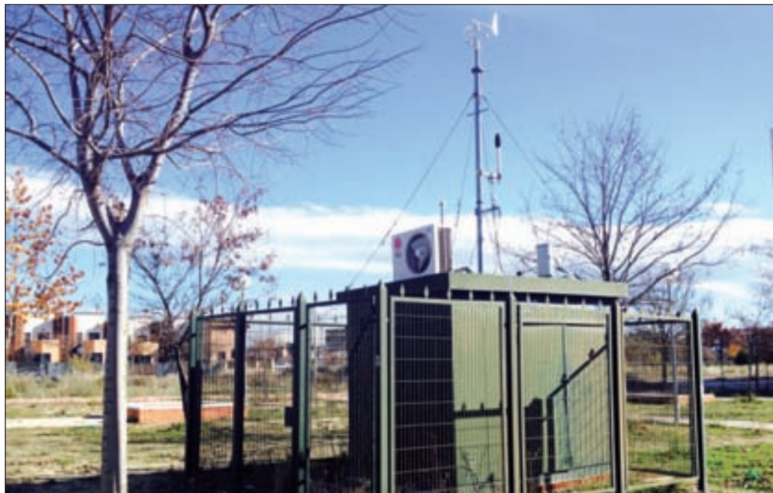
La estación de medición situada en una zona verde del Ensanche de Vallecas

“Madrid un año más (y ya son cinco consecutivos) incumple la legislación europea de calidad del aire, puesto que ya cuatro estaciones de la red han rebasado las 18 superaciones permitidas”, dicen.