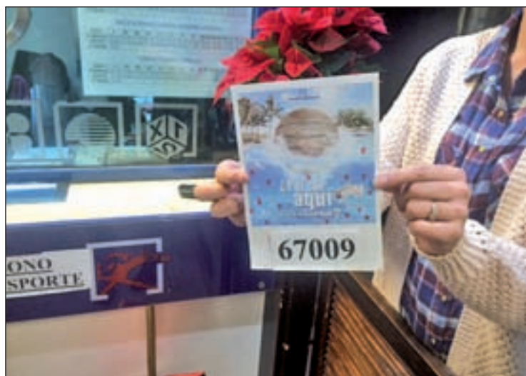
Una lotera de Alcobendas muestra el número GENTE

LOS USUARIOS CONTINÚAN PREFERIENDO VENTANILLA