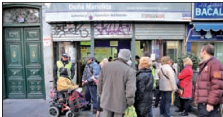
Imagen este establecimiento GENTE

Sobre las 10:30 de la mañana salía uno de los premios más madrugadores, el 7.617, agraciado con 200.000 euros a la serie. El número estuvo muy repartido, llegando a provincias de varios puntos de la península, incluyendo