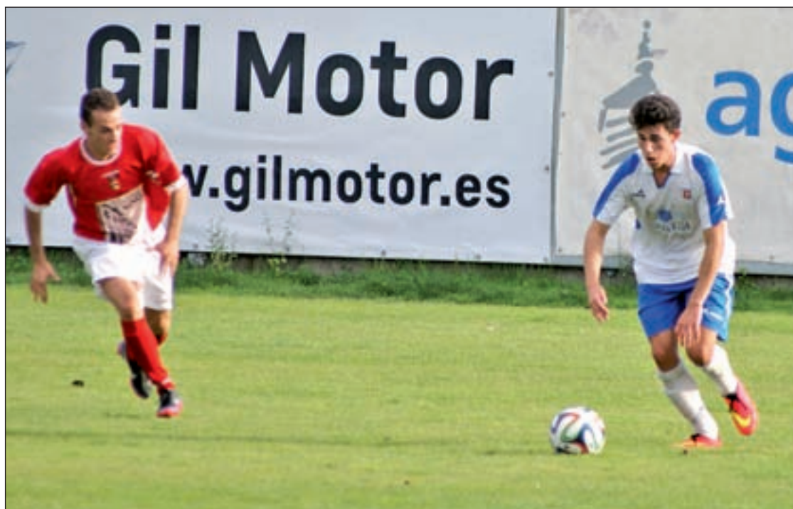
El Puerta Bonita continúa en los puestos altos de la clasificación

Pero esa igualdad no es exclusiva de la parte alta. En la zona más caliente de la clasificación, equipos como el Parla, el Real Madrid C o el Atlético C siguen acercándose al abismo, alimentando las esperanzas de equipos como el