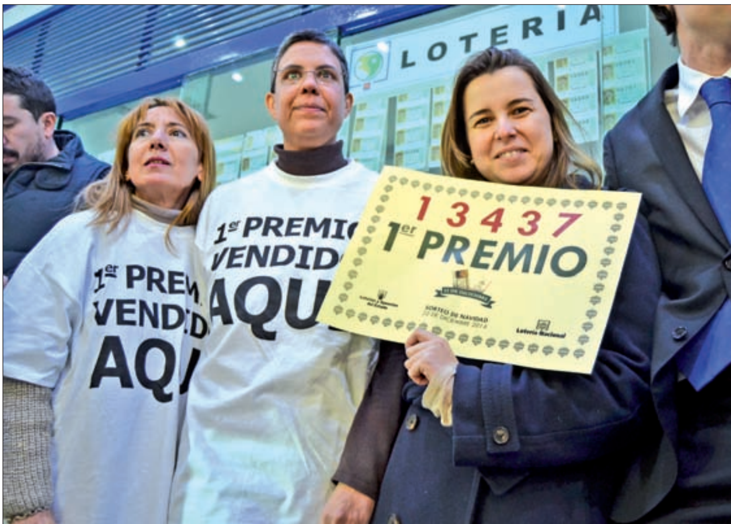
El 'Gordo' se vendió en la calle Zurbano

Una administración de la calle Zurbano vendió 118 series del primer premio, el 13.437, y regaló 20 décimos entre empleados y conocidos • En Avenida de América, en Atocha y en Méndez Álvaro se repartieron el segundo y dos quintos premios, respectivamente PÁGS. 4, 6 Y 8