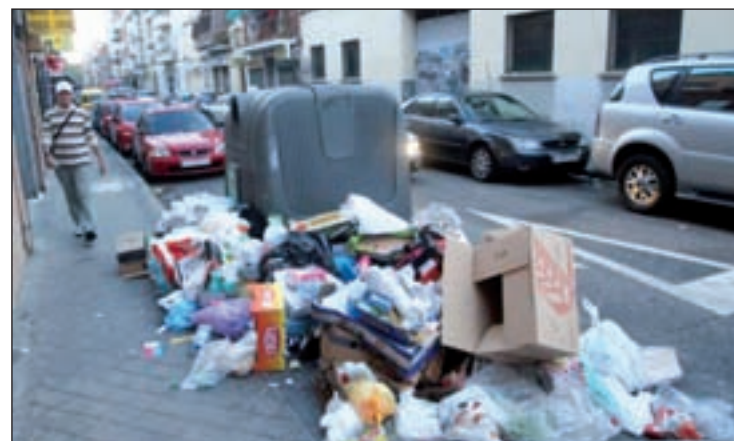
La basura se concentra en una calle de Puente de Vallecas

firmado por el Ayuntamiento de Madrid con la UTE de las empresas Urbaser (empresa del grupo ACS) y Cespa (empresa del grupo Ferrovial). “Ha traído el caos al servicio de recogida de basuras a los distritos periféricos de la capital con camiones que contaminan con combustible de gasoil y que no se adaptan a las calles más estrechas de la ciudad, retrasos de hasta tres y cuatro días en la recogida de basuras”, critican. Todo ello a pesar de que el Ayuntamiento de Madrid ha ingresado más de 600 millones de euros