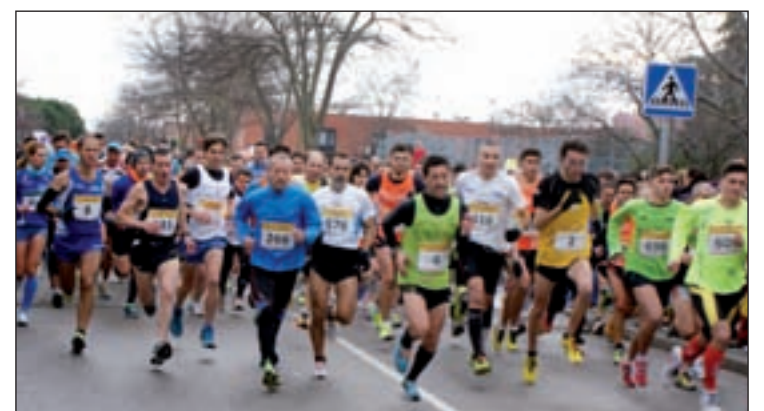
La salida de la última edición

También los más pequeños podrán despedir el año corriendo por las calles de su barrio. Las inscripciones de las pruebas de menores, desde chupetines hasta cadetes, serán gratuitas y se realizarán en el Polideportivo de Vicálvaro (Calle de Villablanca, s/n) el mismo día 31 hasta media hora antes de su comienzo.