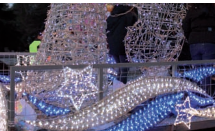
de las carrozas del distrito de San Blas-Canillejas