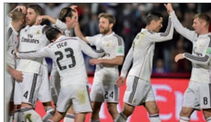
El Real Madrid conquistó el Mundial de Clubes