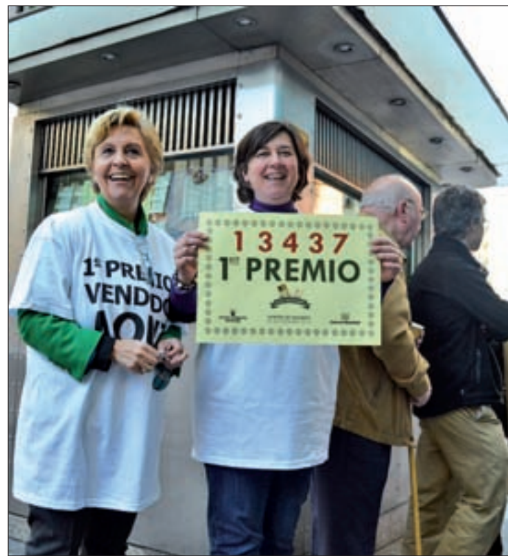
Dueñas del quiosco de Gran Vía

En otro punto de Madrid, la administración número 336, conocida como 'El Monstruo', ha vuelto a traer la suerte a los vecinos del distrito de Latina, en concreto a los barrios de Las Águilas y Aluche. Cuatro años después de que vendiera 10 décimos del 79.250, en 2014, este 22 de diciembre ha repartido otros 10 del número 13.437, el Gordo, y alrededor de