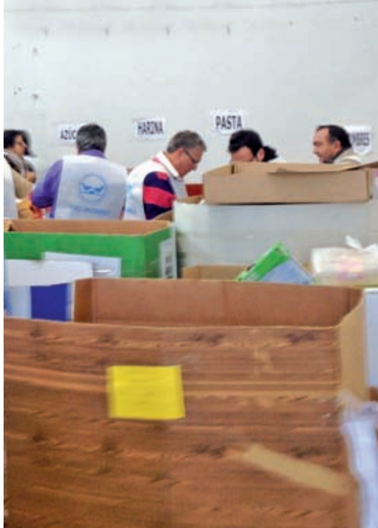
Almacén del Banco de Alimentos en Getafe

“Un millón de gracias a todos por vuestra generosidad”