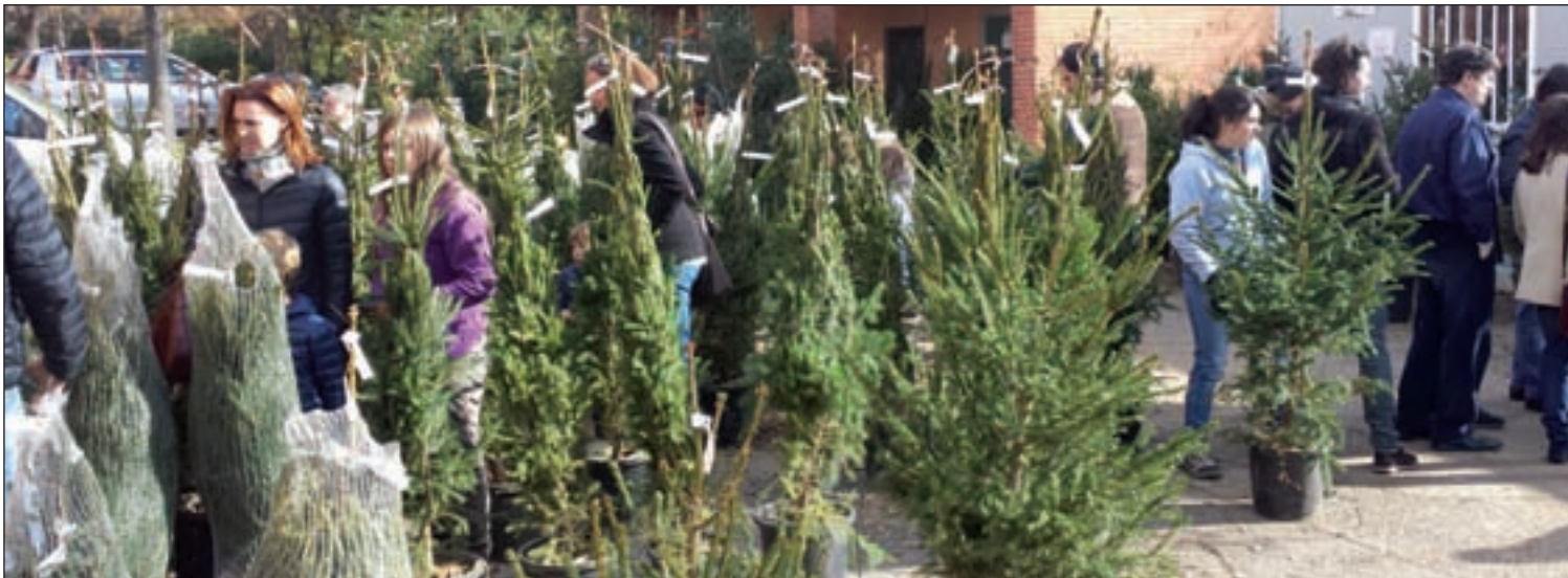
Las ventas de abetos este año han superado las expectativas en la Escuela de Ingenieros de Montes