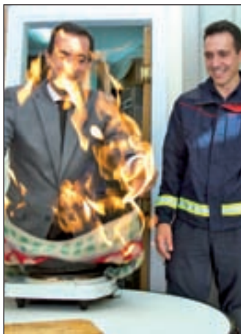
Durante la visita informativa

"Ponemos en marcha este programa para concienciar a los ciudadanos de que la mayor parte de los incidentes graves en viviendas y en lugares habitados, como en