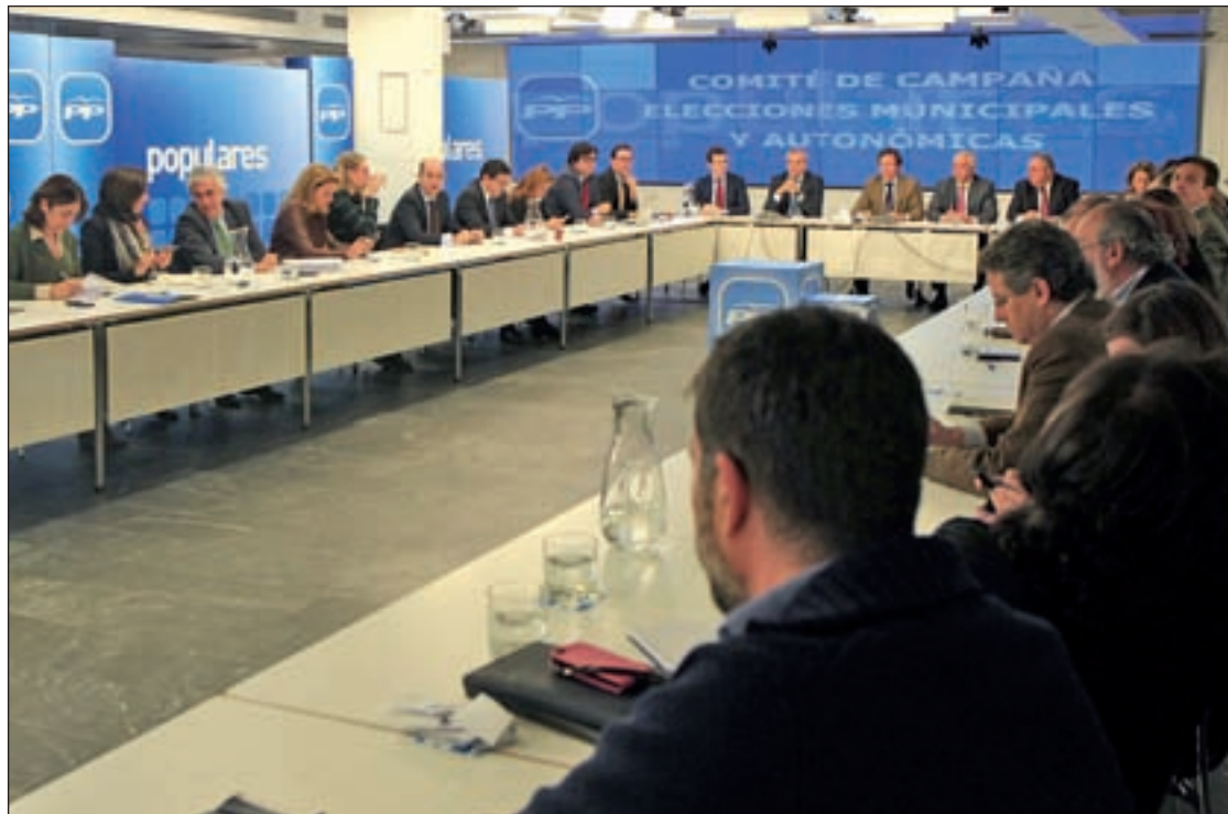
Imagen del Comité de Campaña del PP

Lo que sí ha hecho ya el PP es nombrar a los componentes de su