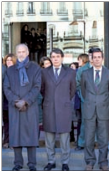
Minuto de silencio en Sol

El ataque terrorista contra el semanario satírico 'Charlie Hebdo' en París el pasado 7 de enero ha sacudido al mundo y ha dejado secuelas que van más allá de las 17 vidas que se cobraron los autores en tres atentados. Todavía suena el eco de los gritos por la libertad de expresión que, en todos los idiomas, han mostrado su apoyo a la publicación francesa bajo una afirmación rotunda: 'Yo soy Charlie'. Desde la Comunidad de Madrid también se han solidarizado con 'Charlie Hebdo' y, además de guardar un minuto de silencio para manifestar la repulsa generalizada de los madrileños hacia el ataque terrorista, denunciaron "una actuación que