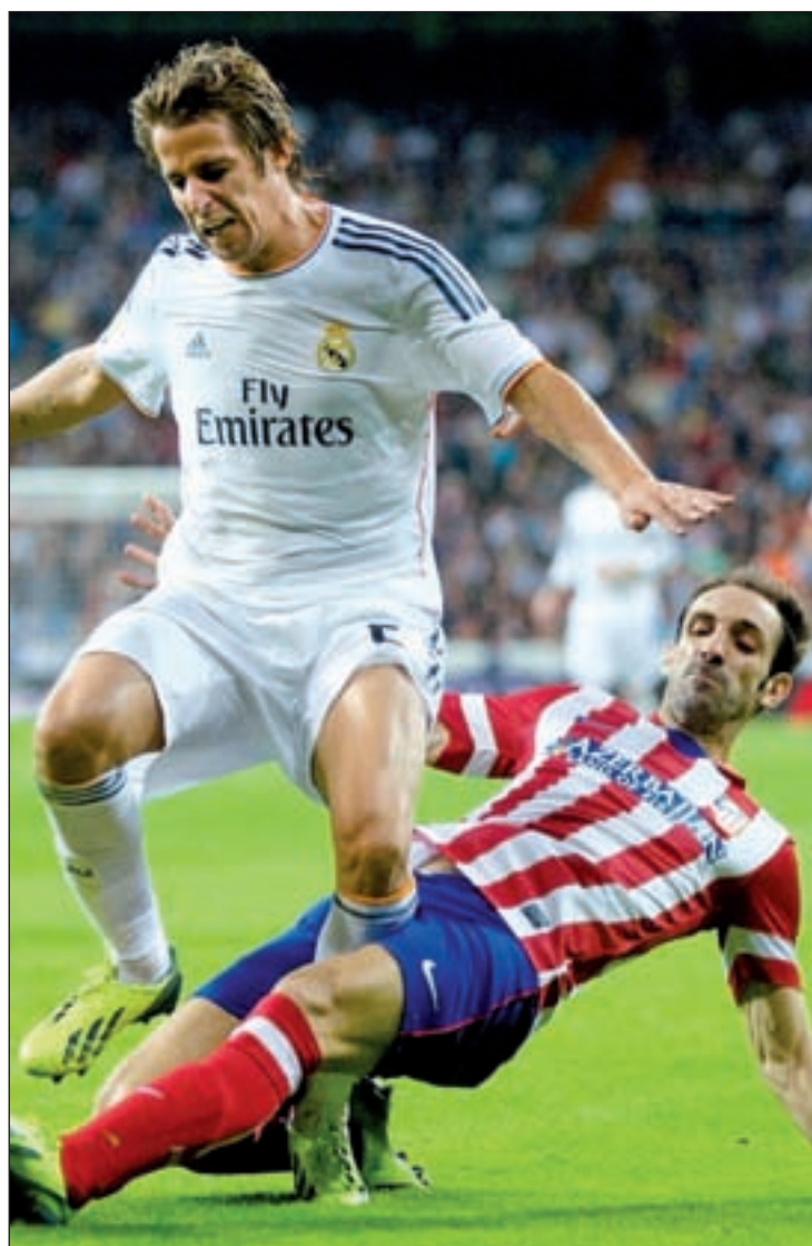
Los dos equipos ya piensan en la Liga

El Atlético volverá a jugar este domingo (17 horas) como local ante el colista de la clasificación, el Granada. El cuadro andaluz lleva sin conocer la victoria en Liga desde el pasado 20 de septiembre, acumulando una racha de resultados que han puesto en entredicho la continuidad de su entrenador, Joaquín Caparrós. Ansaldi es baja en los locales.