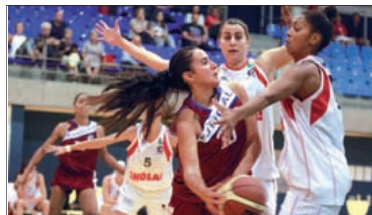
Las jugadoras del CREF ya comandan la clasificación

Por otro lado, los representantes de la capital dentro de la Liga ACB deberán jugar este fin de semana a domicilio. Concretamente, el Real Madrid visitará en la tarde del domingo (19:45 horas) al penúltimo clasificado, La Bruixa d'Or Manresa, con la necesidad de ganar para asegurarse la condición de cabeza de serie en el