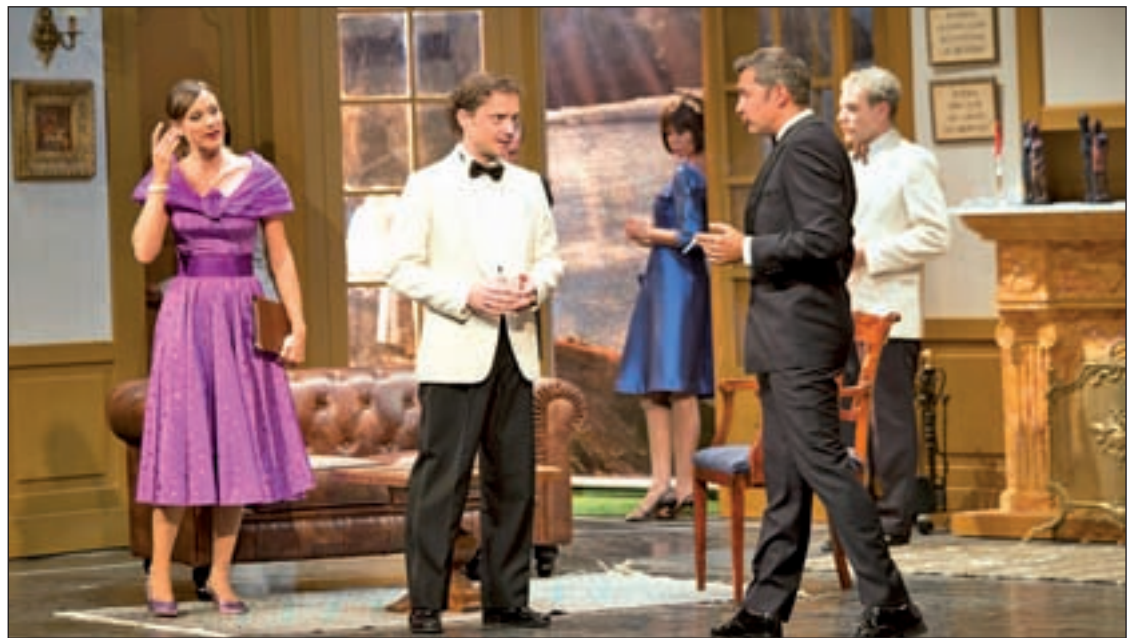
'Diez negritos' se representa en el Teatro Muñoz Seca LUCAS GANCEDO

Desde el 15 de enero la risa está asegurada en el Teatro Marquina