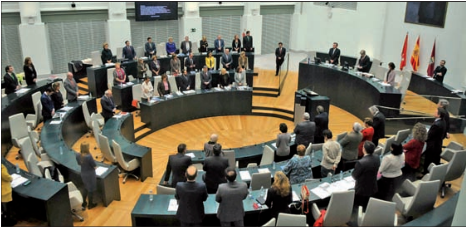
El Pleno del Consistorio puede cambiar su composición