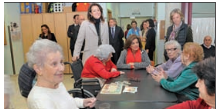
La alcaldesa, con algunos de los usuarios y el resto de autoridades

Martínez de Velasco, hay 32 plazas repartidas entre 18 viviendas individuales y 7 dobles que disponen de cocina, salón/dormitorio y baño individual. Durante la visita, Botella anunció la construcción en el barrio de un nuevo Centro Municipal de Mayores por importe de 1.100.000 euros.