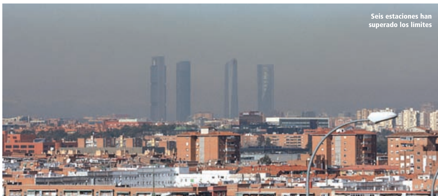
Seis estaciones han superado los límites

Sábado 23 de enero. 20:15 h. Aforo limitado. Reserva en tienda@guitarrasramirez.com .