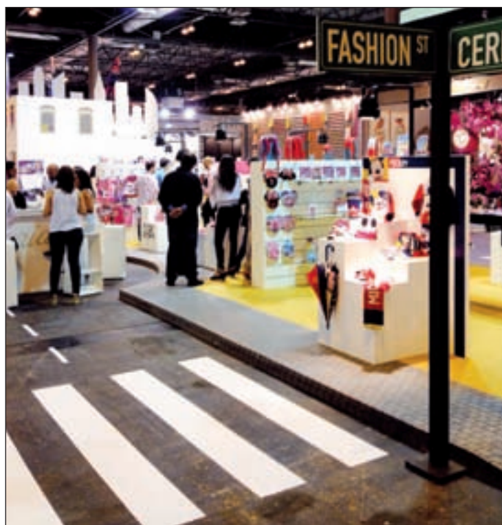
Imagen de la edición pasada de la feria Intergift

Otra de las novedades vendrá de la mano del Colegio Oficial de Decoradores Diseñadores de Interior de Madrid, Coddim, que abordará la rehabilitación de varias viviendas. Por último, cuatro profesionales de diseño mostrarán a los asistentes los locales más 'cool' de Madrid en los barrios de Malasaña o Retiro.