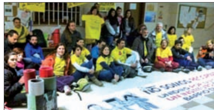
Uno de los últimos actos reivindicativos

Por estos motivos, volverán a marchar hasta la Puerta del Sol en una fecha todavía por decidir.