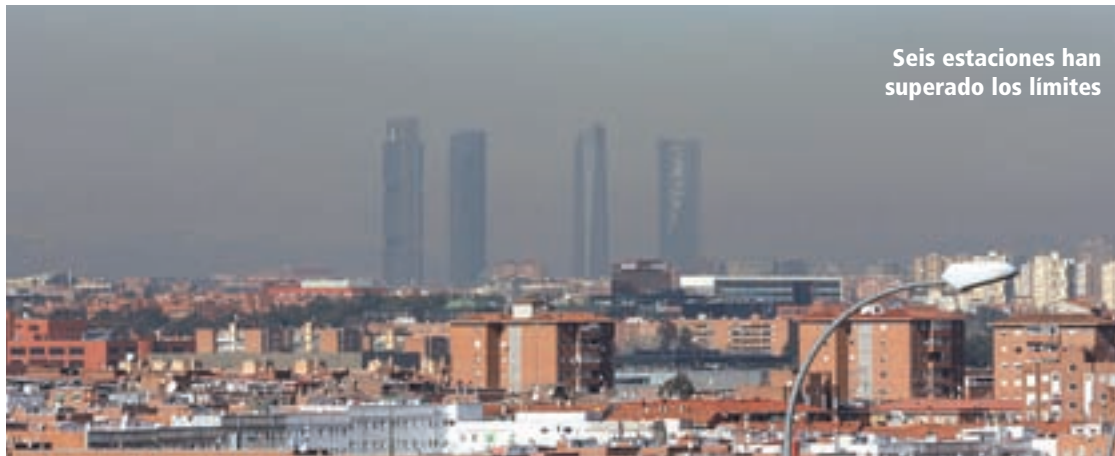
Seis estaciones han superado los límites

Pese a que en los últimos años la mala situación económica ha llevado a una reducción de tráfico en la capital, por el menor uso tanto de vehículos particulares como de transporte público, los niveles de contaminación se mantienen, a día de hoy, muy alejados de los niveles saludables, provocando más de 2.000 muertes prematuras cada año. Según el Informe de Calidad del Aire en Madrid, presentado esta semana por Ecologistas en Acción, la ciudad incumple la legislación sobre contaminación por sexto año consecutivo. Así, las superaciones de dióxido de nitrógeno (NO 2 ) rebasaron nuevamente en 2014 los máximos anuales permitidos por la normativa europea; y, en los