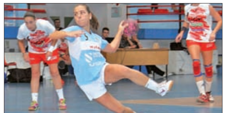
El Seis do Nadal vigués, próximo rival de las madrileñas

conjunto madrileño deberá desplazarse hasta la localidad pontevedresa de Vigo para medirse este sábado (17:30 horas) con el Seis do Nadal-Coia. El cuadro gallego ocupa la octava posición de la tabla y sólo ha podido sumar 4 puntos. En la ida, el Base Villaverde se hizo con el triunfo por 30-25.