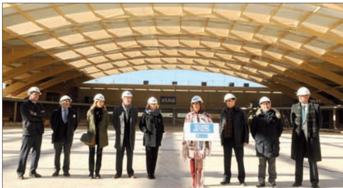
Estado actual de los trabajos de construcción del recinto deportivo

El programa de apertura extraordinaria comenzó en junio de 2004 y, desde entonces, más de 1,5 millones de estudiantes se han beneficiado del mismo. Actualmente, se celebra tres veces al año, coincidiendo con los exámenes de enero, mayo y septiembre.