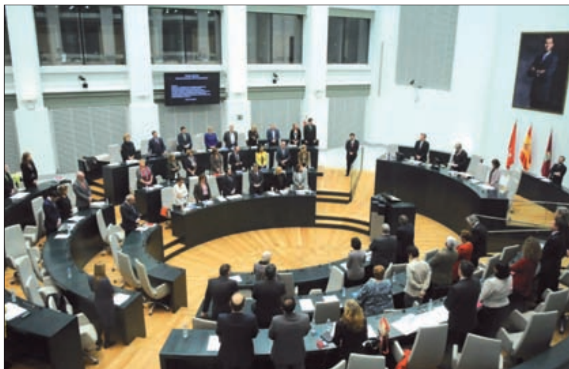
El Pleno del Consistorio puede cambiar su composición

Esa incertidumbre también está presente en la designación del sucesor de la que ha sido hasta ahora la alcaldesa de Madrid. Ana Botella anunciaba el pasado 9 de septiembre que no se presentaría a la reelección, abriendo una carrera de la que todavía no se conoce al ganador. Soraya Sáenz de Santamaría, Esperanza Aguirre o Cristina Cifuentes son algunos de los nombres que han aparecido en las quinielas de futuribles, pero al cierre de esta edición la decisión aún no era pública. Mientras, varios asuntos como la aprobación de la Ordenanza de Convi-