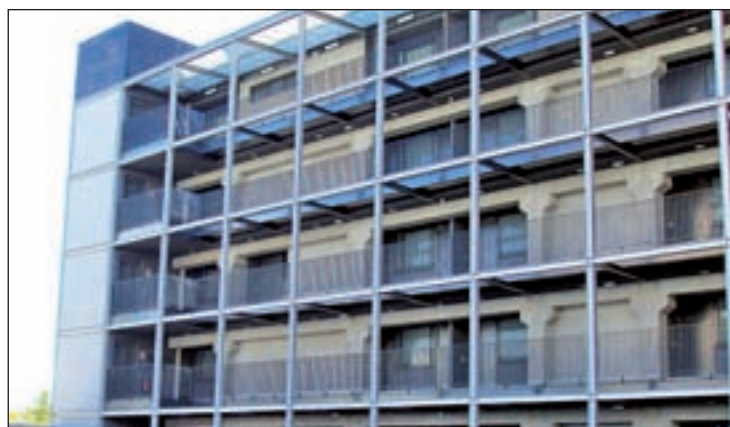
Una de las promociones de vivienda del PAU de Carabanchel

Por su parte, la evolución en Latina y Villaverde fue similar con