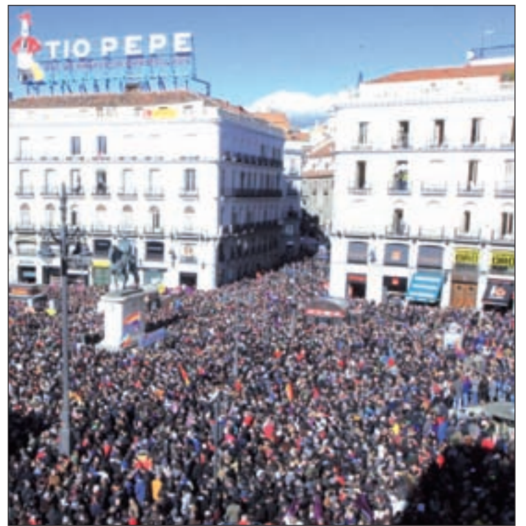
MANIFESTACIÓN PARTICIPACIÓN DE 100.000 PERSONAS

Mientras el PP aseguró que Podemos no le asusta y que a quien "tiene que dar miedo" es a los españoles por sus postulados, el partido de Pablo Iglesias consideró que si la "progresión" se mantiene es "evidente" que va a ganar al PP con una "victoria contundente". Por su parte, el PSOE dijo "desconfiar" de la 'cocina' del CIS, pues cree que coincide con la estrategia de los 'populares' de "ningunear" a los socialistas.