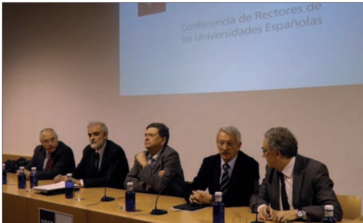
Los rectores, durante la conferencia

Desde el Gobierno están convencidos de que esta medida mejoraría el sistema actual. Según el ministro de educación, José Ignacio Wert, la reducción en un año de la duración de los grados que