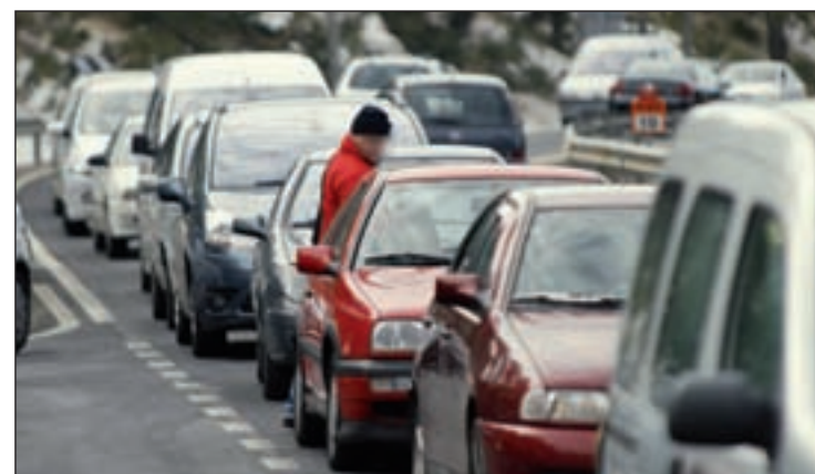
El número de accidentes ha pasado de 51 a 79