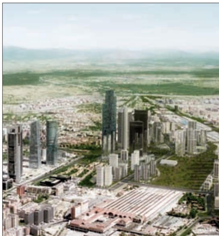
Propuesta del proyecto urbanístico

Miembros de la empresa Distrito Castellana Norte (cuyo socio mayoritario es el BBVA) cifran esta