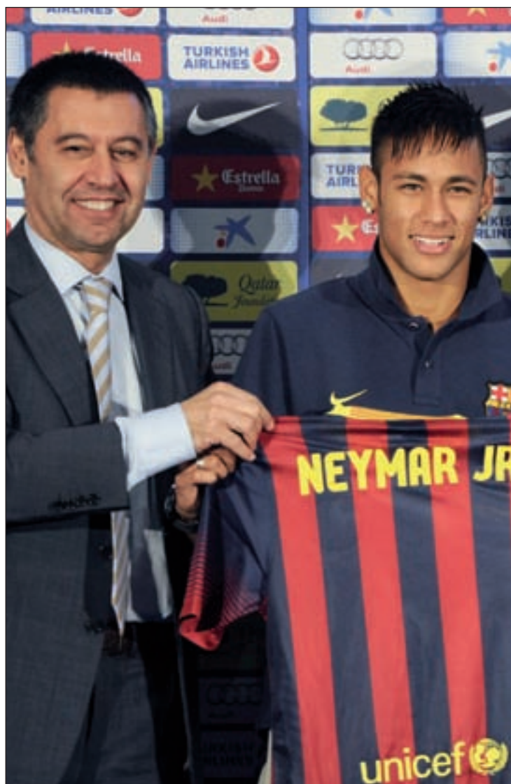
Bartomeu, en el acto de presentación de Neymar

pudieron aconsejar su enjuiciamiento conjunto". En su auto, el juez asegura que "ante la evidencia de que, para el caso de haber incumplido su obligación de retención del IRPF impuesta en la normativa tributaria, pudiere haberse superado en exceso el límite de 120.000 euros de cuota defraudada que fija el artículo 305 del Código Penal, concurren en el presente estadio indicios suficientes para la investigación acerca de la posible comisión de un nuevo delito contra la Hacienda Pública correspondiente al ejercicio 2014".