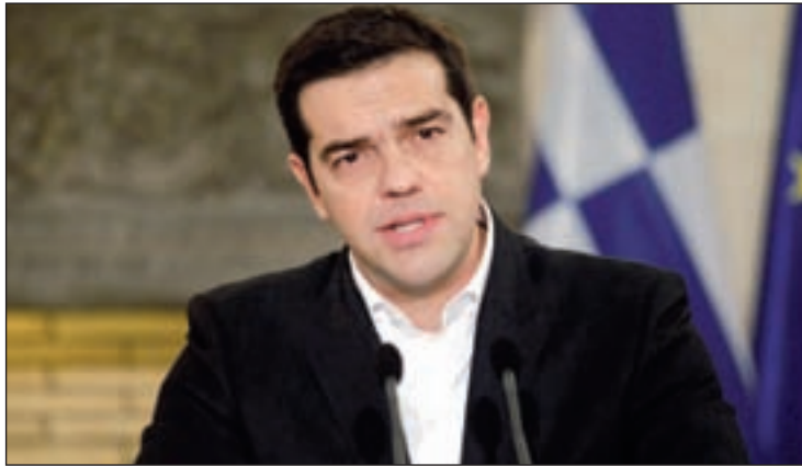
El primer ministro griego se reunió con líderes europeos

Varoufakis subrayó que el Ejecutivo heleno ya no pide una quita de la deuda externa de 315.000 millones de euros que tiene el país, sino que reclamará una serie