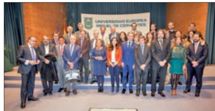
Miembros del jurado, junto a la premiada y la rectora de la UEMC

en lo que hacen, además de saber transmitirlo". El jurado estuvo formado por 45 directores de medios de la región, entre los que se encuentra el Grupo Gente con sus ediciones Gente en Valladolid, Gente en Burgos, Gente en León, Gente en Palencia, Gente en Segovia y Gente en Ávila.