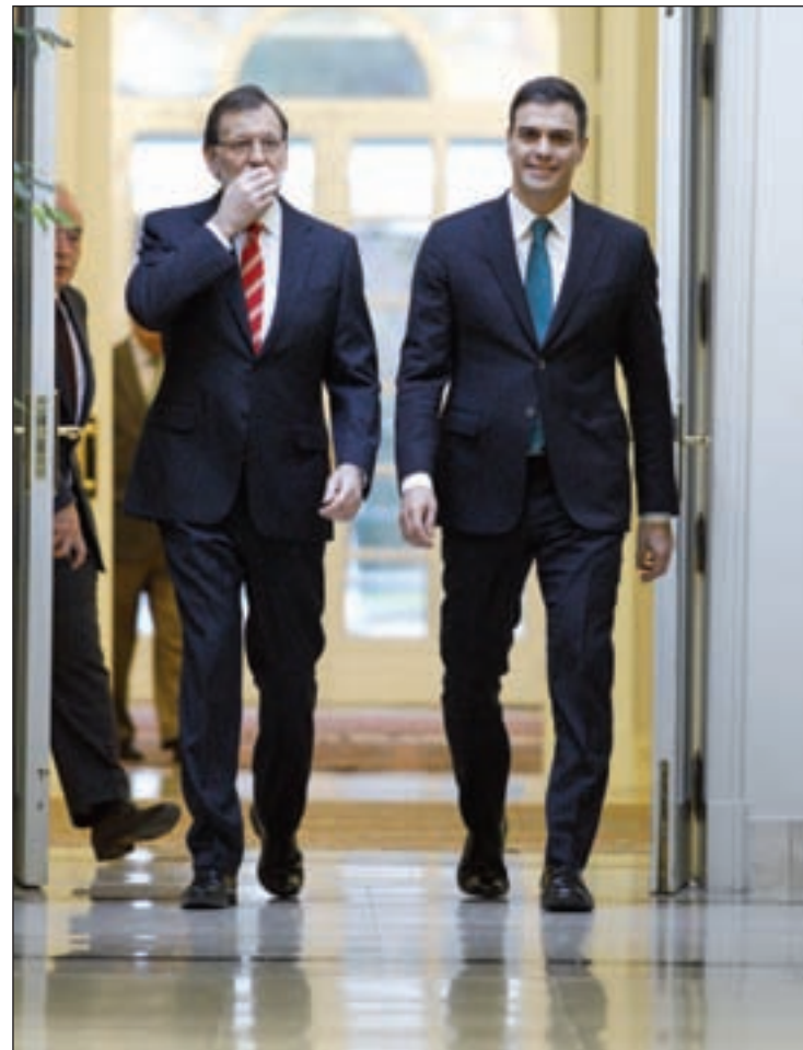
Mariano Rajoy y Pedro Sánchez, en La Moncloa

A pesar de estas reticencias, el Gobierno se muestra "optimista" y confía en que el consenso será más amplio, según fuentes gubernamentales. Por el momento, tanto PP como PSOE han iniciado contactos con el resto de formaciones.