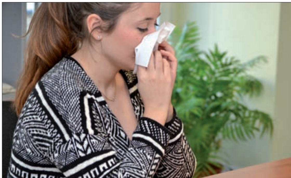
El frío favorece el contagio de la enfermedad por el hacinamiento que conlleva

Cada semana se registran más casos, aunque la pendiente de ascenso comienza a disminuir, por lo que la Red Nacional de Vigilancia Epidemiológica cree que "nos acercamos al pico de máxima incidencia". Es imposible saber a ciencia cierta cuándo llegará el final de la epidemia, sin embargo, "en los últimos años estamos teniendo casos hasta marzo, incluso abril", explicó David Moreno, coordinador del Comité Asesor de Vacunas de la Asociación Española de Pediatría. En general, persistirá mientras continúe el invierno. "El frío facilita el hacinamiento de las personas y la transmisión de la infección, pues es por vía aérea", apuntó Fernando