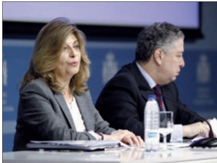
Hidalgo y Burgos, en rueda de prensa

Los sindicatos, por su parte, pintan un panorama de precariedad, estacionalidad y pobreza con empleo. El secretario de Acción