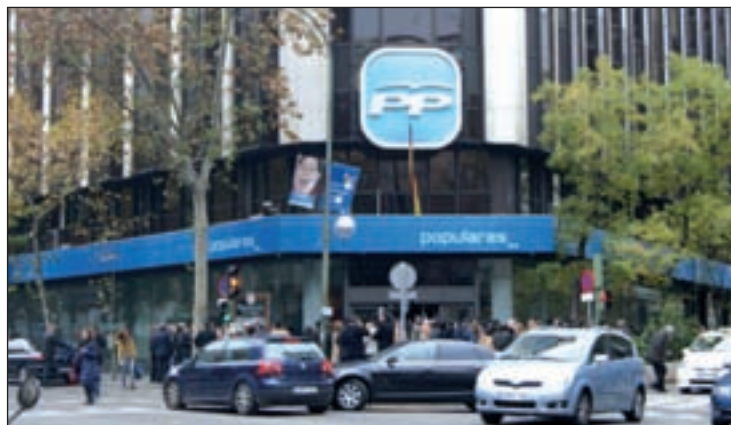
Ruz ve al PP responsable de los pagos en negro de su sede

Tras la publicación de este auto, Génova aseguró que desconocía la existencia de una doble contabilidad y señaló que las donaciones a los partidos "siempre" han