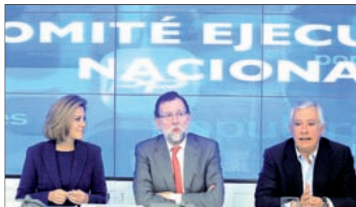
Mariano Rajoy, durante el Comité Ejecutivo Nacional