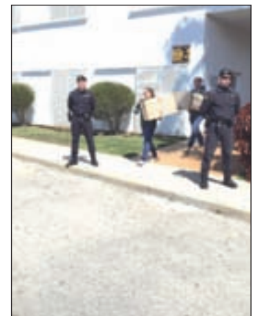
Operación de la Guardia Civil

Un total de 16 personas fueron detenidas el pasado martes por la Unidad Central Operativa de la Guardia Civil en el marco de la operación 'Barrado' por el presunto fraude en cursos de formación financiados por la Junta de Andalucía que investiga la juez Mercedes Alaya. El caso está bajo secreto parcial de sumario, y podrían haber incurrido en presuntos delitos de prevaricación, malversación de caudales públicos y fraude de subvenciones.