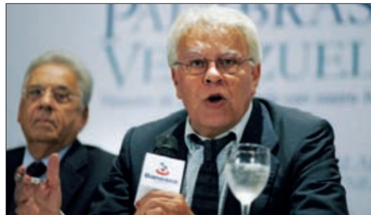
Felipe González, expresidente del Gobierno

El ministro de Asuntos Exteriores y Cooperación, José Manuel García-Margallo, reveló que el expresidente le llamó para comunicarle esta decisión, lo que considera "una tarea muy noble". "Defender las libertades, los derechos humanos y el Estado de Derecho me parece una tarea muy digna que realmente enaltece a Felipe González", aseveró.