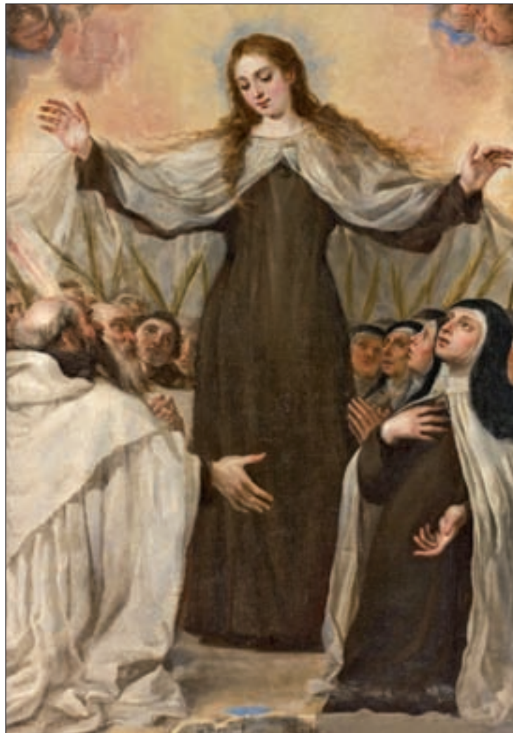
Una de las obras de la muestra

je a la tierra del Carmelo', centrándose en el origen de la Orden. La capilla de Mosén Rubí, por su parte, acoge dos capítulos, 'La España de la Contrarreforma' y 'Los pobres de Santa Teresa'. El primero, contextualiza el periodo en el que vivió la Santa, y entre sus obras cuenta, incluso, con un elemento tan curioso como la matrícula de San Juan de la Cruz en la Universidad de Salamanca. El segundo estadio de la capilla, "Las pobres descalzas de Teresa", expo-