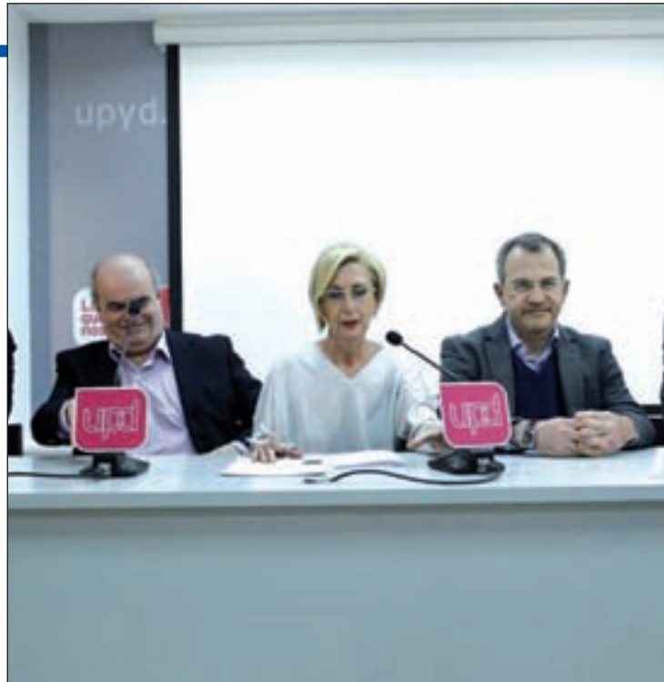
Rosa Díez, junto a miembros de su directiva

En lugar de dicha reacción, la portavoz nacional de la formación, Rosa Díez, dejó claro que tanto ella como su partido siguen teniendo "la misma fuerza" y que no iban a rendirse tras el resultado. "Unas veces se gana y otra se