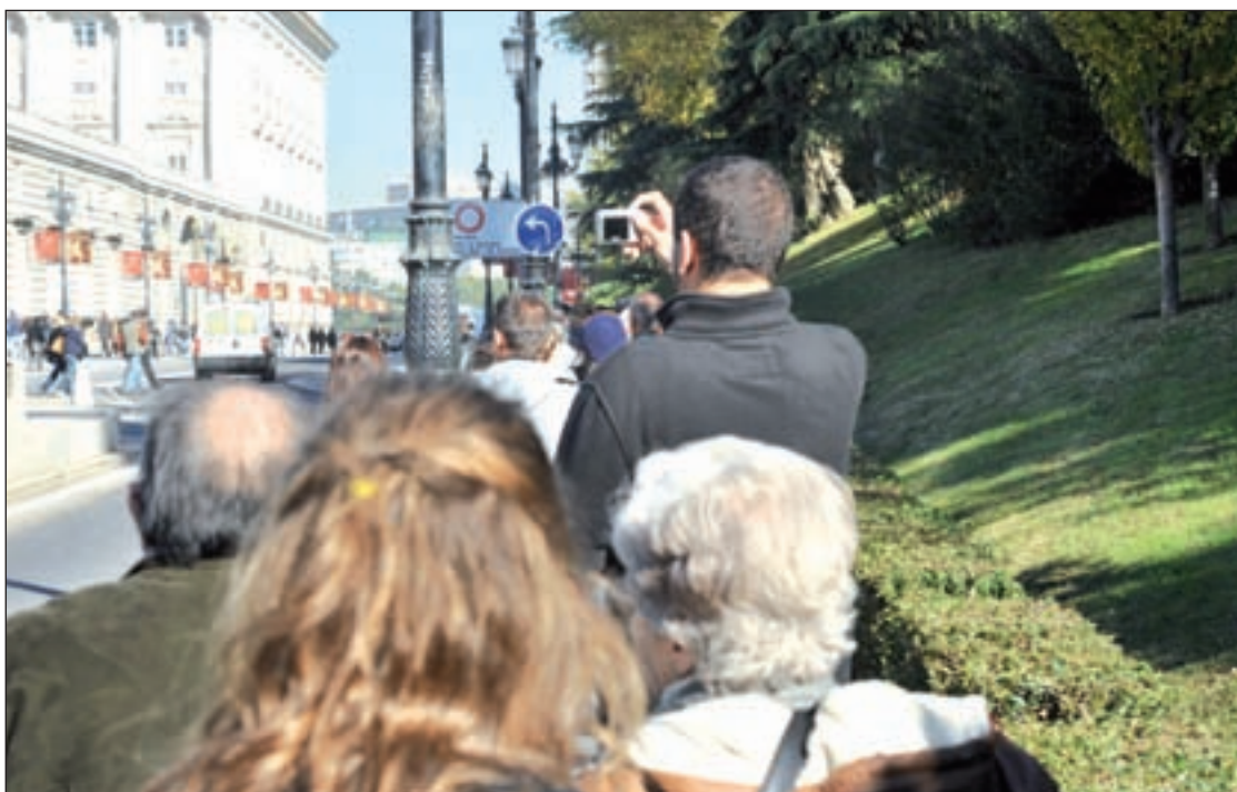
Los hoteleros mostraron su satisfacción por los datos

Otro dato positivo es que la mayoría de los hoteleros consideran que su rentabilidad será similar a la del trimestre pasado (61%) y un 35% cree que será mejor debido al capítulo de ingresos y por