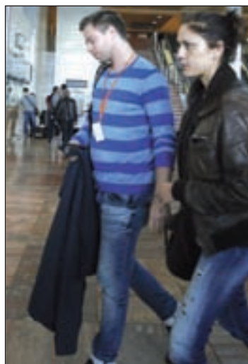
Familiares en el Prat

El vuelo U9525, que se desplazaba de Barcelona a Düsseldorf, descendió durante ocho minutos antes de colisionar, después de que se perdiera la pista cuando