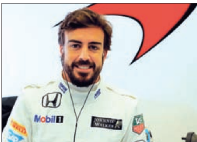
Alonso correrá su primera prueba del año