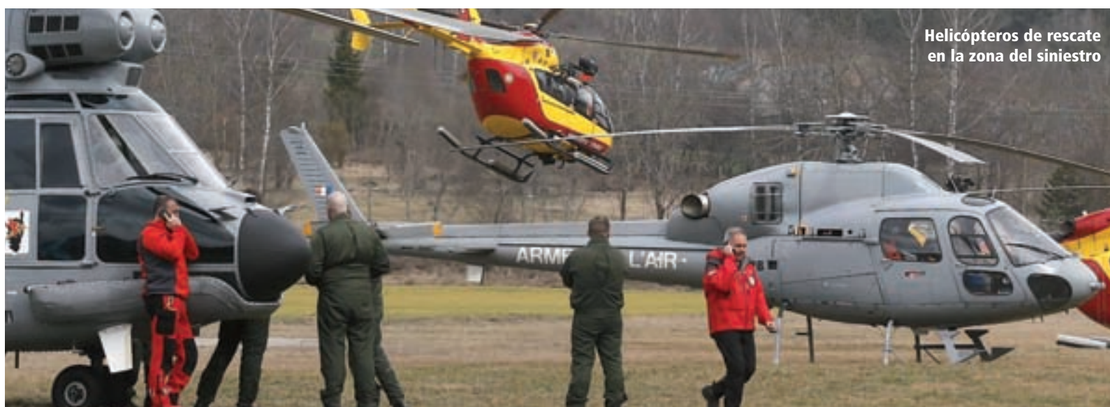
Helicópteros de rescate en la zona del siniestro