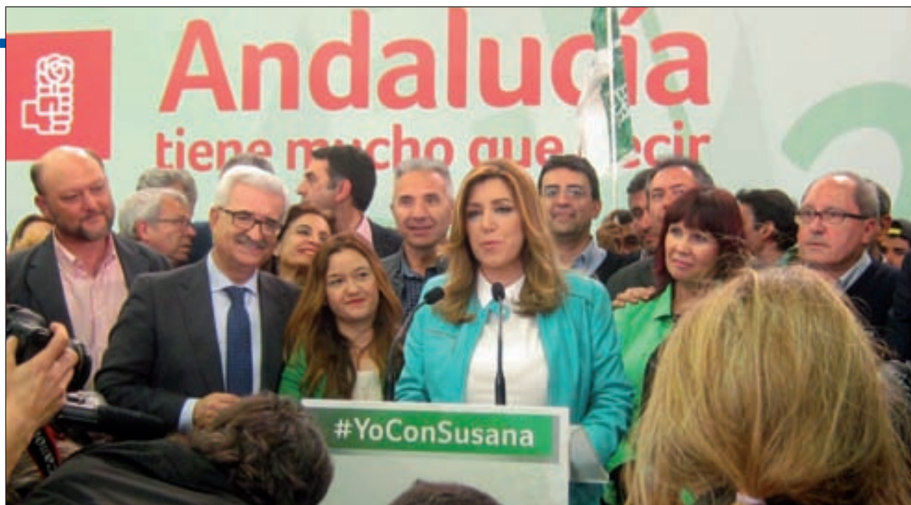
Susana Díaz tras ganar el domingo las elecciones

Los socialistas todavía no se han pronunciado al respecto, pero lo que está claro es que Susana Díaz necesita esa mayoría absoluta para ser proclamada presidenta en la primera votación, aunque no en las siguientes, en las que le bastaría con una mayoría simple. Pero para lograrlo en esas votaciones, deberá abstenerse, al menos, una de estas tres formaciones: PP, Podemos o Ciudadanos. Díaz también necesita que PP y Podemos no se unan, algo que parece no ocurrirá, después de que el vicesecretario de Organización y Electoral del PP, Car-