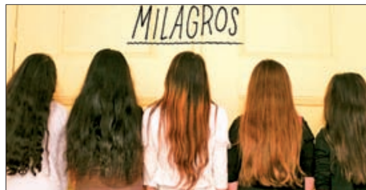
Componentes de 'Milagros'

pasado la chilena Javiera Mena, cantante de música electrónica, ya independizada; y, ahora, el grupo catalán El último vecino, especializado en pop sintetizado. "Les descubrimos cuando lanzaron un casete en edición limitada. Ahora están de gira por México y EE.UU.", puntualiza Prieto.