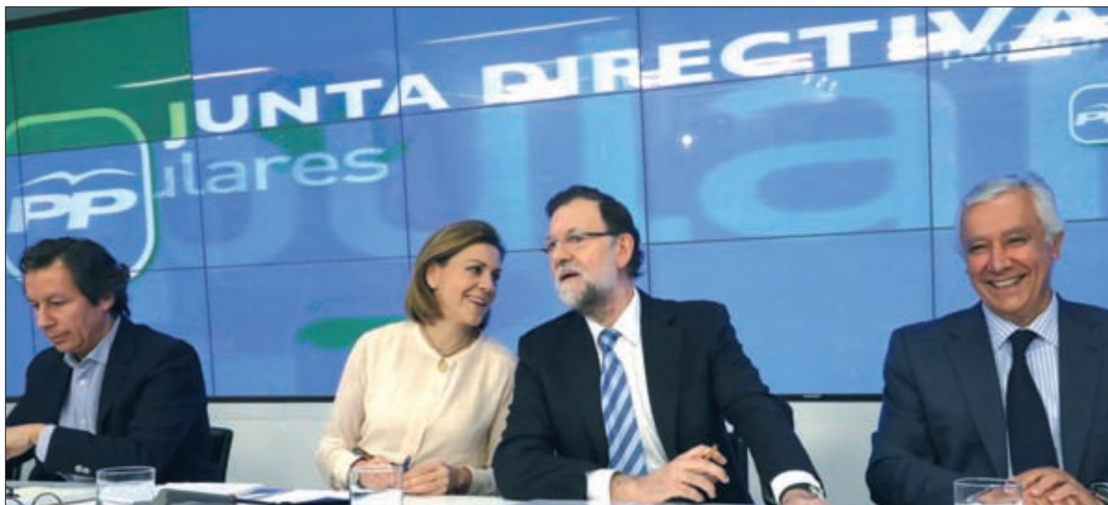
El presidente del Gobierno, Mariano Rajoy, presidió la Junta Directiva del PP celebrada el martes