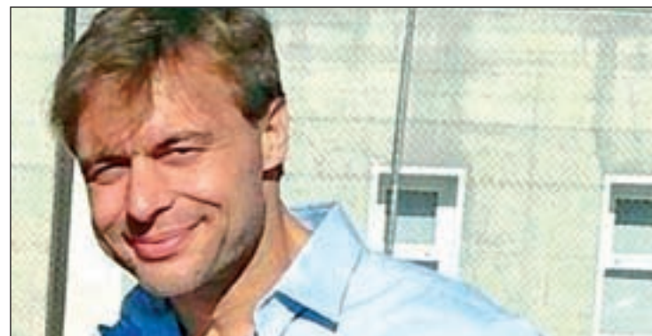
Presunto pederasta de Ciudad Lineal

Respecto a otros actos que se le imputaban, el magistrado recalca que la investigación “no ha permitido alcanzar evidencias o indicios de peso que permitan su procesamiento en relación con otros tres hechos”.