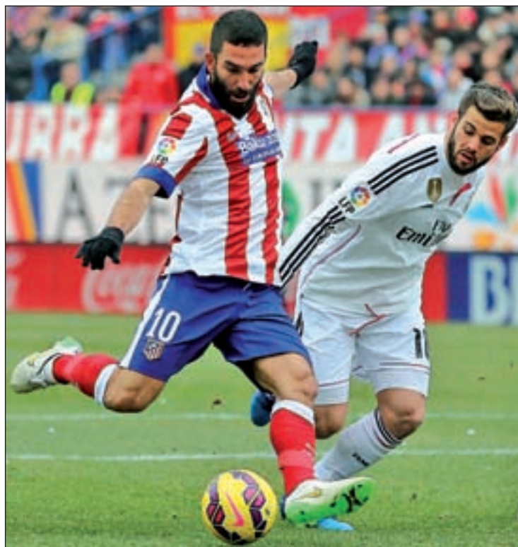
Los dos partidos de Liga cayeron del lado del Atlético

Otro de los aspirantes al título, el FC Barcelona, tendrá una intere-