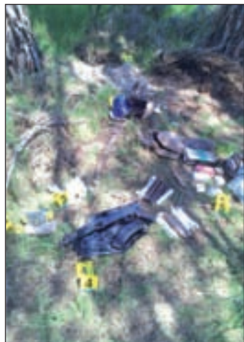
Las armas estaban enterradas

Los Cuerpos de Seguridad tuvieron conocimiento de la presencia de estos elementos a raíz de la llamada que realizó al 112 un vecino que paseaba por la zona, en las inmediaciones de la Finca de los Orioles, entre Majadahonda y Pozuelo, en Madrid.