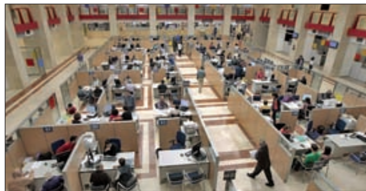
La campaña se extenderá hasta el próximo 30 de junio

La Agencia espera que la campaña cuente con 19,2 millones de