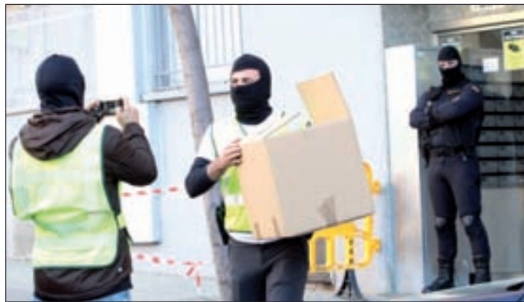
La operación continúa abierta