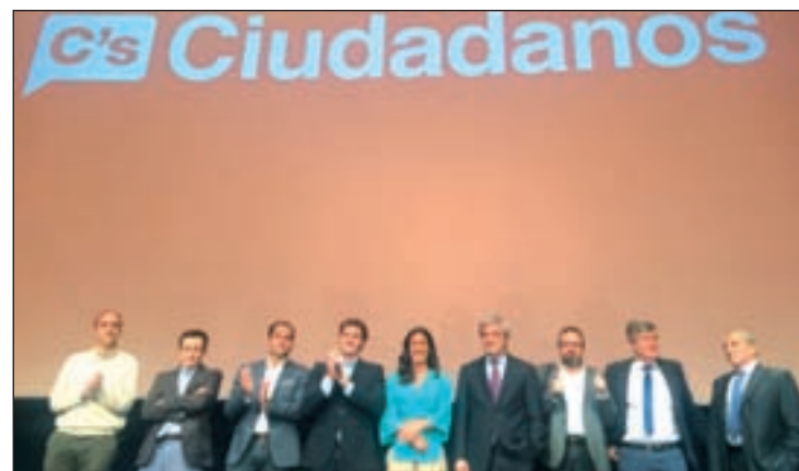
Albert Rivera, en la presentación del programa económico

Otra de las propuestas del partido de Albert Rivera consiste en flexibilizar y evitar los escalones numéricos en toda la normativa fiscal, laboral, que discrimina en función del tamaño. El programa cita como ejemplo que "por encima de 50 empleados las empresas tienen que auditar sus cuentas o tener comité de empresa".