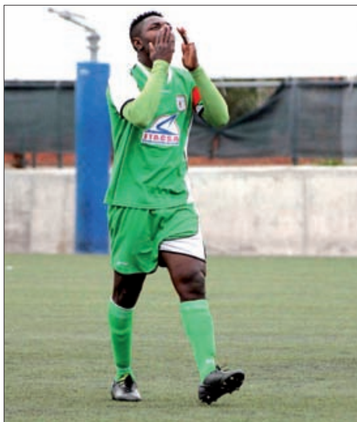
El Villaverde sueña con regresar a Tercera

Tras ponerse al día el pasado jueves con el encuentro ante el Torrejón, el conjunto carabanchero intentará sumar una nueva