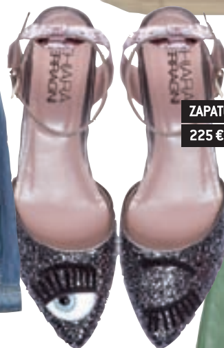
ZAPATOS CHIARA FERRAGNI 225 €