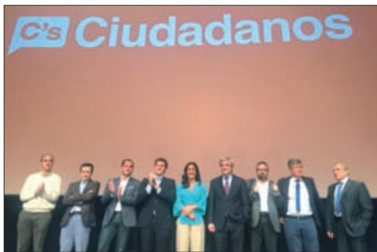
Albert Rivera, en la presentación del programa económico

LA AFILIACIÓN AUMENTA UN 20% EN MENOS DE UN MES