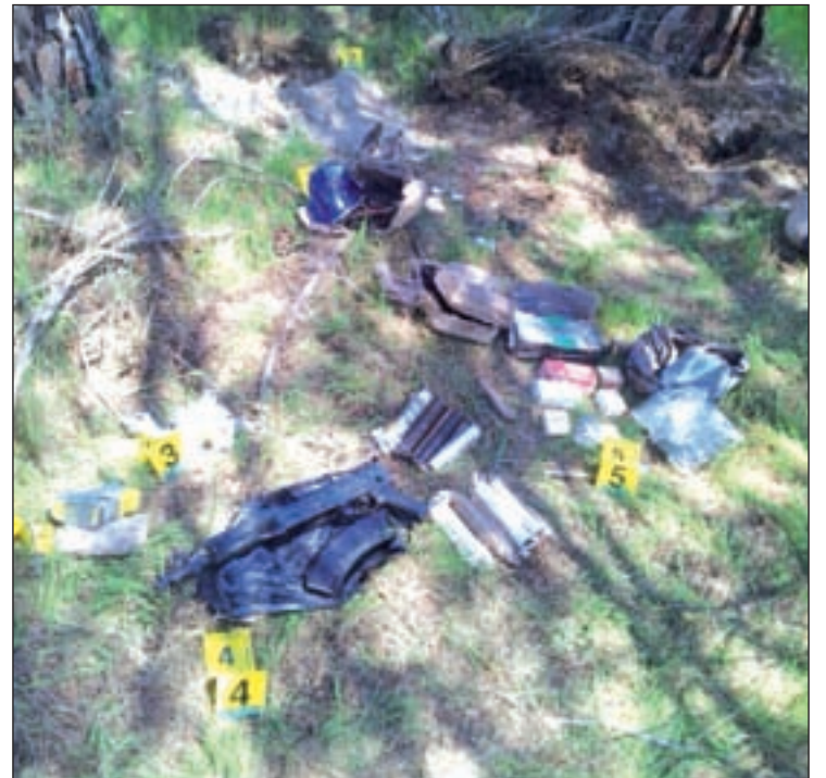
El material estaba en un zulo GENTE

El descubrimiento se produjo por la mañana. Debido a la proximi-