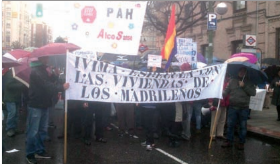
Una de las manifestaciones protagonizadas por los vecinos

Además de la recomendación, la UDYCO envía al magistrado, tras su requerimiento, relación de los socios y administradores de