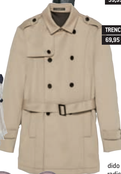
TRENCH ZARA MAN 69,95 €