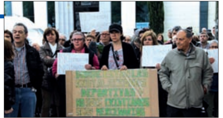
Una de las protestas de los vecinos a las puertas de la iglesia

terreno aledaño a la parroquia debe ser para uso del barrio, toda vez que el distrito acumula un notable déficit de equipamientos", concluyen.