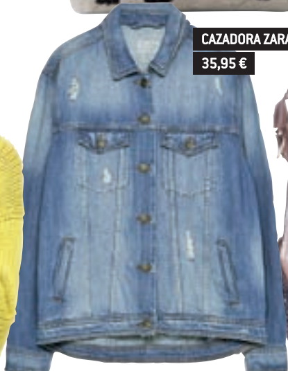
CAZADORA ZARA 35,95 €