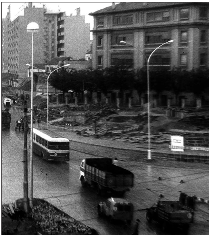
La 'nueva' carretera de Andalucía, el 2 de noviembre de 1963

Los autores 'pintan' un Usera muy diferente al actual, donde estuvo instalada la línea que separaba a republicanos y nacionales en la Guerra Civil, en el año 1939. "A este espacio situado entre los distritos de Carabanchel y Villa-verde se le conoció antes como frente, el frente de Usera, que como distrito, que es una división