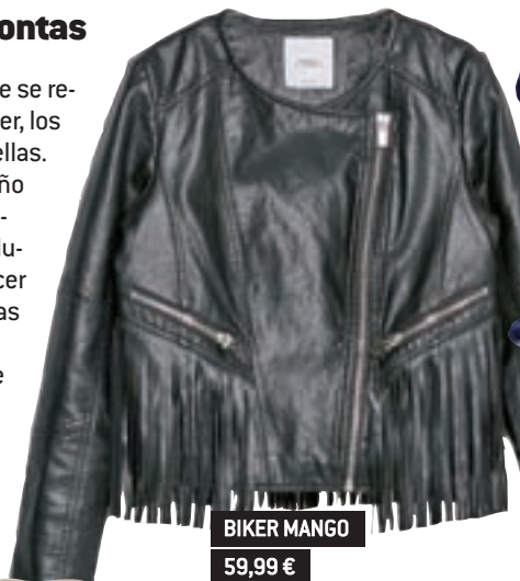
BIKER MANGO 59,99 €

Hay tendencias que se resisten a desaparecer, los flecos son una de ellas. Después de un otoño en el que habían tomado un segundo lugar vuelven a florecer en todas las prendas y complementos. Os recomiendo que elijáis los flecos en serraje para conseguir ese estilo boho-chic que tanto mola.