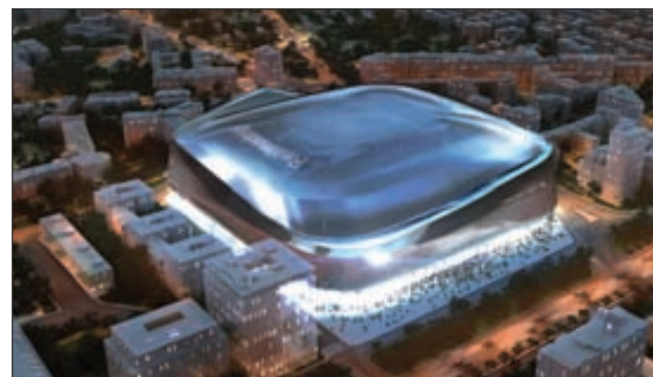
Los planes del club blanco podrían no llevarse a cabo

interpuso Ecologistas en Acción en el año 2013. El fallo subraya que la operación no responde al interés general, no amplía las dotaciones públicas y está diseñada sólo para satisfacer las necesidades de la entidad privada. Además, asume que ha existido desviación de poder (uso de las competencias de una administración para fines diferentes a los que justificante). Tras estas dos sentencias, se imposibilitan las posibilidades del proyecto del club de fútbol de construcción de un hotel y un centro comercial de lujo