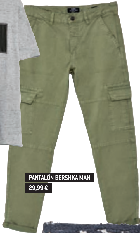
PANTALÓN BERSHKA MAN 29,99 €