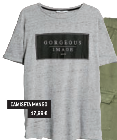
CAMISETA MANGO 17,99 €

Cambio de temporada , cambio de armario y, como no, de colorido • Es momento de repasar los desfiles y de sacar conclusiones de los catálogos de las tiendas 'low-cost'