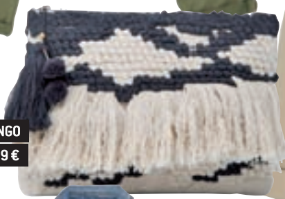
BOLSO MANGO 25,99 €

Si tienes el armario dividido en prendas de diario y prendas de vestir ya puedes ir dándole una vuelta para conseguir looks molones y diferentes. En esta primavera salir con una camiseta a la discoteca e ir con un pantalón de traje y deportivas a la universidad es algo vital. ¡Mezcla diferentes estilos y arriésgate!