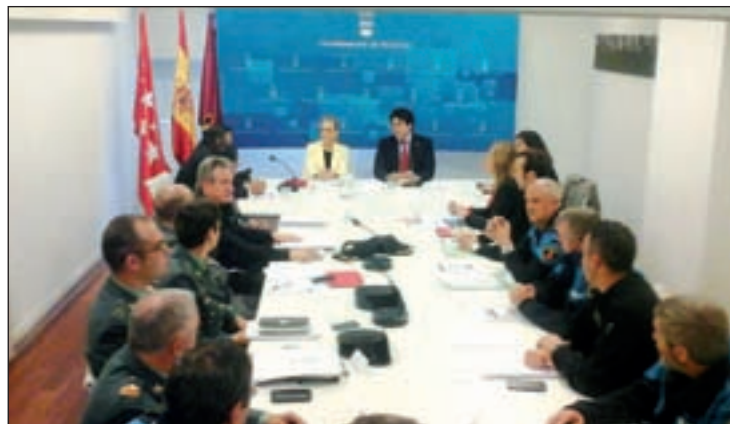
Cristina Cifuentes, en la Junta de Seguridad de Alcorcón

Llegó a la Delegación en enero de 2012, cuando todavía daba coletazos el movimiento 15M, y confesó que ella no hubiera dejado que acamparan durante casi tres meses en la Puerta del Sol, planteando como alternativa que los 'indignados' se fueran a la Casa de Campo y reconociendo que se infiltró en una asamblea del 15M