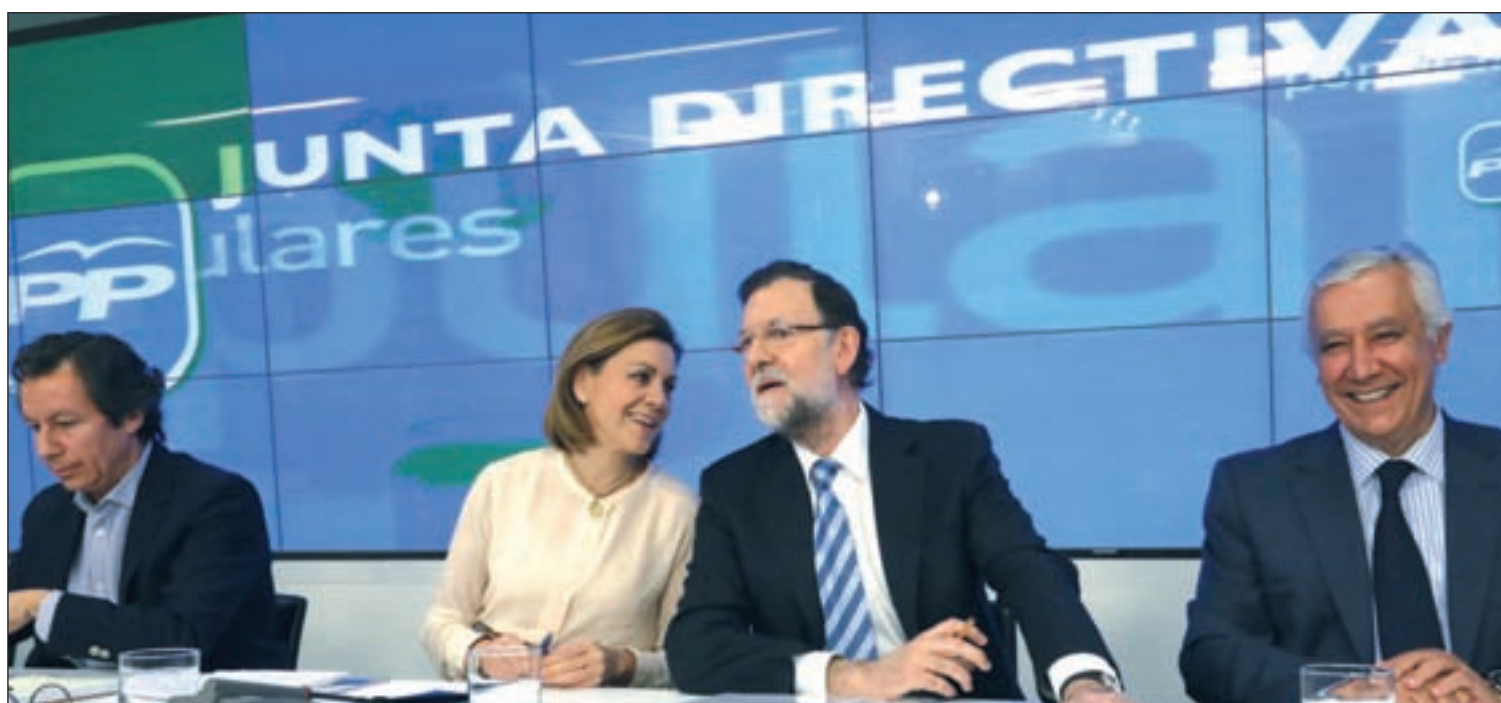
El presidente del Gobierno, Mariano Rajoy, presidió la Junta Directiva del PP celebrada el martes