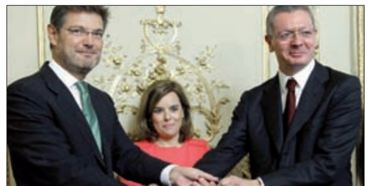
Catalá y Ruiz-Gallardón, en la toma de posesión del primero

Todas las demás normas impulsadas por Gallardón han cambiado completamente su contenido. Una de las pocas medidas salvadas fue la prisión permanente revisable.