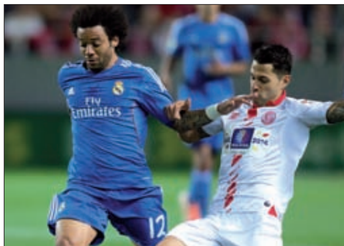
Los blancos ya cayeron derrotados el año pasado en Sevilla