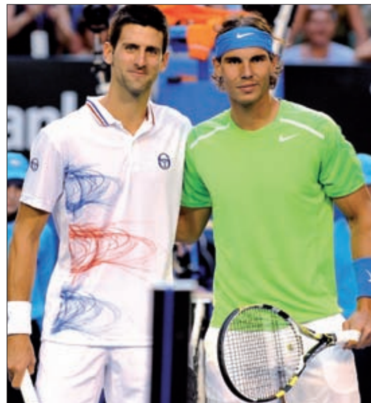
Djokovic y Nadal no se verán las caras en Madrid

Unas sensaciones muy diferentes han dejado dos jugadores que bien podrían dar la sorpresa en el torneo que arrancará este viernes. El checo Tomas Berdych se confirma como número dos en la ca-