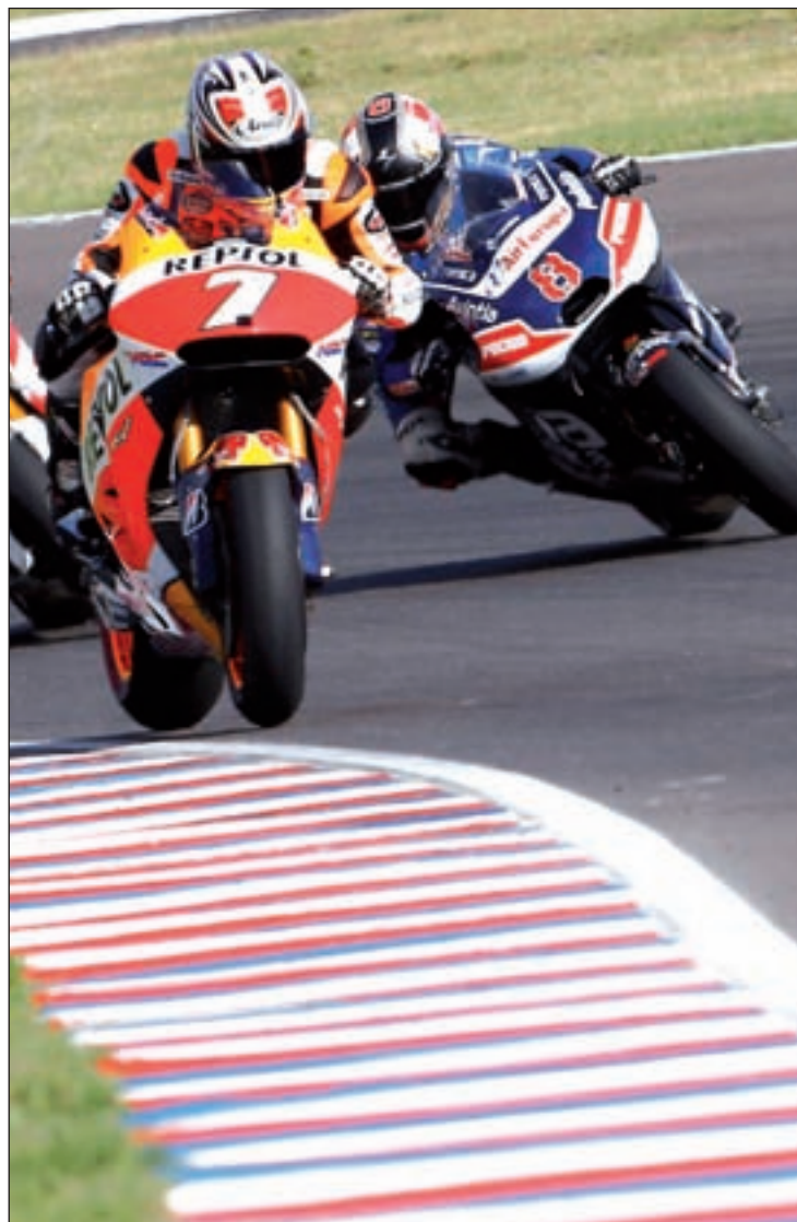
Aoyama ha suplido a Pedrosa durante varias carreras

entre Márquez y Rossi, dejando como ganador al italiano, quien lidera la clasificación general con 66 puntos, 6 más que su compatriota Andrea Dovizioso, quien está plasmando en las carreras las buenas sensaciones que había desprendido Ducati durante la pretemporada. Para encontrar al primer piloto español en la máxima categoría hay que descender hasta la cuara plaza, donde está Jorge Lorenzo. El mallorquín espera subir al podio por primera vez en la presente campaña.