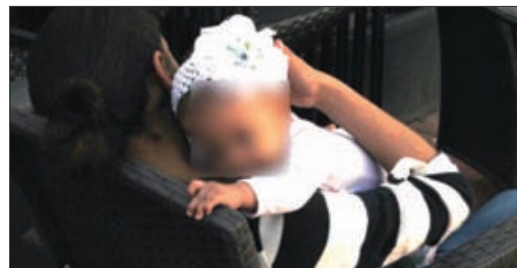
La planificación domina ahora sus vidas N.G./GENTE

difícil, reconoce esta última, ha sido “cargar con los comentarios de las personas que te conocen, cuando se enteran de que estás embarazada. Una vez superas ese pánico y después de que el mundo se te venga encima, enseguida compruebas que existen soluciones”, zanja sonriente.