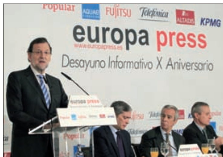
Mariano Rajoy, presidente del Gobierno, en el desayuno

SIN INTENCIÓN DE HACER CAMBIOS EN EL PARTIDO