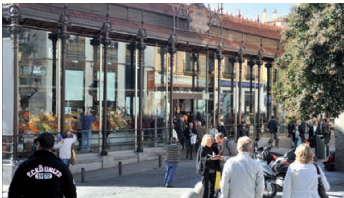
España recibió 10,6 millones de turistas extranjeros en el primer trimestre del año

Además, también revisa los expedientes la concesión judicial de la emancipación y del beneficio de la mayoría de edad. Así, la norma elimina, además, el supuesto de emancipación por matrimonio. Actualmente, un joven podía emanciparse a los 14 años si se casaba, pero este supuesto desaparece al haber elevado la edad para contraerlo a los 16 años.