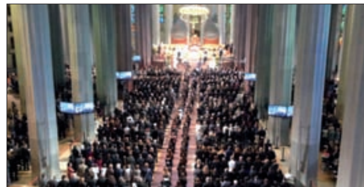
El funeral se ofició en la Sagrada Familia

Sistach pidió a los familiares que la tragedia no paralice sus vidas y coraje para seguir viviendo. "La muerte violenta y repentina de nuestros queridos hermanos podría paralizar la vida de quienes les aman muchísimo. Sin embargo, el mensaje paulino que hemos escuchado nos ha de dar coraje para vivir", afirmó el cardenal-arzobispo de Barcelona durante la homilía.