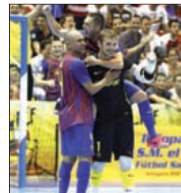
El Barça cayó en semifinales

Por su parte, el Inter apela a la calidad de jugadores como Cardinal, Ricardinho o Rivillos. La 'máquina verde' intentará resarcirse de la inesperada eliminación en la última Copa de España.