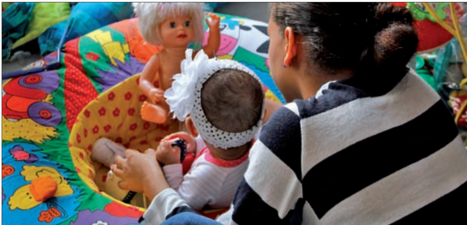
Guardería de la Fundación Madrina en el barrio de Valdeacederas (Madrid)