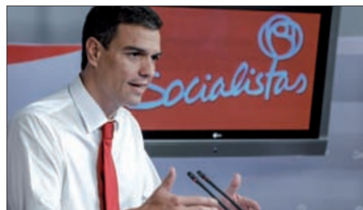
Pedro Sánchez, líder de los socialistas

Por su parte, el secretario general, Pedro Sánchez, puso en valor el portal, "en el que no solamente vais a poder conocer el estado de mis cuentas corrientes y mi declaración de bienes, sino