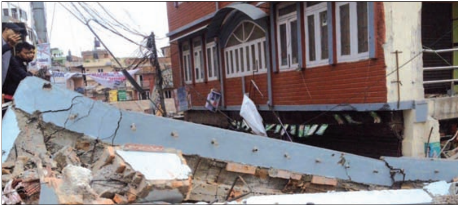
Más de 5.000 personas han fallecido, pero las autoridades creen que la cifra de víctimas puede aumentar