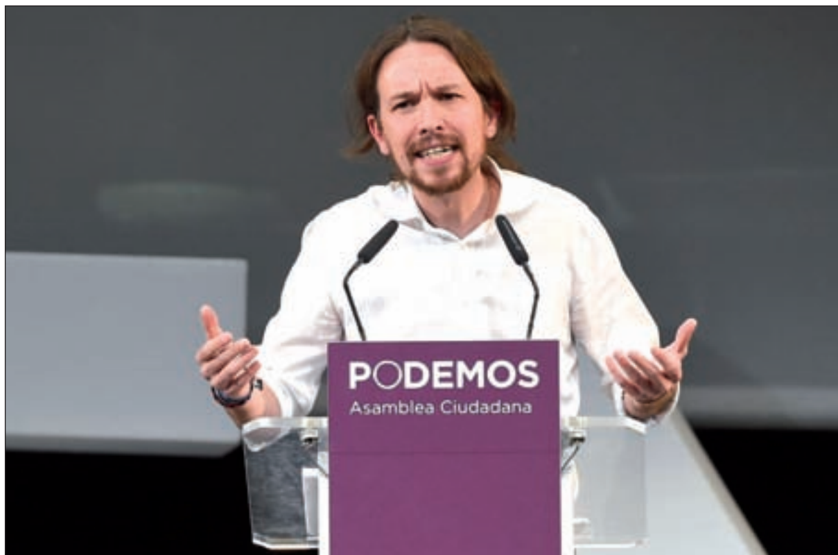
Podemos es el único partido que da la espalda totalmente a la banca

La situación es bien distinta para el resto de alternativas políticas. Partidos históricos como IU dedicarán un 50% menos que en 2011, 2,2 millones de euros, ya que, aseguran, no conviene que los políticos sean "ostentosos". Detrás, los serios problemas económicos de la formación que arrastra una deuda de 1,8 millones de euros con Hacienda y la Seguridad Social en la Comunidad de Madrid.