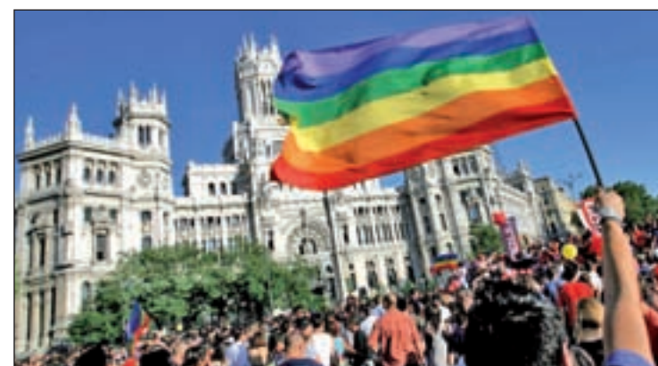
Última celebración del Orgullo Gay en Madrid

MADO 2015 se celebrará en la capital del 1 al 5 de julio. El impacto económico ronda los 110 millones de beneficios para la ciudad y la participación alcanza los dos millones de personas.