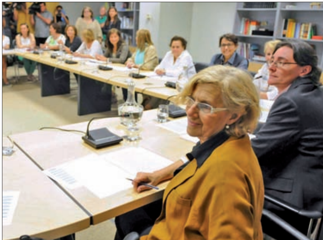
Manuela Carmena y Marta Higuera, este miércoles en el Área de Gobierno de Equidad

En dicha rueda de prensa, Carmena, que estrenaba así su agenda pública como alcaldesa, puntualizó que los datos recogidos, 2.701