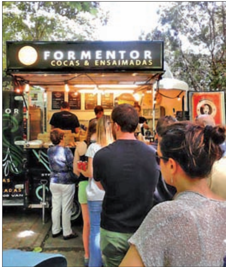
Imagen de una de las anteriores ediciones

En el capítulo de novedades también habrá hueco para el encuen-