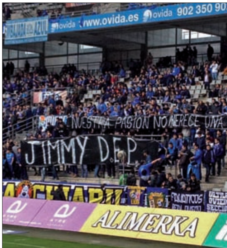
La muerte de 'Jimmy' conmocionó al fútbol español

A pesar de estas detenciones, al cierre de estas líneas no se descartaba que se produjeran nuevos arrestos. Las fuentes consultadas por Europa Press precisan que estos dos nuevos detenidos acusados de homicidio pertenecerían supuestamente al mismo grupo agresor en el que se encuentran