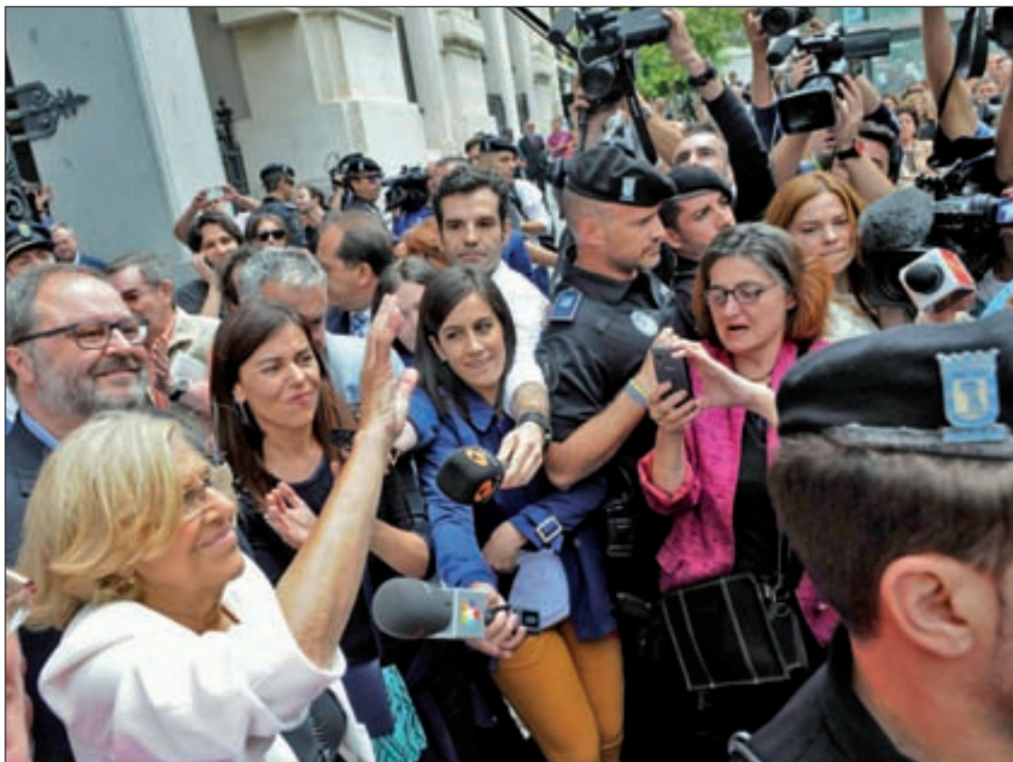
Manuela Carmena, a su salida del Pleno de investidura

La nueva alcaldesa anuncia un incremento del presupuesto para proporcionar este verano comidas y cenas a menores de edad PÁGS. 10-11