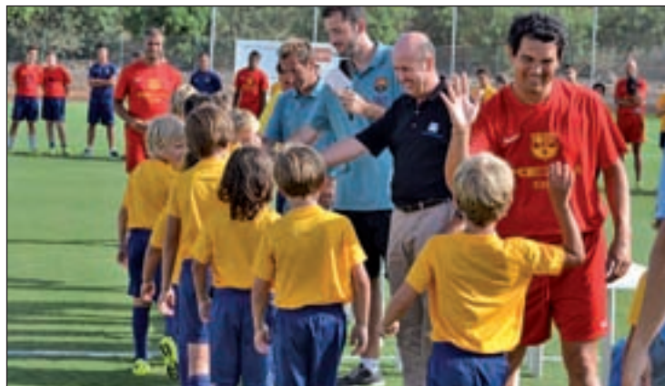
Fútbol y educación se dan la mano

Para los vecinos de la zona Norte, más concretamente en