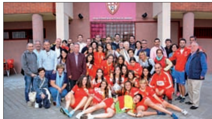
Las ganadoras posan con el título

po agresor, en el marco de aquella reyerta, lanzó a dos personas al río Manzanares con un lapso de tiempo de 43 segundos de diferencia, y una de ellas fue la persona fallecida. Todos los detenidos fueron trasladados a las dependencias de la Policía Nacional en la Comisaría de Moratalaz en Madrid. Pocas horas después, la Fiscalía de Menores dejaba en libertad a los dos ultras del Frente Atlético menores de edad y decidió no imponer medidas cautelares privativas de libertad a los detenidos al no encontrar pruebas de su participación.