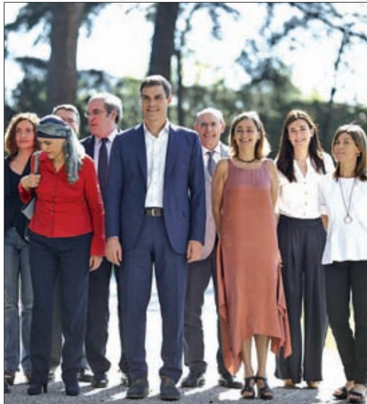
Pedro Sánchez y su grupo de expertos

Por su parte, el presidente del Gobierno, Mariano Rajoy, ha encargado a la dirección del PP empezar a crear grupos de expertos para la elaboración del programa con la idea de que esté listo a mediados del mes de septiembre. En el texto, los populares harán hincapié en las políticas sociales y estudian nuevas ayudas para autónomos o pensionistas con familiares a su cargo. De hecho, la agenda social centrará una de las ponencias de su Conferencia Política, que se celebrará los próximos 10 y 11 de julio, un conclave que el PP quiere convertir en un