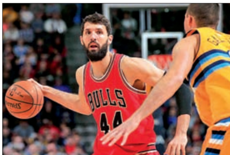
España busca un nuevo título