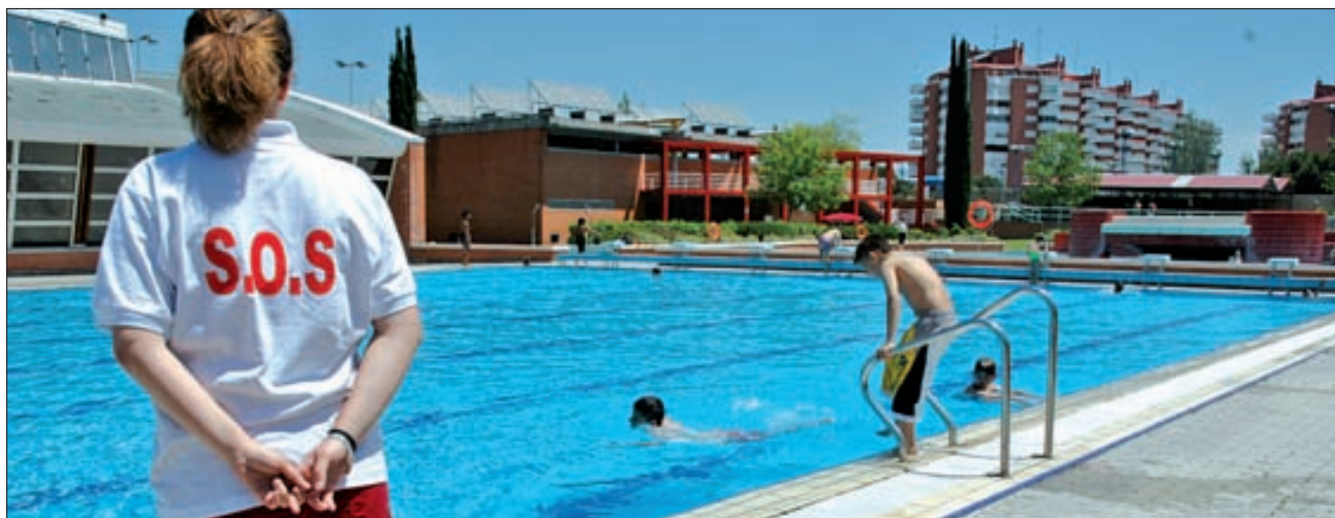
El deber del socorrista es el salvamento no la supervisión

El curso pasado, la ley comenzó a implantarse en 1º, 3º y 5º de Primaria y casi un año más tarde País Vasco y Cataluña no han aprobado su normativa de Primaria. Ante esta situación, el ministerio ha presentado dos requerimientos de inacción. Las mismas fuentes indican que estas comunidades no han emitido una respuesta y recuerdan que, en el caso de que no sea sustanciado, el Ministerio abrirá un proceso contencioso-administrativo.