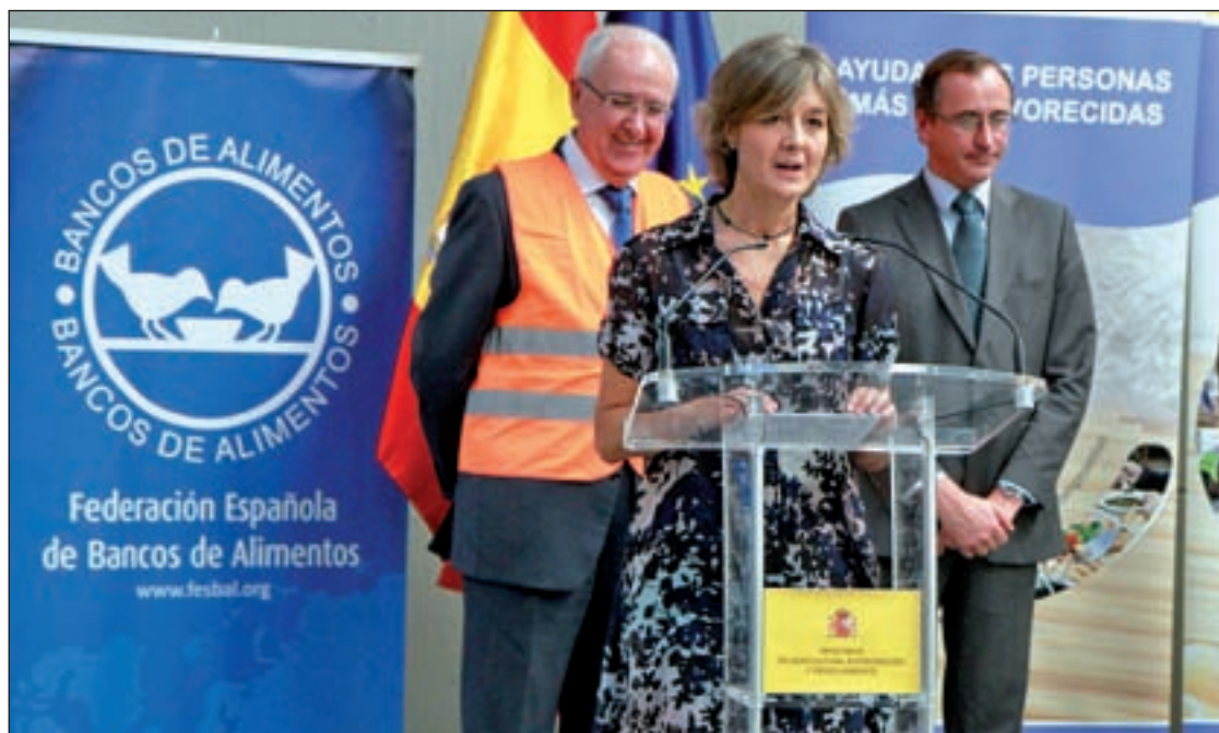
García Tejerina y Alonso, en la presentación del plan en el Banco de Alimentos de Madrid

Su ingreso llega después de que el Ministerio retrasara su entrada dos veces como medida de austeridad. La ley fue aprobada en 2006 y en 2012 tendrían que haberse sumado.