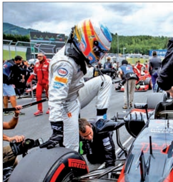
Alonso aún no ha estrenado su casillero de puntos

Pero volviendo a Alonso, la razón del optimismo moderado que ha mostrado en los últimos días el asturiano tiene que ver con el