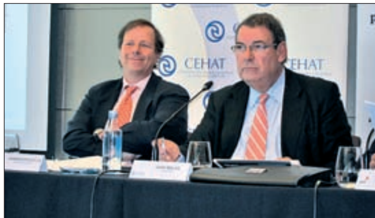
Representantes de Cehat y de la consultora PwC

La Confederación Española de Hoteles y Alojamientos Turísticos (Cehat) y la consultora PwC dieron a conocer el pasado miércoles su índice OHE Hotelero, que muestra un incremento del 12,3% en relación al año 2014, hasta si-