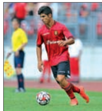
Asensio, una de las estrellas

que dejó la edición del año pasado parece no haber hecho mella en una nueva generación de jugadores que ya en la fase previa dejó unas sensaciones estupendas. Las goleadas ante Georgia (4-1), Turquía (5-0) y Portugal (4-0) les valieron a los jóvenes españoles un billete para el torneo que