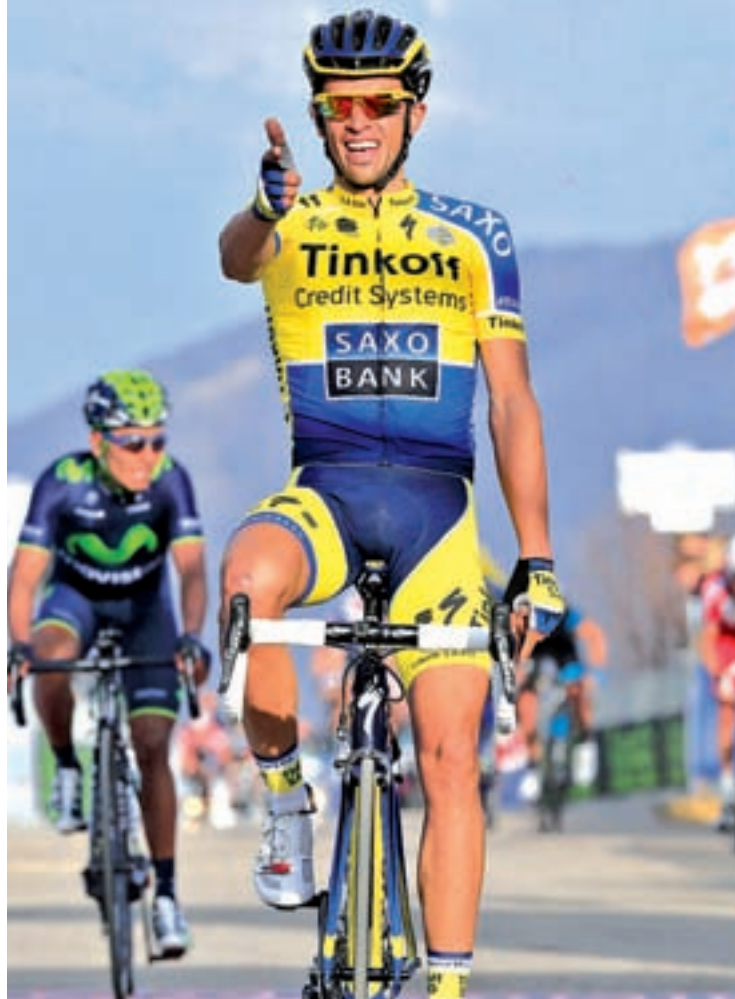
El pinteño afronta un desafío histórico

FRANCISCO QUIRÓS SORIANO @franciscoquiros