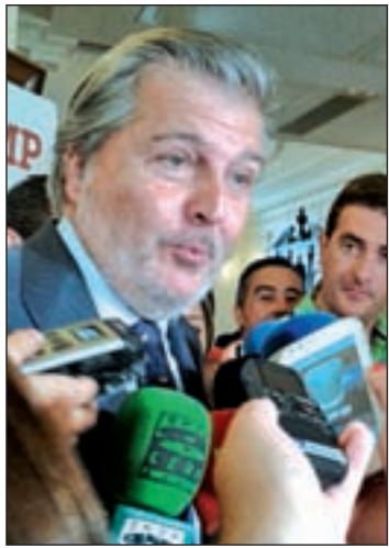
Íñigo Méndez de Vigo