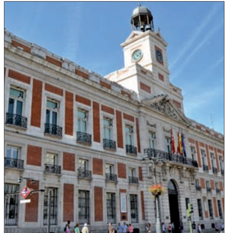
La sede del Gobierno regional

Esta rebaja supondrá un ahorro de más de dos millones de euros. "Esta reducción obedece a un compromiso electoral del PP y al acuerdo suscrito con Ciudadanos