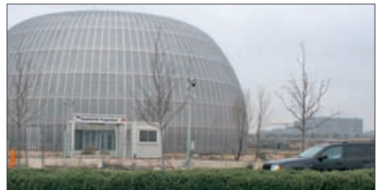
El edificio seguirá sin tener uso por el momento

de la Ciudad de la Justicia "hubo un intento denominado Campus de la Justicia, con un objetivo similar", pero que "quedó formalmente disuelto". Según los cálculos del Gobierno regional, unas 25.000 personas pasarían a diario por estas instalaciones, entre ciudadanos y trabajadores.