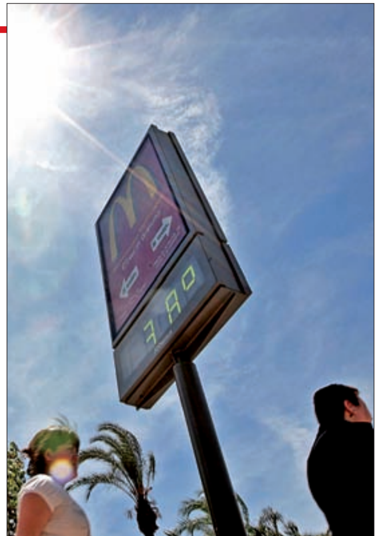
Sanidad recomienda vestir con ropa de colores claros

Por último, es necesario consultar al médico ante síntomas que se prolonguen más de una hora y que puedan estar relacionados con las altas temperaturas, así como mantener las medicinas en un lugar fresco, ya que el calor puede alterar su composición y sus efectos.