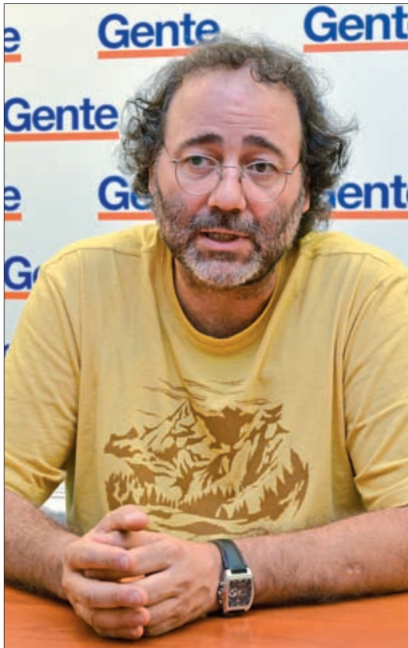
CHEMA MARTÍNEZ / GENTE

No, aunque lo considero como un primer paso. Vamos a necesitar una implicación absoluta por parte del Gobierno municipal, en especial en el tema de la Emvs, pero también con la gente que vive en un piso del Ivima. Se están dando situaciones de desahucios, de lanzamientos injustos y de dejadez por parte de los Servicios Sociales. Ha habido un desentendimiento continuado, y hablo de la institución, no de los profesiona-