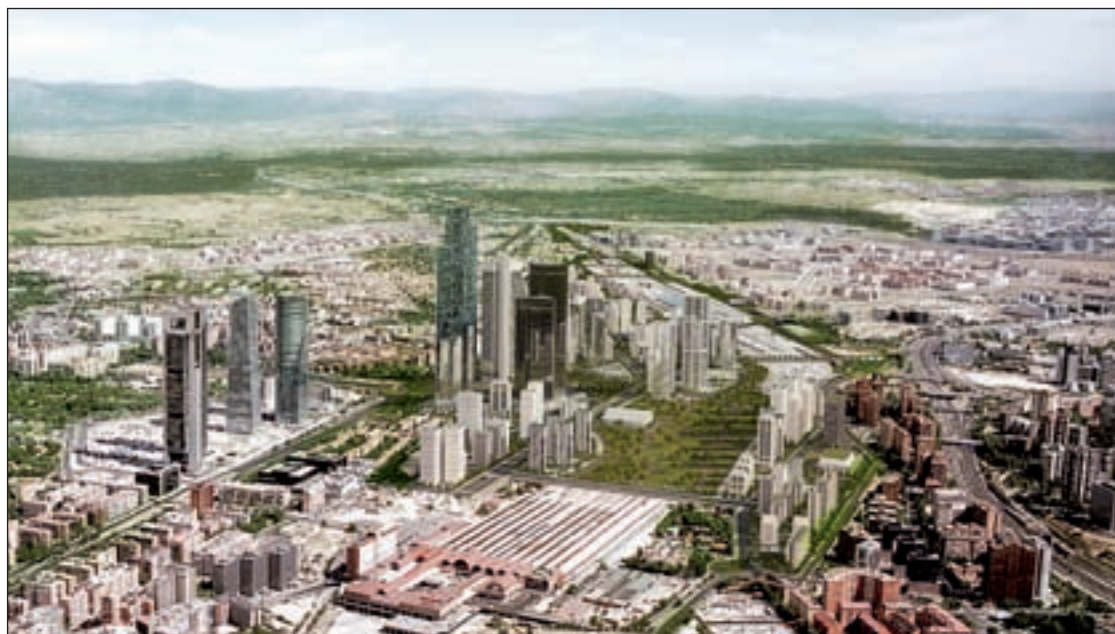
Vista área de Distrito Castellana Norte

Lo que está claro es que, al margen de la deuda municipal, serán los proyectos urbanísticos quienes acaparen la atención de la regidora en estos primeros meses al frente de Cibeles, con especial atención a Chamartín, plaza de España, Canalejas y Campamento. Con respecto al primer caso, la regidora se ha comprometido a estudiar el plan ante el presidente de Distrito Castellana Nor-