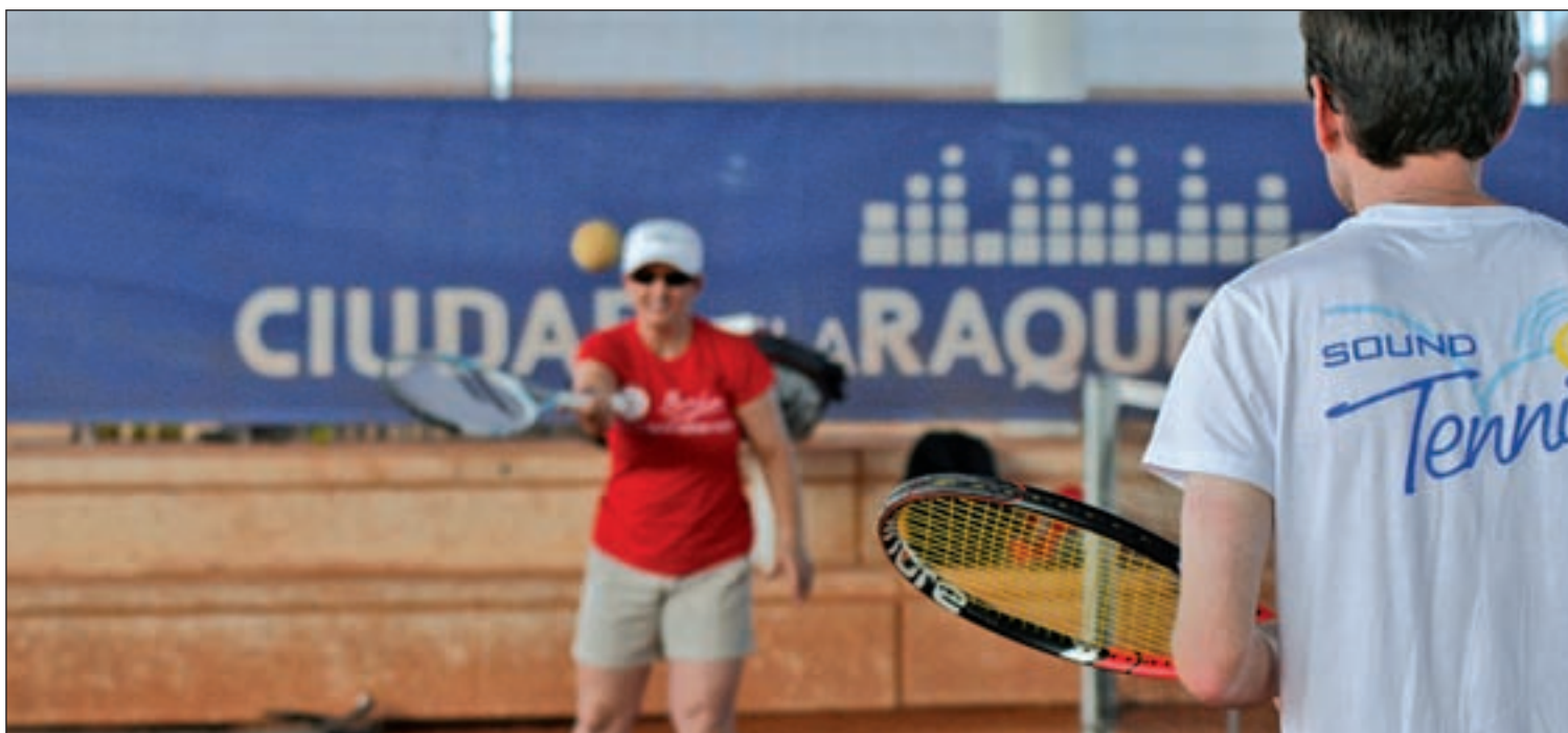
Momento de un entrenamiento en las pistas de Fuencarral