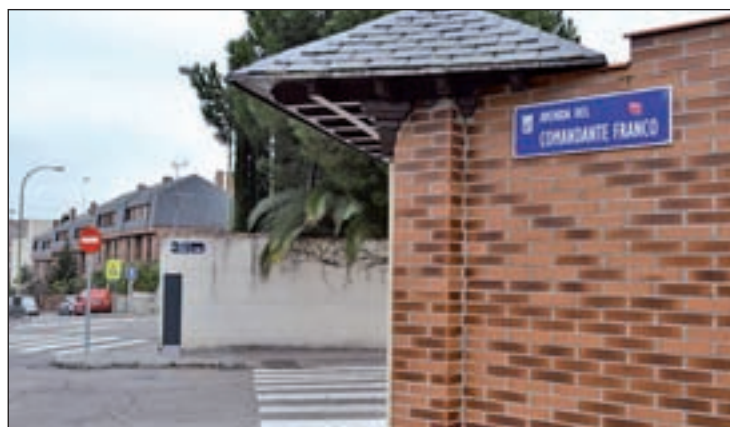
Calle franquista en Madrid

El plan de la nueva alcaldesa, Manuela Carmena, es sustituirlos por nombres que sí estén acordes a la legislación actual, afectando a algunas vías como la avenida del Comandante Franco, en el distrito de Chamartín, u otras tan emblemáticas como la avenida del Cardenal Herrera Oria, en Fuen-