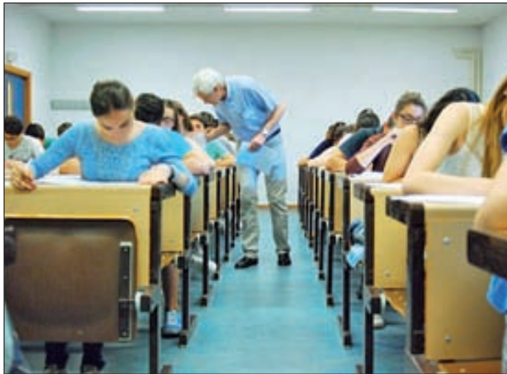
EL plazo de matriculación se retrasará unas semanas