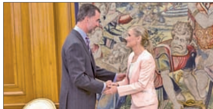
Don Felipe y Cristina Cifuentes, durante la audiencia

Al mismo tiempo, hablaron de la situación de la Comunidad de Madrid, de la nueva estructura del Gobierno y de las iniciativas recogidas en el programa electoral que se llevarán a cabo, destacando la importancia de hacer política social.