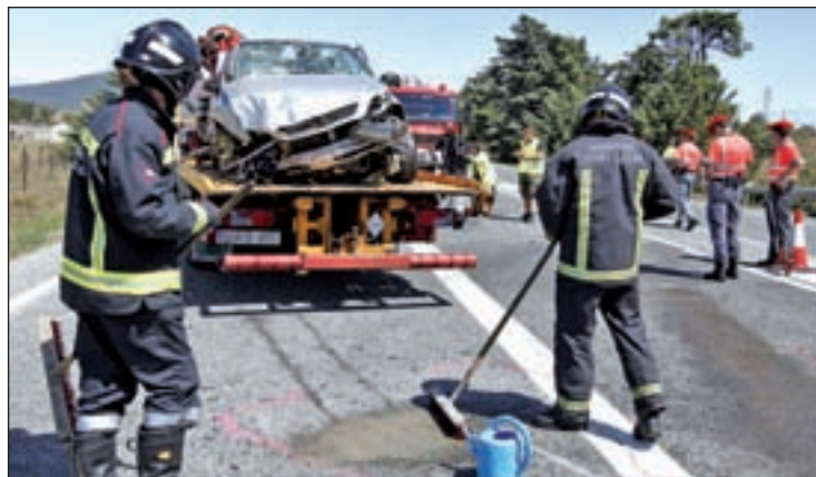
Los fallecidos se incrementaron un 0,4% en 2014

La decisión responde a la “preocupación” de los responsables de Tráfico debido a la anti-