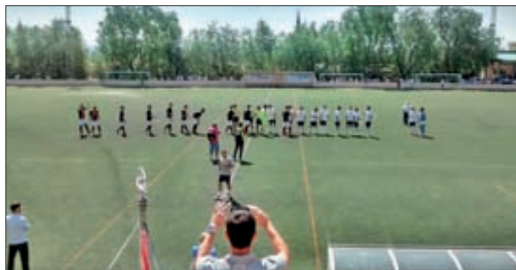
El equipo de San Blas no jugará en la élite GENTE

económicos. En esta ocasión, el protagonista es un equipo madrileño, el Distrito Olímpico Plenilunio. El conjunto de San Blas ha pasado varias semanas trabajando a contrarreloj para superar las trabas administrativas derivadas de su ascenso a Liga Femenina, pero finalmente la entidad ha tira-