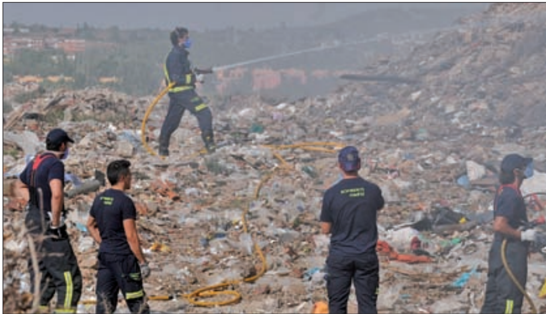
Bomberos del Ayuntamiento, esta semana en el basurero