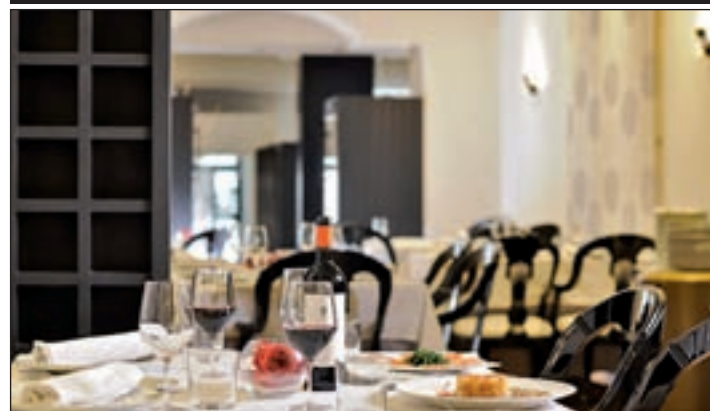
El interior del restaurante Lakuntza