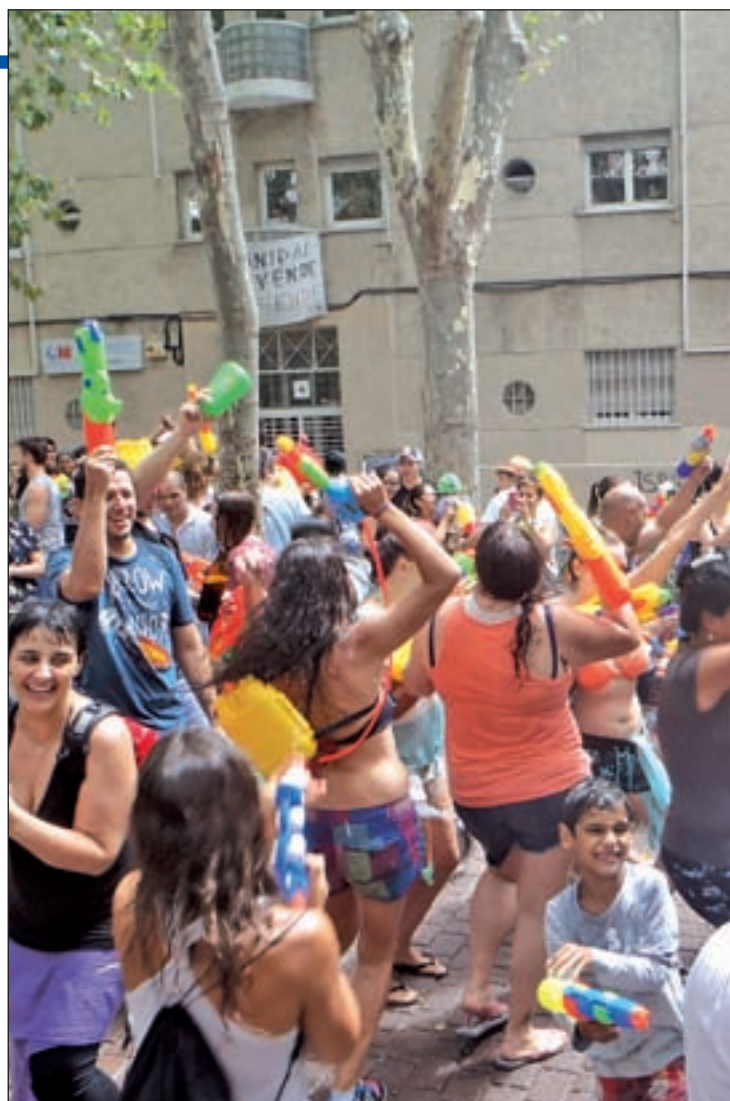
Un momento de las celebraciones del pasado año

Las celebraciones vecinales arrancarán el jueves 16 de julio a las 19 horas con un paseo de gigantes, cabezudos y dulzaneiros