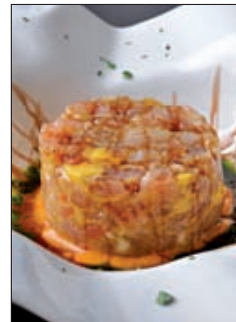
Uno de los platos de la carta

Un espacio adaptado a las nuevas tendencias sin perder la filosofía de calidad, servicio atento y discreto y gusto por el producto de origen y temporada en su estado más natural. Así es Lakuntza (General Díaz Porlier, 97), un asador donde las mejores verduras de Navarra, los pescados salvajes traídos directamente de Ondarroa y las piezas de carne de reses de pequeños productores son la base de una cocina que apuesta por el "menos es más" y cuyos platos se sirven también en barra.