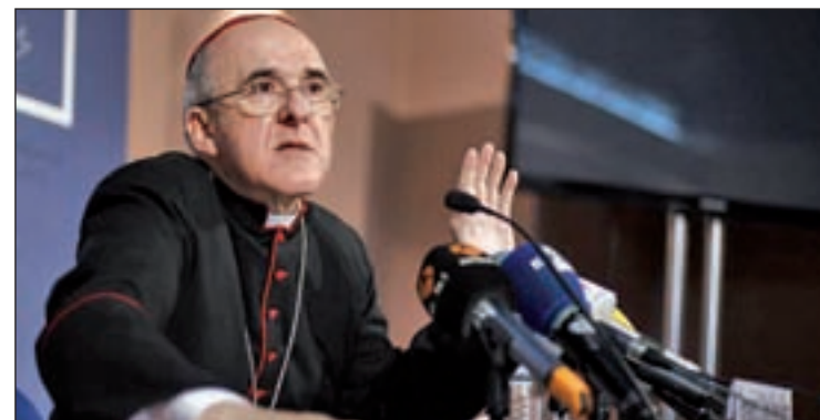
Carlos Osoro cree que existe una "demanda" para su plan de ayuda

bién espera crear un "clima de fraternidad entre todos". Y remarca: "Cuando era cura joven estuve con jóvenes que pude recoger en una casa y hoy son grandes padres de familia que han sido capaces de transmitir a sus hijos lo mejor de sus vidas cuando a lo mejor nadie lo esperaba".