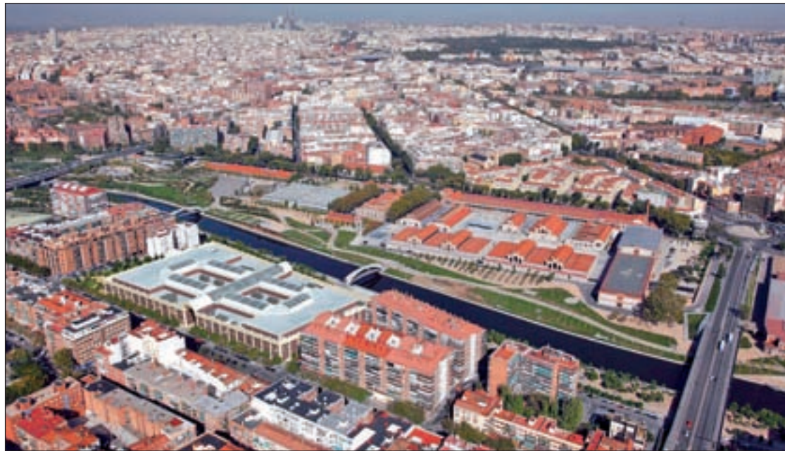
Una recreación del futuro espacio comercial