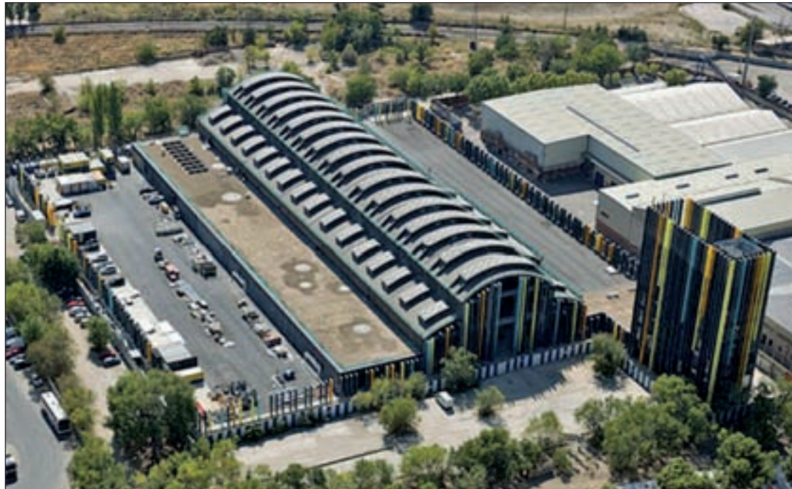
Estado actual de la infraestructura situada en el distrito de Villaverde

Para ello, pondrá en marcha la primera fase de un proceso de participación el próximo mes octubre, con el objetivo de que los vecinos del distrito puedan dar su opinión sobre el destino final del edificio. En el mismo estarán implicadas las Áreas de Equidad, Derechos Sociales y Empleo, de Participación Ciudadana, Trans-