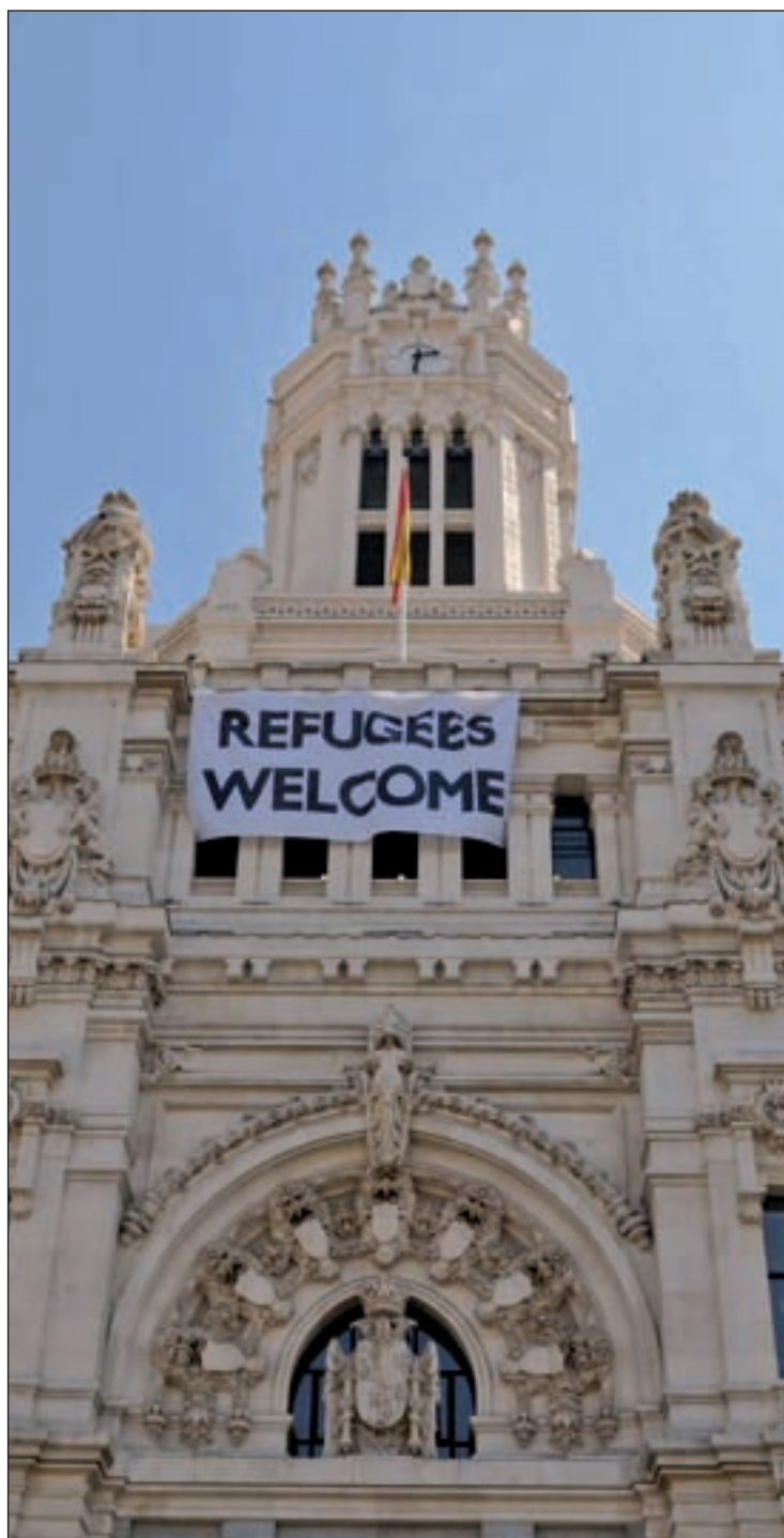
Una pancarta da la bienvenida en el Ayuntamiento de Madrid

Consistorios de todos los signos políticos también han decidido colaborar. Madrid fue la primera localidad en dar un paso al frente y ya ha aprobado destinar 10 millones de euros a un plan de