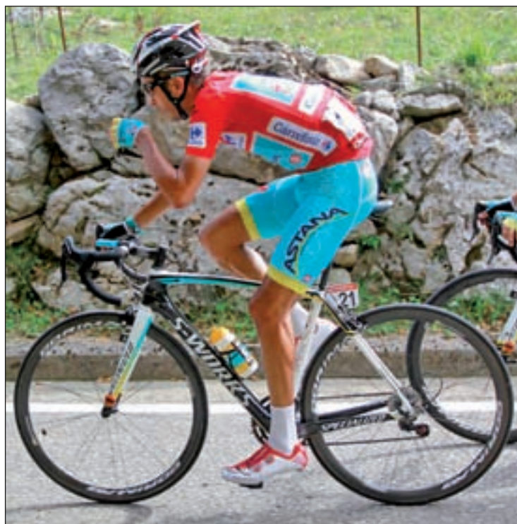
Fabio Aru, uno de los grandes protagonistas

Pero antes de bajar el telón de forma definitiva, los supervivientes deberán afrontar una última etapa en la que está prevista la salida en torno a las 17:35 horas desde Alcalá de Henares. La localidad Complutense dejará paso a otras del Corredor, como Torrejón de Ardoz, San Fernando o Coslada. Una vez recorridos estos municipios, el pelotón tomará la Avenida del Mediterráneo para después incorporarse a los paseos de Reina Cristina e Infanta Isabel. La estación de Atocha y el paseo del Prado serán la antesala del primer paso por la línea de meta. Después se darán diez vueltas a un circuito con puntos destacados como Colón, Cibeles, Callao y la Glorieta del Emperador. En función de la velocidad que empleen