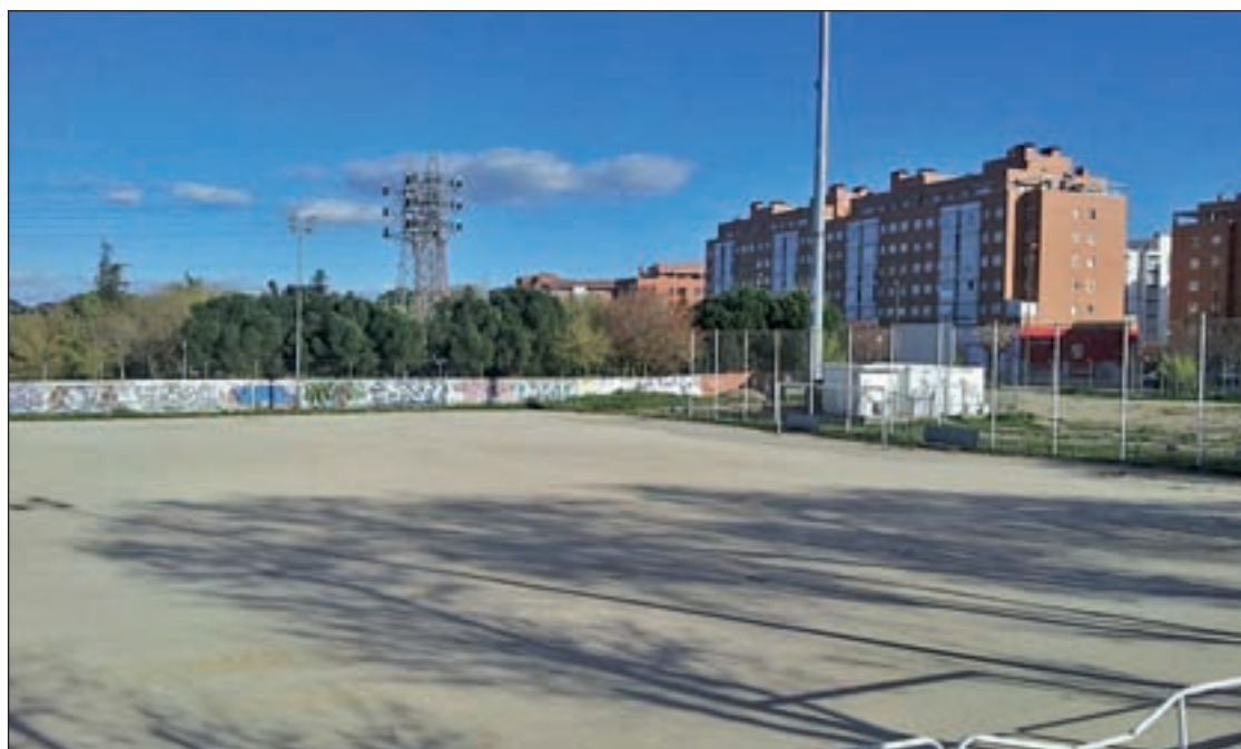
Estado actual de las instalaciones deportivas de la avenida de la Aviación

Desde la compañía explicaron que esta factoría, al igual que el conjunto del grupo PSA, continúa su proceso de mejora continua y de refuerzo de la competitividad, por lo que está inmersa en un proceso de transformación que recoge actualizaciones en sus instalaciones. Este plan también incluye el traslado de personas de otras entidades de la compañía en la Comunidad de Madrid al centro de Villaverde.