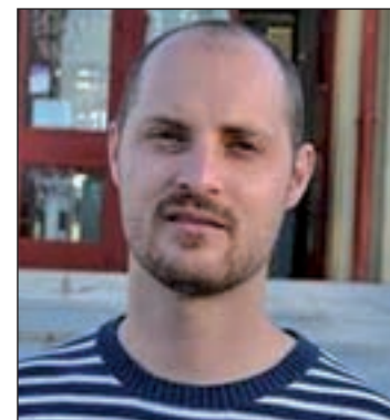
El edil socialista

sus barrios y distritos. Como ejemplo, los socialistas hablaron de la presencia de colonias de ratones en los jardines de la plaza de Tirso de Molina y en la Plaza de Oriente, así como de ratas de grandes dimensiones en algunas calles de los barrios de Aluche y de Legazpi.