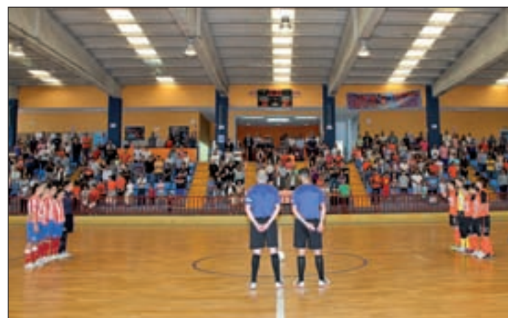
Imagen del partido de ida

a la última etapa. La jornada del sábado promete ser decisiva en lo que a los puestos decisivos de la clasificación general se refiere. La línea de salida estará situada en San Lorenzo del Escorial, desde donde los ciclistas deberán afrontar una etapa de 175 kilómetros que incluye las ascensiones a dos puertos de primera categoría: Navacerrada, Morcuera y Cotos.