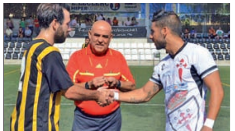
El Carabanchel debutará en el campo del Fortuna

En esta tercera fecha, el Puerta Bonita buscará su primera victoria del curso con motivo de la visi-