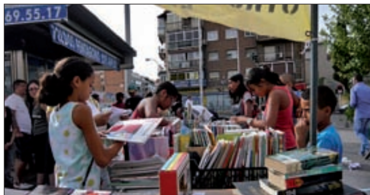
Un momento de la iniciativa del pasado año

Cualquier familia podrá aportar el material escolar que ya no utilice y escoger el que necesite para el curso 2015-2016. Como en ediciones anteriores, este colecti-