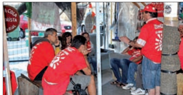
Los trabajadores han vuelto tras una lucha de 20 meses

El alcalde de Fuenlabrada, Manuel Robles (PSOE), acudió a las puertas de la factoría para escenificar su apoyo a los empleados. Mientras, en el campamento de la 'esperanza' habilitado a varios metros, en otra de las puertas de acceso a la empresa, el resto de compañeros se mostraban satisfechos con las incorporaciones.