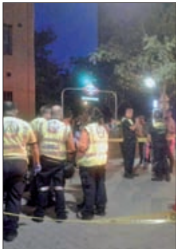
Un momento del suceso

Los afectados presentaban todos picor de ojos, escozor en la piel e irritación en la garganta. Los sanitarios consiguieron aplacar el malestar general de los heridos producido por el producto químico distribuyendo 'diphotere' y suero. No obstante, una mujer fue trasladada al Hospital 12 de Octubre al no remitir la irritación de garganta.