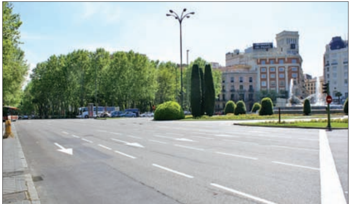
Los coches no podrán circular entre Cibeles y Atocha en las mañanas de las jornadas dominicales

Por otro lado, el Ayuntamiento planea reducir la velocidad media del tráfico en la capital, que es muy superior al de otras ciudades. Las soluciones podrían pasar