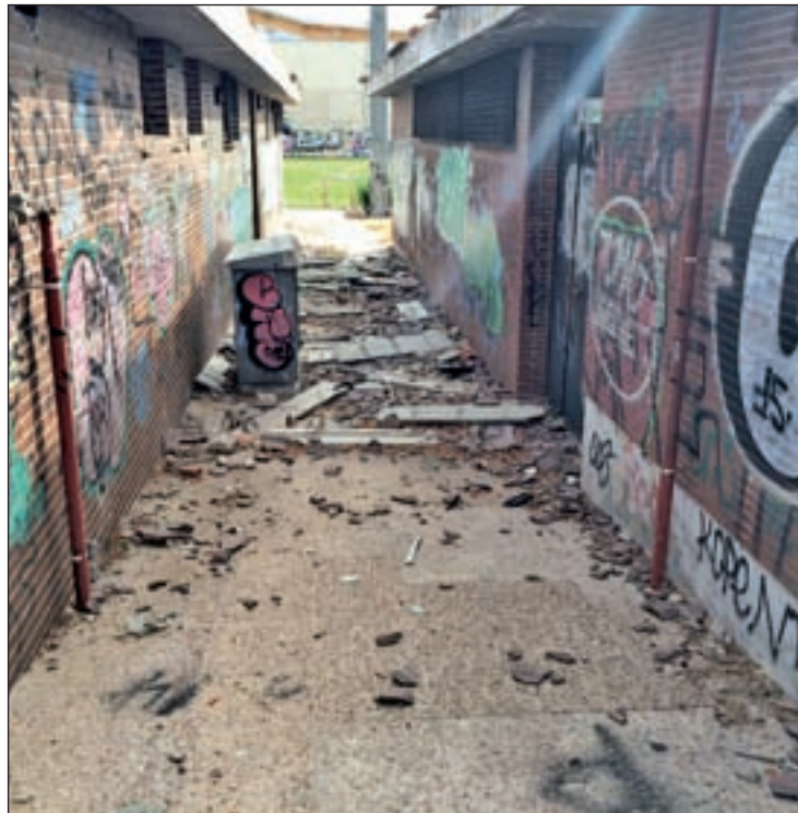
Estado actual de los vestuarios del campo de fútbol

Al respecto, inciden en que se han encontrado con esta situación y que su voluntad es resolverla "de manera prioritaria, poniendo por fin a disposición de la ciudadanía un equipamiento adecuado tanto para los atletas federados como para el desarrollo