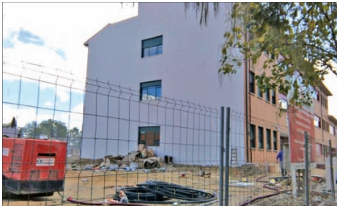
El nuevo equipamiento educativo situado en la calle de Estefanita AVIB

Una aseveración que cuestionan algunos progenitores que aseguran que, ni siquiera, les han dejado entrar en las nuevas instalaciones por órdenes de la propia consejería. "No hemos podido pasar de la puerta. Un padre intentó entrar el lunes, y la dirección se lo impidió alegando falta de permisos. Ante esto, nos tenemos que fiar de lo que nos dicen sobre el estado del instituto", explica la madre de un alumno de Segundo de la ESO. Al respecto, la Administración regional replica