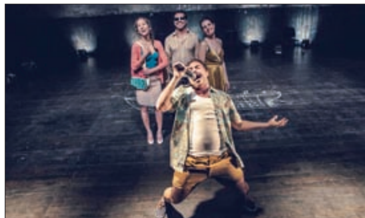
Puesta en escena de 'Delirare'