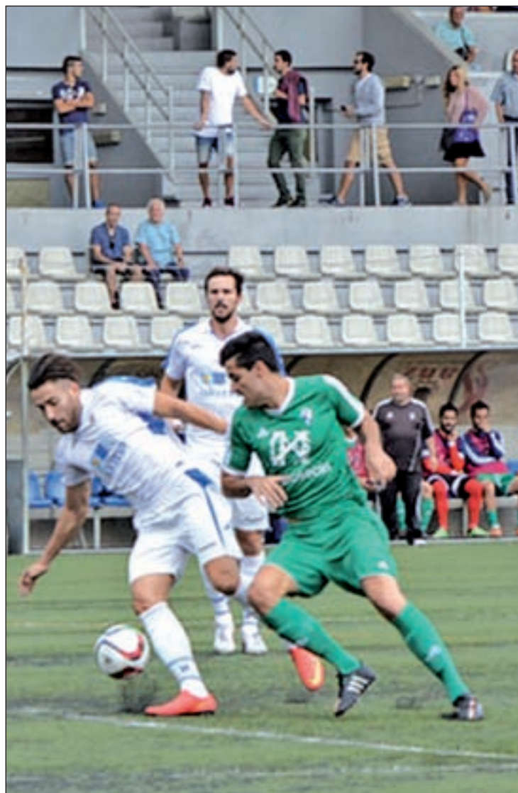
El Puerta Bonita busca su primer triunfo de la temporada

Para acabar de completar este intenso menú futbolístico, otro de los candidatos a subir a Tercera dentro del grupo II de Preferente, el CD Los Yébenes-San Bruno recibirá a un equipo cuyo objetivo es bien distinto. Tras su histórico ascenso, el CD Latina se fija como meta la permanencia, pero el triunfo por 2-1 ante el Real Aranjuez, manda un mensaje claro a navegantes: no será fácil derrotar a los hombres de 'Kuko' Álvarez.