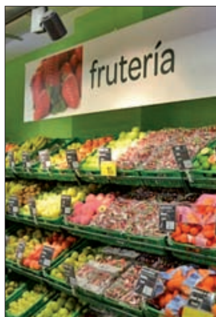
Carrefour supervisa el proceso

La franquicia también se presenta como una opción para aquellos que buscan sacar mayor rentabilidad a su negocio. En este aspecto, Carrefour ofrece a los propietarios