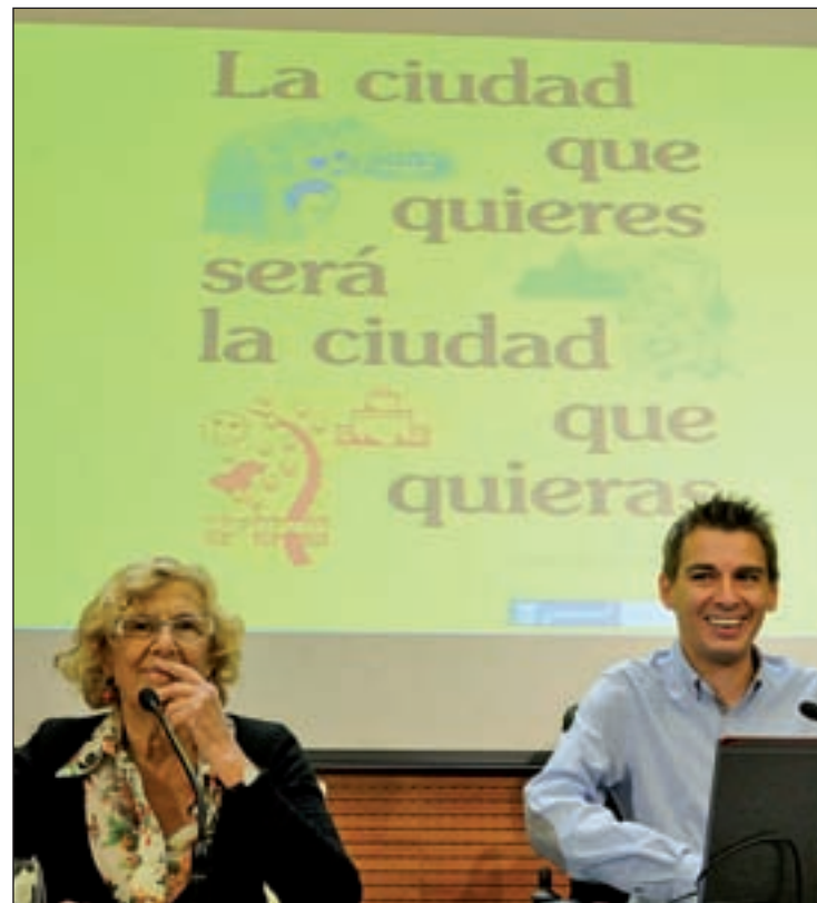
La web de Gobierno Abierto es Decide.madrid.es GENTE

Sobre este último punto, Soto matizó que "este mecanismo no cambia el marco jurídico en el que se maneja el Consistorio. Cambia quien toma las decisiones, pero hay ciertos límites". En