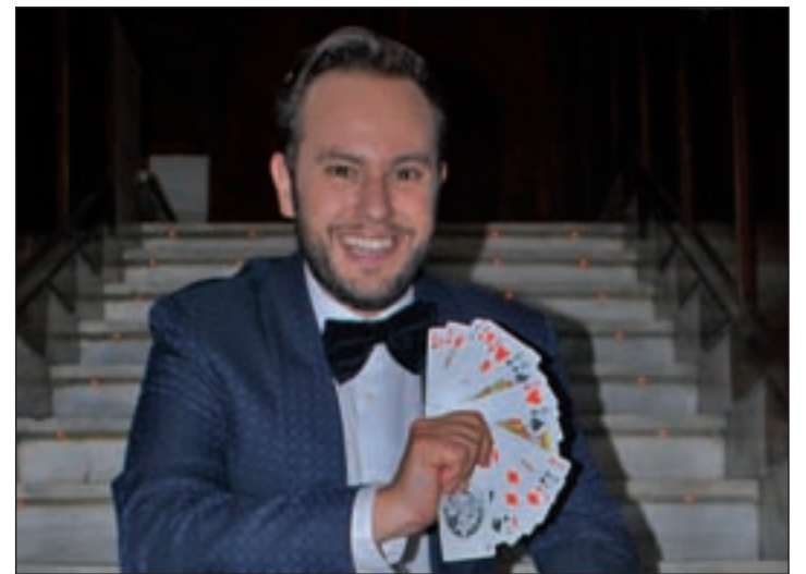
JORGE BLASS Mago

Dónde: Teatro Español · Cuándo: Del 1 de octubre al 29 de noviembre