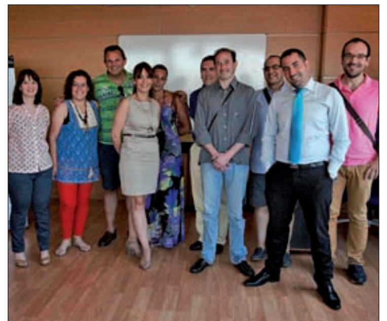
Una de las jornadas de formación de RH Properties

Arrentum, Best House, Comprarcasa, Donpiso, Engel&Völkers... Las opciones en este ámbito son variadas, al igual que las inversiones totales necesarias, que oscilan entre los 30.000 y los 150.000 euros con o sin cánones de apertura