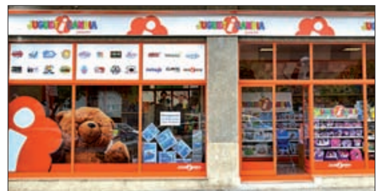
Juguetería tiene 30 años de experiencia en el sector

soramiento para el montaje de la tienda y la formación a los trabajadores. Para poder abrir una franquicia es necesario un local de más de 100-150 m 2 en una buena zona comercial y que la ciudad disponga de al menos 25.000 habitantes. Más información en Jugueteria.com .