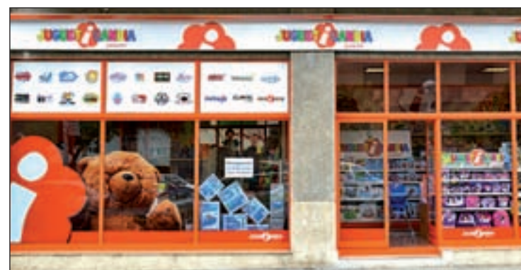
Juguetería tiene 30 años de experiencia en el sector

soramiento para el montaje de la tienda y la formación a los trabajadores. Para poder abrir una franquicia es necesario un local de más de 100-150 m 2 en una buena zona comercial y que la ciudad disponga de al menos 25.000 habitantes. Más información en Jugueteria.com .