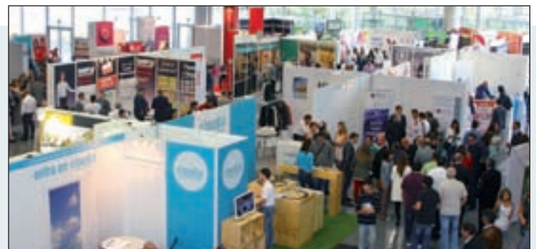
FRANKINORTE BILBAO: La capital vasca acogerá el 25 y 26 de septiembre Franquinorte, que incluye un amplio abanico de ofertas comerciales de firmas nacionales e internacionales, y de diferentes sectores.