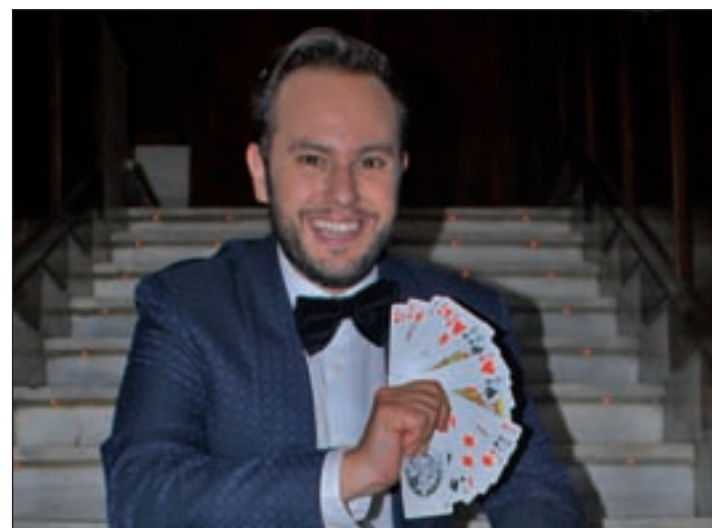
JORGE BLASS Mago

Dónde: Teatro Español · Cuándo: Del 1 de octubre al 29 de noviembre