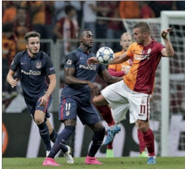
Los rojiblancos despejaron las dudas en Estambul

Por su parte, el Atlético de Madrid ha optado por la fórmula de años atrás: férrea defensa y un extenso catálogo a balón parado. Nada nuevo bajo el sol del Manzanares que el martes (20 horas) recibirá la visita de un necesitado Getafe, aunque antes, los rojiblancos deberán visitar al Eibar (sábado, 20:30 horas) cuatro días después de su trabajado triunfo en el campo del Galatasaray.