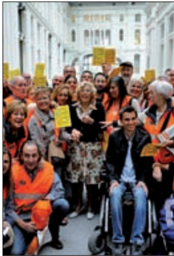
Carmena y Pablo Soto

El 15 de septiembre se celebró el Día Internacional de la Democracia, una fecha ideal para que el Ayuntamiento de Madrid presentara una de sus medidas estrella en lo que a la participación ciudadana se refiere, junto al incremento de la importancia de la figura del vocal vecino en las Juntas Municipales, una figura cuyo futuro ya se está gestando con la recogida de candidaturas. Bajo el lema 'La ciudad que quieres será la ciudad que quieras', la alcaldesa de la capital, Manuela Carmena, y el delegado del Área de Gobierno de Participación Ciudadana, Transparencia y Gobierno Abierto, Pablo Soto, abrieron el pasado martes el mecanismo de presen-