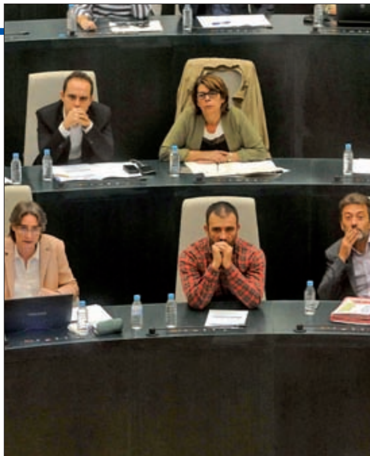
Parte del equipo de Gobierno, durante un Pleno

han topado con un problema común: las condiciones legales de algunos contratos con empresas externas, como las que gestionan limpieza y jardinería. La delega-