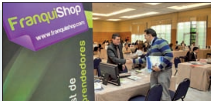
FRANQUISHOP MADRID: Un centenar de empresas se reunirán en Madrid el 23 de septiembre en una feria diseñada para facilitar el contacto directo entre los asistentes y cadenas con reuniones de treinta minutos fijadas previamente.

Personas interesadas en abrir un negocio pueden aprovechar las dos próximas citas del calendario de las franquicias: Franquishop, con su original formato de encuentros cortos, y Frankinorte, con una amplia oferta empresarial en el País Vasco.