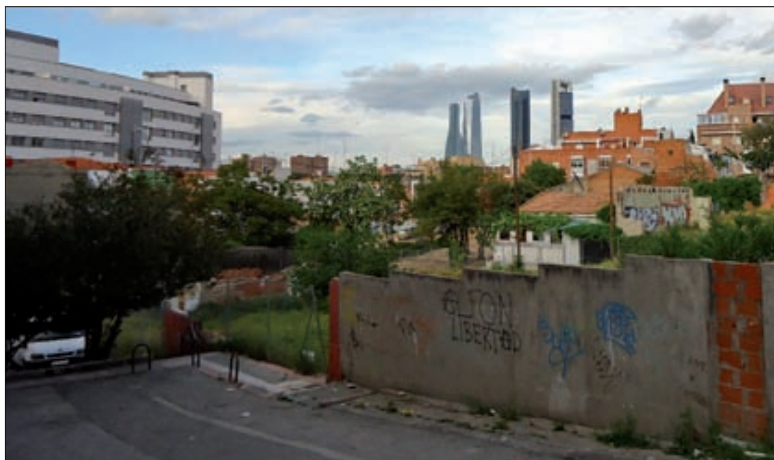
La zona sigue en obras

Desde este colectivo aseguran que Galcerán “hizo una exposición muy valiente de su opinión sobre lo que ha pasado en el Pa-