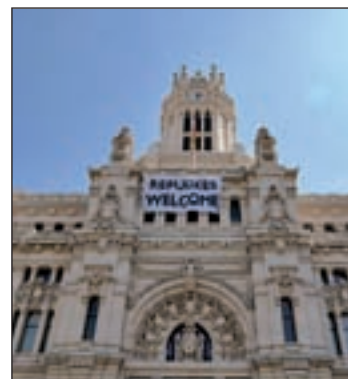
El Consistorio realiza un censo

Por otra parte, el Ayuntamiento anunció el pasado martes su intención de crear una unidad policial contra los delitos de odio formada por profesionales de segunda actividad con experiencia