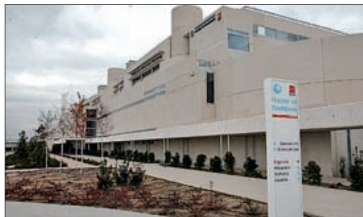
Hospital de Fuenlabrada

El hombre no presentaba signos evidentes de violencia, según han detallado fuentes del personal sanitario, pero habrá que esperar a los resultados de la autopsia, que al cierre de esta edición todavía no se había realizado, para saber