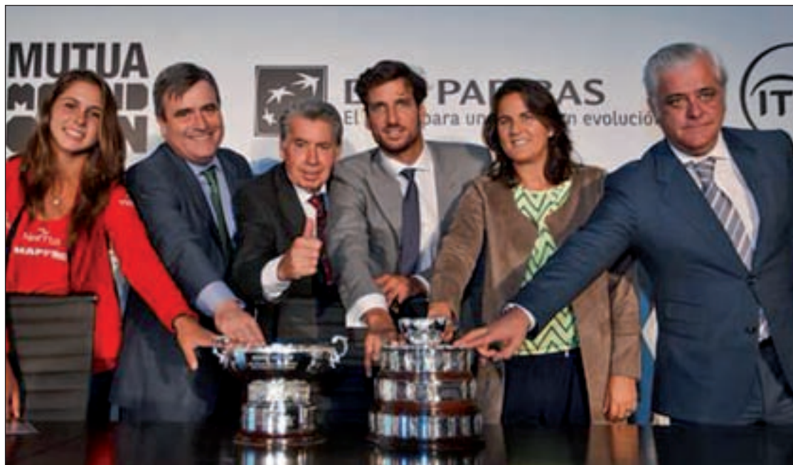
El acto de presentación contó con la presencia de Manolo Santana, Miguel Cardenal y Feliciano López

Será la primera vez que Madrid albergue este evento deporti-