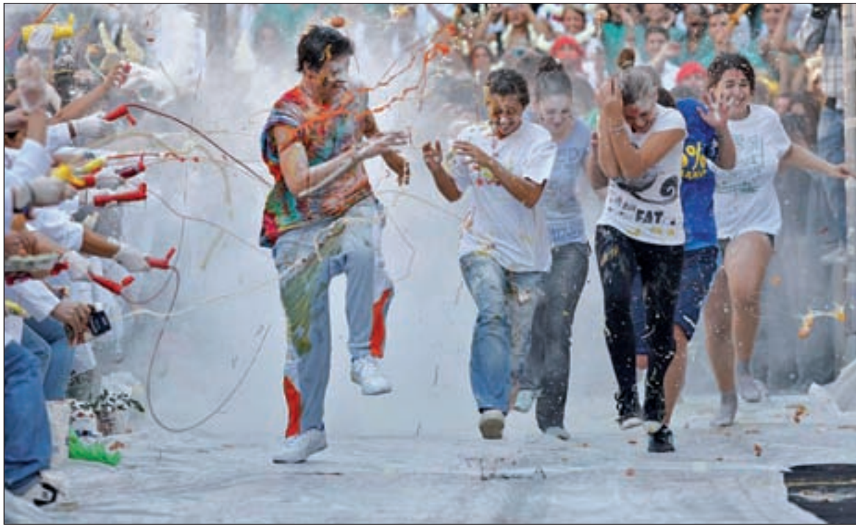
Estudiantes de primer año recibidos a huevos por los veteranos