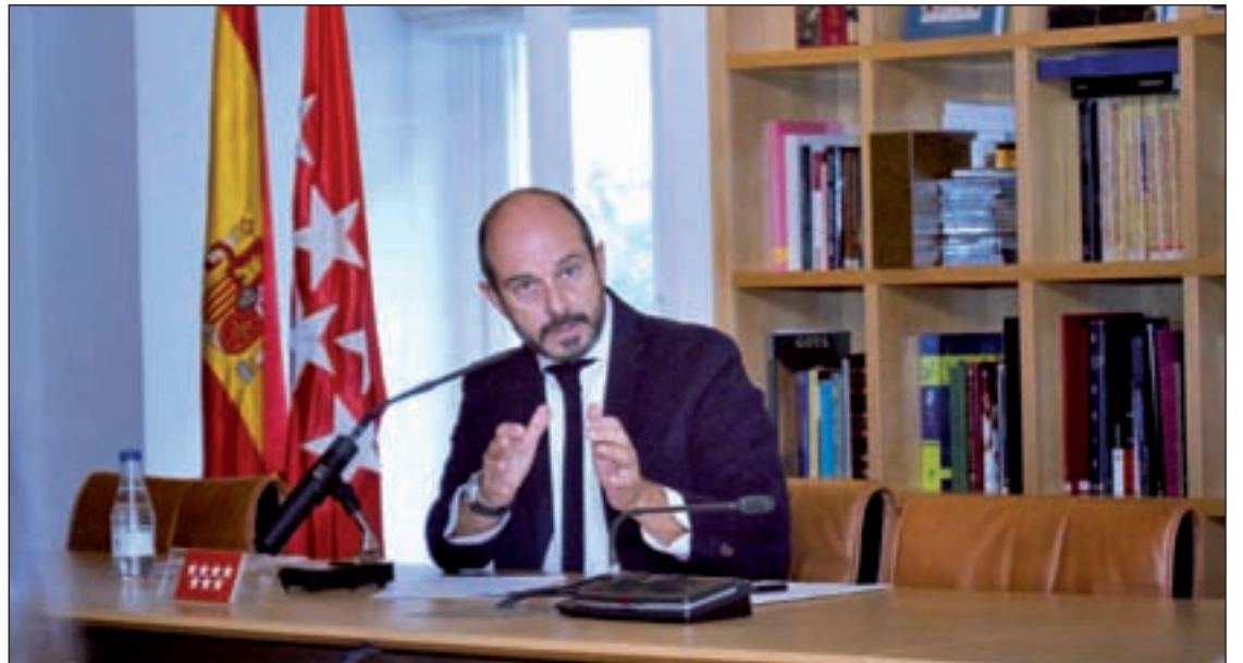
Pedro Rollán, consejero de Transportes, durante un encuentro con los medios de comunicación

En total, se beneficiarán más de 550.000 usuarios de la región de esta tarifa plana, recogida en el