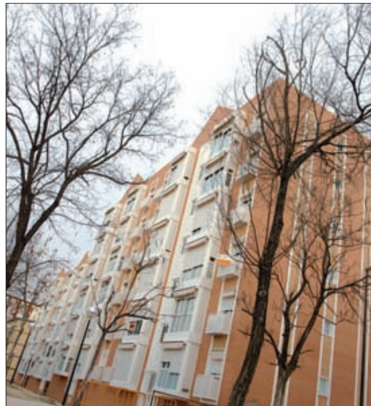
El Consistorio ya trabaja en ayudas para las familias desfavorecidas

En esta línea, el área se dirigirá al Ministerio de Economía y Administraciones Públicas para ins-