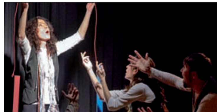
Imagen de años anteriores

El jurado tendrá la difícil tarea de elegir a los ganadores, entre las obras que han sido seleccionadas, para esta fase final. El nombre del ganador se conocerá el 12 de diciembre.