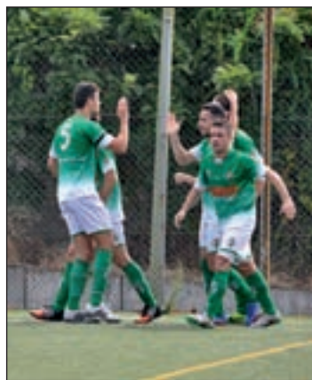
Buen inicio de la AD Esperanza