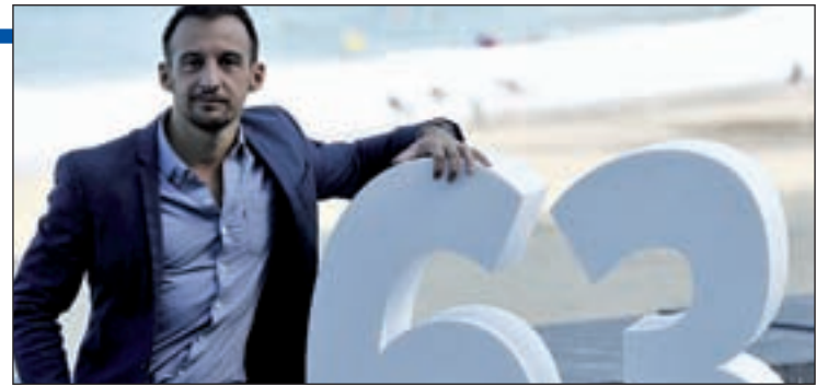
El director Alejandro Amenábar

tián ha sido el lugar elegido para la presentación de 'Regresión', un film de terror con las actrices Ethan Hawke y Emma Watson como protagonistas.