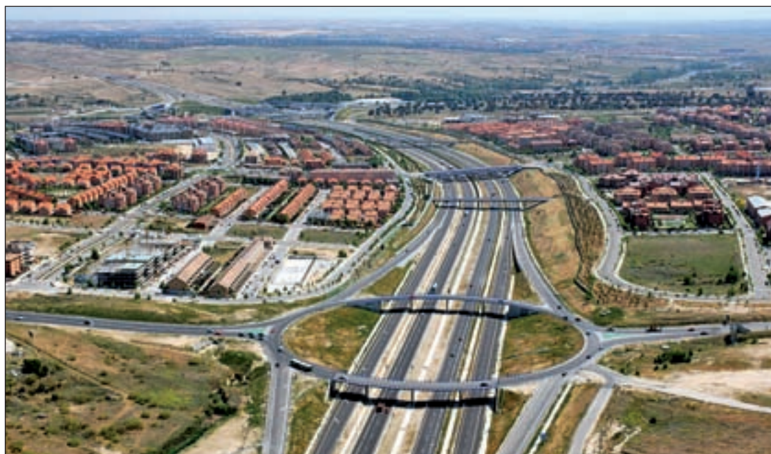
La M-50 a su paso por Boadilla del Monte