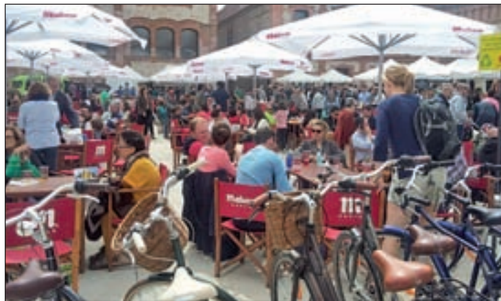
La pasada edición de Madrid Productores

El último fin de semana del mes ha llegado y, con él, la segunda edición de la Feria de la Tapa de Madrid Productores, un evento único donde el visitante disfruta, con toda la familia, de una experiencia diferente y agradable, a la vez que aprende sobre consumo y hábitos saludables. Todo en un mismo espacio y con el valor añadido de ser productos locales de la Comunidad de Madrid. En esta edición participarán una treintena de tapas con el ingrediente estrella del productor en cuestión,