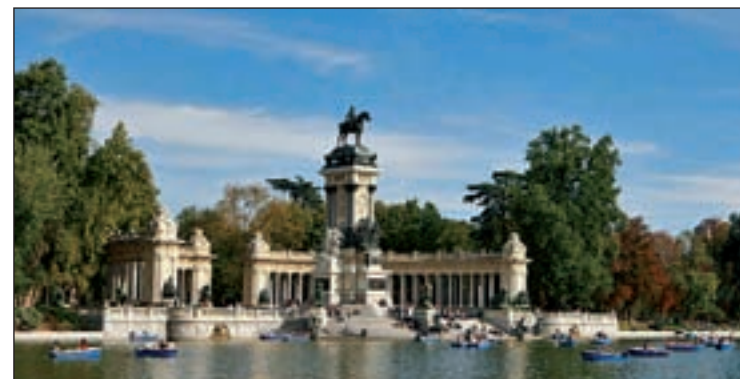
El ocio y vacaciones son los motivos escogidos para viajar a Madrid

Este aumento se refleja también en el acumulado anual. Así de enero a agosto Madrid recibió un 11,20% más de visitantes.