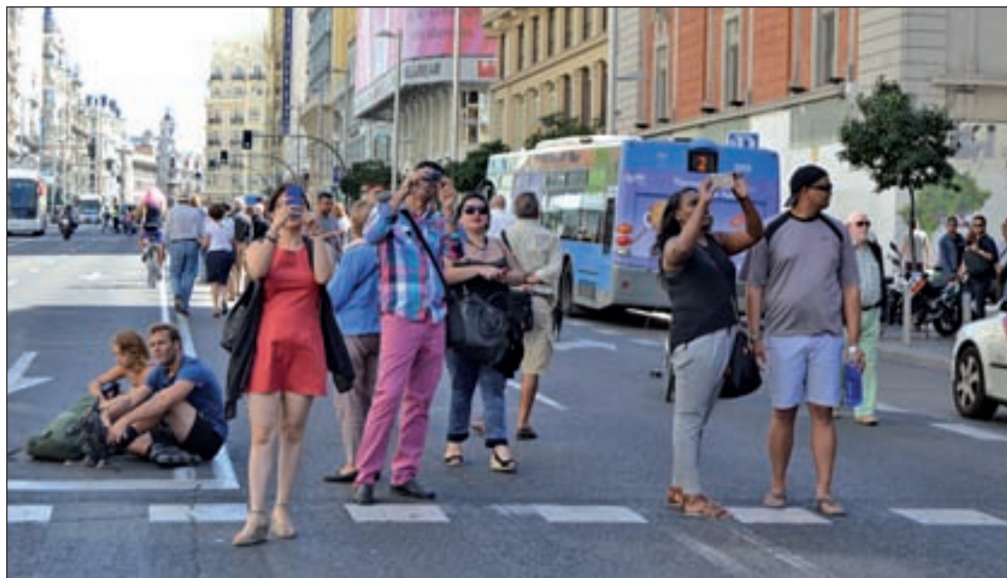
Coches y curiosos durante el corte el pasado martes

Para "próximas fechas" está también prevista su llegada a Zamora, Burgos, Murcia, Granada y Castellón.