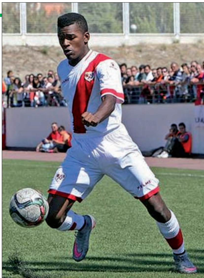
El Rayo B se impuso con mucho sufrimiento al Alcalá