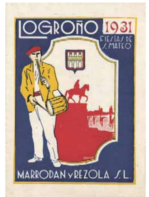
Programa de fiestas de 1931.

rándose en abril de 2002 totalmente terminada. Sin duda alguna habrá habido a lo largo de todos estos siglos otras actividades imposibles de reseñar en este corto espacio periodístico. Pero eso, les invito a volver a gritar: ¡Viva San Mateo!