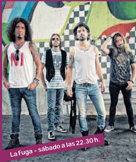
La Fuga - sábado a las 22.30 h.