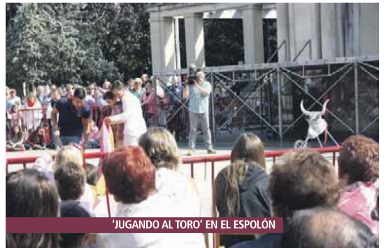
'JUGANDO AL TORO' EN EL ESPOLÓN