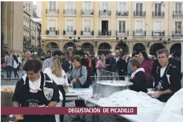
DEGUSTACIÓN DE PICADILLO