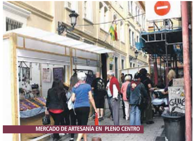
MERCADO DE ARTESANÍA EN PLENO CENTRO

El martes, en el Espolón se repitió la iniciativa 'Jugando al toro', que este año contó como maestro con el torero riojano Diego Urdiales, que enseñó las suertes del toro a los niños en un acto que fue seguido por unas 500 personas. Ya por la tarde, las marionetas de Maese Villarejo congregaron a unas 1.800 personas en el CDM Las Norias, mientras unas 700 presenciaron el espectáculo teatral 'Globe Story' en la Plaza de San Bartolomé.