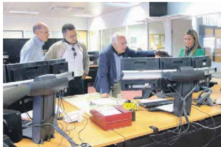
Visita del presidente de La Rioja a los trabajadores del SOS Rioja.

Marcando el número de teléfono 112 los ciudadanos pueden requerir, en los casos de urgente necesidad, la asistencia de los servicios públicos