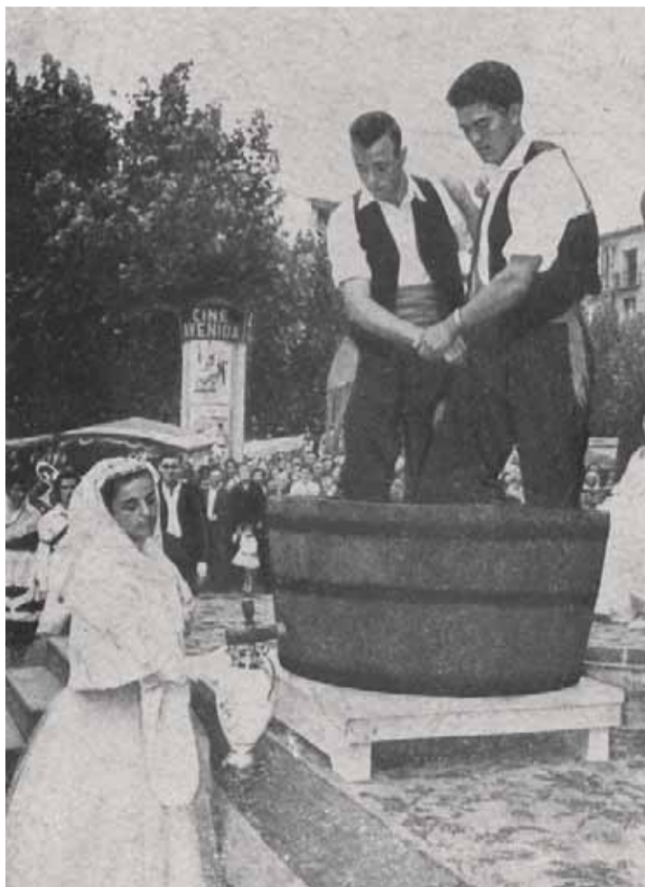
Pisada de la uva en 1958.

forasteros que allí "hallábanse congregados". Un hito importante en las fiestas mateas es la inauguración de la nueva plaza de toros de La Manzana en 1915. En los años cuarenta se organizan dos Ferias de Muestras coincidiendo con las fiestas mateas, las cuales se instalan en el Instituto de Enseñanza Media. En el año 1957 se organizan las primeras Fiestas de la Vendimia, para promocionar el vino riojano y sus cualidades. Aquel año las autoridades locales y provinciales se vuelcan en la celebración de las fiestas. Se organiza un gran desfile de carrozas con la participación de todas las cabeceras de comarcas así como de entidades oficiales y particulares. También se celebra el primer pisado de la uva en el paseo del Espolón, recogiendo el primer mosto, que se reserva para ofrecérselo a la Virgen de Valvanera, junto con otros frutos el "Día de la Provincia" que tuvo lugar en la concatedral de La Redonda. La Virgen de Valvanera había sido entronizada patrona de La Rioja en 1954 coincidiendo con la visita a nuestra ciudad del general Franco. En 1959 se celebra la I Feria del Vino