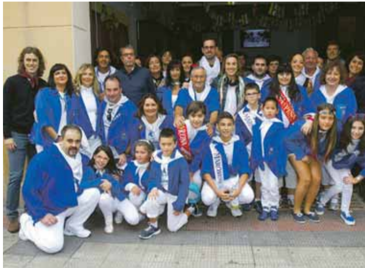
Las fiestas de San Mateo han hecho que las distintas formaciones políticas del Ayuntamiento aparquen sus discrepancias por unos días.

El sábado 26 de septiembre, la Cocina Económica ofrece un desayuno solidario de 9.30 a 11 horas. En la plaza del Mercado, dentro de la Semana Gastronómica, la Federación de Peñas ofrecerá una degustación de salchichón.