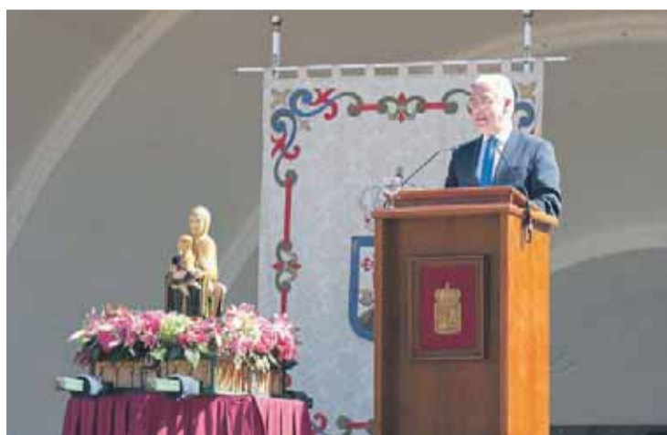
El presidente de La Rioja, José Ignacio Ceniceros, en su discurso.