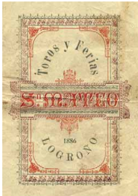
Programa de fiestas de 1886.