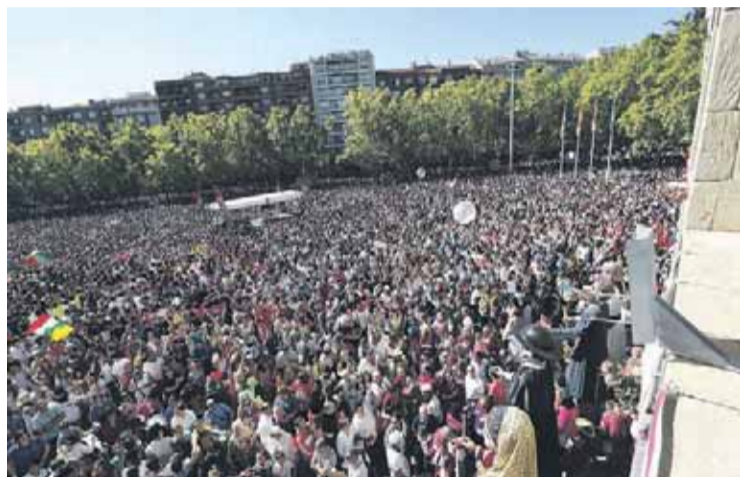
La plaza del Ayuntamiento congregó a unas 60.000 personas.

Globos, banderas de La Rioja, buen ambiente y mucha diversión inundaron la plaza del Ayuntamiento y alrededores donde, gracias al cohete limpio, se congregaron unas 60.000 personas de todas las edades