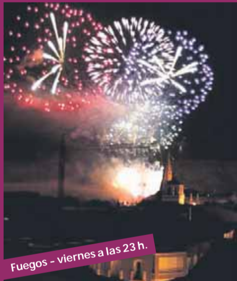
Fuegos - viernes a las 23 h.