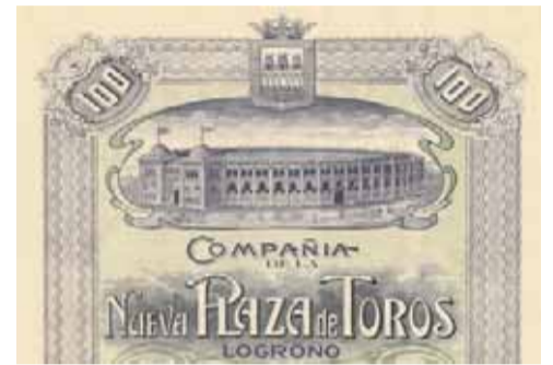
Acción plaza de toros de 1915.