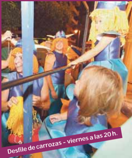
Desfile de carrozas - viernes a las 20 h.

LA QUEMA DE LA CUBA PONDRÁ EL BROCHE FINAL A LAS FIESTAS EL SÁBADO A LAS 22 HORAS EN LA PLAZA DEL AYUNTAMIENTO