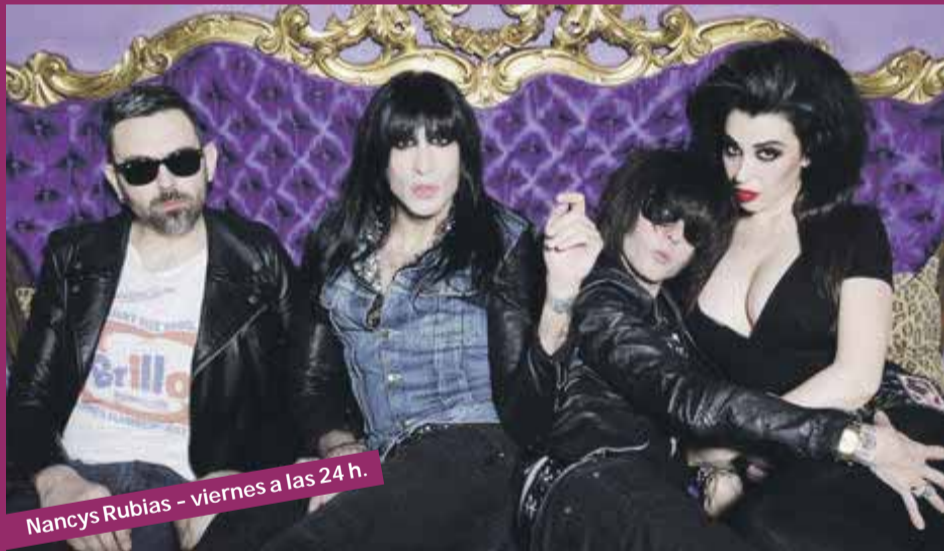
Nancys Rubias - viernes a las 24 h.

Aún quedan dos días para quemar el último cartucho