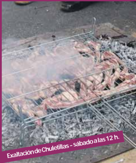
Exaltación de Chuletilas - sábado a las 12 h.