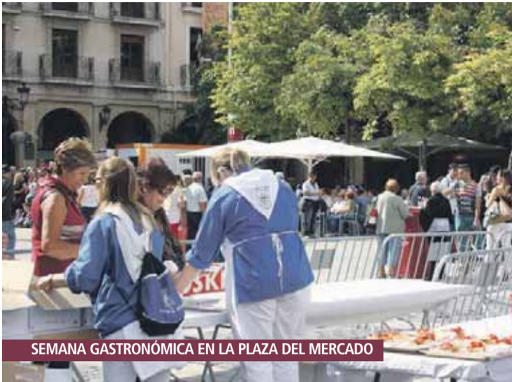
SEMANA GASTRONÓMICA EN LA PLAZA DEL MERCADO