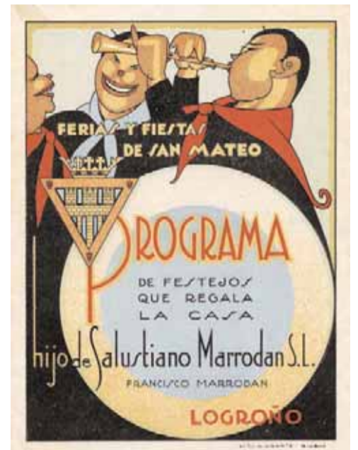
Programa de fiestas de 1930.

forasteros que allí "hallábanse congregados". Un hito importante en las fiestas mateas es la inauguración de la nueva plaza de toros de La Manzana en 1915. En los años cuarenta se organizan dos Ferias de Muestras coincidiendo con las fiestas mateas, las cuales se instalan en el Instituto de Enseñanza Media. En el año 1957 se organizan las primeras Fiestas de la Vendimia, para promocionar el vino riojano y sus cualidades. Aquel año las autoridades locales y provinciales se vuelcan en la celebración de las fiestas. Se organiza un gran desfile de carrozas con la participación de todas las cabeceras de comarcas así como de entidades oficiales y particulares. También se celebra el primer pisado de la uva en el paseo del Espolón, recogiendo el primer mosto, que se reserva para ofrecérselo a la Virgen de Valvanera, junto con otros frutos el "Día de la Provincia" que tuvo lugar en la concatedral de La Redonda. La Virgen de Valvanera había sido entronizada patrona de La Rioja en 1954 coincidiendo con la visita a nuestra ciudad del general Franco. En 1959 se celebra la I Feria del Vino