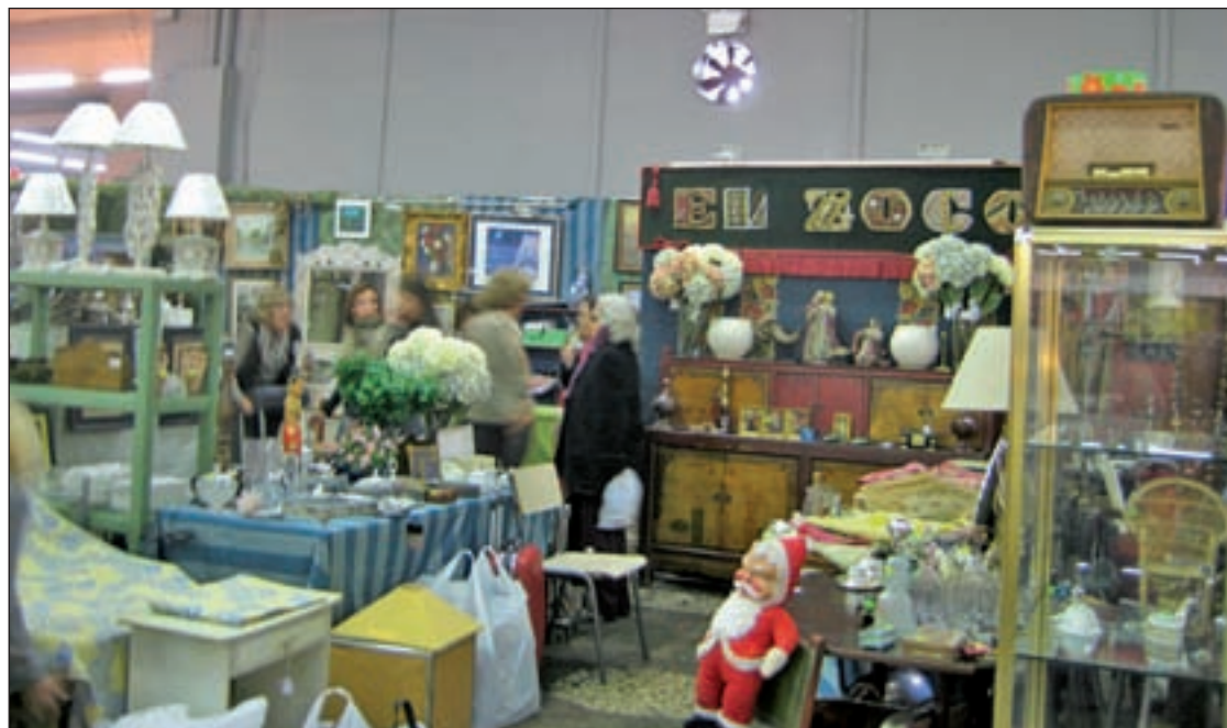
Los puestos permanecerán abiertos hasta el domingo 29 de noviembre

Nadie quiere perderse esta cita anual y hasta allí se acercan numerosos rostros conocidos. La sorpresa de este año la ha dado el Rey Don Juan Carlos, que ha visi-