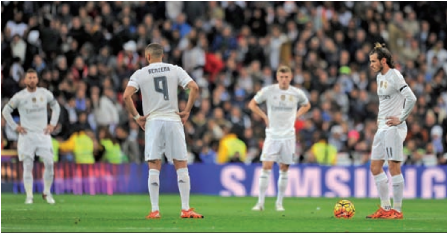
Los jugadores blancos, tras uno de los cuatro goles encajados el pasado sábado