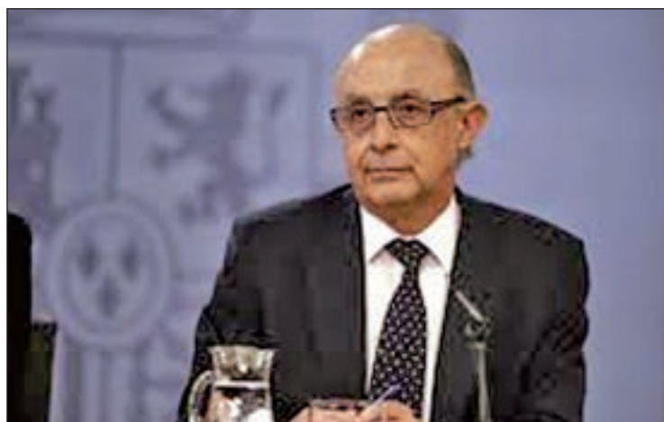
El ministro de Hacienda, Cristóbal Montoro

LA CANTIDAD NO HABRÍA SIDO CONTABILIZADA