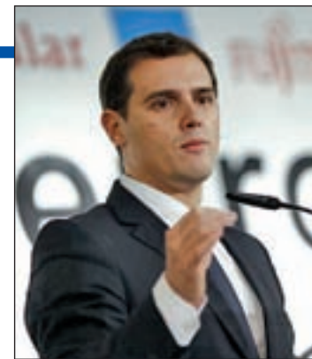
El líder de C's, Albert Rivera

ría a reducir la discriminación de la mujer en el mercado laboral y se facilitaría una mejor conciliación laboral" gracias al aumento de la duración de la baja total.