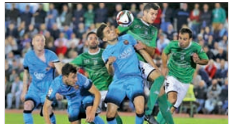
El Villanovense firmó un meritorio 0-0 ante el Barcelona

diz, que recibirá en la noche del miércoles al Real Madrid. Un día antes, el martes, el Atlético de Madrid rendirá visita al Reus Deportivo, mientras que uno de los reyes de la Copa, el Athletic, jugará en el campo de la Balompédica Linense. El otro superviviente de Segunda División B, el Barakaldo, recibirá al Valencia.