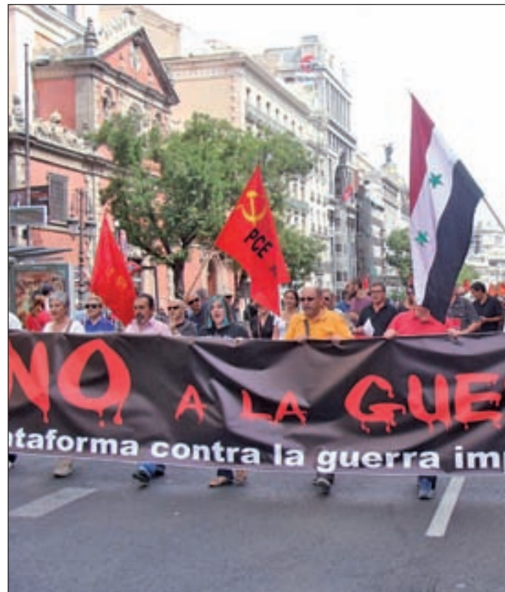
Algunos de los firmantes

En el texto, redactado por el escritor Isaac Rosa, se muestra la repulsa “a los ataques terroristas de París y Líbano, a los bombardeos contra la población civil siria, a recortes democráticos como inefi-