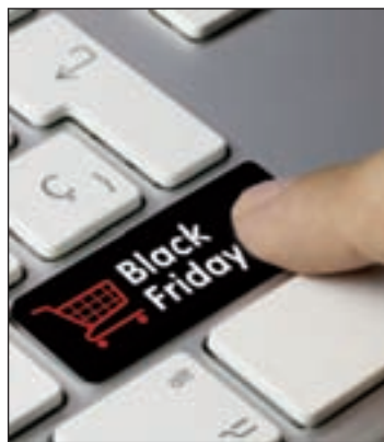
Los hombres prefieren la red

El comercio electrónico está de enhorabuena en España. El 'Viernes Negro' y el posterior 'Cyber Monday' generarán un volumen de ventas superior a los 1.172 millones de euros, tal y como ha señalado un estudio realizado por la Asociación Española de la Economía Digital. Esta suma supone un 10,6% más que en 2014. El análisis arroja, además, que el 69% de los 'e-commerce' encuestados va a llevar a cabo campañas especiales.