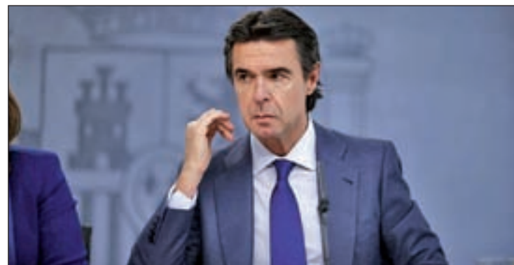
El ministro de Industria, José Manuel Soria

Este sistema de incentivos, indicó Soria, se tuvo que modificar porque resultaba "inviabile" y podía conducir "a la quiebra" del sistema energético en España, dando como resultado que se haya pasado de unos 400 millones anuales de déficit a tener superávit en 2014 y 2015.