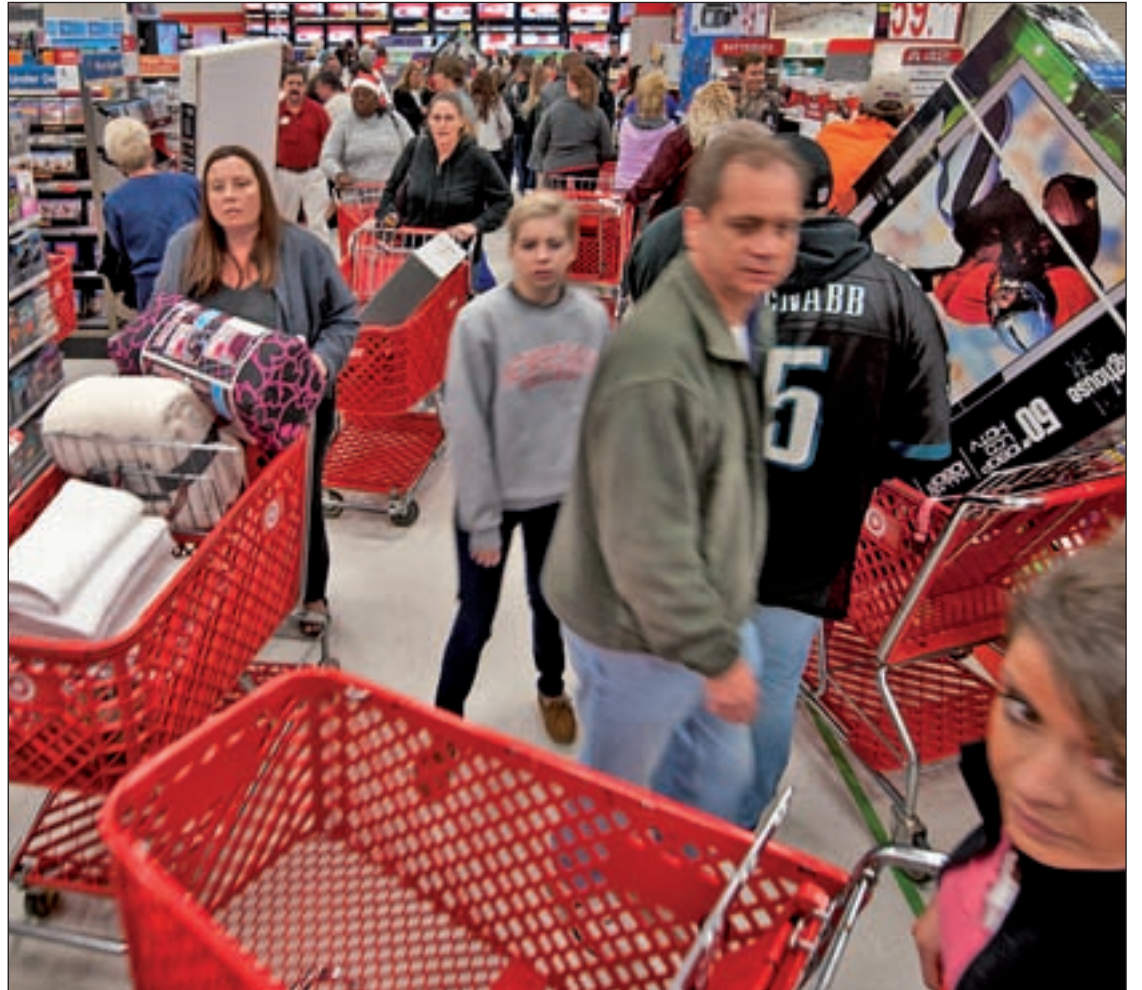
La liberalización del periodo de rebajas ha permitido su implantación en España

La CEC considera que el efecto 'Black Friday' responde a dos cuestiones: por un lado, la prueba de los beneficios de no disponer de periodos de rebajas acotados y definidos, pero también es fruto del nuevo consumidor mucho más escéptico, que rehúye la compra impulsiva y valora más la relación calidad-precio, medita sus compras y compra de forma más frecuente pero menos.