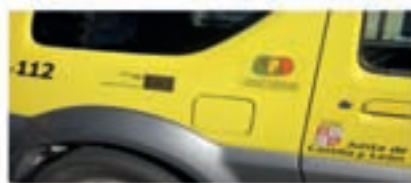
Vehículos de intervención en emergencias