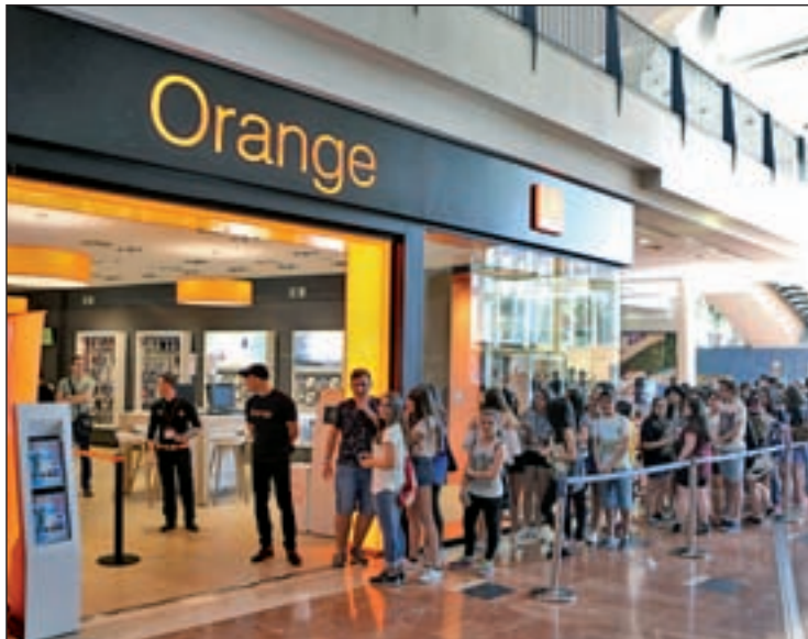
Para adelantar los regalos navideños ve a una tienda Orange