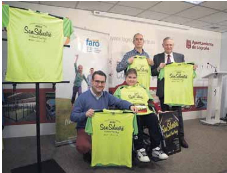
Presentación de la carrera en rueda de prensa.

Las inscripciones pueden realizarse exclusivamente de manera presencial hasta el 30 de di-