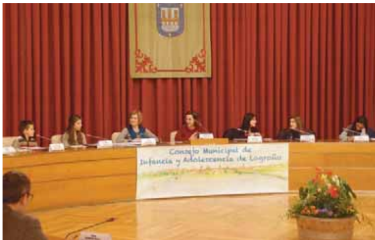
Segunda reunión del Consejo Municipal de Infancia y Adolescencia.