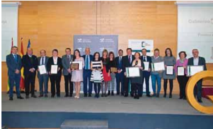
Foto de familia con los premiados.