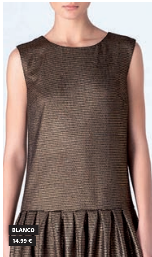
BLANCO 14,99 €