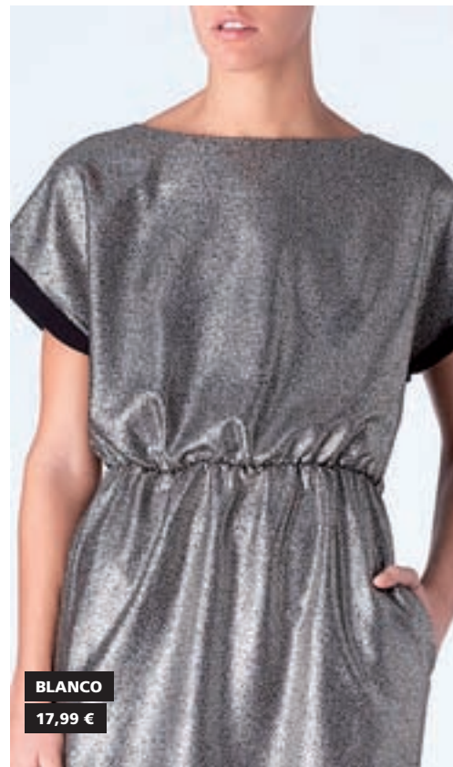
BLANCO 17,99 €