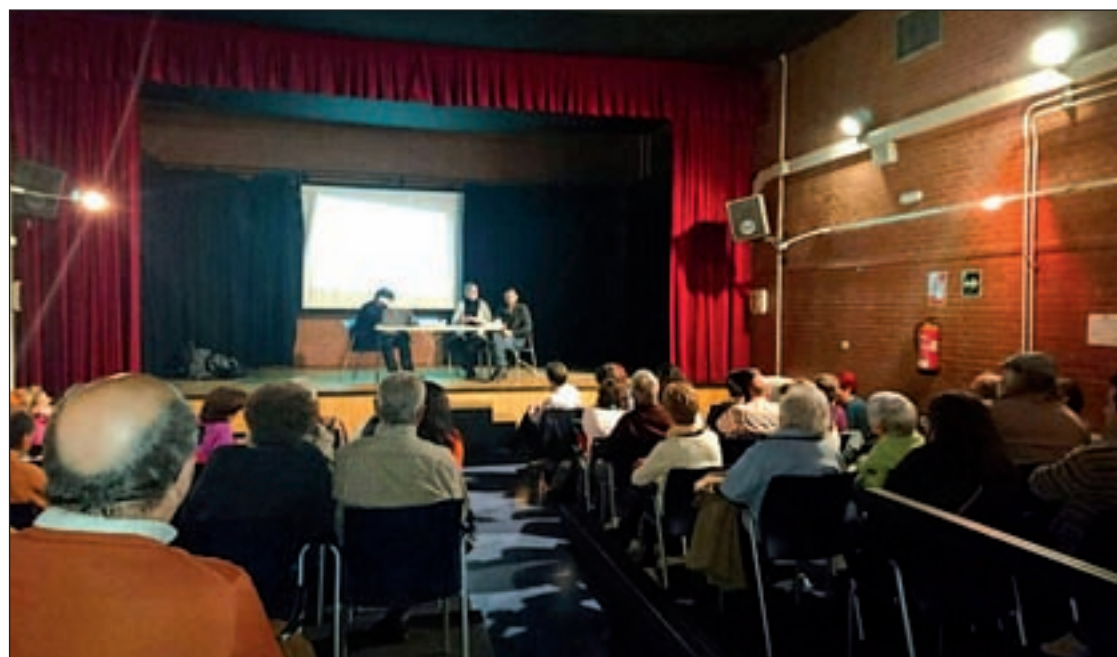
Un momento del encuentro ciudadano celebrado en el centro cultural de Oporto

Los vecinos de Opañel llevan concentrándose a las puertas de la parroquia todos los domingos desde abril de 2014 para reivindicar el uso público de los terrenos.