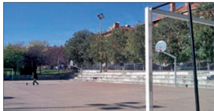
Estado actual de las instalaciones deportivas

Este colectivo incide en que a partir de ahora hay que cuidarlas y en su uso respetar el descanso de los vecinos en aras de la convivencia en la zona.