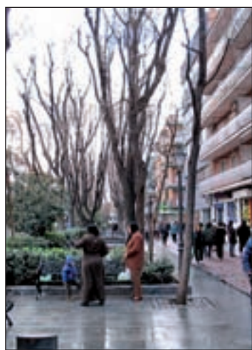
El paseo principal de la zona