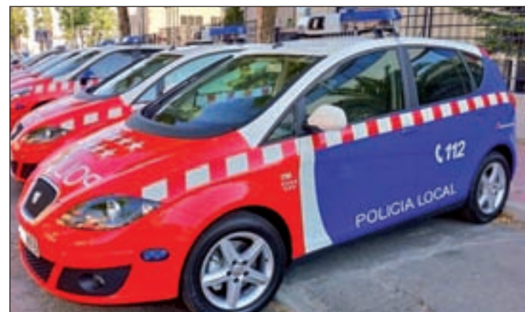
Aumentará el presupuesto destinado a las Bescam

Esta partida incluye una dotación de 17,5 millones de euros adicionales para la Empresa Municipal de Transportes (EMT) de cara al año que viene, cantidad que se ha aumentado tres un acuerdo de los grupos parlamentarios de PSOE, Podemos y Ciudadanos en la Asamblea. Además, la Comunidad de Madrid destinará cinco millones de euros más a financiar las Brigadas Especiales