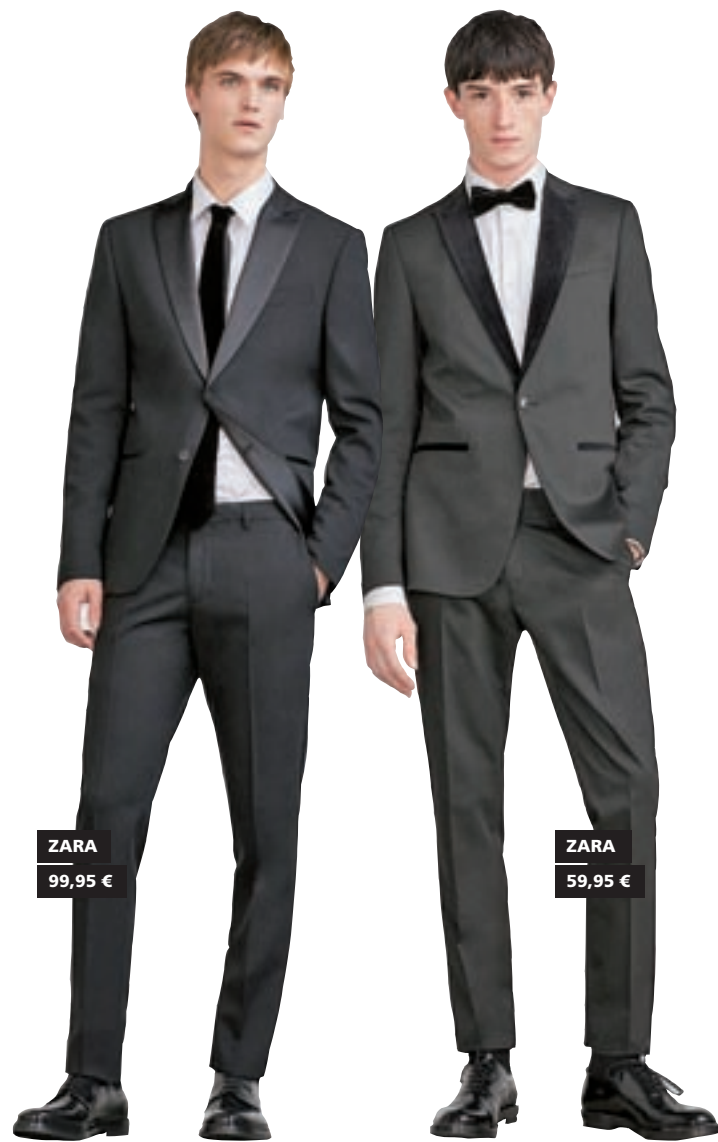
ZARA 99,95 €

Los 'looks' de Nochevieja para los chicos pueden parecer a primera vista más sencillos, pero si lo que buscas es diferenciarte del resto y aportar un punto de modernidad no es tan fácil. Ciertamente es que el traje se convierte en la prenda ideal para tomar las uvas y salir de fiesta con los amigos. Sin embargo para ir a la moda lo mejor es combinarlo con una pajarita. Si prefieres corbata, una que sea de pala estrecha porque es más juvenil y acentúa la figura. En cuanto a los colores del traje, el gris marenco y el negro serán los reyes.