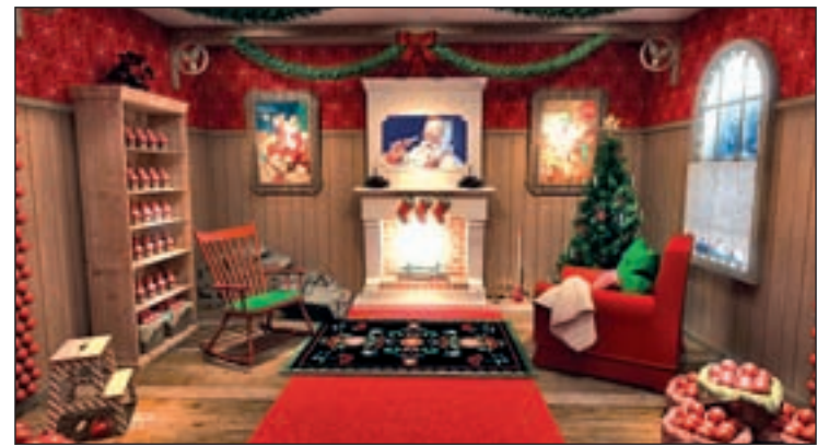
Casa de Papá Noel

que a la gran pantalla llegan películas como 'El viaje de Arlo', 'Go-co, el pequeño Dragón' o la segunda parte del film 'Hotel Transilvania'.