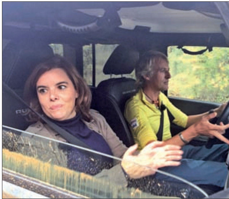
Pedro Sánchez, en 'En tu casa o en la mía', y Soraya Sáenz de Santamaría, en 'Planeta Calleja'