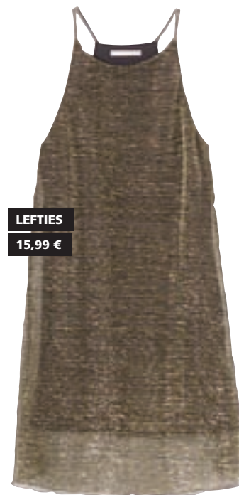
LEFTIES 15,99 €