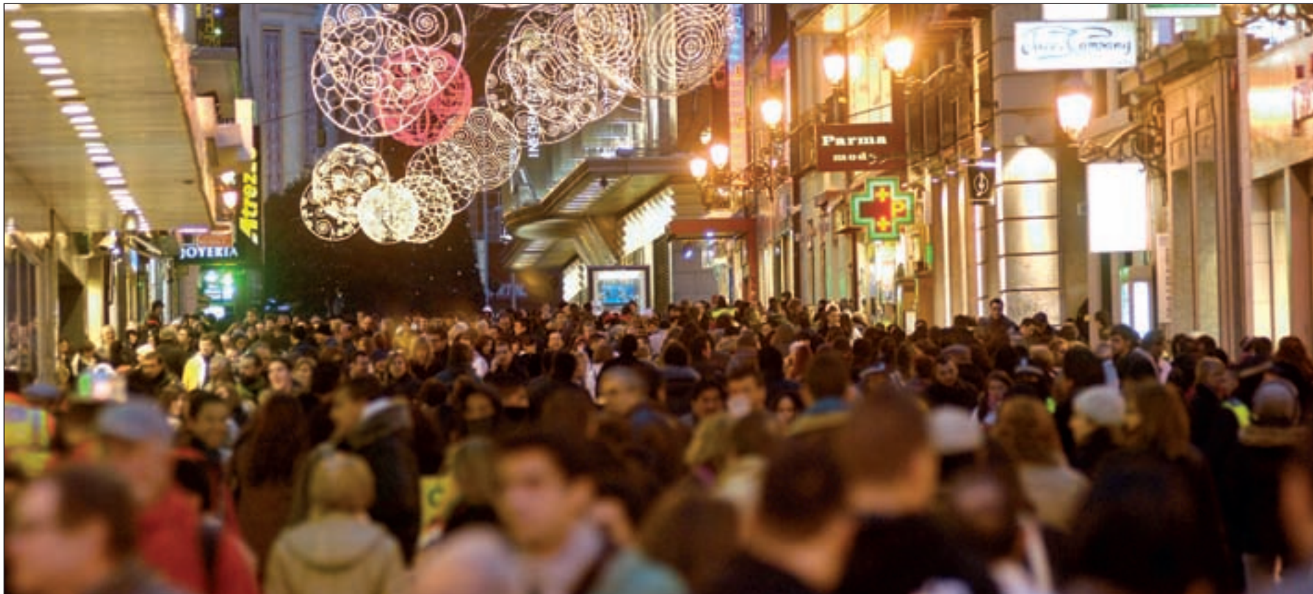
Imagen de la calle Preciados durante las navidades

¿Tinto, blanco o rosado? Te damos las claves para que acompañes tus celebraciones con el mejor caldo