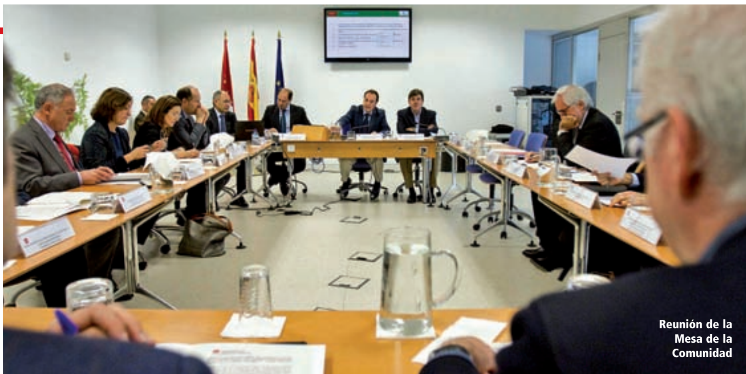
Reunión de la Mesa de la Comunidad

El nuevo protocolo mejorará la definición de vehículo comercial o industrial; flexibilizará la desactivación de las medidas; incluirá la toma de medidas excepcionales en caso de reiteración de superaciones o por razones de seguridad o acontecimientos especiales; reforzará el carácter preventivo fundamental adelantando los plazos de preaviso y aviso y al cabo de un año será evaluado y,