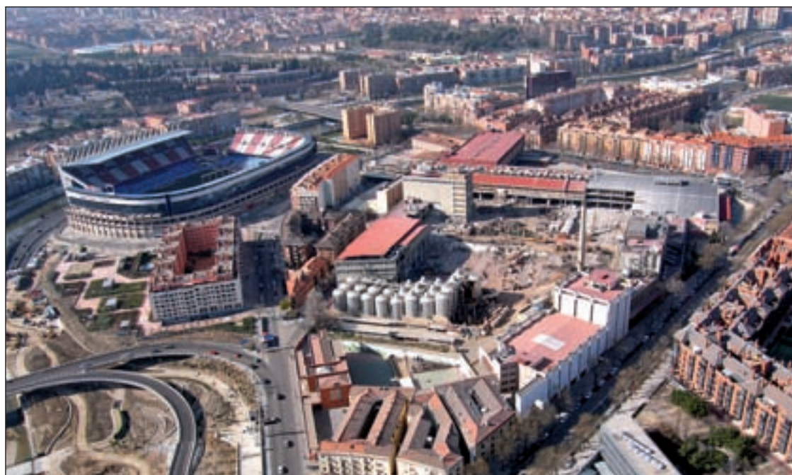
El entorno afectado por la operación urbanística ahora paralizada en los tribunales