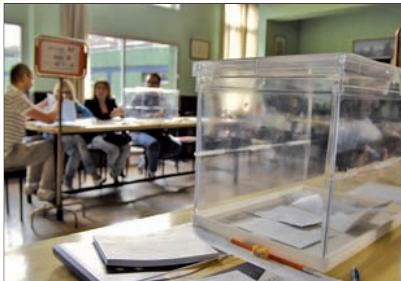
Una de las urnas colocada en un colegio electoral

dan su papeleta a un emigrante español. “Me puse en contacto con ellos y me pusieron en una lista de espera, a los 5 días me dieron el ‘email’ de una chica que ha-