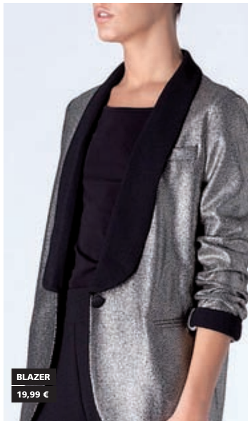
BLAZER 19,99 €