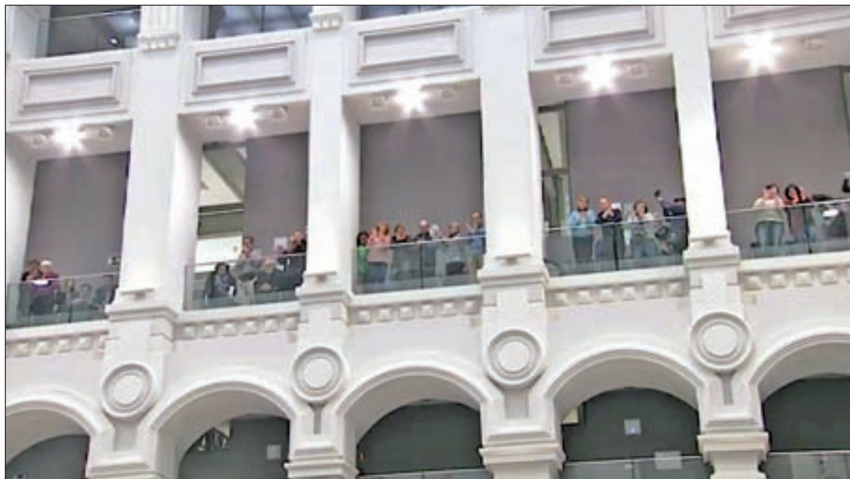
Varios asistentes celebraron la aprobación de la iniciativa del PSOE desde la tribuna

Precisamente, el literal de esta moción fue lo que no gustó al grupo popular que pretendía que se incluyera en su totalidad el artí-