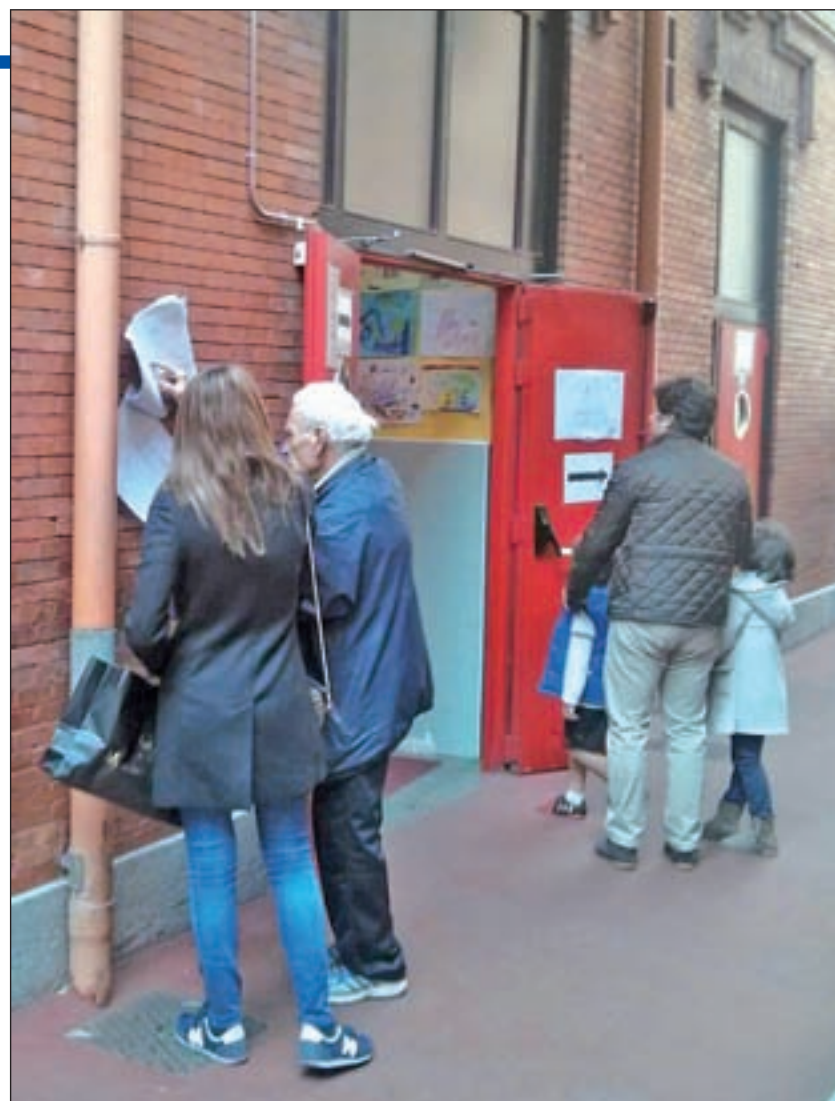
Los votantes consultan las listas en un colegio de Retiro GENTE

tal. En el primero de los casos, se ha pasado de 16.527 (0,96%) en 2011 a 10.336. Mientras que los madrileños que decidieron no apoyar a ninguna candidatura fueron 9.076 (el 0,5%) por los 17.342 (1,02%) de los anteriores comicios generales.