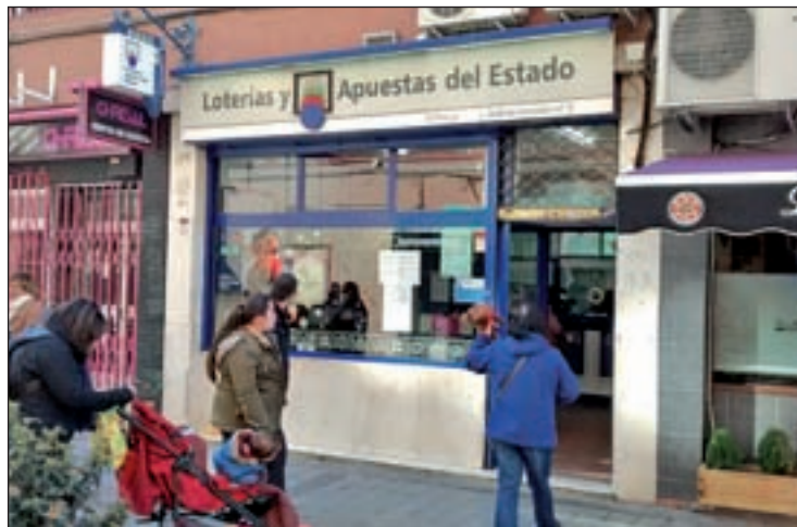
Fachada de la administración donde se ha vendido el número GENTE