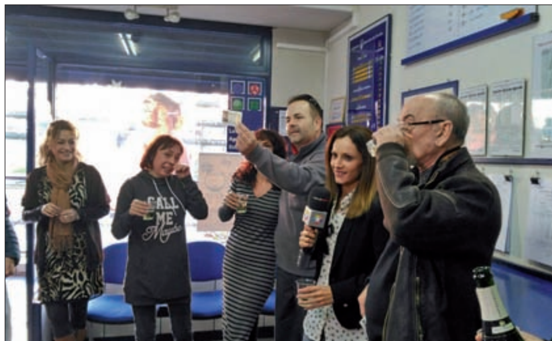
Las loteras y los agraciados, que se acercaron a la administración, celebrando el premio