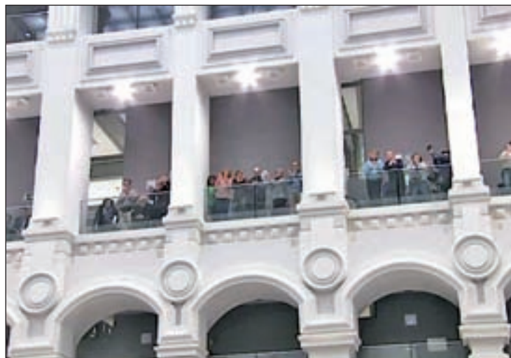
Varios asistentes celebraron la aprobación desde la tribuna

El Ayuntamiento impulsará el mencionado plan en colaboración con asociaciones y con la Cátedra de Memoria Histórica de la Universidad Complutense (UCM), que incluye una guía para