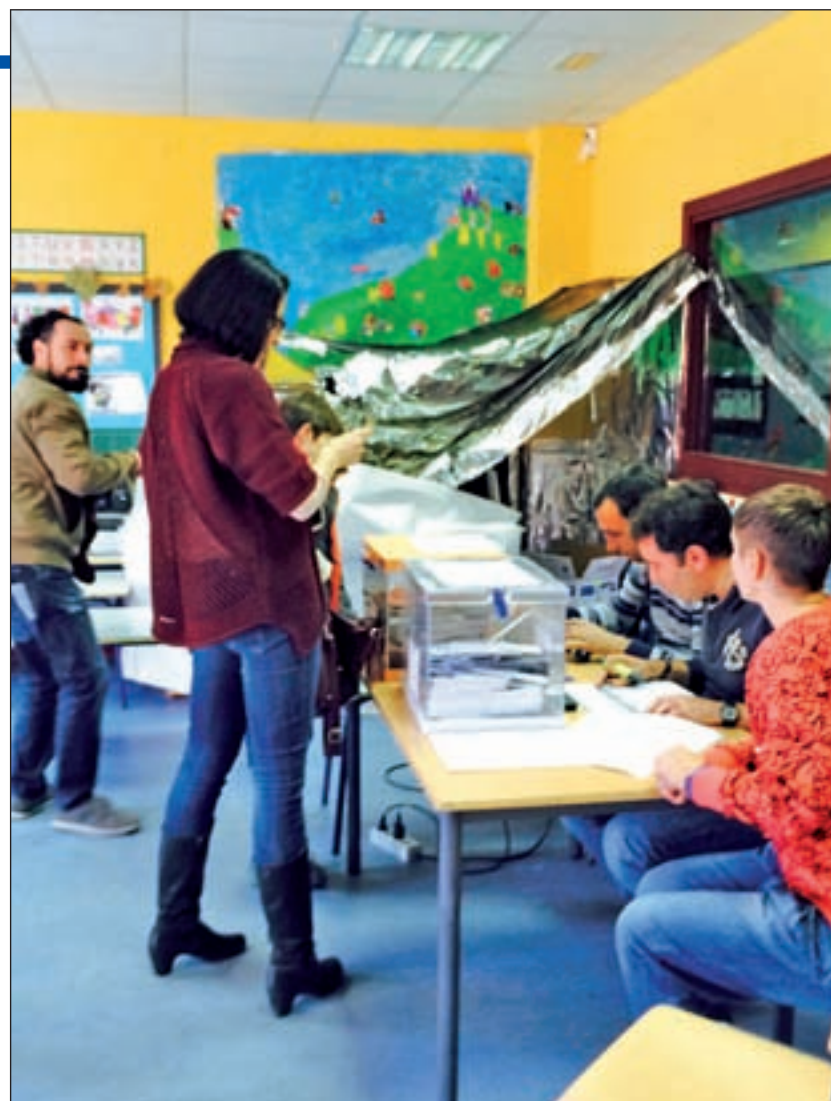
La votación en el colegio Loyola de Palacio de Vallecas LUCA JIMÉNEZ

tal. En el primero de los casos, se ha pasado de 16.527 (0,96%) en 2011 a 10.336. Mientras que los madrileños que decidieron no apoyar a ninguna candidatura fueron 9.076 (el 0,5%) por los 17.342 (1,02%) de los anteriores comicios generales.