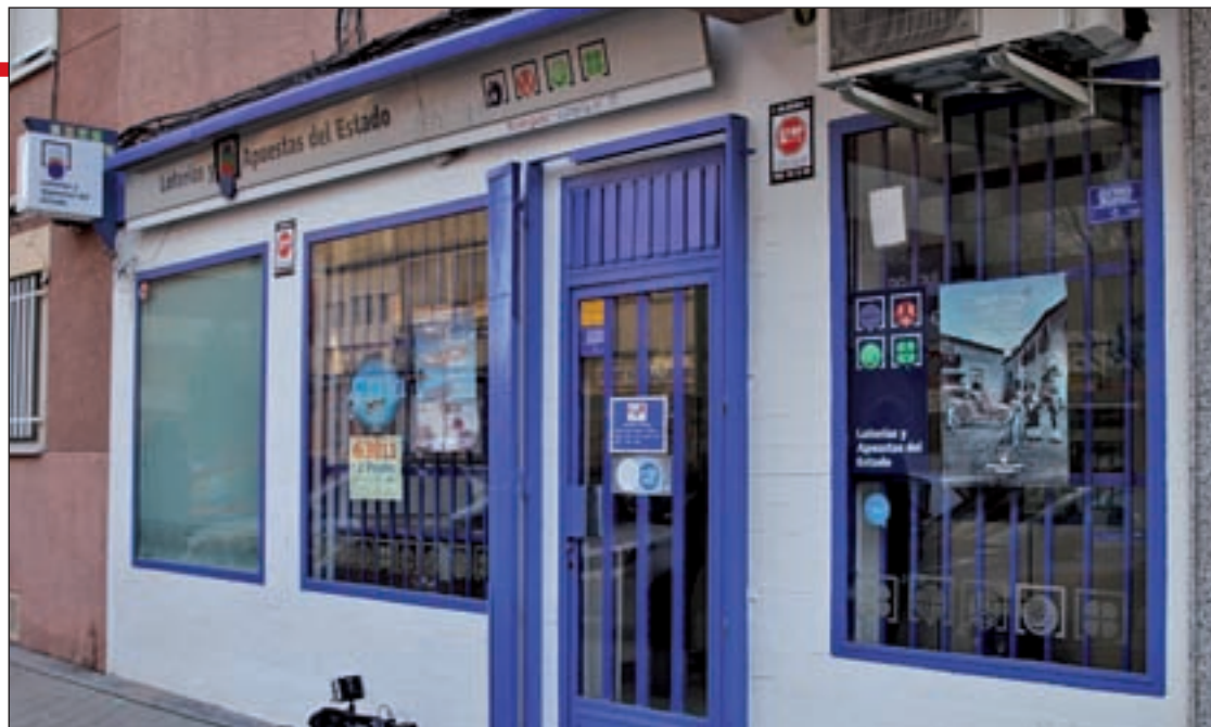
Administración número 17 de Leganés

Por su parte, la administración número 17 de loterías de Leganés, situada en la calle Priorato del barrio de Zarzaquemada, vendió to-