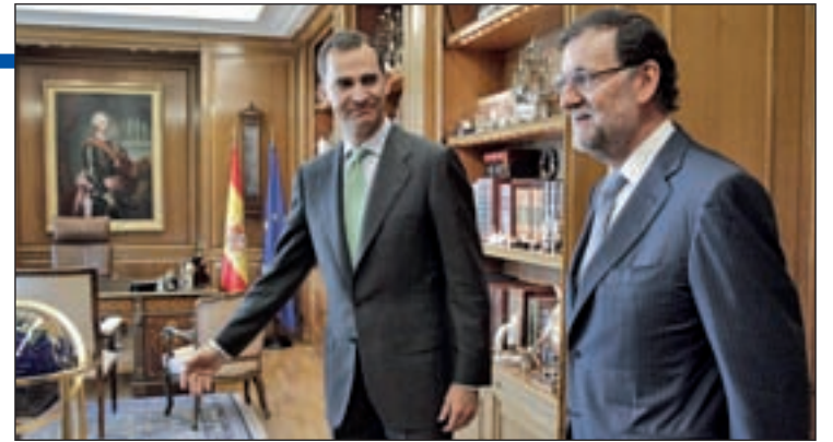
Felipe VI, en una reunión anterior con Rajoy

dría con obtener una mayoría simple. Si no hubiese acuerdo dos meses después de la primera votación de investidura se convocarían nuevas elecciones.