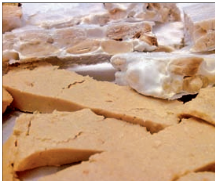
Turrónes duros y blandos