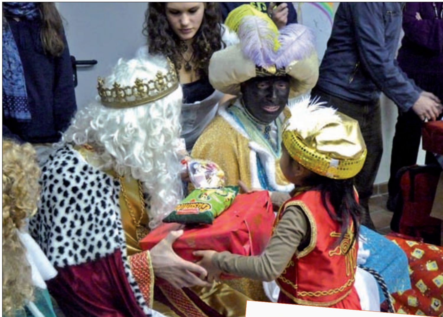
Algunos de los niños recibiendo sus regalos