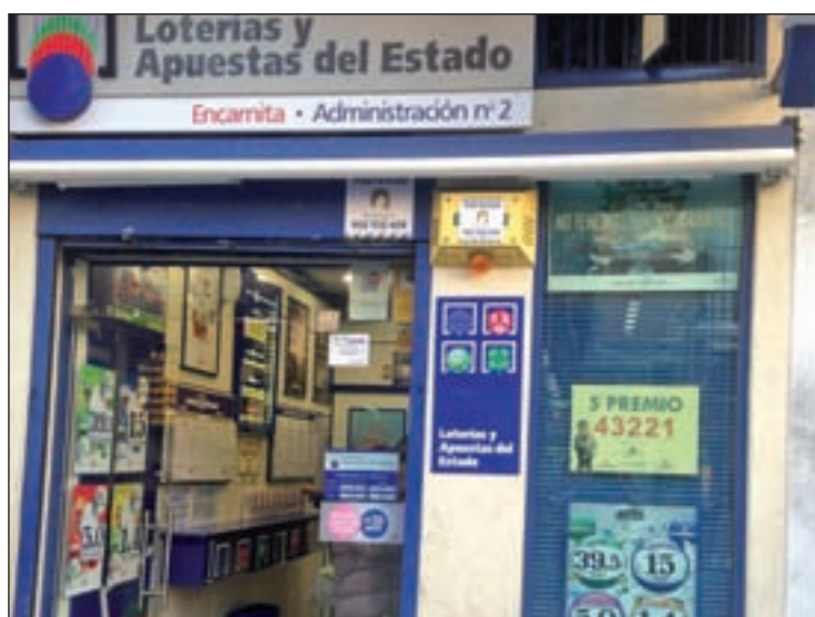
Administración agraciada en la calle Madrid PAULI/GENTE

QUINTO PREMIO EL NÚMERO PREMIADO ES EL 43.221