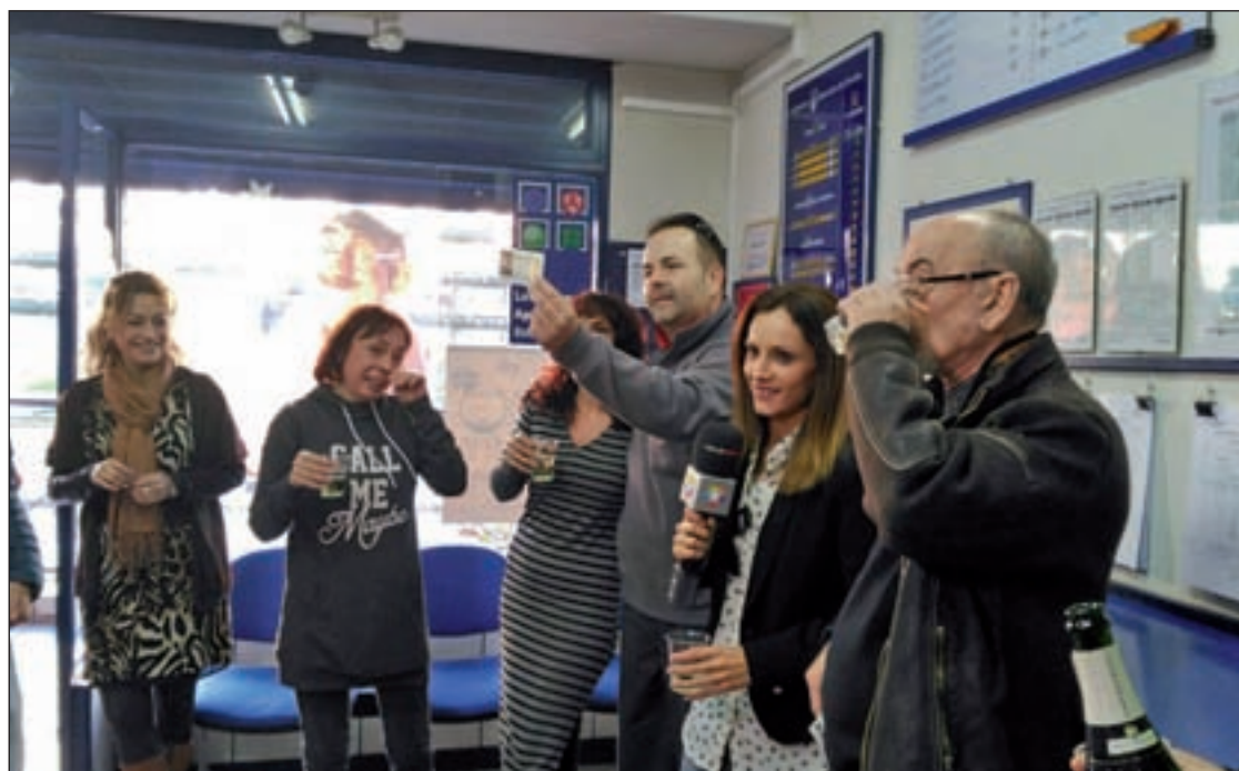
Las loteras y los agraciados, que se acercaron a la administración, celebrando el premio