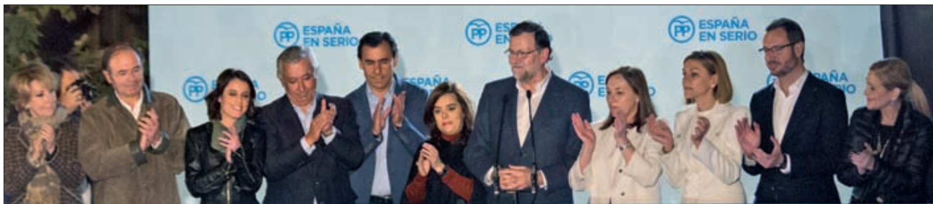
Mariano Rajoy, rodeado de los suyos, en el balcón de la sede de Génova el pasado domingo