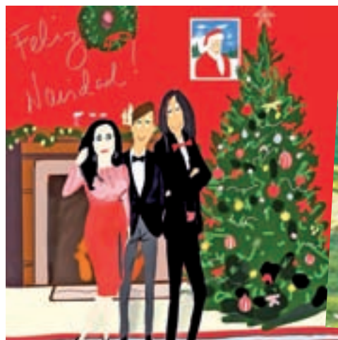
A la izquierda, la original felicitación de Alaska y Mario Vaquerizo. A la derecha, Jorge Javier Vázquez

El mundo cambia, la tecnología avanza y las redes sociales marcan ahora un tiempo nuevo. Si no estás en ellas, no eres nadie. Y eso es algo que saben bien los personajes públicos de este y de todos los continentes del planeta. Es por ello que muchos de ellos han dejado atrás este año las postales y los 'christmas' para felicitar la Navidad a través de Instagram. Futbolistas, presentadores de televisión, cantantes, toreros y demás personajes de la crónica social han querido sumarse a esta nueva moda, y han colgado sus mensajes navideños a modo de instantáneas por aquello que dicen de que una imagen vale más que mil palabras.