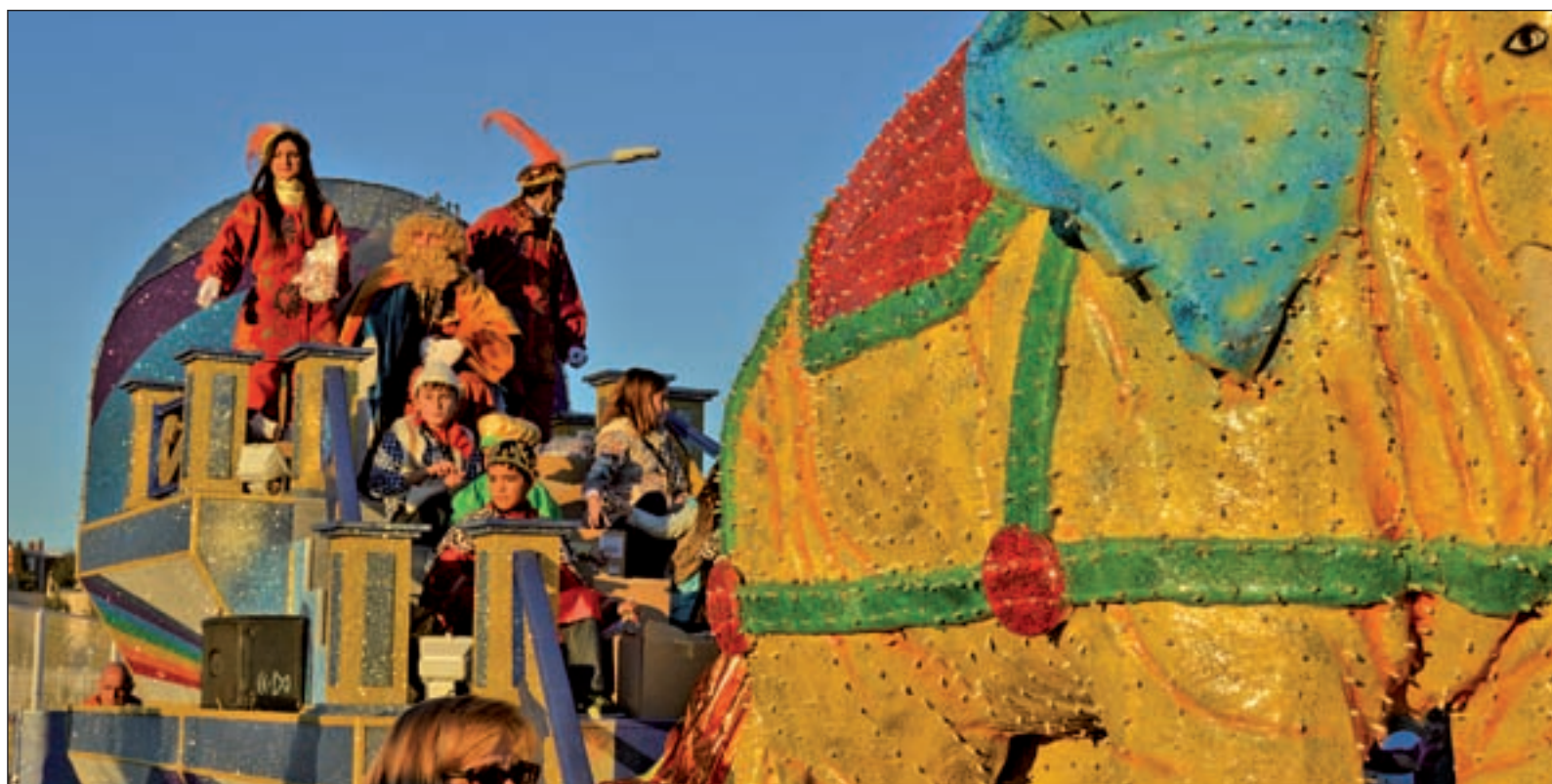
La carroza del Rey Gaspar en la cabalgata de Villa de Vallecas del pasado año