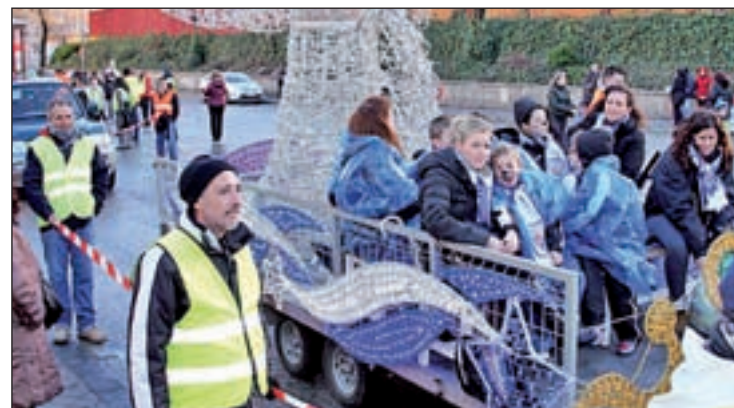
Un momento de la cabalgata del distrito de Moratalaz

Por último, Melchor, Gaspar y Baltasar visitarán a los vecinos de Ciudad Lineal a partir de las 18 horas. Saldrán de Marqués de Corbera, para continuar por Francisco Villaespesa, Emilio Ferrari, Alcalá, García Noblejas y terminar en la Junta Municipal.