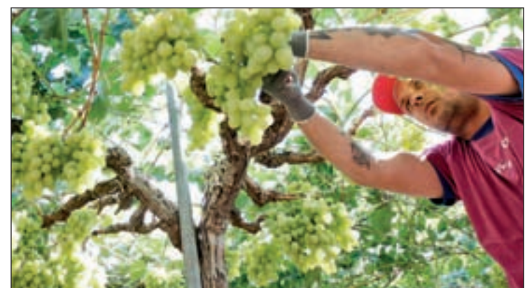
Tratamiento de la uva en la comarca del Vinalopó

No ocurre lo mismo con la novedad de las uvas en conserva, y es que los españoles prefieren la compra a granel o los 'packs' especiales de doce uvas que se preparan para la Nochevieja. Eso sí, siempre que sean frescas.