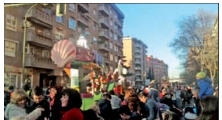
Un momento de la actividad navideña del pasado año

Por su parte, en el distrito de Carabanchel, los Reyes Magos iniciarán su periplo a las 17 horas. La comitiva saldrá de la Avenida de la Peseta y discurrirá por la Avenida de Carabanchel Alto, Eugenia de Montijo, Nuestra Señora de Fátima, Oca y General Ricardos para concluir en la glorieta del Marqués de Vadillo.