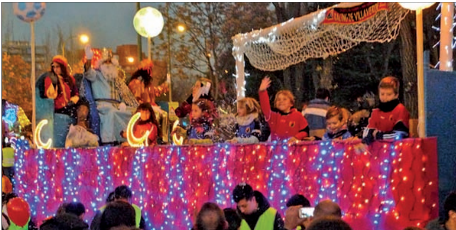
La carroza del rey Melchor, a su llegada al barrio de Butarque, el pasado mes de enero