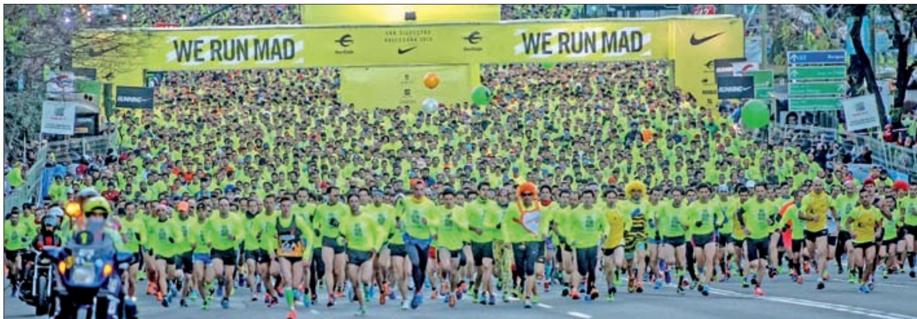
La marea amarilla inundó las calles de la capital el año pasado

Una de las que más tradición tiene es la San Silvestre de Móstoles que este año celebró su vigésima edición. Una de las peculiaridades de esta carrera es que, a pesar de llevar el nombre del santo, no se disputa el 31 de diciembre, sino el 28, y además su recorrido no se extiende hasta los 10 kilómetros, quedándose en 8. Por su parte, la localidad de Getafe apuesta por la tradición y reserva la mañana del día 31 para esta prueba. A partir de las 11 de la mañana dará comienzo una carrera que está organizada por la Peña PCeros y que, tras 34 ediciones, está más que consolidada en el calendario regional. Collado Villalba, Bustarviejo, Alcobendas o Las Rozas también despedirán el año a ritmo de San Silvestre, formando una lista a la que este año se suma Colmenar Viejo.