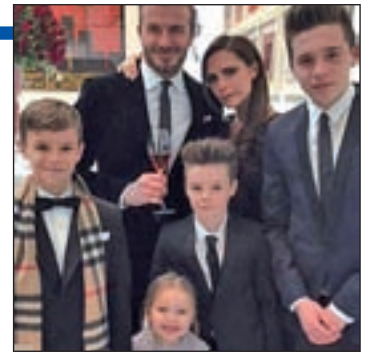
La familia Beckham al completo

de la familia Beckham al completo, cuyos miembros posaron con sus mejores galas y trasladaron sus mejores deseos para todo el mundo.