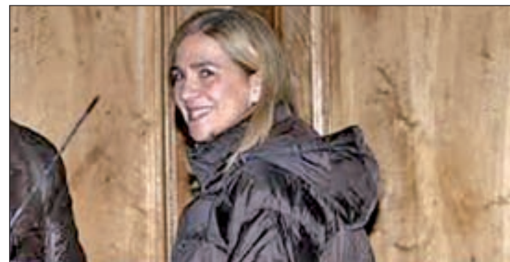
La Infanta Doña Cristina

tras dure el procedimiento administrativo, y también exige que "no tenga derecho al trato de Excelentísima Señora, ni ninguna precedencia protocolaria en cualquiera de los actos oficiales organizados por el Ayuntamiento". Es la primera vez que el Consistorio retira esta distinción.