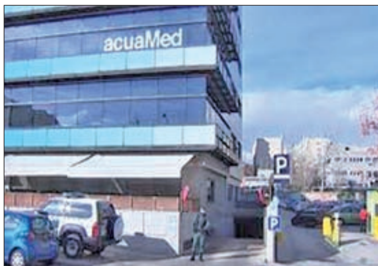
Edificio de la sede de Aquamed en Madrid

LA EMPRESA DEPENDE DEL MINISTERIO DE AGRICULTURA