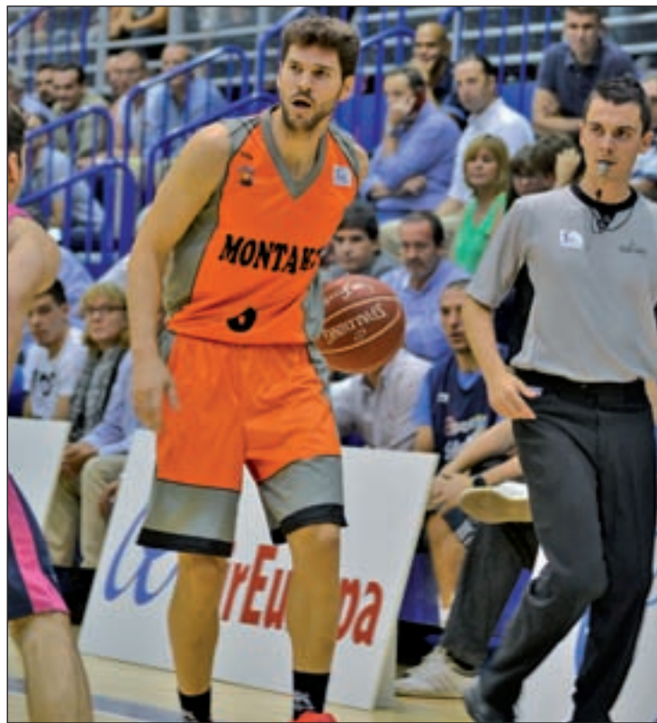
El Fuenlabrada vive un gran momento

A la espera de un fallo de sus rivales directos estarán tres equipos. El primero de la lista es el Dominio Bilbao Basket, un conjunto que necesita ganar y que Real Madrid o Laboral Kutxa le