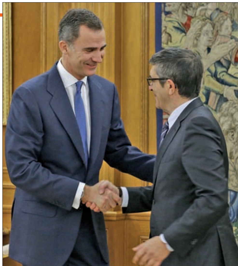
El Rey Felipe VI está recibiendo a los grupos parlamentarios

Mientras, el Rey Felipe VI ha comenzado su ronda de contactos con los líderes de los partidos po-