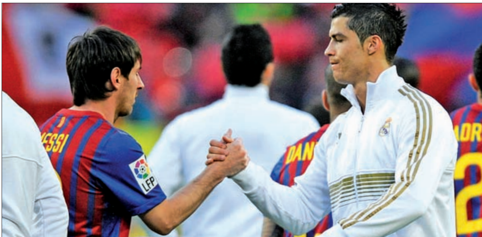
Cristiano Ronaldo y Messi han copado este galardón en las últimas seis temporadas