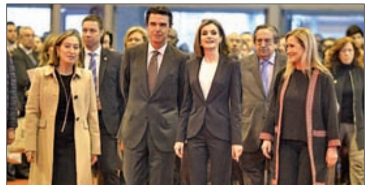
La reina Doña Letizia junto durante su visita a FITUR

Se prevé que este evento conlleve un impacto económico de entre 180 y 200 millones de euros. Este año se espera que aumente el número de visitantes ya que los expositores han crecido en un 3%.