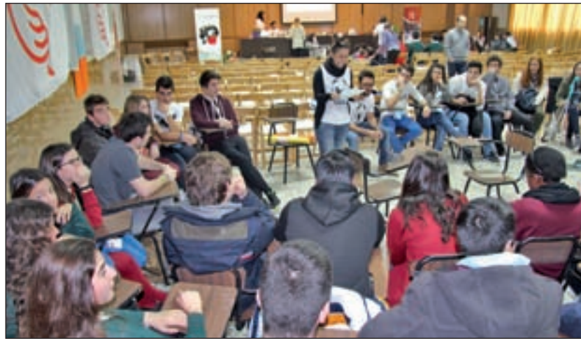
Jóvenes durante uno de los debates de las Scholas ocurrentes