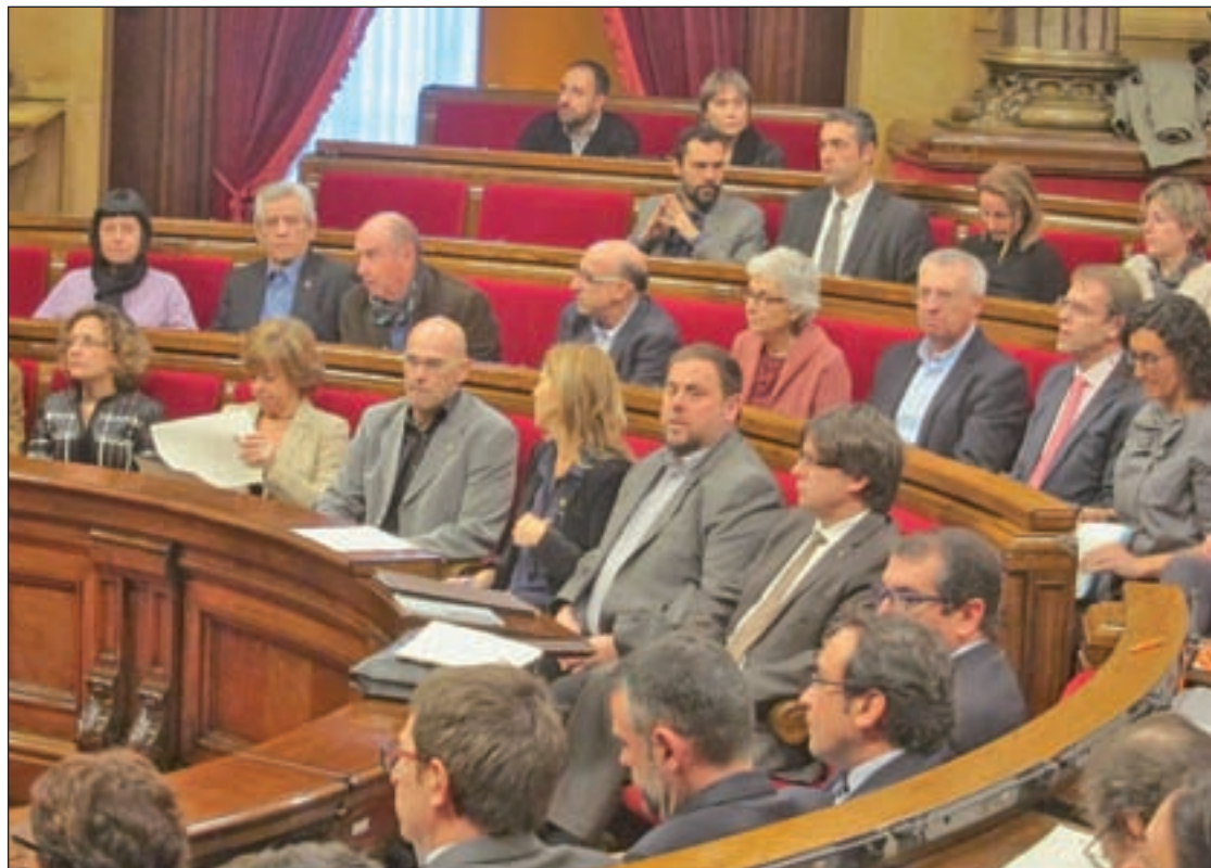
Imagen de la celebración del primer pleno ordinario del Parlamento catalán

Después de que el pasado 27S la coalición de JxSí no lograra obtener la mayoría necesaria para iniciar el proceso soberanista, el mensaje de la formación ha ido cambiando con el paso de los días. Ahora la opción de declarar la independencia de Cataluña de manera unilateral sin contar con el Gobierno central queda prácticamente descartada, tal y como anunció Munté el pasado martes en una rueda de prensa cuando dijo que en el acuerdo alcanzado con la CUP "no hay ninguna mención sobre unilateralidad" para comenzar el proceso separatista. Aunque la portavoz del Gobierno