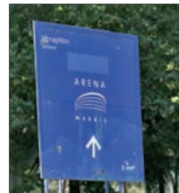
Cartel del Madrid Arena