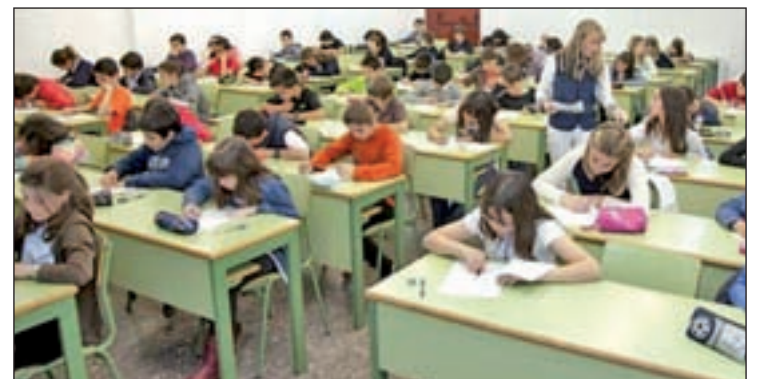
Alumnos durante una clase

quia (298), según los datos. El documento indica sobre España que "el debate sobre la financiación de las escuelas no gubernamentales está muy politizado" y define como "práctica eficaz" la cesión de suelo para contruir centros por parte de las comunidades. También se señala el debate sobre la enseñanza concertada por la presencia mayoritaria de centros católicos, un debate, "inexistente" en los países del norte de Europa