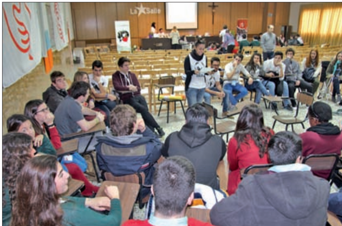
Jóvenes durante uno de los debates de las Scholas ocurrentes