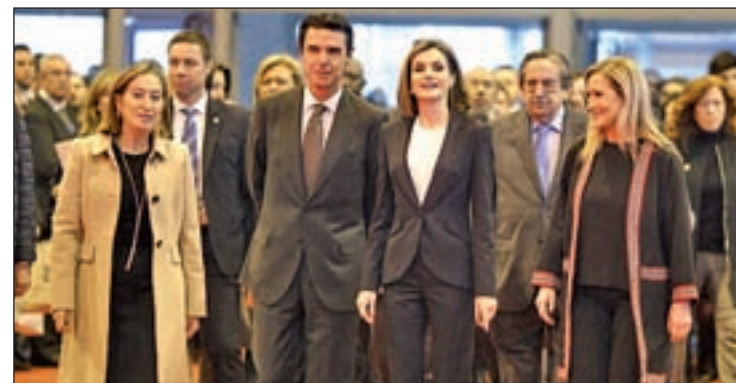
La reina Doña Letizia junto durante su visita a FITUR

Se prevé que este evento conlleve un impacto económico de entre 180 y 200 millones de euros. Este año se espera que aumente el número de visitantes ya que los expositores han crecido en un 3%.