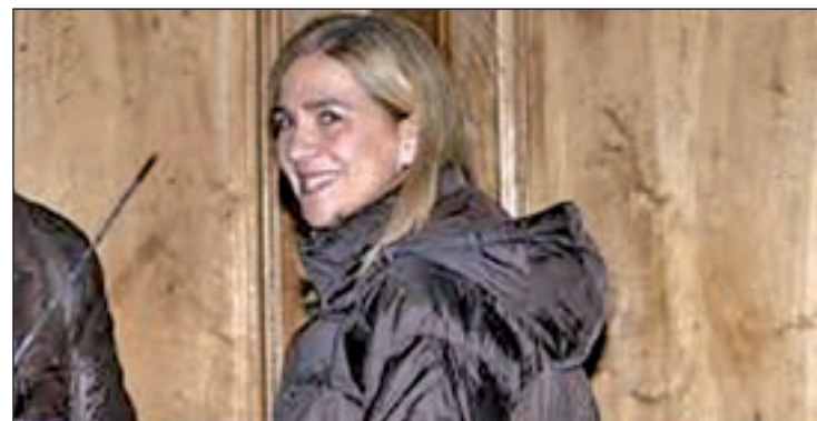
La Infanta Doña Cristina

tras dure el procedimiento administrativo, y también exige que "no tenga derecho al trato de Excelentísima Señora, ni ninguna precedencia protocolaria en cualquiera de los actos oficiales organizados por el Ayuntamiento". Es la primera vez que el Consistorio retira esta distinción.