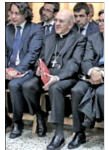
El arzobispo de Madrid