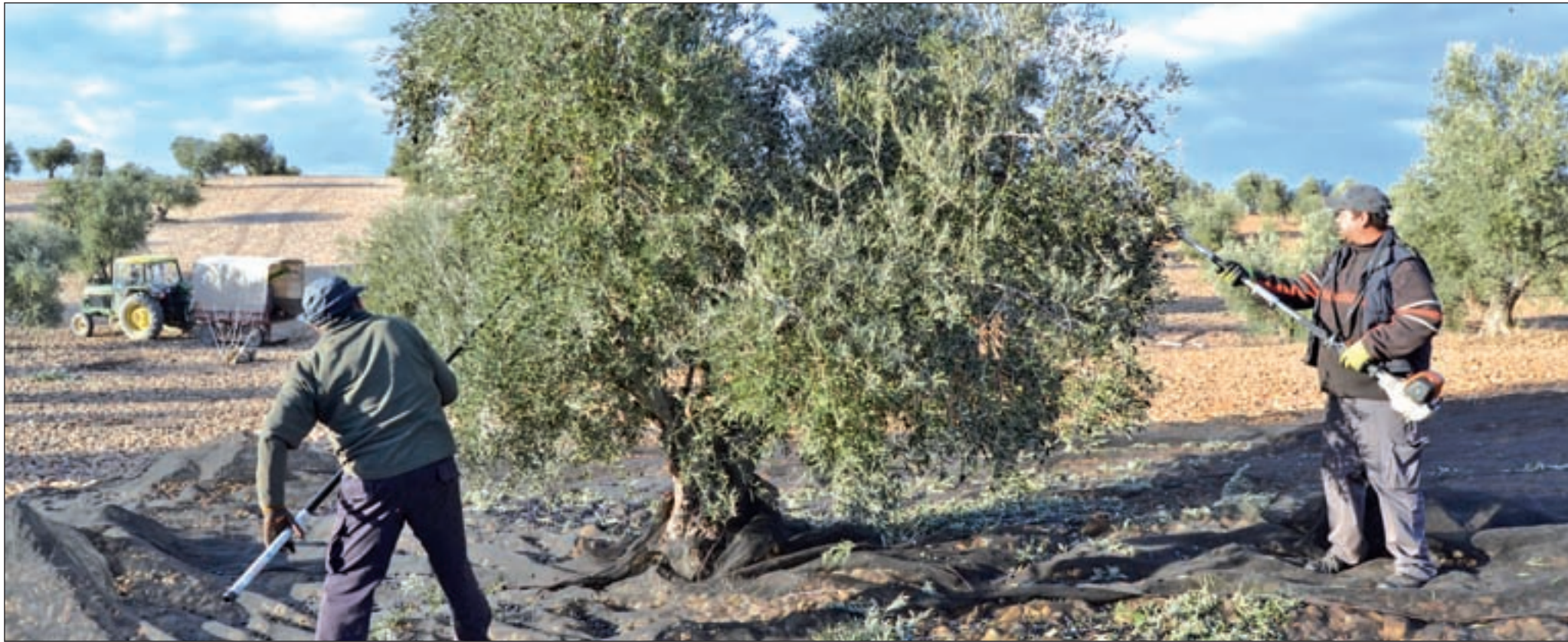
Los trabajadores recogen la aceituna a golpe de vara en Villaconejos