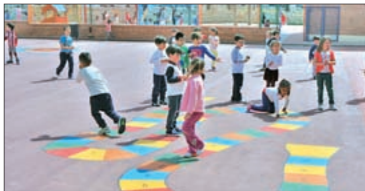
Estas Jornadas se celebrarán en el CEIP Gabriel García Márquez

Este plazo tiene como objetivo favorecer que los padres puedan conciliar vida laboral y familiar, al mismo tiempo que ofrecen a los niños una alternativa lúdica en un colegio del municipio en este día