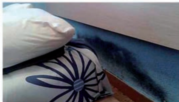
Problemas de humedad por capilaridad

Se han realizado estudios científicos sobre adolescentes que sufren afecciones respiratorias, dando como resultado un 83% de asma, bronquitis asmáticas y bronquitis crónicas y un 87% de rinitis crónicas, que alcanzan a jóvenes que viven en habitaciones demasiado húmedas. De un 20 a un 30% de nosotros sufrimos alergias respiratorias, ¡dos veces más que hace 20 años!. Edouard Drouhet,