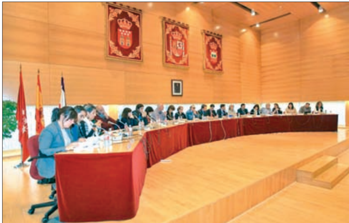
Sesión plenaria de Tres Cantos

Asimismo, esta buena sintonía ha permitido que el municipio tricantino haya sido uno de los primeros ayuntamientos de la Comunidad de Madrid en aprobar los Presupuestos para este 2016