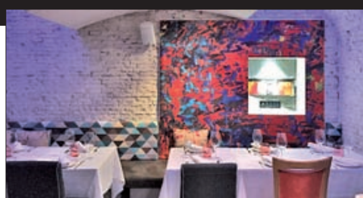
Uno de los salones de Artys Madrid

bola de discoteca incluida. Cualquier momento es bueno para acercarse a conocer el punto de vista de un chef que pone nombre propio a una sobrasada exquisita que se servirá de aperitivo. Y una vez el comensal ha abierto el apetito, en Artys disponen tanto de carta como de menú semanal.