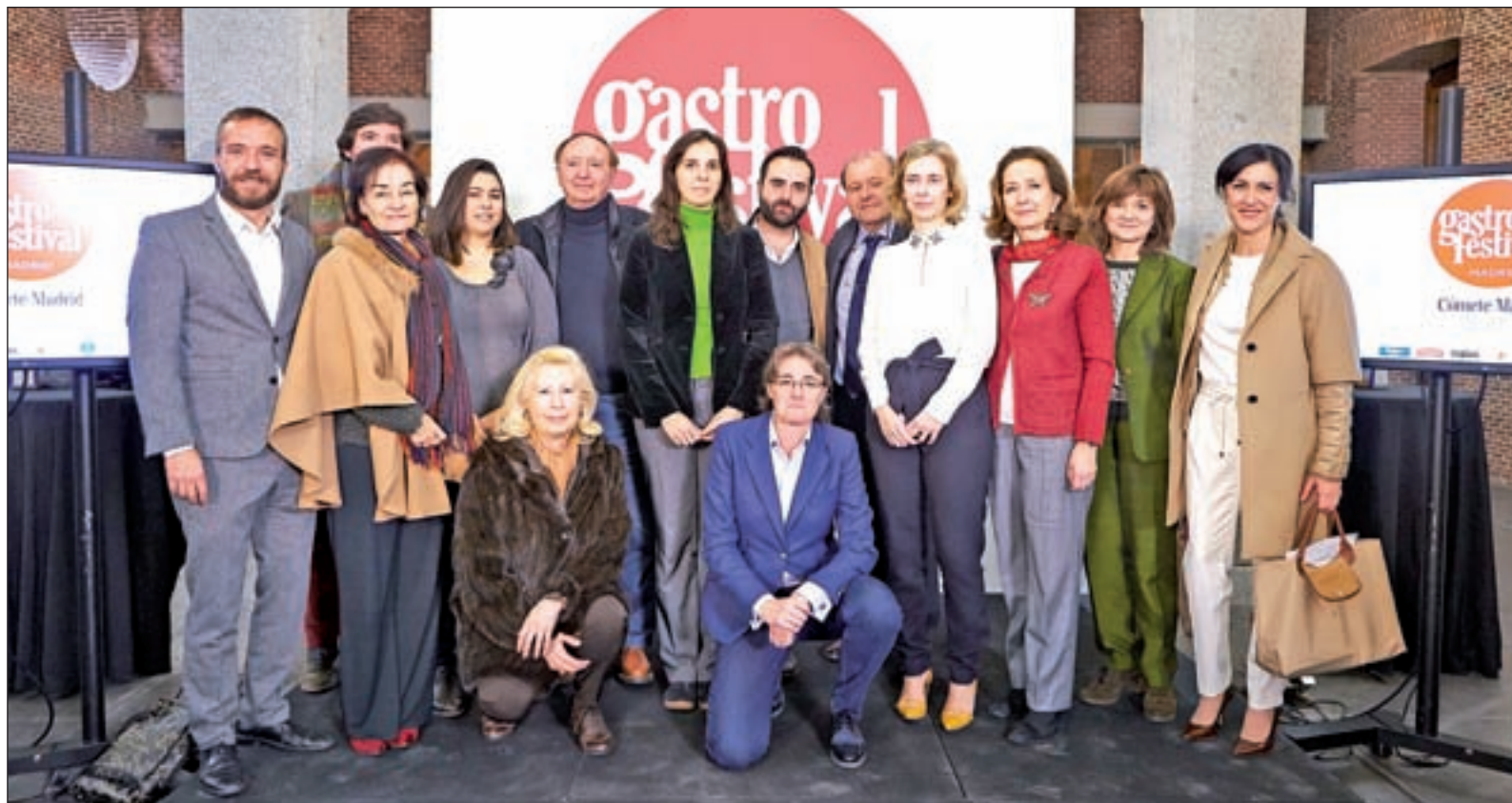
Presentación de la séptima edición del Gastrofestival