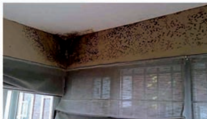
Problemas de humedad por condensación

jefe de micología en el instituto de la Salud Pública