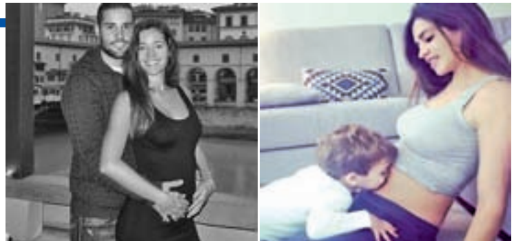
Malena Costa y Sara Carbonero

Bar Refaeli es otra de las futuras mamás. La modelo israelí publicó un test de embarazo en Instagram para dar a conocer al mundo la Buena Nueva.