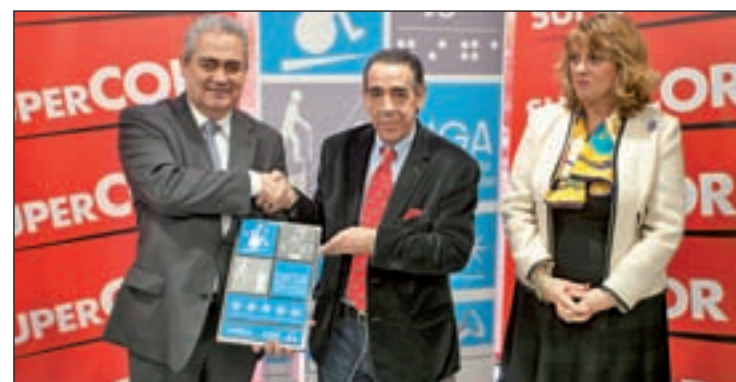
Acto de entrega de la certificación

hizo entrega de este distintivo. El sistema DIGA, cuyo objetivo es mejorar la calidad de vida de personas con movilidad reducida, evalúa y certifica el grado de accesibilidad de todos los elementos que constituyen el conjunto de estructuras físicas, funcionales y virtuales.