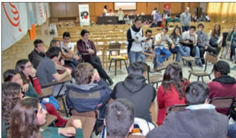
Jóvenes durante uno de los debates de las Scholas ocurrentes

En los debates, los jóvenes se dividieron en cuatro grupos y hablaron de los problemas que más preocupan a la gente de su entor-