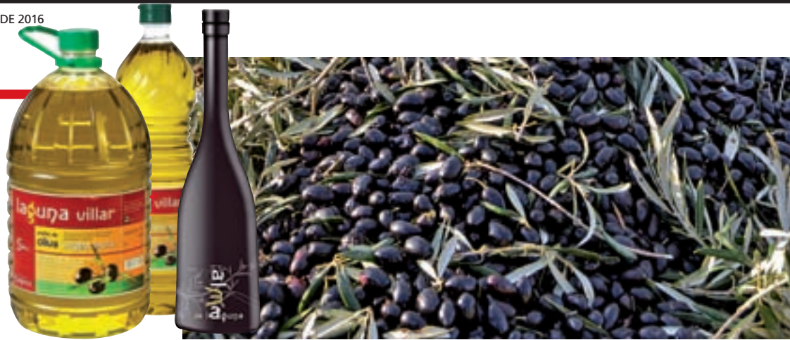
La variedad cornicabra es la más utilizada por Vinos y Aceites Laguna para sus productos

Esta almazara vende su producto con la etiquetas de Laguna Villar, en envases de uno y cinco litros, y de Alma de Laguna, su variedad más 'premium'. Y, a pesar de que cuentan con olivar ecológico desde hace ocho años, su aceite se hizo por primera vez con estas características el año pasado, después de adaptar la almazara para