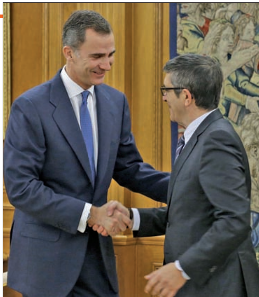
El Rey Felipe VI está recibiendo a los grupos parlamentarios

Mientras, el Rey Felipe VI ha comenzado su ronda de contactos con los líderes de los partidos po-