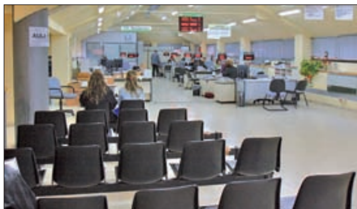
El Programa se desarrollará de marzo a junio de 2016

No obstante, desde el Ayuntamiento se ha informado de que "las personas desempleadas que