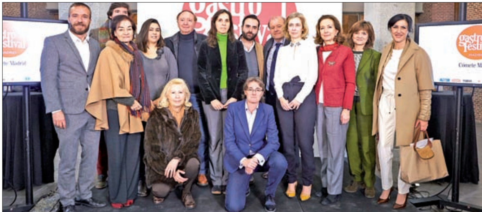
Presentación de la séptima edición del Gastrofestival