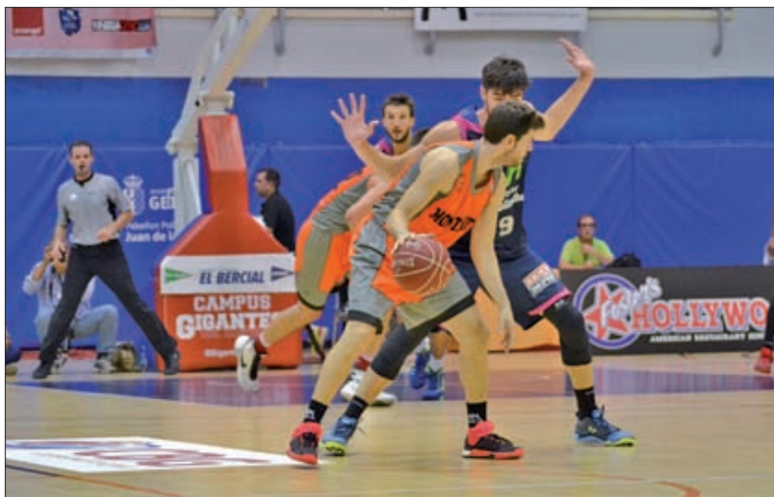
El Montakit, durante un encuentro

Fe inquebrantable y defensa firme fueron las apuestas del Montakit Fuenlabrada en el derbi frente al Real Madrid. El cuadro naranja, esta vez de verde, se llevó el partido en el Fernando Martín por 91-85. Los fuenlabreños rompen así una racha de diez partidos sin vencer al cuadro blanco.