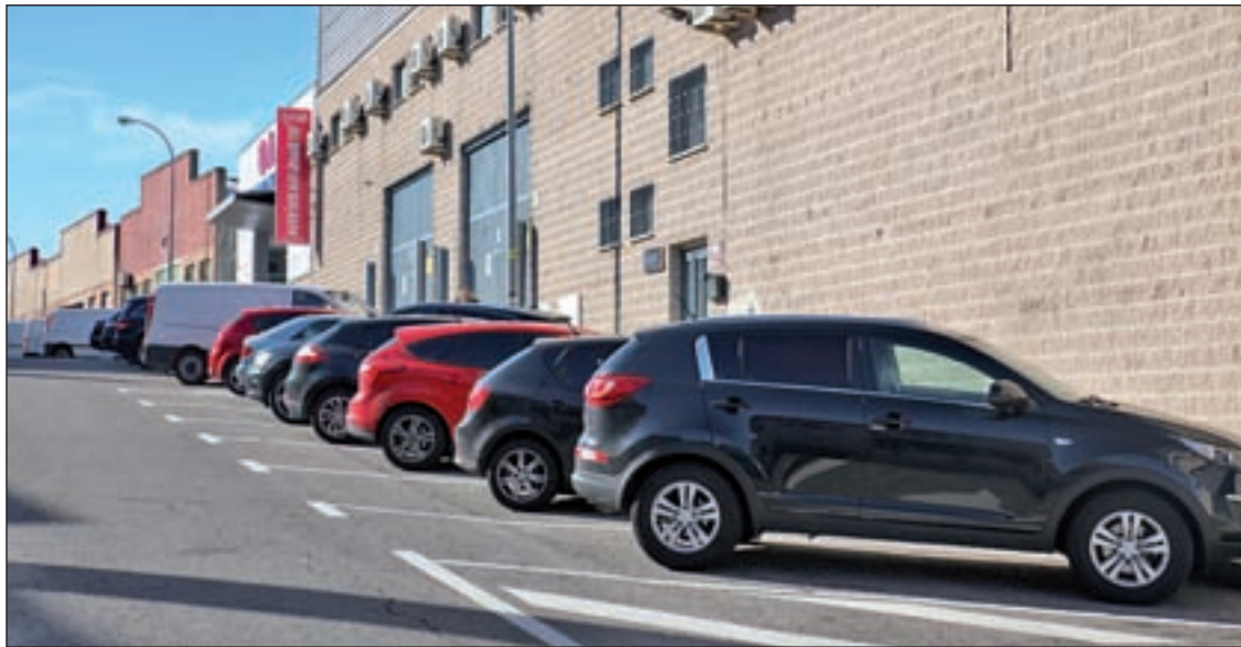
Estado anterior de la calle Piedrafrita