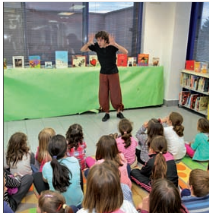
Una sesión de la pasada edición de '¡Cuánto Cuento!'