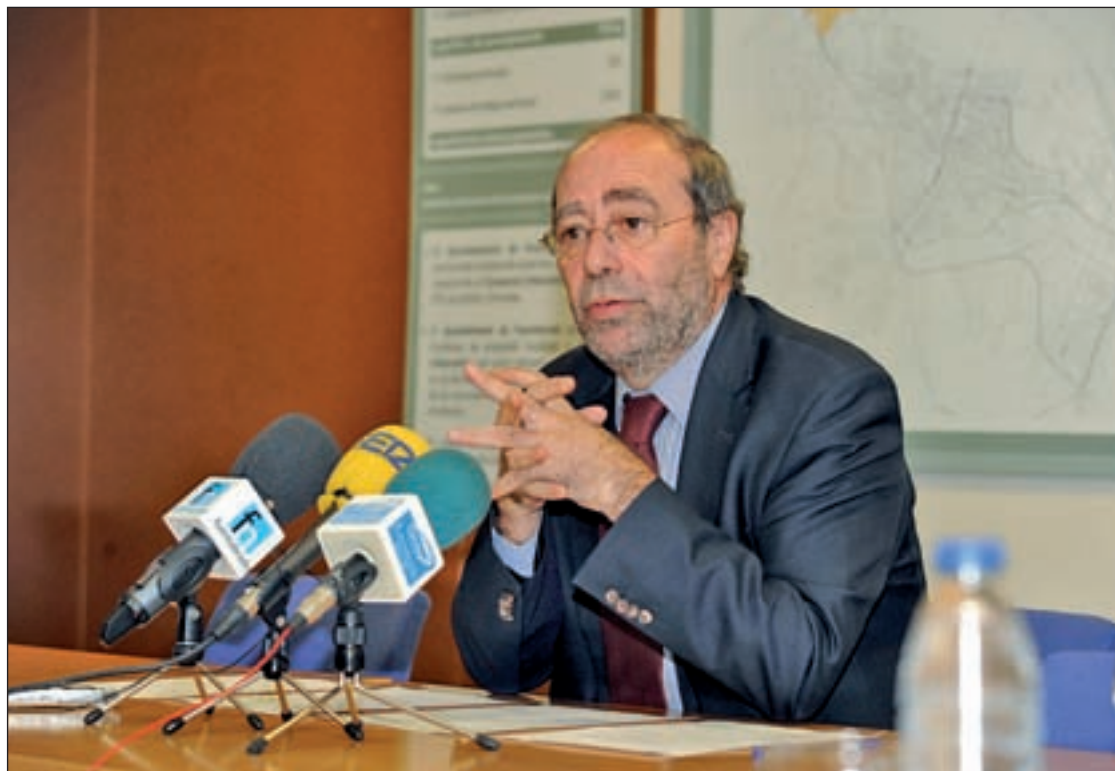
El alcalde de Fuenlabrada, Manuel Robles

Según desatacaron desde el Consistorio, el pasado año el pleno aprobó, con la abstención del PP, una moción en la que se pedía el mantenimiento de la antigua oficina de empleo así como la apertura de una nueva que cubriera