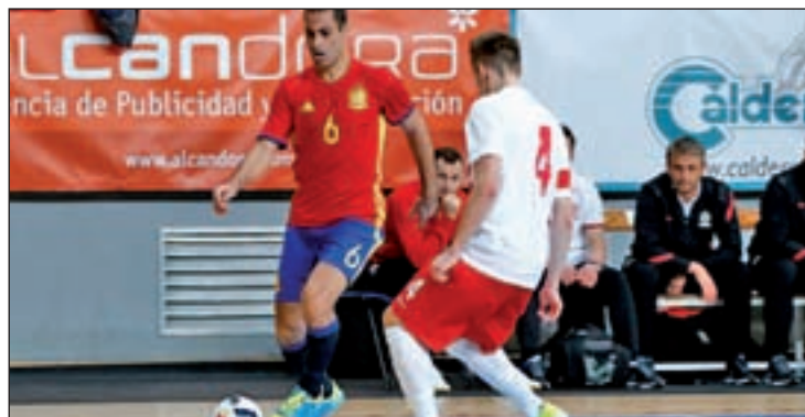
La selección goleó a Polonia en su último amistoso

Para abrir boca, España ha quedado encuadrada en el grupo