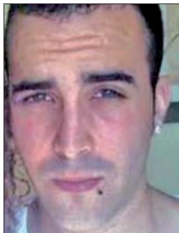
El presunto agresor

Al parecer el origen de la disputa se produjo cuando la madre se despertó de madrugada y, según la versión de algunos medios, sorprendió al hombre abusando de su hija. En ese momento se pro-