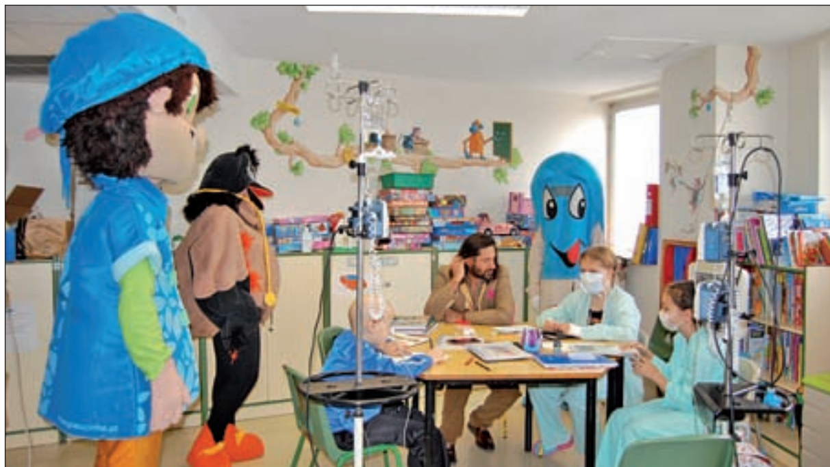
La planta de Hemato-Oncología Pediátrica atiende a alrededor de 100 pacientes al año

Esta doctora explica que para en la lucha contra el cáncer hace falta “invertir en investigación. El rango de curación aumenta todos los años por la aparición de nuevas técnicas y medicamentos, pero los investigadores necesitan financiación para no tener que dejar el trabajo a medias porque se les acabe la beca” detalla. Otra de las claves fundamentales para avanzar en este campo es el trasplante de médula. Con motivo del