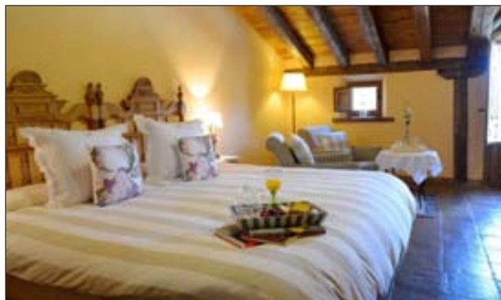
Una de las suites de la Posada

Además, la Posada Real de las Vegas dispone de un segundo pa-