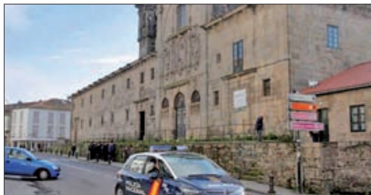
El convento de las Mercedarias de Santiago

Fue una de las monjas, que consiguió salir del Convento de las Mercedarias de Santiago la que acudió a la Comisaría de la Policía Nacional para denunciar que tanto ella como otras monjas estaban siendo retenidas en este lugar bajo coacciones. Los agentes se personaron en el convento