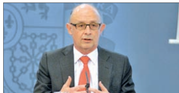
Cristóbal Montoro, ministro de Hacienda en funciones

Según el informe, el subsector Comunidades Autónomas ha registrado un déficit de 14.204 millones hasta finales de noviembre, lo que equivale al 1,31% del PIB, frente al déficit del 1,34% registrado en noviembre de 2014.