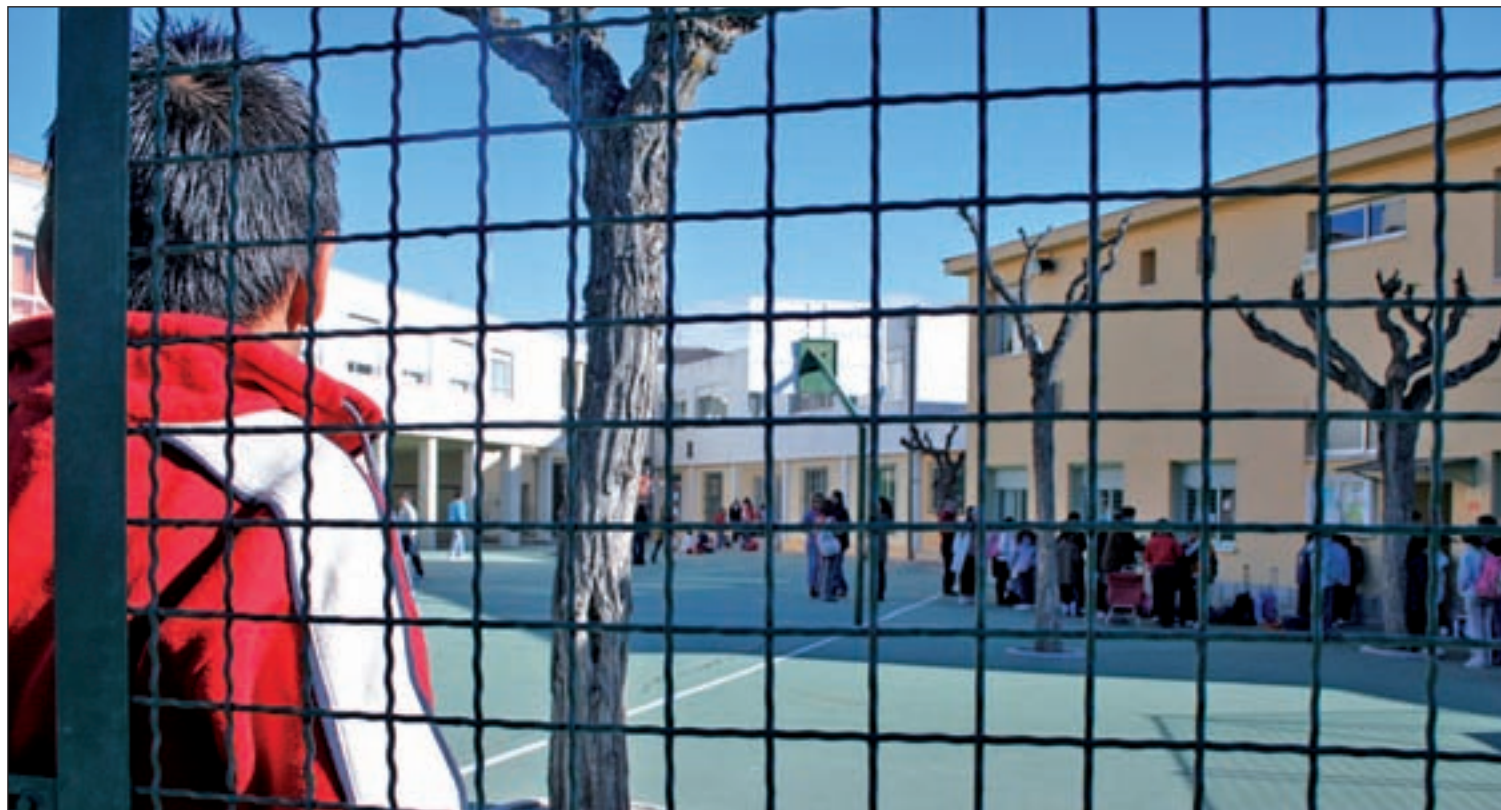
El Gobierno aprueba nuevas medidas del Plan Estratégico de Convivencia Escolar