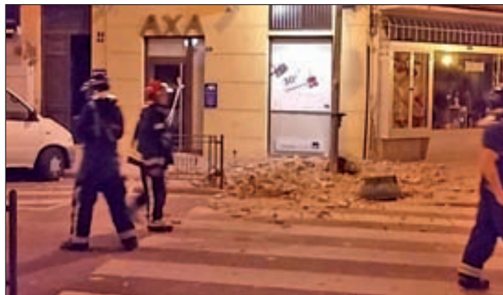
Las calles de Melilla tras el terremoto

Se trata del segundo terremoto que tiene lugar en la zona en los últimos días. El jueves anterior se produjo un seísmo de magnitud 4,9 con epicentro en esta misma