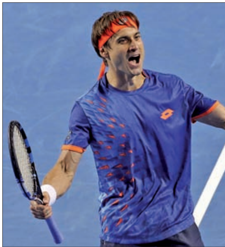
David Ferrer fue eliminado por Andy Murray

La otra cara de la moneda ha sido para nombres como los de