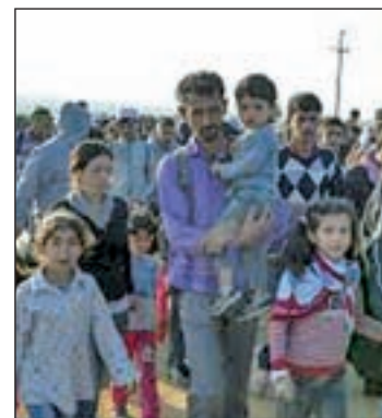
Grupo de refugiados sirios

La Ley contempla que los demandantes de asilo podrán quedarse con unos 1.300 euros o 10.000 coronas de dinero en metálico y los objetos de valor que porten hasta este límite, pero por encima del mismo, en ambos ca-