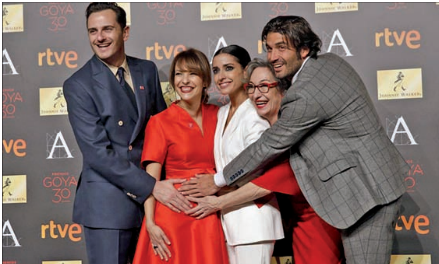
Reparto de actores de 'La Novia', una de las películas preferidas en los Goya