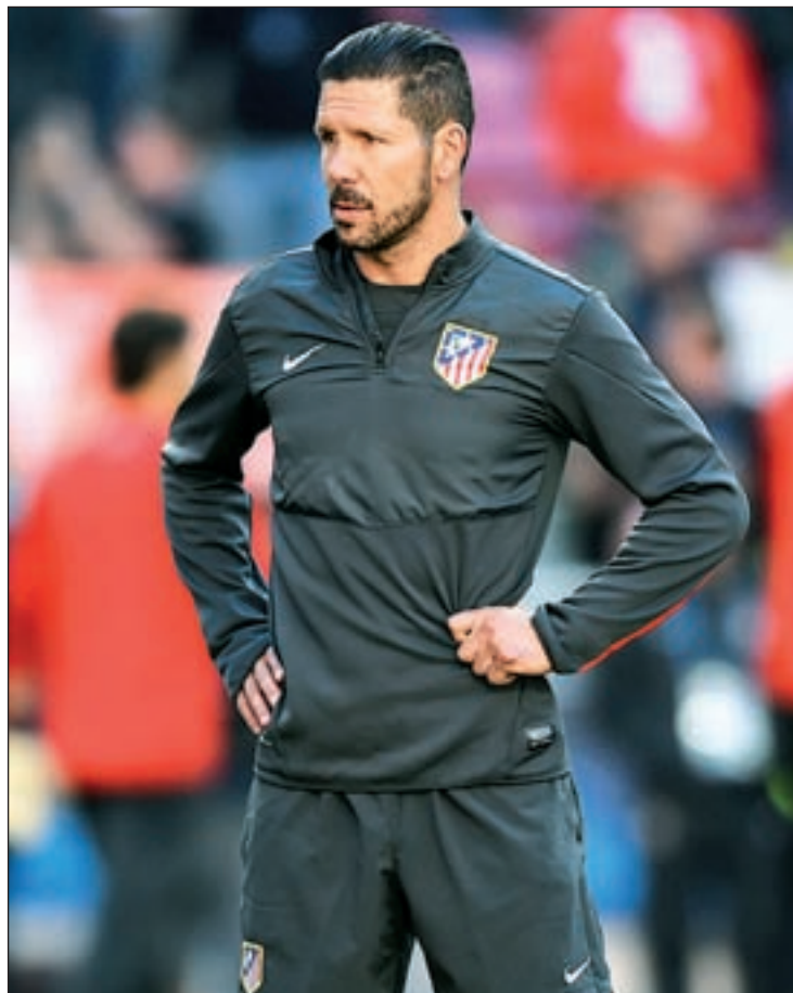
Simeone, el técnico de Primera que más tiempo lleva en el cargo

Gran parte del 'planeta fútbol' mirará durante 90 minutos a la Ciuda-