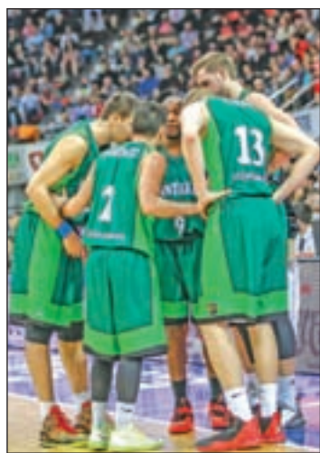
El 'Fuenla' dio la sorpresa