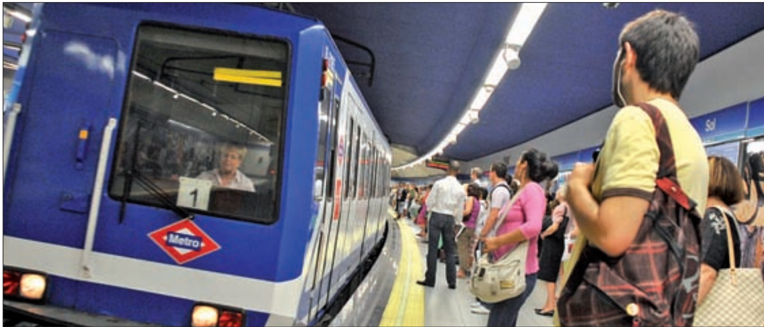
La Línea 1 tiene 97 años y por ella pasan 85 millones de personas al año GENTE