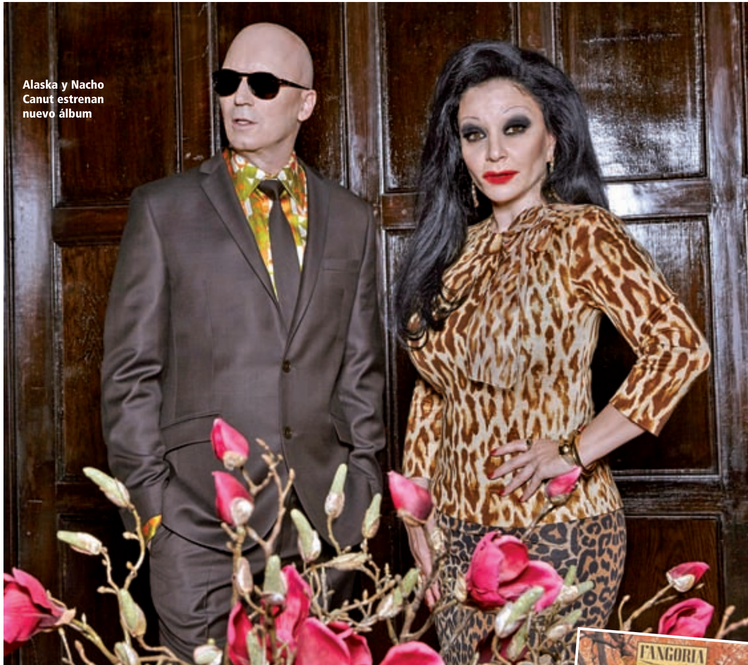
Alaska y Nacho Canut estrenan nuevo álbum