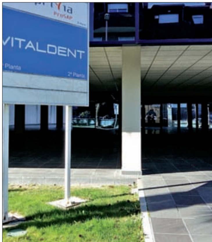
Los registros afectaron a la sede central, ubicada en Las Rozas

Las detenciones se han precipitado ante las sospechas de la UDEF de que el propietario de Vitaldent tenía previsto cerrar repentinamente el negocio y que-