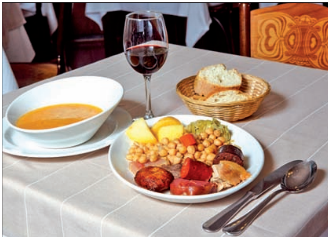
Plato de cocido del restaurante Manolo

Esta iniciativa gastronómica, enfocada a promover el consumo del cocido, se podrá disfrutar en la capital en Casa Carola, Casa Pello, El Café de la Ópera, La Bola, La Cruzada, La Gran Tasca desde 1942, Los Arcos de Ponzano, Los Galayos, Malacatín, Manolo, Nuevo Horno de Santa Teresa, Posada del León de Oro, Puerta Bisagra, Rivera Navarra, Rincón de Goya, Taberna Eneri, Taberna de la Daniela, Villagodio y Viva Madrid.