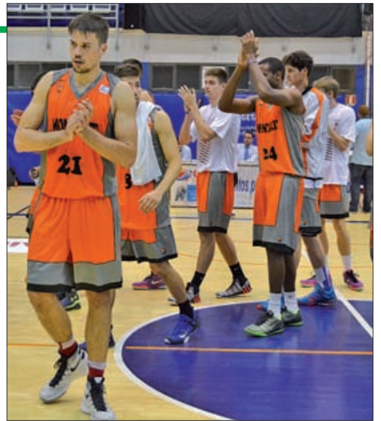
Cita histórica para el Montakit Fuenlabrada

A pesar de la diferencia entre sus presupuestos, las plantillas, e incluso el palmarés, establecer un pronóstico favorable a los hombres de Pablo Laso se antoja un tanto osado. A la espera de recuperar sensaciones y su mejor juego, el Madrid intentará superar los escollos para plantarse en la final del domingo, en la que podría verse las caras con el Barcelona Lassa, un 'Clásico' decisivo que ya se ha dado en cinco de las últimas seis ediciones. Al margen de la irregularidad exhibida a lo largo de este curso, el vigente cam-