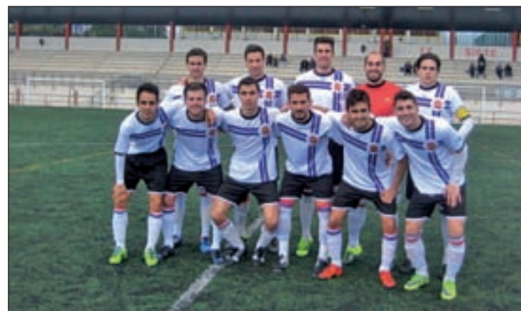
La E.F. Siete Picos se enfrenta este domingo a la A.D. Esperanza