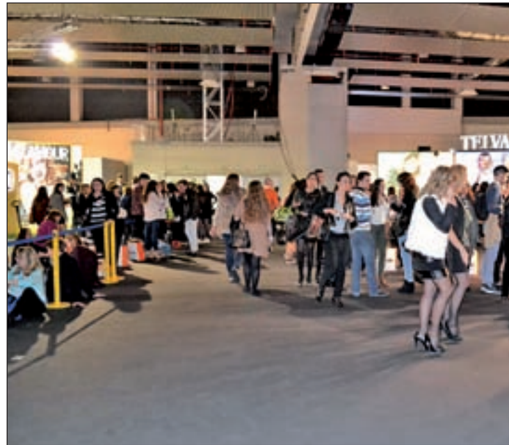
Imagen del Cibelespacio

Además, desde febrero de 2013, Mercedes-Benz convoca todos los años un premio entre los diseñadores participantes en la pasarela Samsung EGO, que da la oportunidad al ganador de mostrar su colección en una de las pasarelas internacionales patrocinadas por la marca. Un jurado de ex-