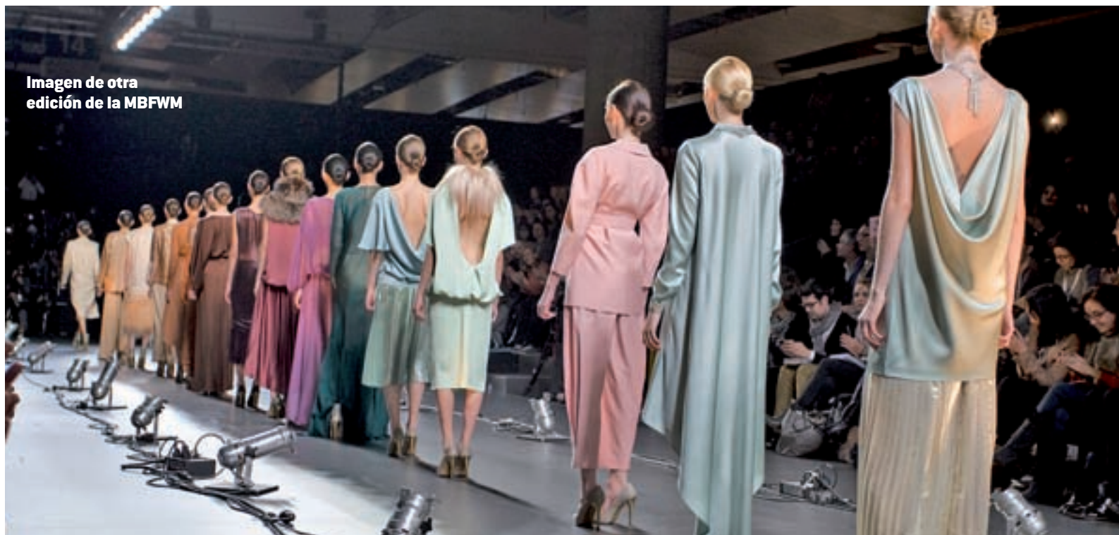
Imagen de otra edición de la MBFWM

uno de los grandes eventos en el universo de la moda y el diseño internacional, según explicaron los organizadores.