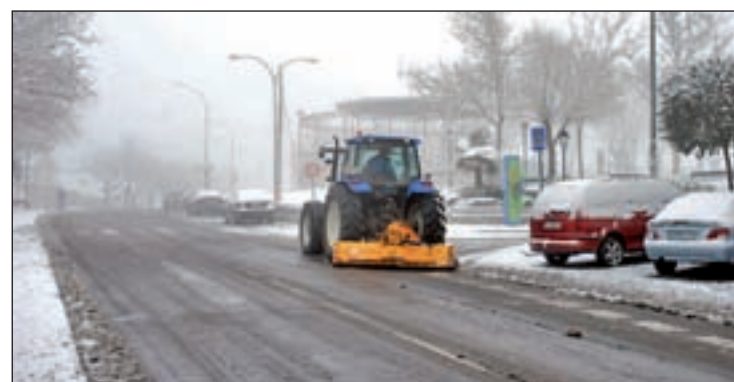
Acondicionamiento de vías de circulación de Colmenar

El dispositivo se activará en el momento en el que se observe que la nevada es copiosa y que las condiciones de temperatura y hu-