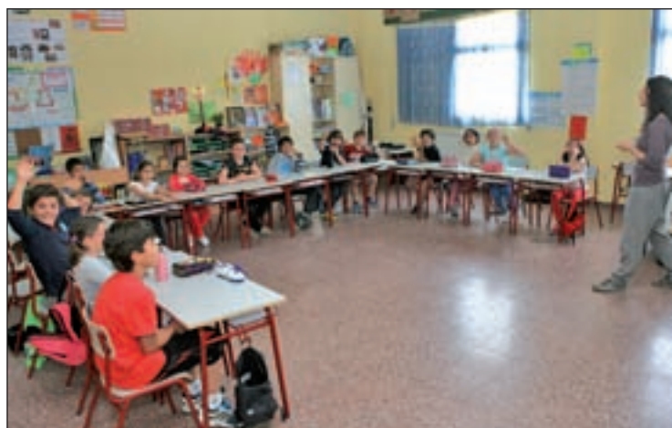
Este viernes 19 se podrá visitar el CEIP Antonio Osuna