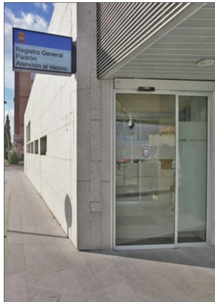
Registro General de Tres Cantos

El número de facturas que se podrán presentar será de un máximo de 3 por persona y número.