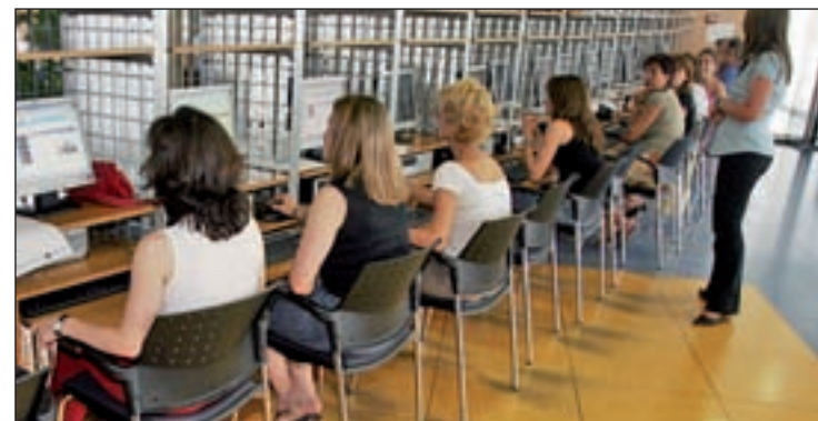
El plazo de preinscripción está abierto hasta el 24 de febrero

Preinscripciones a través de Empleo@colmenarviejo.com .