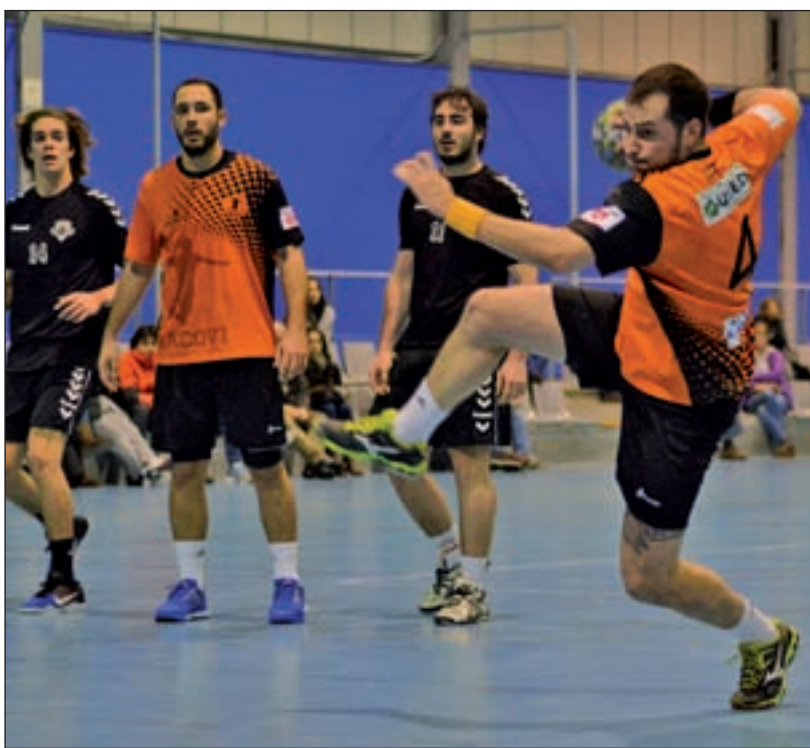
El Bacovi recibirá el próximo 28 de febrero al líder, el Maravillas.