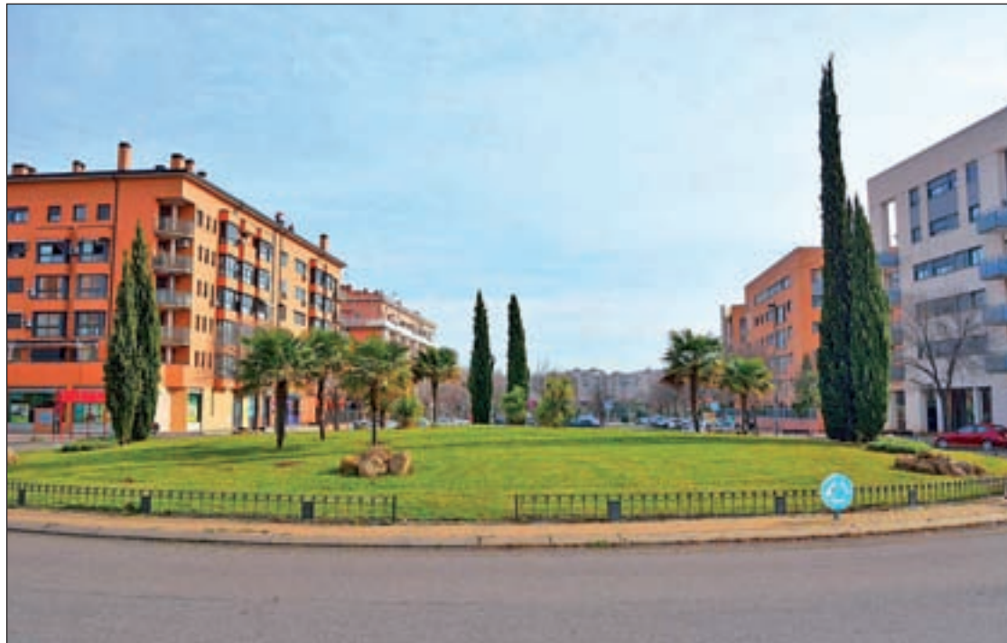
Una de las calles de Alcorcón

Con un descenso menos pronunciado encontramos municipios como Arganda (-1,39%), Alcalá de Henares (-1%), Collado Villalba (-0,84%), Madrid(-0,73%),