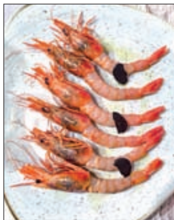
Gambas rojas del Mediterráneo

Lo mejor de cada mar. De eso se compone la carta del Chiringuito de El Señor Martín (calle Mayor, 31) que, desde su apertura en la primavera de 2015, se ha propuesto llevar al centro de la capital lo mejor de las costas españolas. Así, los platos están distribuidos en tres menús degustación enfocados a recorrer el Atlántico, el Mediterráneo y el Cantábrico a través de sus productos más emblemáticos: mejillón del Atlántico, langostino de Sanlúcar, vieira gallega o rape salvaje del Medite-