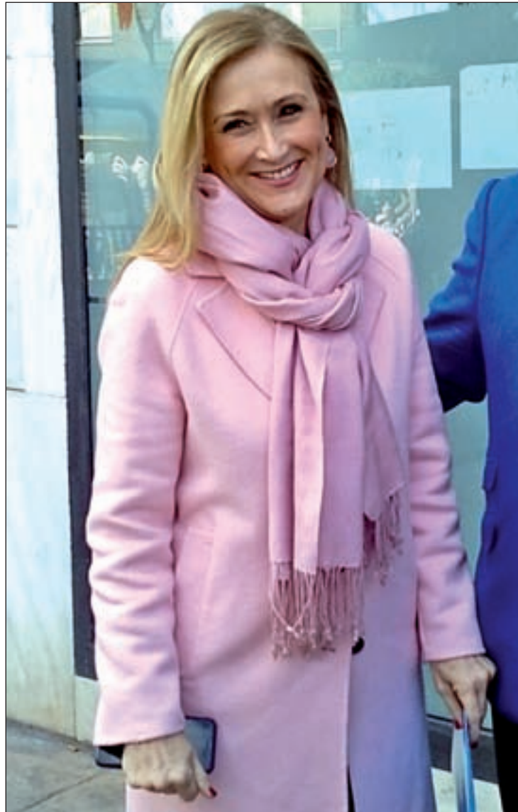
Cifuentes visitó Getafe tras conocerse que presidirá la gestora

De esta forma, se enteraba Rajoy de la decisión de la expresidenta de la Comunidad. Sin embargo, fue a través de los medios de comunicación como el presidente del Gobierno en funciones conoció que Ignacio González había dimitido hace semanas de su cargo como secretario general del PP de Madrid. "Nos hemos ente-