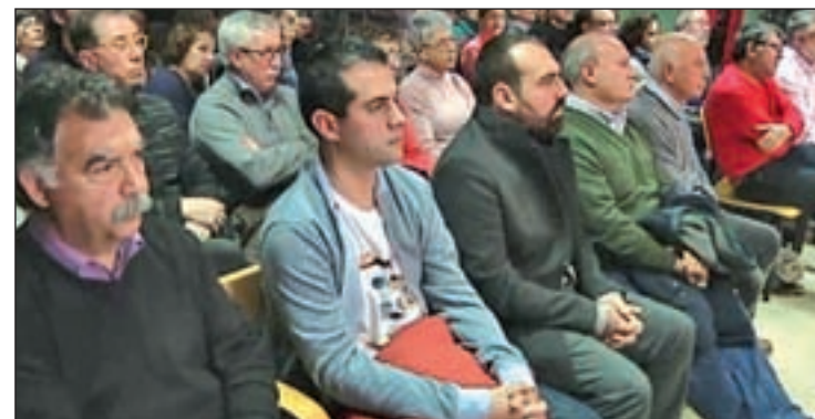
Pedían 60 años de prisión para ellos