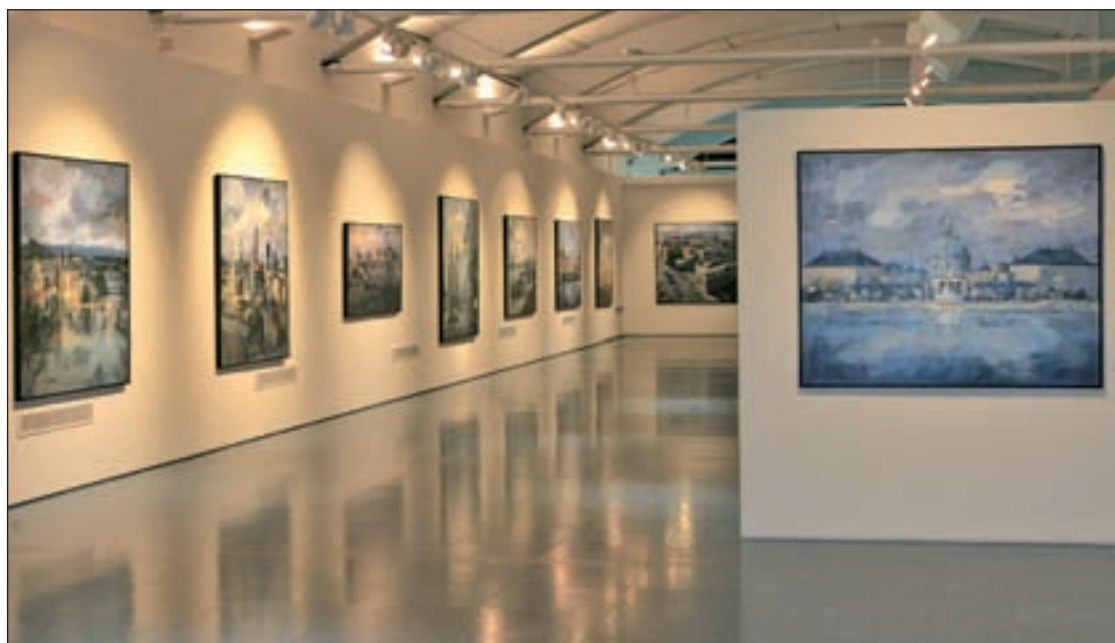
La muestra 'La Unión Europea, nuestras Ciudades'

Más información e inscripciones en la web municipal colmenarviejo.com .