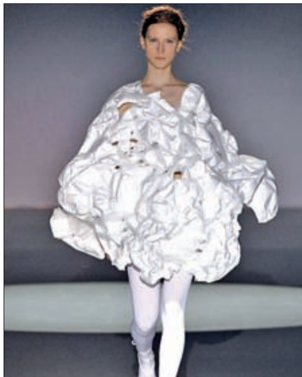
Diseño de Ela Fidalgo

Mikel Colás fue otro de los diseñadores que hizo lo propio mostrando unas prendas de cortes irregulares y asimétricos en una paleta cromática que pasa desde los melocotones y los rosas