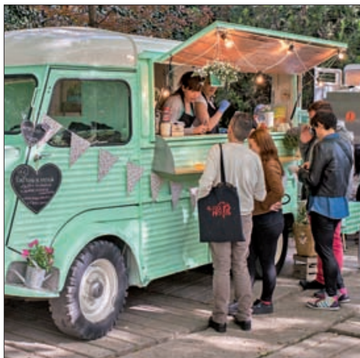
En el 'food truck' de Lucia's se degustarán diferentes tortillas

Entre los platos que se podrán degustar, están las papas arrugadas con mojo picón y vino blanco de Canarias; de Asturias, los cachopos, faces con pantrucu y sidra na-