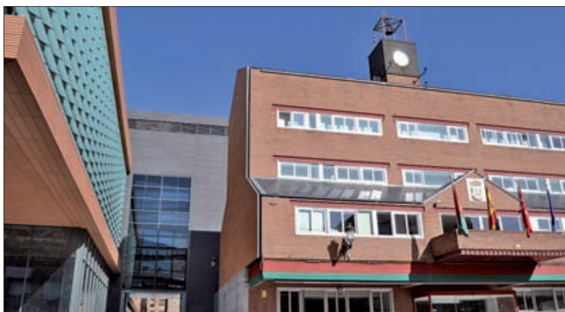
Ayuntamiento de Alcorcón

La compañía ha adaptado la obra al lenguaje de los más pequeños con el objetivo de que los niños pueden entender el texto del escritor y aviador francés Antoine de Saint-Exupéry. "Nos queremos dirigir a ellos, pero también a todos los que tienen aún vivo al niño que llevan dentro, para decirles que la vida es un viaje del que hay que disfrutar, y en el que seguro encontramos compañeros que van a acompañarnos y a hacérselo más fácil", han indicado. El Principito habla de un viaje, de la amistad, de la necesidad que tenemos de los otros, y de todo lo bueno que tiene ser diferente.