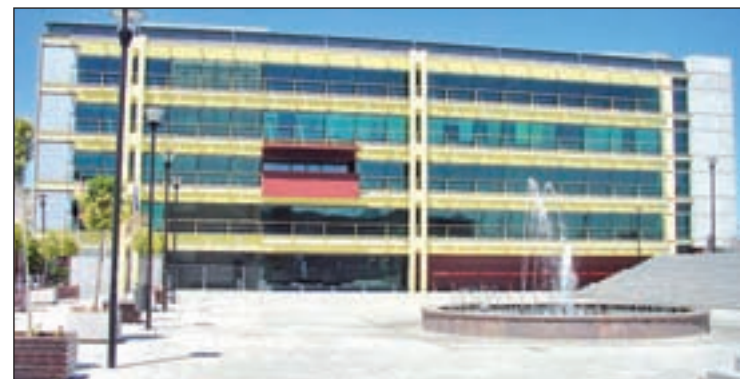
Fachada del Ayuntamiento de Fuenlabrada

Leganés, por su parte, aumentó el plazo desde los 64 hasta los 90 días de media.