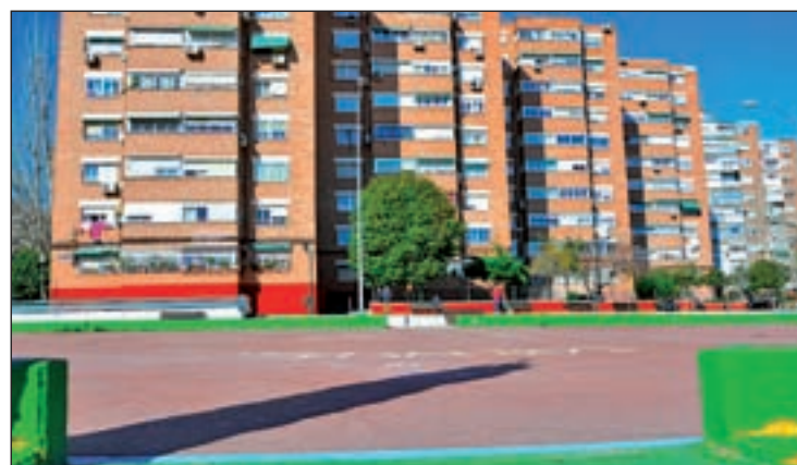
Canchas de baloncesto donde se traficaba con drogas

de “posibles incidencias” en un espacio alquilado por un grupo de jóvenes, varios de ellos menores de edad. Se da la circunstancia de que el local no contaba con el seguro perceptivo de responsabilidad civil obligatorio, ni tenía personal de control de accesos, ni la acreditación correspondiente, además de que se estaba exponiendo y vendiendo alcohol en presencia de menores. Las infracciones por estos hechos califica-