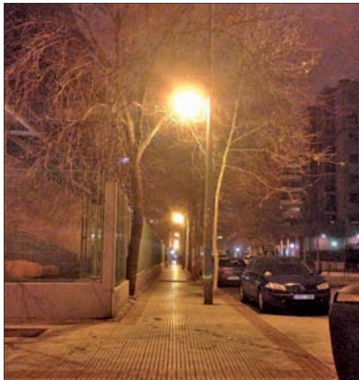
Una de las calles de Alcorcón

El objetivo de esta doble iniciativa es dotar, en el menor plazo