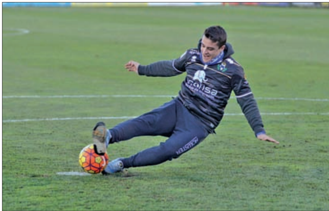
Uno de los participantes de la nueva iniciativa del Club PRENSA ADA

Para participar es necesario seguir las cuentas de Twitter del club (@AD_Alcorcon) y de Ecotisa (@Ecotisa_) y "confiar en ser elegido" en el sorteo que se celebrará pocas horas antes del choque. "Lo que ya no es tan simple es rematar a puerta porque tendrán que hacerlo después de dar diez vueltas sobre uno mismo. Disparar con precisión a portería cuesta lo suyo", han insistido las mismas fuentes. El que acierte se llevará una impresora a casa, además del reconocimiento de la gra-