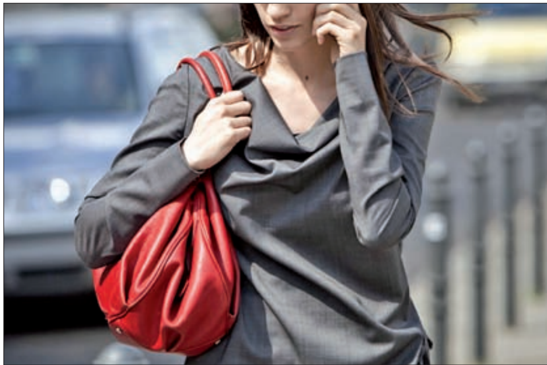
Las llamadas se hacen al azar y normalmente en horario de tarde GENTE

Las llamadas son indiscriminadas, preferiblemente a hijos. Los investigadores señalan que cuando una llamada tiene resultados positivos, los delincuentes siguen con números sucesivos, lo que explica que muchas víctimas se concentren en los mismos barrios