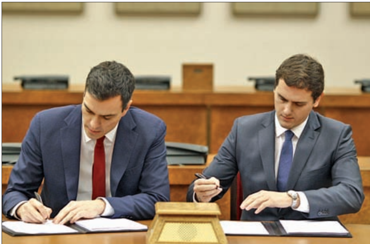
Pedro Sánchez y Albert Rivera firmaron el acuerdo el pasado miércoles