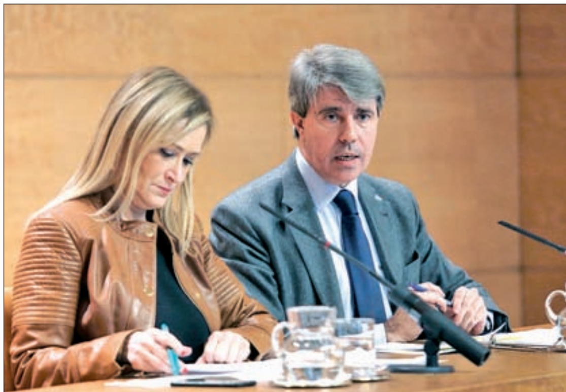
Cristina Cifuentes y Ángel Garrido, en rueda de prensa tras el Consejo de Gobierno de la Comunidad

“Me he querido rodear de personas con experiencia para buscar la integración de todos porque en esta nueva etapa queremos sumar, integrar a todos y estos a su vez van a tener la tarea de formar