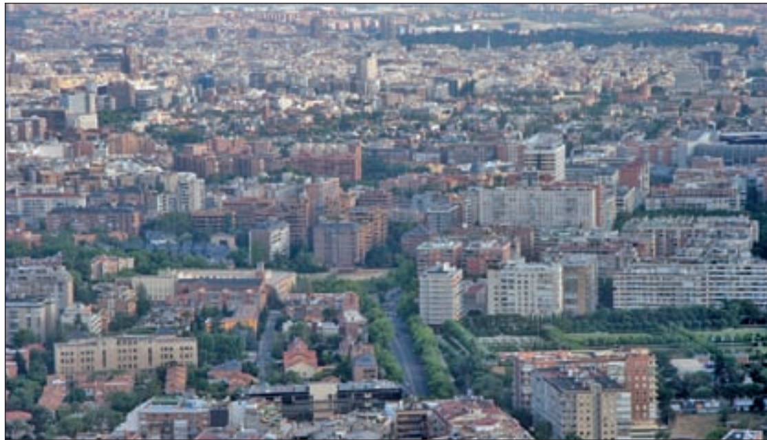
Madrid cuenta con menores tributos también en Sucesiones y Patrimonio