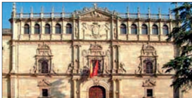
Universidad de Alcalá