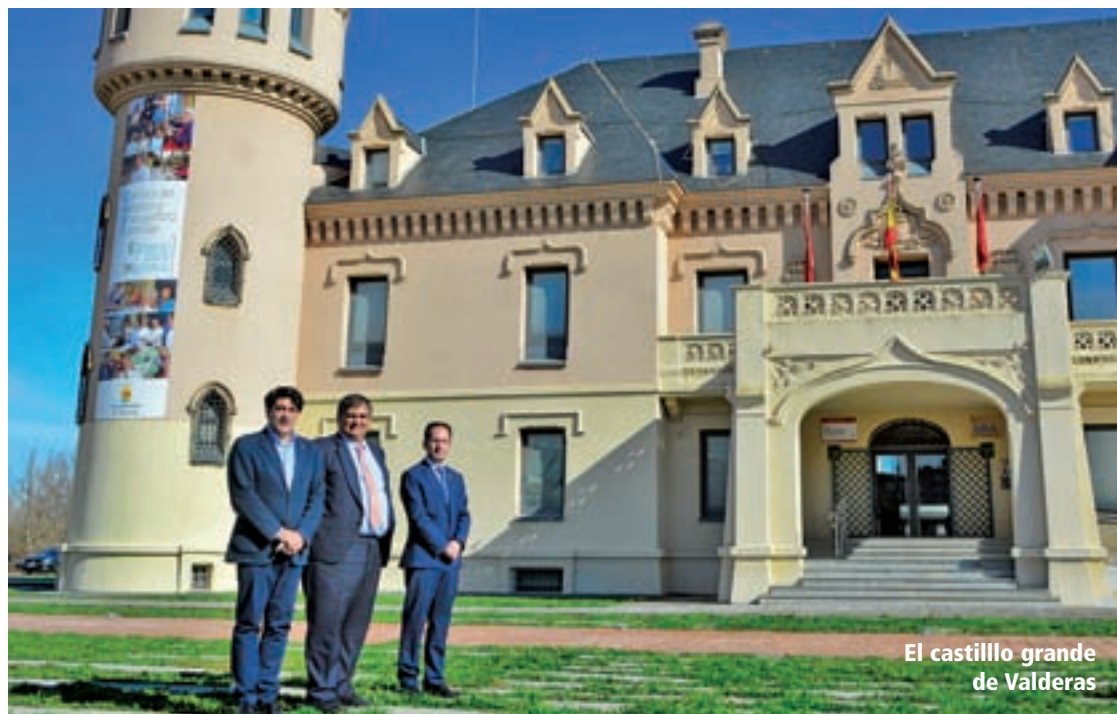
El castillo grande de Valderas

Entre las iniciativas de carácter histórico, formativo, lúdico y festivo, enfocada para toda la familia, que el Consistorio espera que se puedan llevar a cabo los próximos meses, “siempre con la connivencia de las asociaciones y vecinos de la zona”, destaca la recreación histórica del año 1917, según han afirmado fuentes municipales. “Queríamos hacerlo en enero del próximo año porque en 1916 se iniciaron las obras del