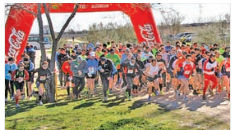
Una de las carreras solidarias que se hacen en Alcorcón