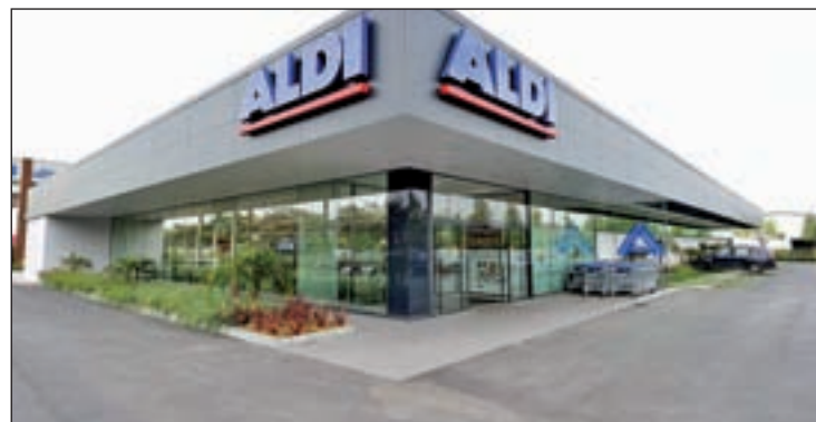
Uno de los supermercados ALDI

La tienda contará con una superficie de 1.200 metros cuadra-