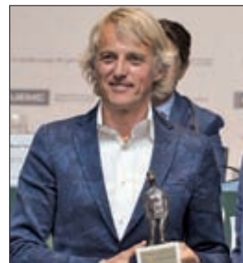
El premiado, Jesús Calleja

de Castilla y León. El jurado encargado de elegir al Personaje Público de Castilla y León que mejor Comunica estuvo formado por 50 directores de medios de comunicación de la región, entre los que se encuentra el Grupo Gente con sus ediciones en Castilla y León (Gente en Valladolid, Gente en