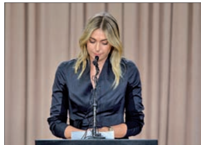
La jugadora rusa, en su comparecencia del pasado lunes