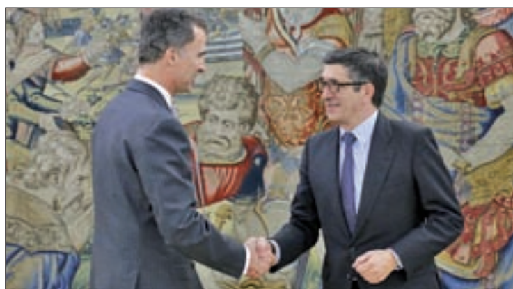
El presidente del Congreso informó al Rey el pasado lunes

Tras la Comisión Permanente de la Ejecutiva Federal del pasado lunes, el secretario general del PSOE insistió en que, a partir de ahora, negociará con el resto de partidos junto a Ciudadanos, tomando como base el acuerdo que