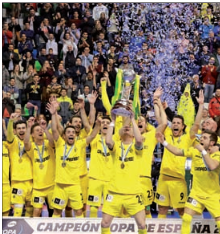
El equipo andaluz, el gran ausente de esta edición