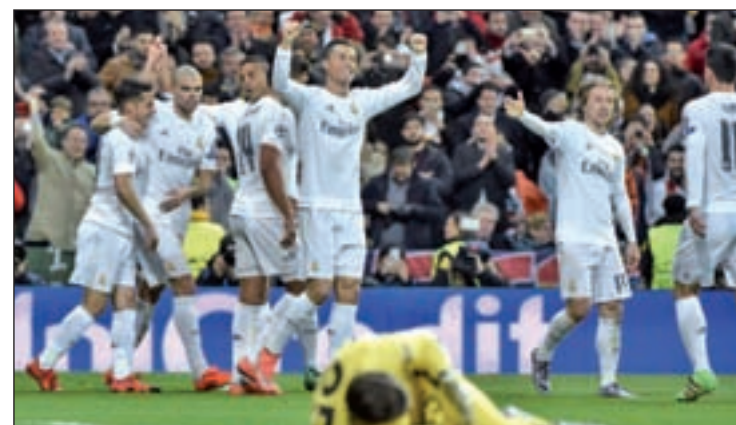
El Real Madrid eliminó a la Roma

Madrid y al FC Barcelona. Los azulgranas cuentan a su favor con el 0-2 conquistado en Londres, un resultado que decanta un poco más si cabe la eliminatoria. A la efectividad goleadora exhibida por Messi, Neymar y Luis Suárez, hay que añadir las numerosas bajas con las que cuenta el Arsenal y que, probablemente, obligarán a Arsene Wenger a alinear un once de circunstancias. Recientemente, el cuadro ‘gunner’ ha visitado en dos ocasiones el Camp Nou y en ambas salió derrotado con cierta claridad: 4-1 en la tempo-