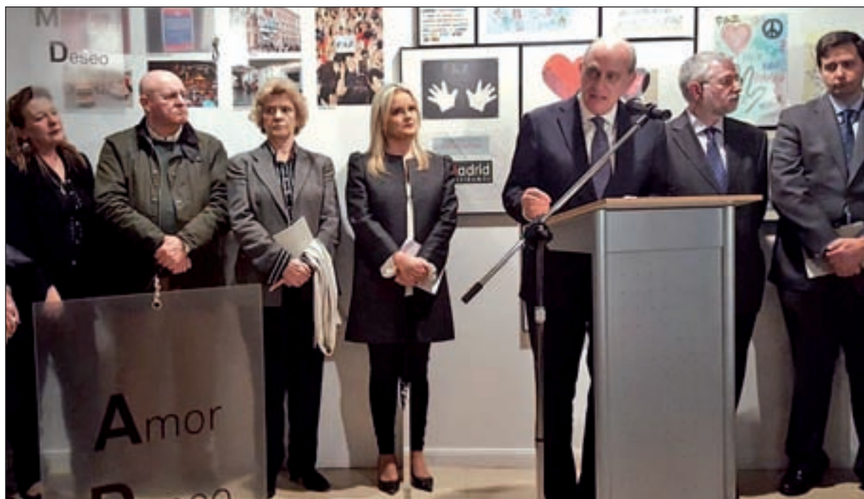
El ministro del Interior en funciones, Jorge Fernández Díaz, durante su intervención