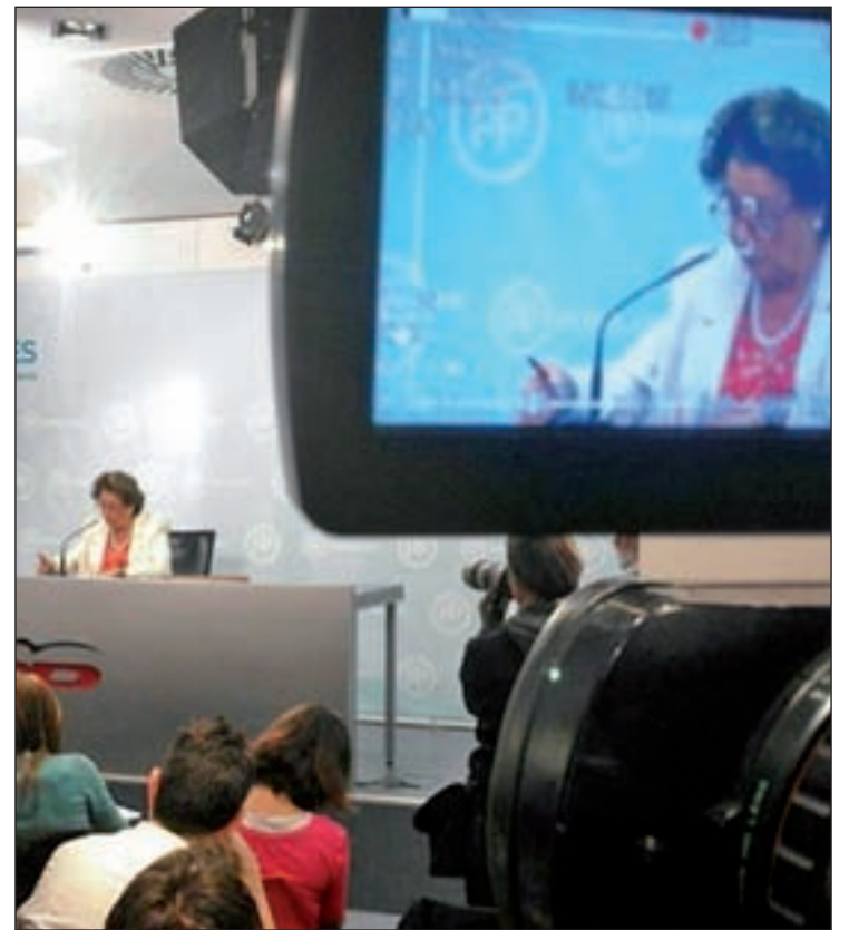
La ex alcaldesa de Valencia Rita Barberá en una rueda de prensa

Los españoles que definen la situación económica como "mala o muy mala" han aumentado, rompiendo la tendencia descendente de los últimos sondeos. Concretamente han pasado de un 61,9%