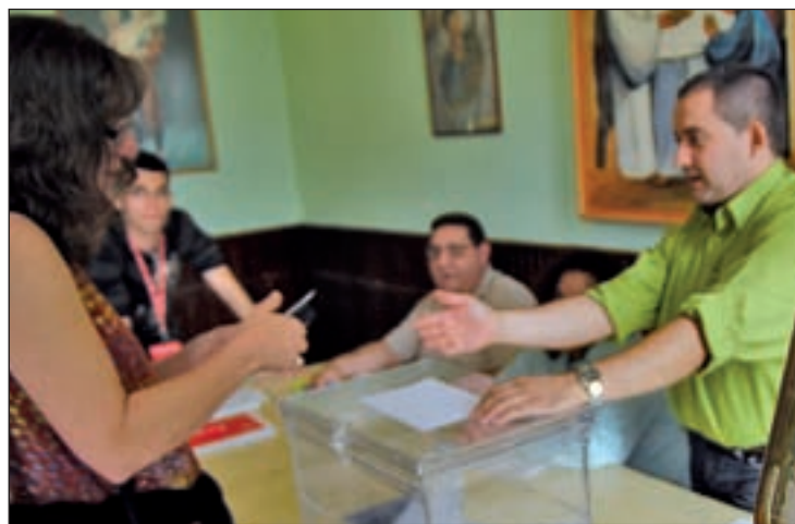
El escrutinio costó 12,8 millones de euros

Sin embargo, a estas cantidades hay que sumar lo que se destinan los partidos a ‘vender’ a sus candidatos, para lo cual reciben importantes subvenciones públicas según los votos y los escaños que lograron en la anterior cita con las urnas. Es decir, los resultados de