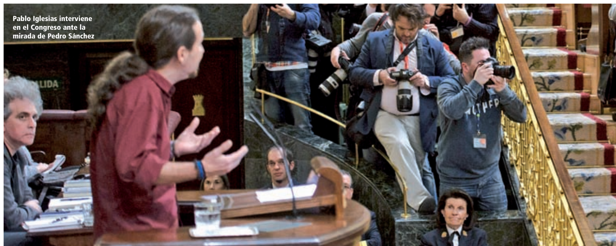
Pablo Iglesias interviene en el Congreso ante la mirada de Pedro Sánchez