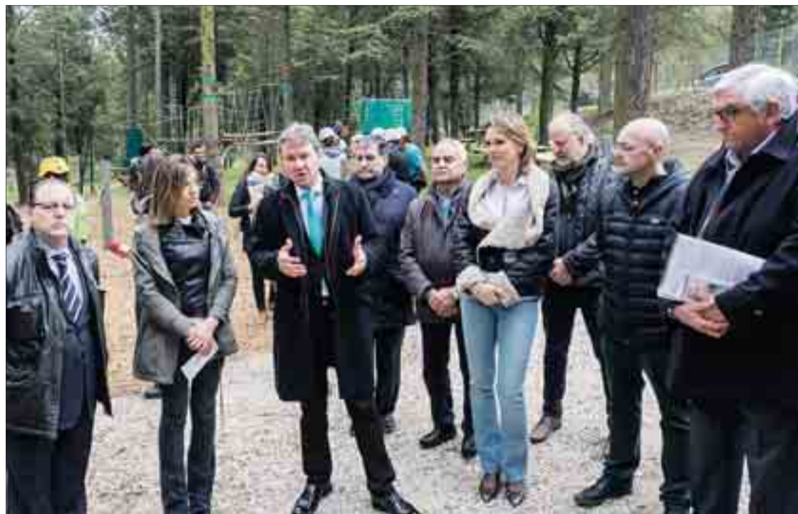
El espacio de tiempo libre fue inaugurado el día 7 y algunos grupos tuvieron la oportunidad de probarlo.

Por su parte, el presidente de la Fundación CISA, Fulgencio Villafáfila, definió el Parque de Cuerdas como "un espacio natural que reúne una de las situaciones de integración". Así, explicó, y en la misma línea que el alcalde, que el equipamiento cumple los requisitos de proporcionar recreo, generar puestos de trabajo y ayudar al colectivo de Aspanias. "Mostrar a la ciudadanía las posibilidades que estos chicos pueden desarrollar es un buen exponente para que poco a poco vayan cayendo esas barre-