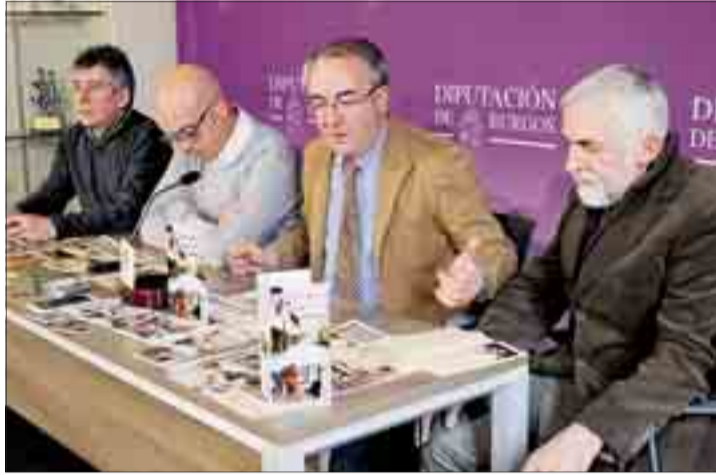
Las jornadas fueron presentadas por sus responsables el martes 5.