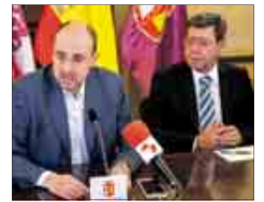
Los responsables de ambas instituciones renovaron el acuerdo el día 7.