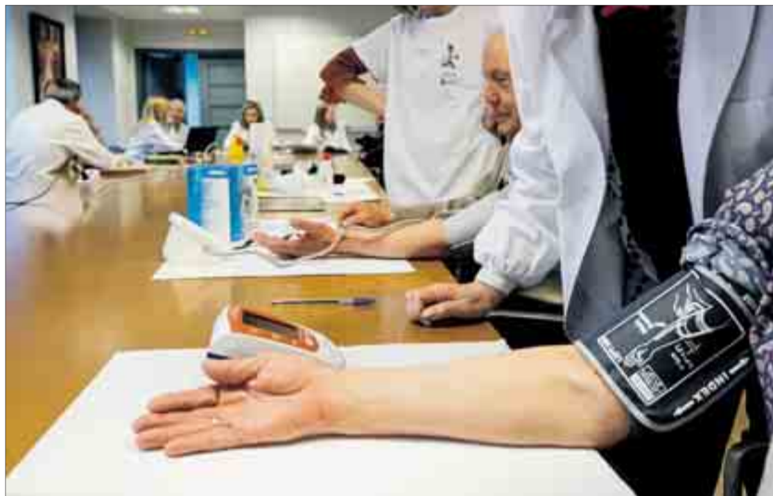
La sala de Juntas del Teatro Principal acogió el jueves 7 un taller sobre factores de riesgo y prevención de la diabetes del adulto.