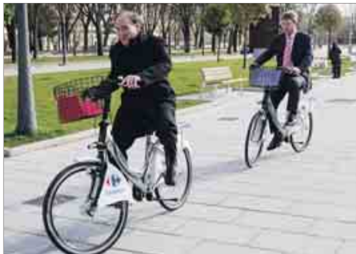
El alcalde no dudó en subirse a la bici al presentar los nuevos vehículos.

La reposición de las bicidetas ha supuesto una inversión de casi 50.000 euros (450 por unidad) y se trata de un servicio -añadió el regidor- cuyo coste de mantenimiento asciende a 70.000 euros al año. Por otro lado, precisó