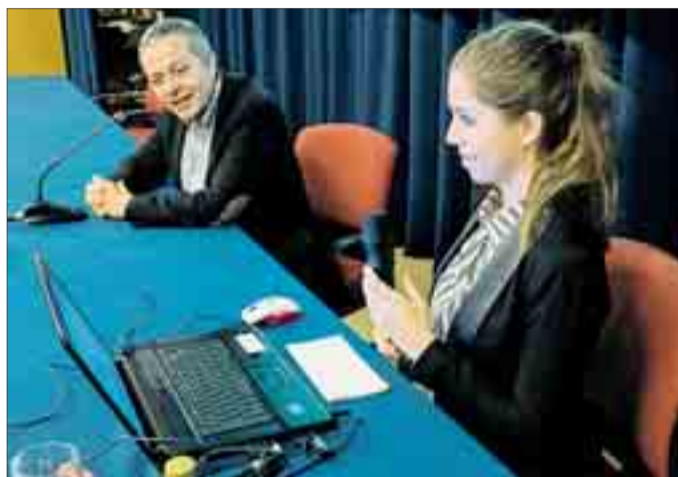
La presentación del proyecto tuvo lugar en la UBU el lunes 4.

Los participantes, divididos en grupos de tres, compiten a su vez con otras cuatro universidades públicas (Madrid, Valencia, Zaragoza y Córdoba) y antes de comenzar el concurso recibirán una formación gratuita en geomarketing y técnicas de comunicación y negociación. Tras ello, serán los propios concursantes los que tengan que contactar con los negocios de su