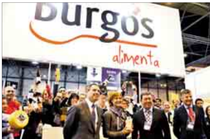
La ministra de Agricultura, Isabel García Tejerina, en el expositor burgalés el día 4.

Durante la jornada inaugural, la ministra de Agricultura, Alimentación y Medio Ambiente en funciones, Isabel García Tejerina, visitó el expositor de Burgos Alimenta, y valoró el "esfuerzo de la Diputación de Burgos a la hora de arropar a los industriales y proporcionarles una plataforma de promoción tan importante" en el Salón. El pre-