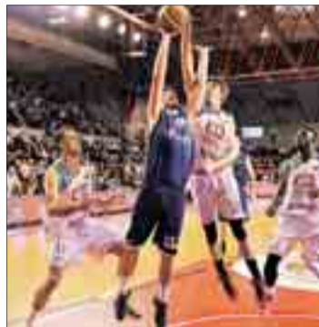
San Pablo tendrá el factor cancha en la primera ronda.

El San Pablo Inmobiliaria, con la clasificación para el playoff en el bolsillo, buscará una nueva victoria para asegurar la tercera plaza ligera. Los jugadores dirigidos por Diego Epifanio visitan la complicada cancha de Pumarín del Unión Financiera Oviedo (viernes 8 a las 21.00 horas). Los asturianos también están realizando una gran campaña y son cuartos en la tabla con una victoria menos que los burgaleses. Las opciones de alcanzar la tercera plaza por el equipo entrenado por Carles Marco pasan por ganar en la noche del viernes