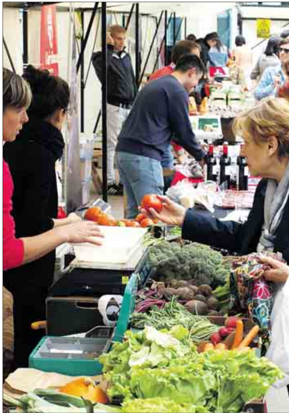
La asociación pone en valor la venta de cercanía, aquella que se produce entre productores y consumidores.

Se puede ir más allá, hasta los minerales. El presidente señala el caso de la sal de Pozo, que se consume muy poca data de la época prerromana y ahora no existe allí ningún puesto de trabajo. "Si la gente consumiera sal de Pozo, en vez de sal de las salinadoras de Valencia, pues habría gente trabajando y supondría empleo y riqueza para Burgos", se lamenta. La antigüe-