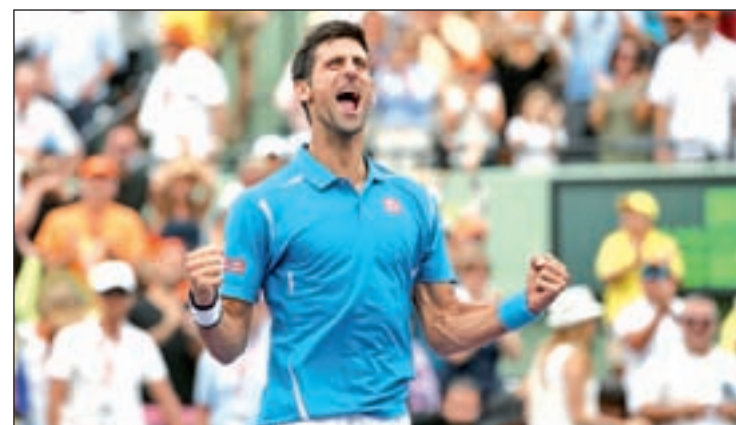
Djokovic, celebrando su triunfo en Miami

Sin embargo, en los últimos años se está produciendo un cambio en la tendencia. Wawrinka y Djokovic se han encargado de destronar a Nadal, quien ya no parte como favorito indiscutible en la edición que arrancará este domingo día 10. El propio jugador balear aseguraba esta semana que "está siendo imposible parar a Djokovic", lo que refleja la