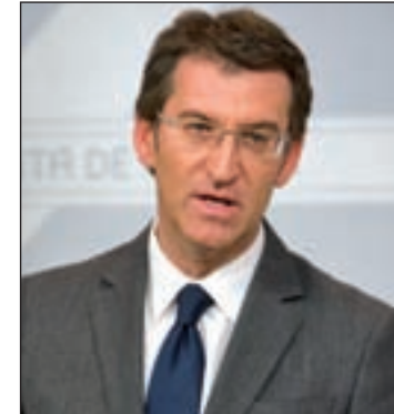
Alberto Núñez Feijóo

Durante su intervención ante la Junta Directiva Regional de los populares gallegos, el líder autonómico dijo que no se presenta "para que todo siga igual", sino con la intención de "no ser un candidato de manual". "Para bien o para mal, soy Alberto Núñez Feijóo", sentenció.