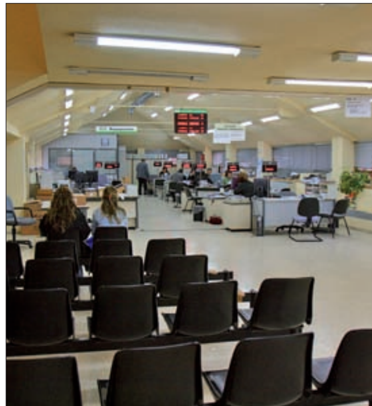
Oficina del Servicio Público de Empleo GENTE

También hubo un comportamiento homogéneo en las afiliaciones de la Seguridad Social, que subió igualmente en todas las regiones de nuestro país, excepto en la ciudad autónoma de Ceuta, especialmente en las comunidades