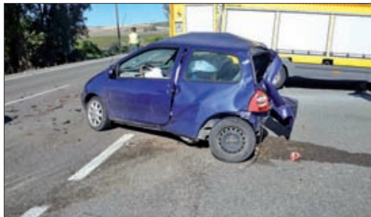
En el primer trimestre se han producido 240 accidentes

La DGT precisa que este marzo, en el que se ha celebrado la Semana Santa, se ha producido el mayor número de desplazamien-