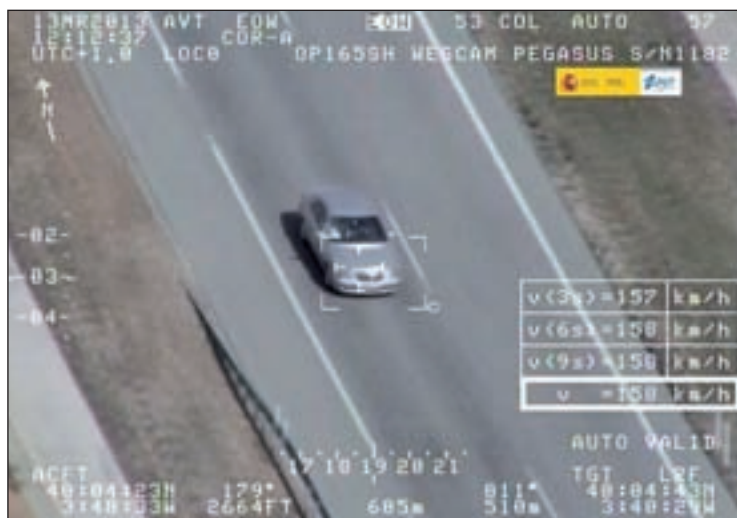
El aumento de las multas en las carreteras españolas fue del 33,7%

MULTAS ESTUDIO DE AUTOMOVILISTAS EUROPEOS