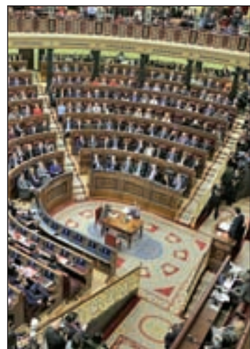
Pleno del Congreso

No obstante, es complicado que la iniciativa culmine su tramitación de no haber gobierno en este mes, ya que es previsible que los populares, al contar con mayoría absoluta en el Senado, intenten ralentizar su tramitación al máximo. Disponen de dos meses para procesar una iniciativa.