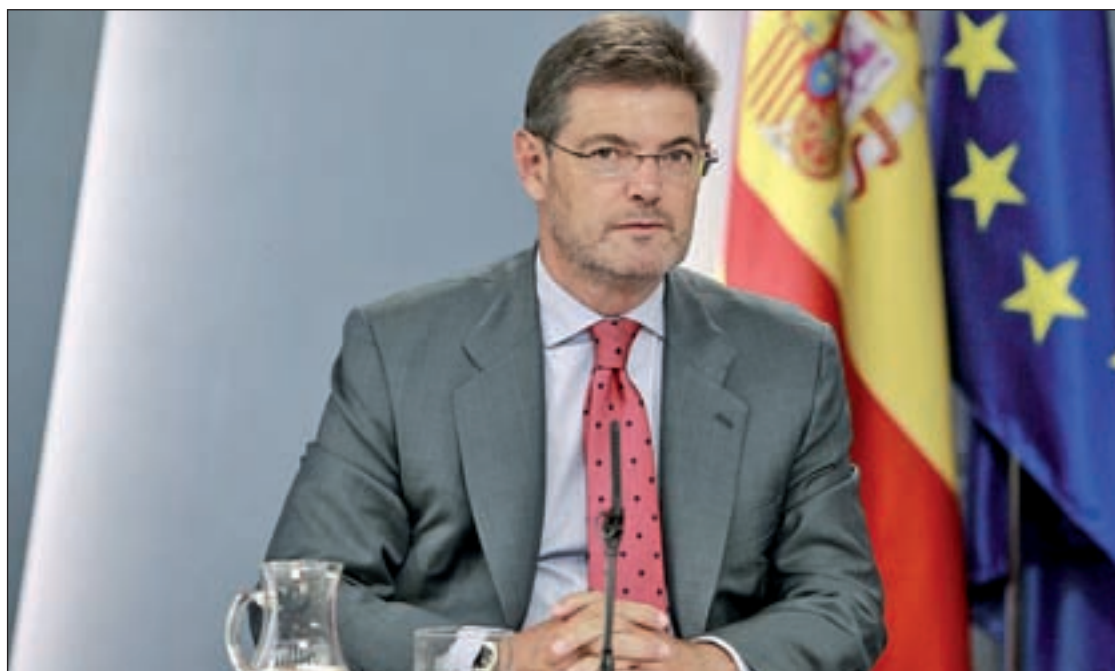
Rafael Catalá, ministro de Justicia en funciones