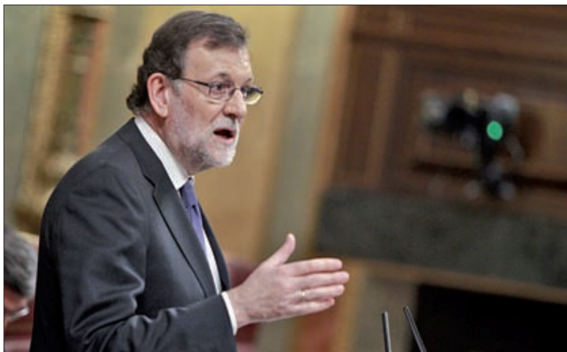
Mariano Rajoy, ante el Pleno del Congreso de los Diputados

Según afirmó, en la preparación de aquel acuerdo que se selló con el pacto con Turquía que permite devolver allí a cuantos refugiados y migrantes alcancen suelo europeo desde su territorio, una vez