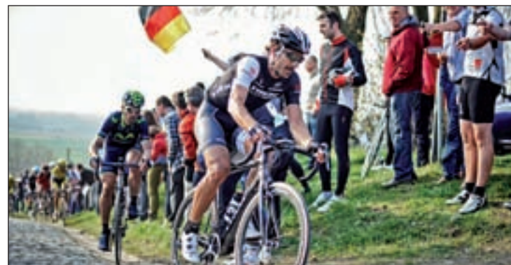
Cancellara, uno de los candidatos a la victoria

La nota curiosa de esta edición es el cambio de los horarios habituales, supeditados a los trayectos de los trenes que discurren por el paso a nivel que deberá cruzar el pelotón.