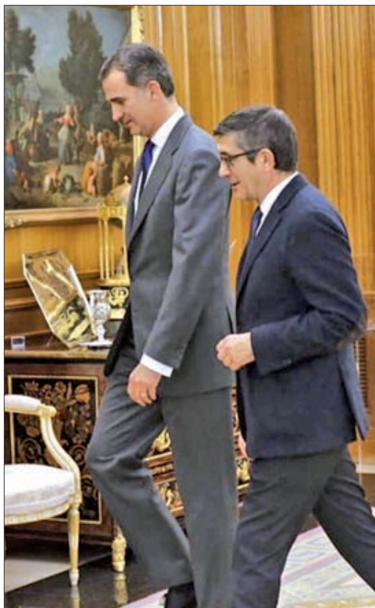
El Rey y el presidente del Congreso convocarían las elecciones

Además, el debate de investidura tendría que empezar un día antes, al menos el viernes 29 de abril. Dicho Pleno no se convoca con una hora de antelación, sino que al menos hay que reservar un día para que los diputados se aseguren que pueden viajar a Ma-