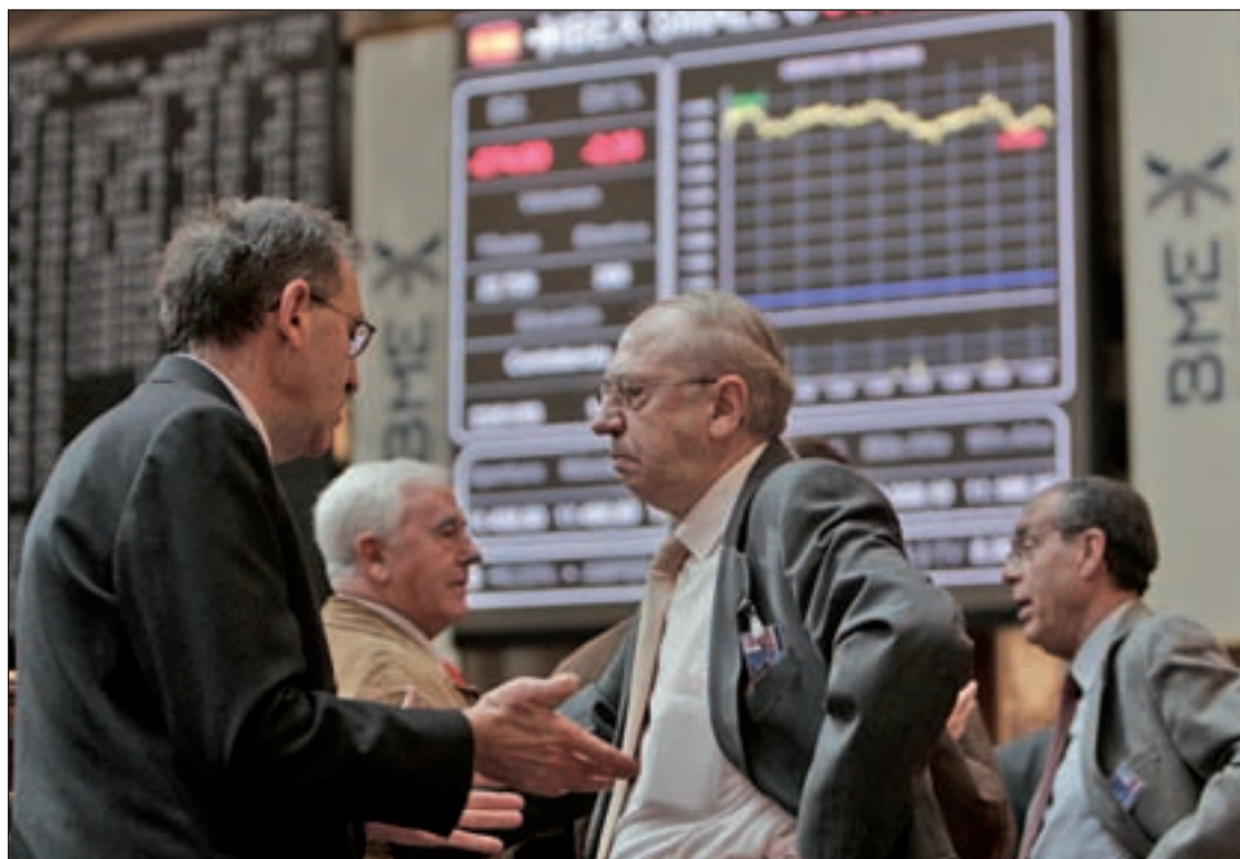
El riesgo de reversión de las reformas pone en duda la recuperación económica

Entre las dos principales razones de este frenazo económico se encuentran, según Axesor, la pér-