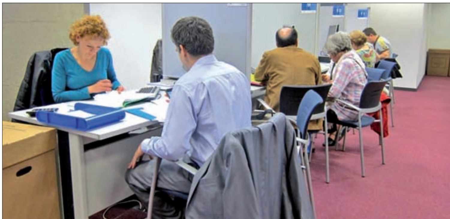
La campaña comenzó el pasado miércoles día 6 de abril