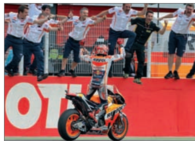
El piloto de Honda se impuso en Argentina

Para este exigente torneo Cadenas ha citado a 16 jugadores, una convocatoria en la que destaca el regreso del canario Daniel Sarmiento. La mala noticia ha sido la baja de última hora de uno de los pilares defensivos de la selección. El guardameta Arpad Sterbik se autodescartó para este Preolímpico, a causa de los problemas que viene arrastrando durante toda la temporada en la espalda, que le repercuten también en las rodillas. Ante esta ausencia, España deberá apelar a la pujanza de Gonzalo Pérez de Vargas y Rodrigo Corrales.