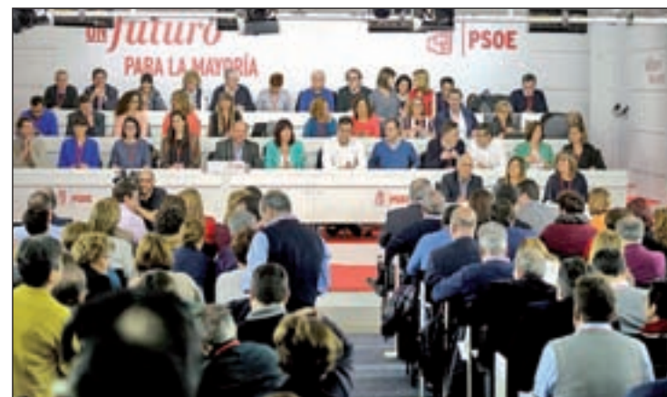
Reunión del Comité Federal del PSOE en Ferraz

La líder del PSOE andaluz, Susana Díaz, dijo sentirse "cómoda" con un gobierno "que quepa en la resolución del 28 de diciembre y