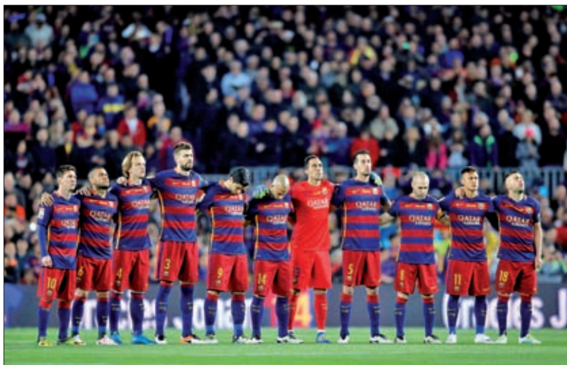
Los hombres de Luis Enrique se juegan la temporada en pocas semanas

Para abrir boca, el Barcelona visita el campo de la Real Sociedad (20:30 horas), uno de los estadios que peor se le han dado al conjunto de Luis Enrique en los últimos años. De hecho, desde que el conjunto donostiarra ascendiera de Segunda División en 2010, el Barça no ha sido capaz de llevarse los tres puntos de Anoeta, con un bagaje de cuatro derrotas y un empate. Si a este balance negativo se le suman la derrota en el 'Clásico' del pasado sábado y el desgaste que supone su eliminatoria de la Liga de Campeones con el Atlético de Madrid, no sería extraño que el líder de la Liga perdiera parte de su ventaja respecto a perseguidores como el propio Atlético o el Real Madrid. En cambio, si el Barcelona logra