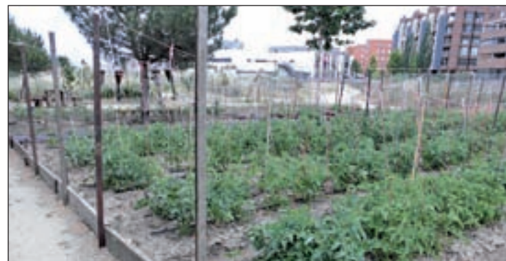
Uno de los huertos urbanos existentes en la capital

tivo de dar un impulso a este tipo de agricultura en el municipio. El Gobierno municipal contempla esta actividad desde la perspectiva de los beneficios ambientales, sociales y educativos, y valora su transcendencia en la consolidación de Madrid como una ciudad más sostenible.