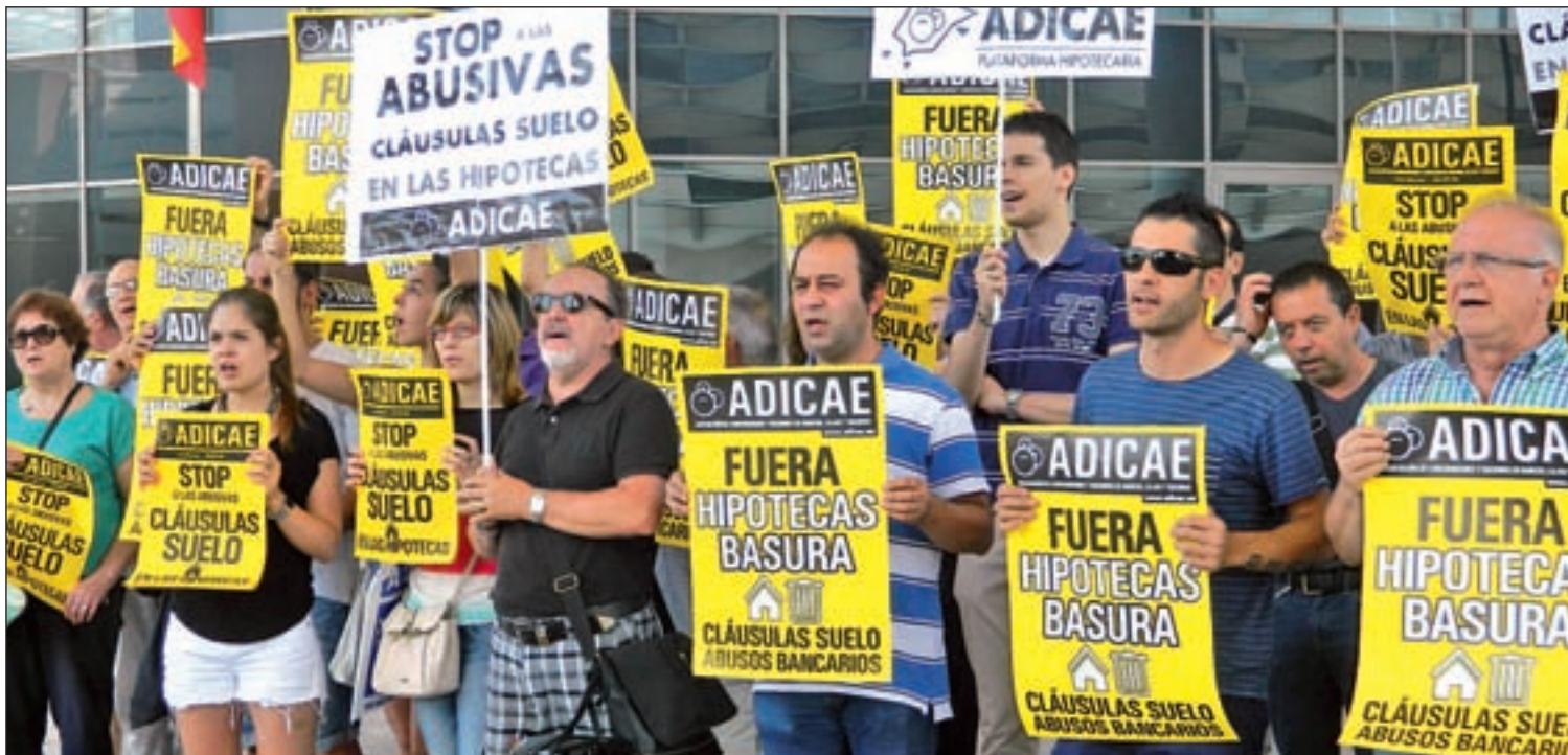
Protestas de los afectados por las cláusulas suelo