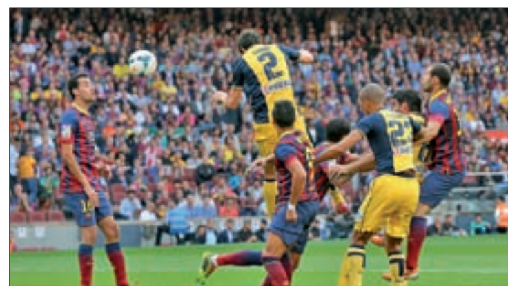
El Atlético aún sueña con revalidar el alirón de 2014

afronta una semana clave, con tres jornadas en un espacio de siete días. Este sábado 16 (16 horas), el Real Madrid jugará en el campo del Getafe, mientras que el Atlético recibirá en la tarde del domingo (18:15 horas) al Granada, con el objetivo de meter presión a un Barcelona que cerrará la jornada ante el Valencia.