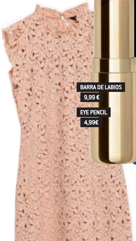
ZARA 49,95 €

El color estrella de este año es el rosa cuarzo, como este vestido de tubo por la rodilla.