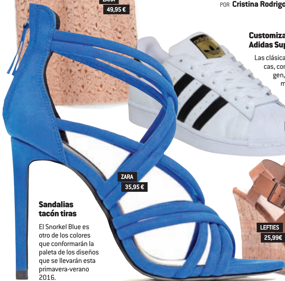
ZARA 35,95 €