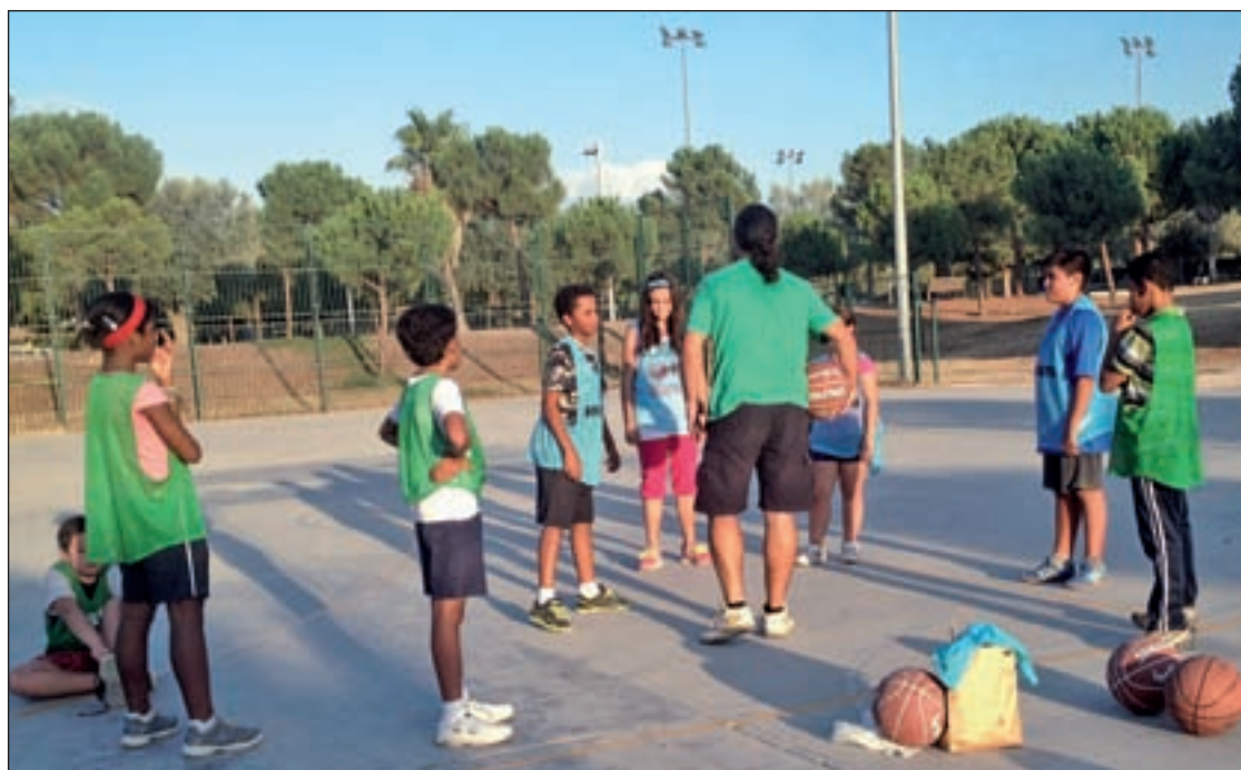
Varios integrantes de la escuela, en una de las pistas del barrio de San Fermín

El dirigente ciudadano asegura que, durante los casi dos meses