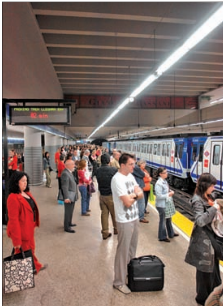
Instalaciones de la Línea 1 de Metro GENTE

La previsión inicial consiste en implantar tres recorridos, cada uno de ellos con un número de autobuses asignados y con una frecuencia. En el tramo comprendido entre las estaciones de Plaza de Castilla, habrá nueve autobuses que pasarán cada 3,5 ó 4 minutos de media. En el que transcurre entre Atocha Renfe y