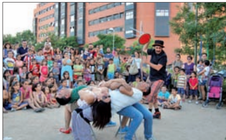
Una de las actividades lúdicas, en el barrio de Butarque AVIB

Los vecinos de Villaverde tendrán la posibilidad de volver a vivir sus tradicionales fiestas de barrio, tras varios años en los que los festejos promovidos por el Consistorio de la capital se realizaron de forma unificada o simplemente no se llevaron a cabo. La Junta Municipal ha decidido recuperar unas celebraciones que ya tienen fechas y recintos oficiales tras su aprobación definitiva en el Pleno del distrito. En su organización colaborarán las entidades sociales a través de la creación de un comisión.