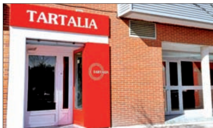
Local de Tartalia

A pesar de esta variedad, la oferta de Tartalia se presenta muy bien estructurada y permite un mode-