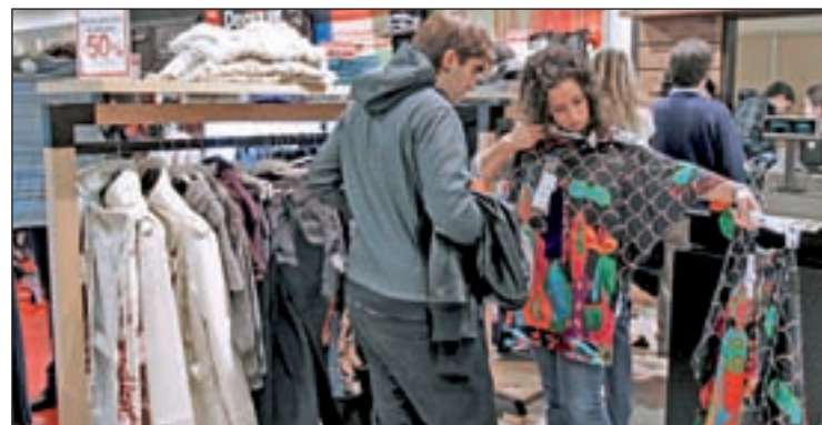
Tienda de ropa en Madrid GENTE

¿Tiene el Parlamento regional competencias para tomar este tipo de decisiones en el ámbito territorial de los ayuntamientos? ¿Quiénes serán los encargados de redactar el documento? Por lo visto, esta, nuestra Comunidad, no tiene otros asuntos más perentorios que solucionar.