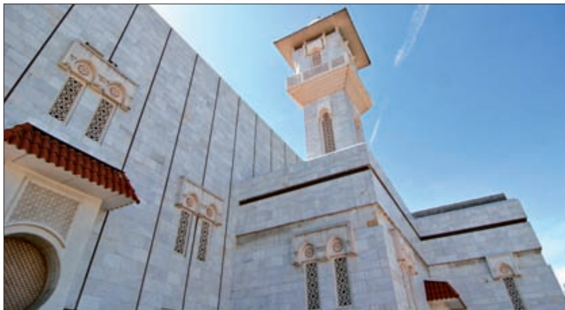
Mezquita de la M-30