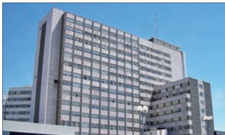
Las Urgencias se reforzarán GENTE

A ellas se sumarán las de facultativos de distintas especialidades, como geriatría, reumatología, alergología o dermatología, endocrinología y nutrición, angiología y cirugía vascular, cirugía plástica y reparadora, medicina nuclear, neurocirugía, urología, dermatología médico-quirúrgica y vene-