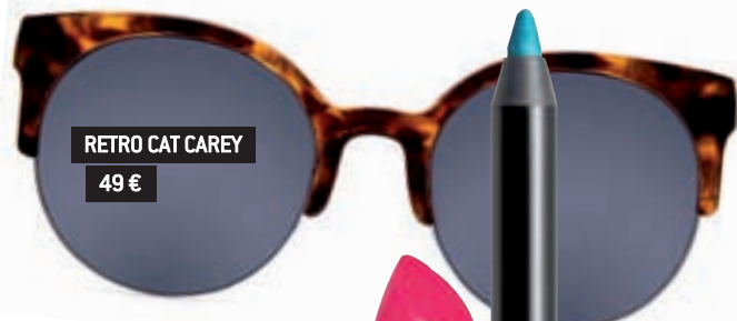
RETRO CAT CAREY 49 €