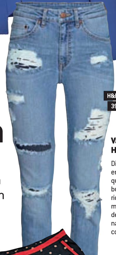
H&M 39,99 €