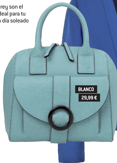
BLANCO 29,99 €

De líneas redondeadas y textura granulada, es un bolso práctico y con personalidad. En más colores.