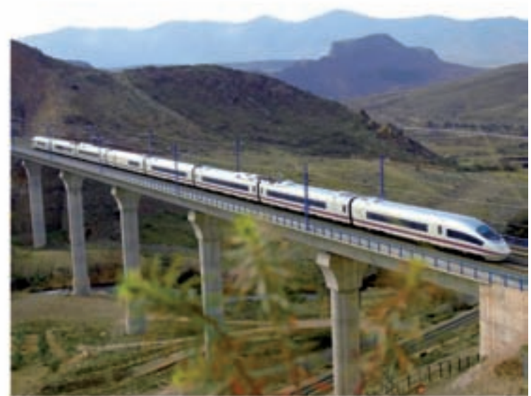
Renfe te lleva a los balnearios de Ourense desde Madrid y 40 ciudades más