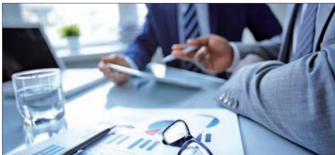
Hay que estudiar el contrato antes de firmarlo