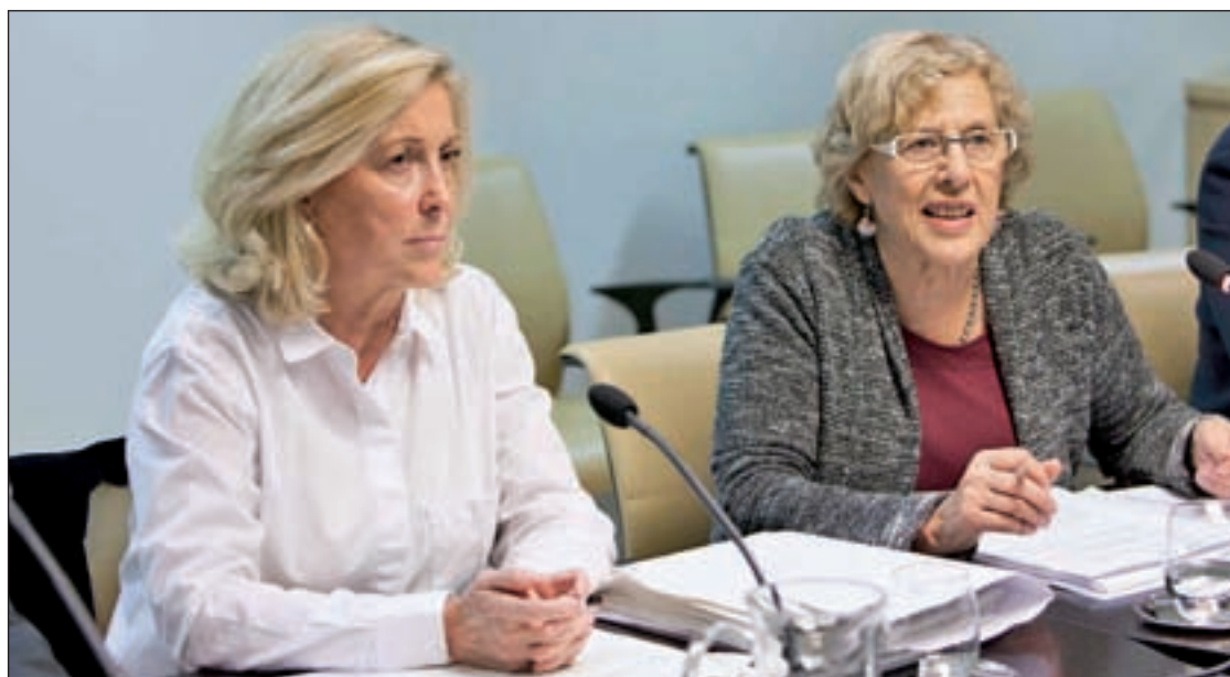
Concepción Dancausa y Manuela Carmena, durante la rueda de prensa

Otras actuaciones a tener en cuenta, a juicio vecinal, serían la construcción de una biblioteca municipal en Lucero, la instalación de una escalera mecánica de acceso a los centros de salud, de mayores y cultural desde la calle de Sepúlveda a la de Monsalpe, la creación de un casa de acogida para las mujeres maltratadas y con dificultades y también centros de día físicos para personas mayores especializados en las zonas de Lucero y Cármes. Además, solicitan un polideportivo con piscina cubierta en el antiguo campo de fútbol de Racing Garvin.