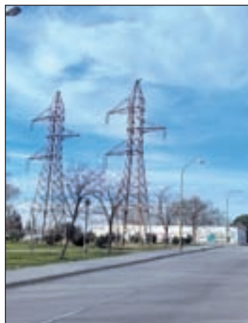
El espacio estancial

“La zona de juegos infantil está prácticamente impracticable y se ha convertido en zona para perros. Hay que evitar que los niños pequeños hagan uso sin poner en riesgo su higiene personal”, critica