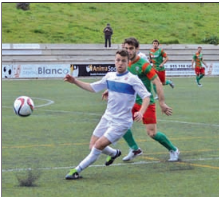
El Puerta Bonita vuelve a jugar ante sus aficionados

Instalados en la penúltima posición del grupo VII, los hombres de Paco Sáez no han terminado de plasmar la mejoría que mostraron semanas atrás, encajando una nueva derrota en la jornada