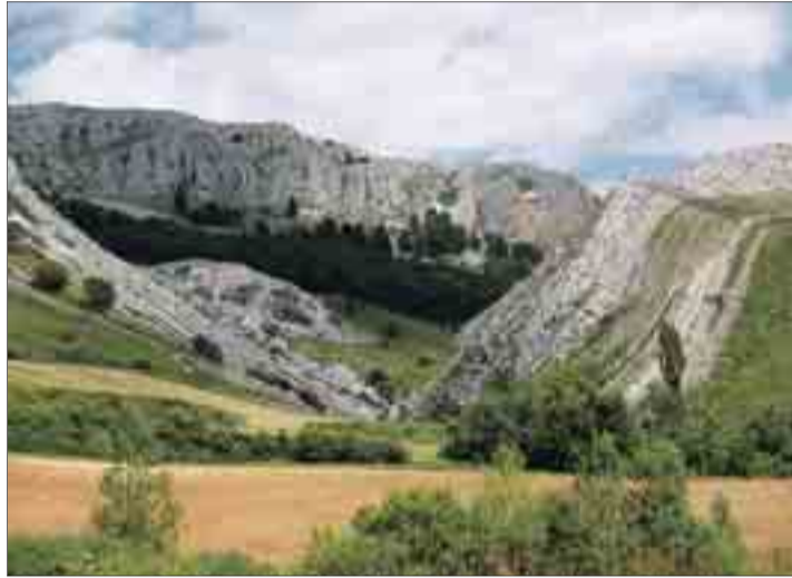
La Asociación para la Reserva Geológica de las Loras, ARGEOL, lidera el proyecto del geoparque. Empezó a trabajar hace diez años.

Actualmente, dieciséis municipios integran el territorio del proyecto Geoparque Las Loras, cinco de la provincia de Palencia -Aguilar de Campoo, Alar del Rey,