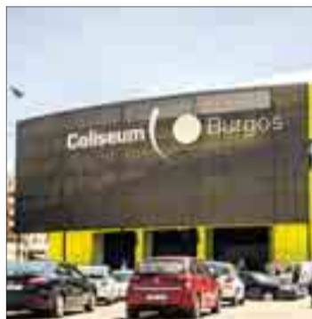
El Coliseum se presupuestó en 5,5M€.

senta la UTE constructora, según relató Fernández Santos, es que para ella, “amparándose en la legislación vigente, la recepción de la obra se hizo el 26 de junio de 2015 y, por lo tanto, no procede hacer ninguna nueva recepción”.