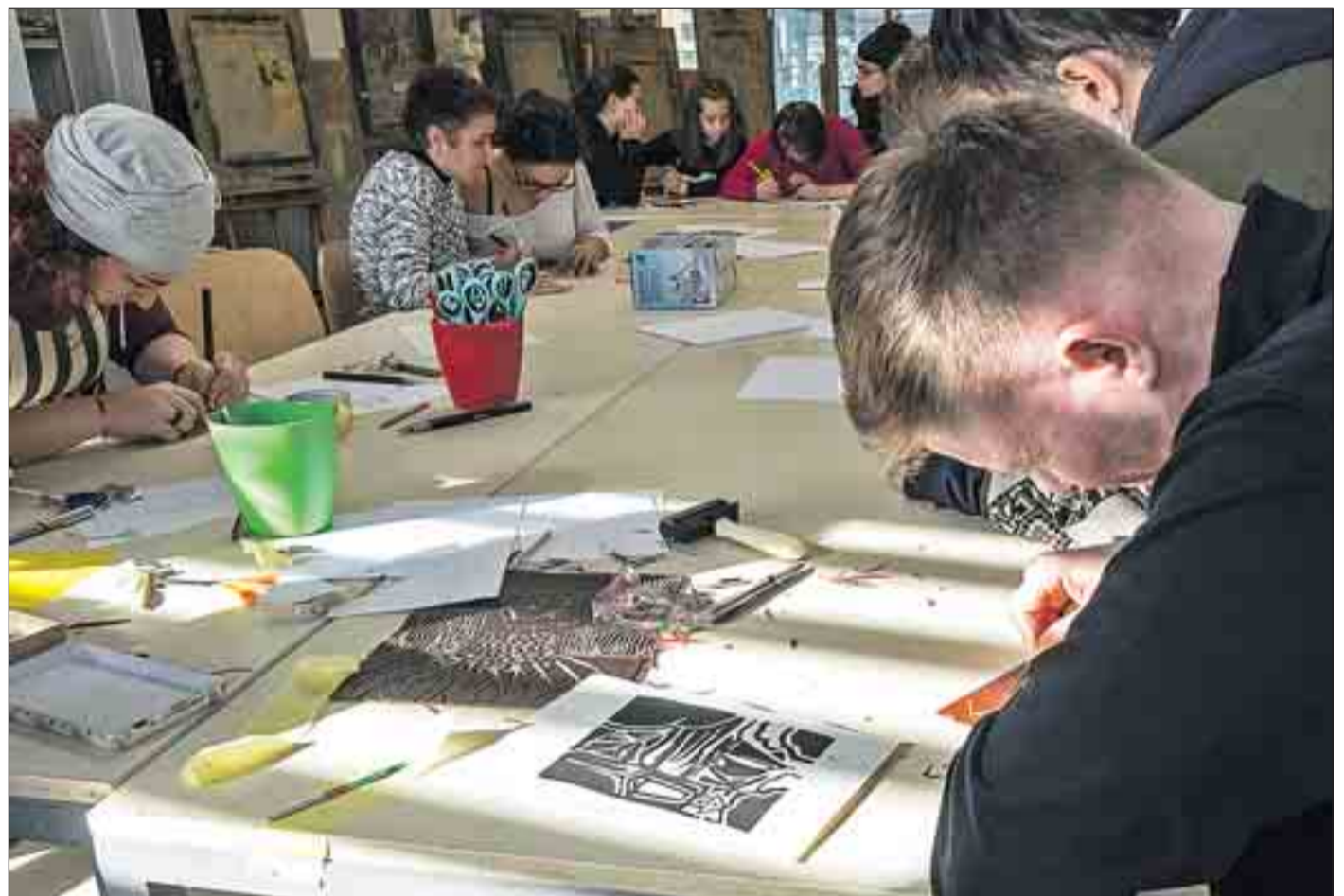
Uno de los talleres que llevaron a cabo los integrantes de la ‘Asociación Berbiquí’ y el centro ocupacional ‘Thikwa’ se realizó en la Escuela de Artes.

La ‘Asociación Berbiquí’ reúne a más de 30 alumnos, de todas las edades, con independencia de que padezcan algún tipo de discapacidad