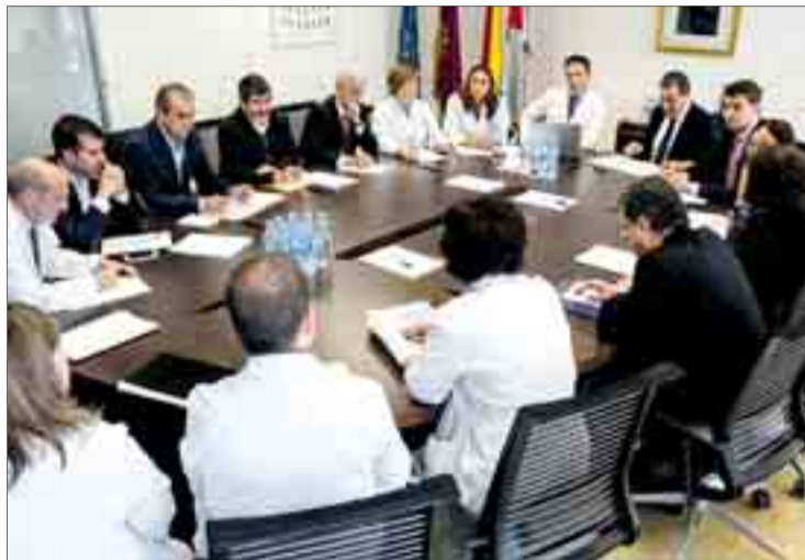
La jornada en el HUBU, visitas y reuniones, tuvo lugar el martes 12.

Entre ellas se encontraría la introducción de nuevos quirófanos, el cambio de concepto del área de digestivo o la incorporación de nuevos equipamientos. Esto supuso, explicó Ibáñez, unos “costes adicionales” para “atender a las exigencias de los profesionales” que, según se planteó en la reunión, habría alcanzado una inversión de