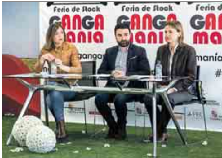
La presentación de la feria y sus actividades tuvo lugar el martes 12.

En esta edición, que se aloja en el Coliseum, se contará también con zona infantil, ludoteca, área de hostelería y talleres de demostración. Por ejemplo, se desarro-