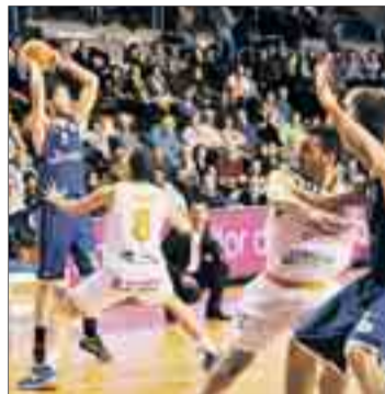
San Pablo busca finalizar en la tercera plaza liguera.

La derrota del viernes 8 en Pumarín frente al Unión Financiera Baloncesto Oviedo no ha restado opciones para el objetivo final. Los pupilos de Diego Epifanio no lo tendrán fácil pese a jugar en el polideportivo El Plantío, ya que reciben a un motivado Cáceres Patrimonio de la Humanidad. Los extremeños se encuentran en el último