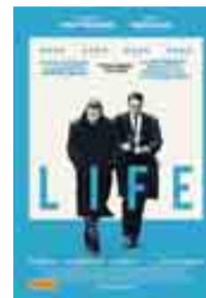
LIFE. Dir. Anton Corbijn. Int. Dane DeHaan, Robert Pattinson. Drama biográfico.

PRESIÓN. Dir. Ron Scalpello. Int. Danny Huston, Matthew Goode. Thriller.