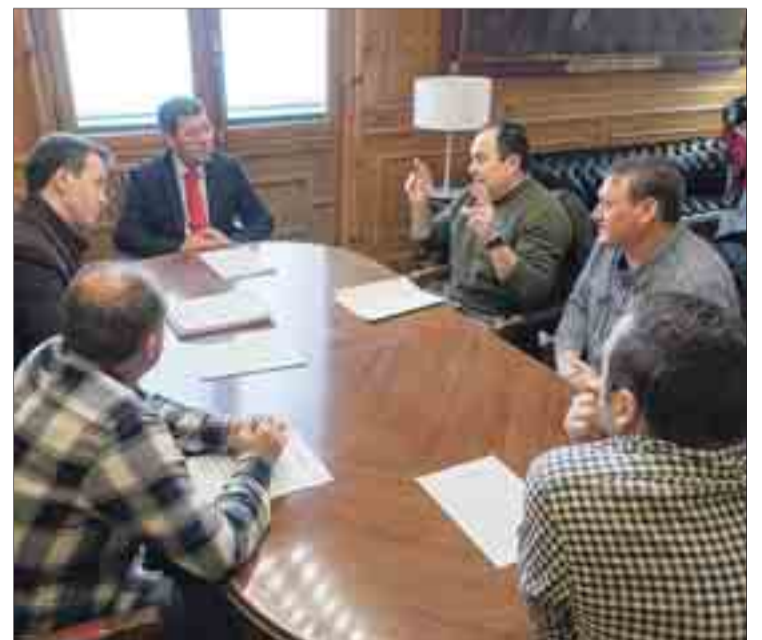
La reunión con los representantes de los bomberos voluntarios se celebró el lunes 11.

Este año la Diputación destina a este servicio 2M€, entre los convenios con los ayuntamientos y la adquisición de material, lo que supone 600.000 más que en 2015.