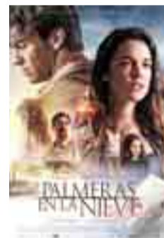
PALMERAS EN LA NIEVE. Dir. Fernando González Molina. Int. Mario Casas, Adriana Ugarte. Drama.