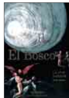
EL BOSCO. LA OBRA COMPLETA. Stefan Fischer. Arte.