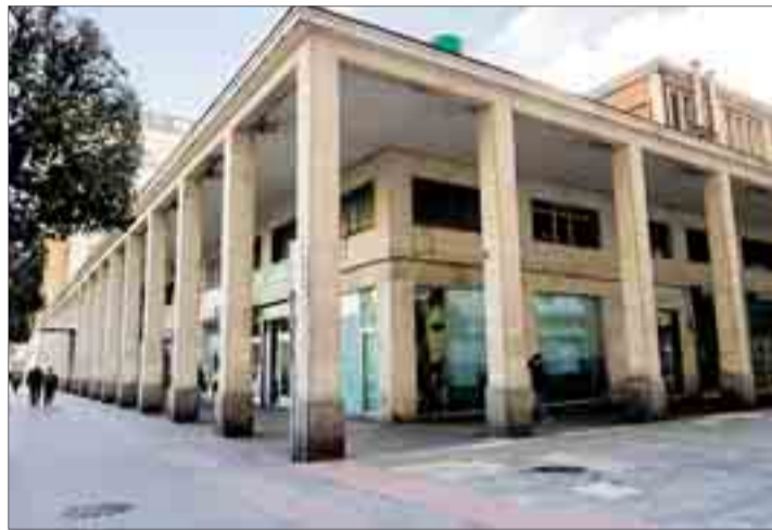
A finales de este año terminan un 50% de las actuales concesiones en el Mercado Norte.

En su comparecencia, De la Rosa planteó que el Ayuntamiento asuma la iniciativa “ante la evidente incertidumbre comercial existente con el Mercado Norte y su progresivo deterioro” y promueva “el consenso suficiente entre los concesionarios para abordar la construcción