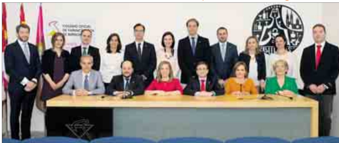
El salón de actos de la sede del colegio burgalés acogió el acto oficial en el que su nueva Junta de Gobierno tomó posesión de sus cargos.

COFBU | La nueva Junta de Gobierno toma posesión de sus cargos