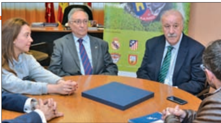
El seleccionador, en un momento de la entrevista

Estamos en un juego en el que puede ocurrir cualquier cosa. Lo que es malo para unos será bueno para otros. Esas situaciones las desdramatizo porque en ocasiones no hay tantas diferencias entre un futbolista y otro. Los que traigamos serán buenos. Podemos equivocarnos, pero no hay grandes diferencias. Y muchas veces, los juicios