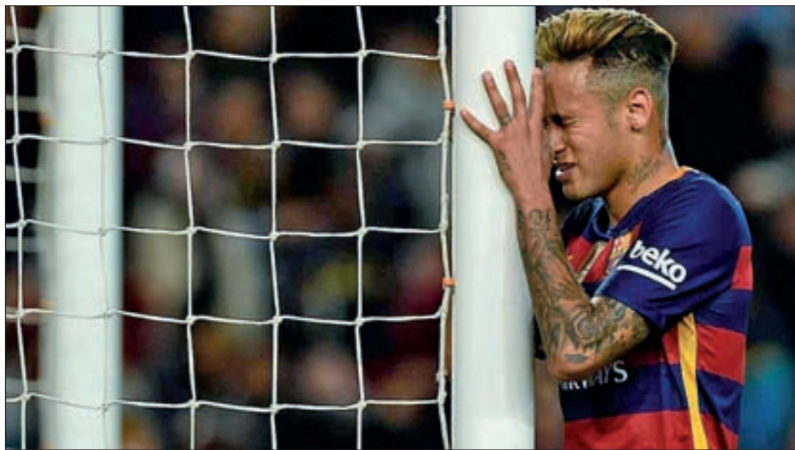
El Barcelona encajó una nueva derrota

Curiosamente, estos tres candidatos ya han saboreado recientemente las mieles propias del campeón del torneo doméstico. El Barcelona defiende la corona del año pasado, mientras que el Atlético de Madrid aspira a repetir la experiencia de 2014, para no tener que esperar tanto tiempo entre alirones, ya que su anterior Liga se remonta a 1996. Por su parte, el Real Madrid levantó su último título en 2012, demasiado tiempo para un club exigido a conquistar campeonatos, por