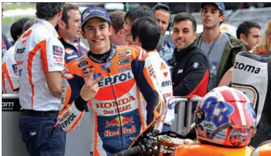
Marc Márquez cerró la gira americana con dos victorias