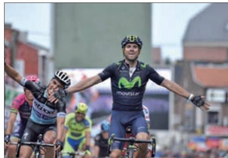
Valverde celebrando su triunfo de 2015

Respecto a los otros candidatos al triunfo, cabe destacar los nombres de Philippe Gilbert, Joaquim Rodríguez, el australiano Simon Gerrans o el irlandés Daniel Martin, que tendrá como escudero a Julian Alaphilippe.