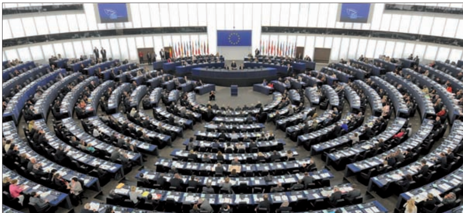
Imagen del Parlamento Europeo