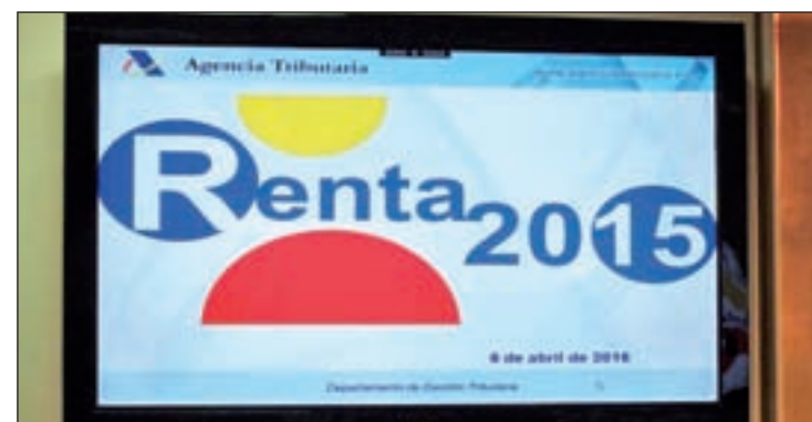
El plazo para presentar el borrador termina el 30 de junio

La AEAT prevé que la presente campaña alcance los 19,7 millones de declaraciones, de las que 14,6 millones tendrán derecho a devolución, con un importe de 10.858 millones de euros. Por otro lado, 4,2 millones de borradores saldrán a ingresar, con 7.948 millones de euros.