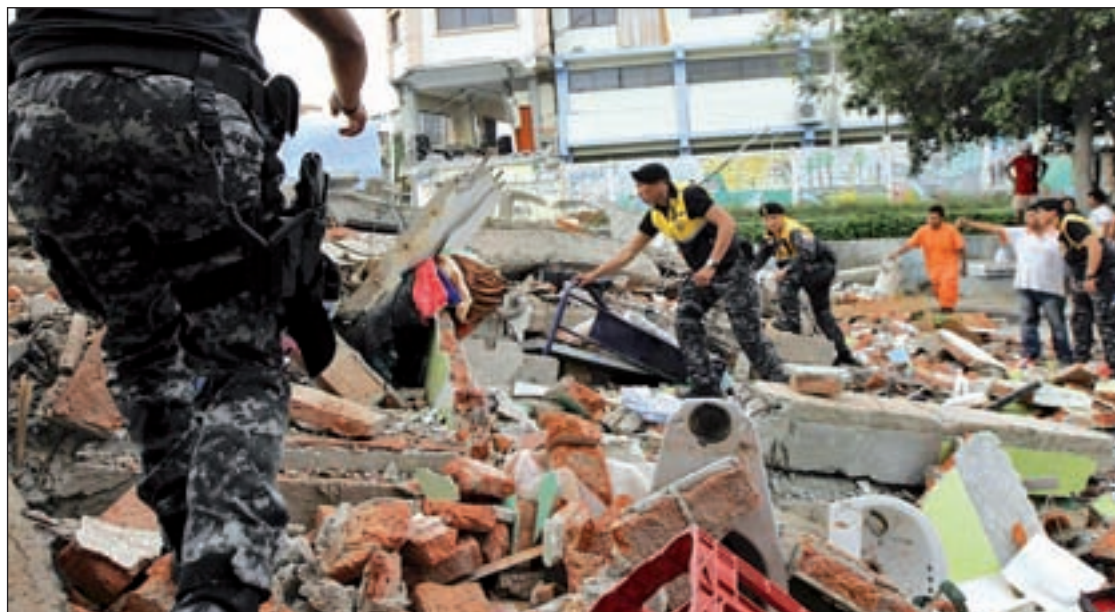
Los heridos superan los 2.500

Según el fiscal, además de extorsionar a los bancos, obtenían fraudulentamente subvenciones y ofrecían "la retirada de la acción penal en algunos procesos previa exigencia de importantes cantidades de dinero", actividades que desarrollaron de forma organizada y prolongada en el tiempo.