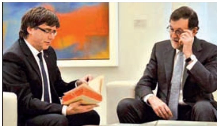
Rajoy y Puigdemont, durante su encuentro en Moncloa

El gobierno del PP enmarcó esta entrevista en la “normalidad insti-