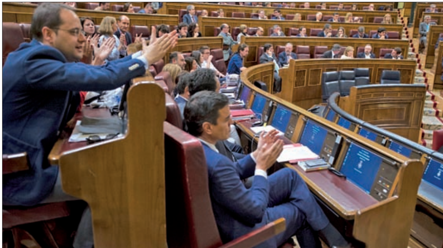
El secretario general del PSOE, Pedro Sánchez, en el Congreso de los Diputados