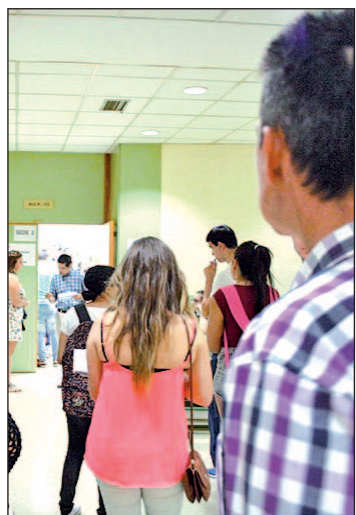
Jóvenes en un instituto

El 46% de los casos gestionados lo sufrieron chicos y chicas de entre 11 y 13 años, pero los autores del trabajo llaman la atención sobre el inicio de este problema, que está empezando a darse ya en niños a partir de los siete años.