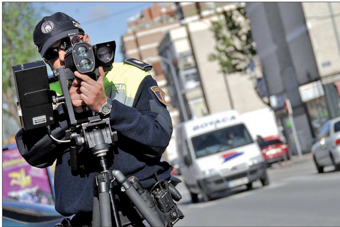
El Ayuntamiento de Madrid, el que más multas emite

Esta lista se debe a que en los núcleos con más población, el número de vehículos en circulación es alto, por tanto el número de sanciones es mayor. Aunque pueda parecer lo contrario, el director general de la fundación indicó que, "a pesar de la percepción, hay menos multas". En los cinco años estudiados el número de sanciones ha ido cayendo, una situación que el informe achaca "a la menor movilidad debido a la crisis". La presión sancionadora