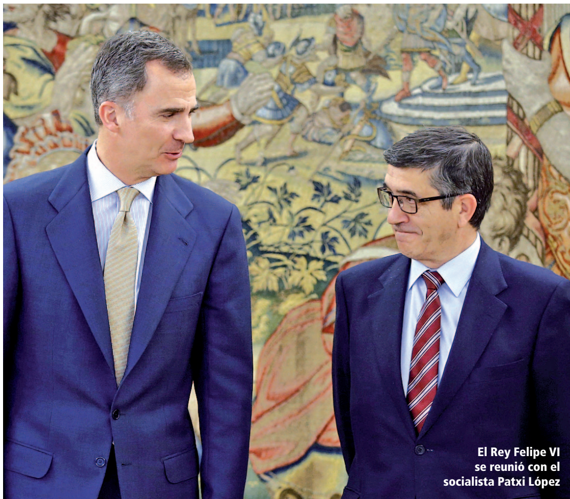
El Rey Felipe VI se reunió con el socialista Patxi López

ra lograr pactos. Será entonces cuando la maquinaria electoral comience a funcionar, con una nueva campaña que se desarrollará entre el 10 y el 24 de junio.