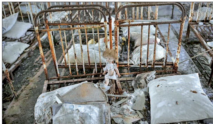
Una de las zonas afectadas por la explosión

En Ucrania, donde se encuentra la central de Chernóbil, los trabajadores convocaron una manifestación ante el Ministerio de Justicia en Kiev para protestar por el bloqueo de las cuentas banca-