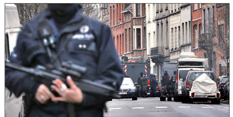
Imagen del asalto a la casa de Salah Abdelsam

La Fiscalía confirmó que los expedientes de ambos se cerraron al considerar que no existía riesgo alguno. Pero, el informe que será el día 3 afirma que esto sucedió por "falta de recursos".