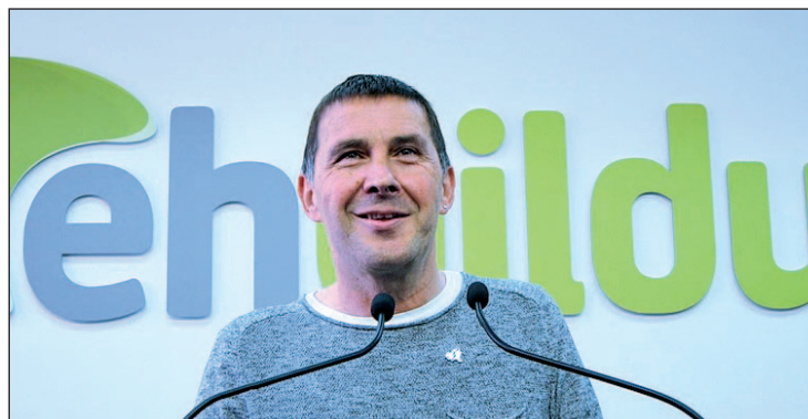
El secretario general de Sortu, Arnaldo Otegi

Otegi cargó contra la política de dispersión de los presos vascos, que no tiene "ningún sentido", "no está justificado jurídicamente" y es "cruel" para los familiares. En este sentido dejó claro que no puede haber un escenario