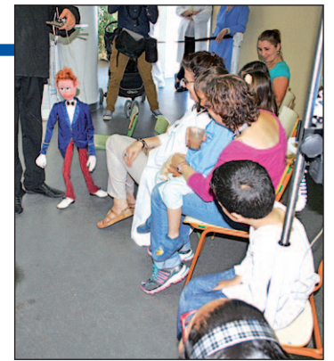
Imagen de una función

una ciudad". Algo que ha identificado con "una fiesta" y un espacio para "la fantasía, la sátira, el esperpento, la parodia" como "remedio saludable contra la hipocresía y el cinismo".