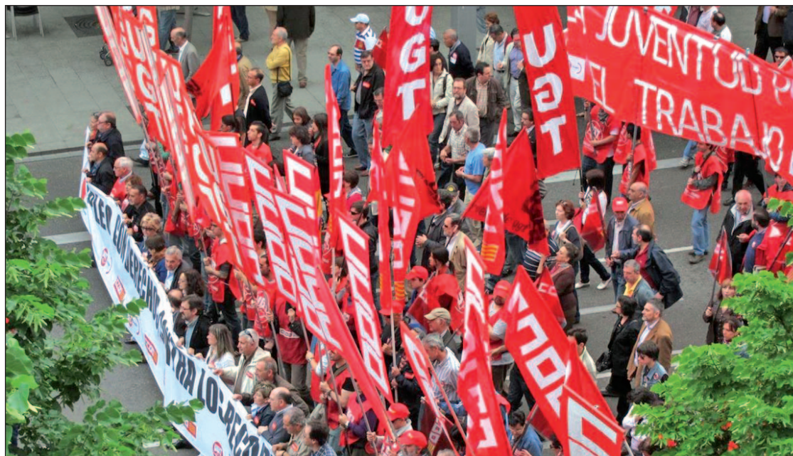
Manifestación del Día del Trabajador del año pasado