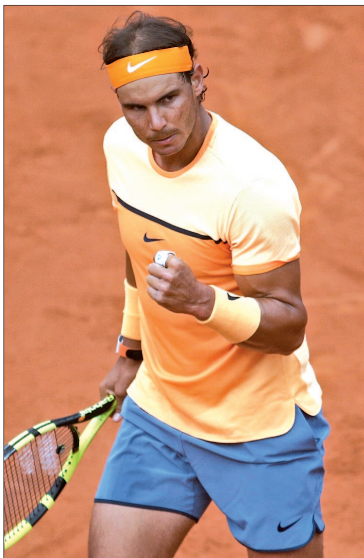
El jugador español llega en un buen momento

La razón de este punto de inflexión se halla en dos torneos recientes, el Masters 1000 de Montecarlo y el Conde de Godó. El regreso a la arcilla parece haber devuelto la confianza al tenista balear, que por primera vez en mucho tiempo ha logrado encadenar dos semanas con un rendimiento importante. Sus sensaciones sobre la pista son cada vez mejores e incluso parece haber superado una de las asignaturas pendientes respecto al año anterior, ganar a algunos de los jugadores con mejor puesto en el ran-