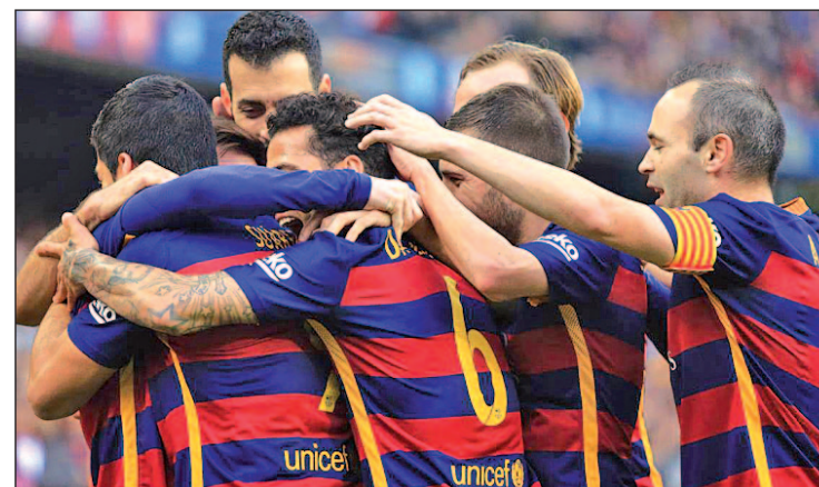
Los azulgranas siguen ocupando la primera posición

En esta carrera a tres bandas, el Real Madrid será nuevamente el que rompa el hielo, visitando (16