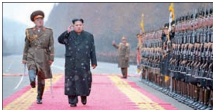
El líder norcoreano, Kim Jong-un

Por otra parte, entre las víctimas hay además 524 miembros de facciones islamistas y rebeldes, así como de las Fuerzas Democráticas Sirias, tres desertores del Ejército, 490 miembros de las fuerzas de seguridad y el Ejército y 395 milicianos leales al Gobierno Sirio.