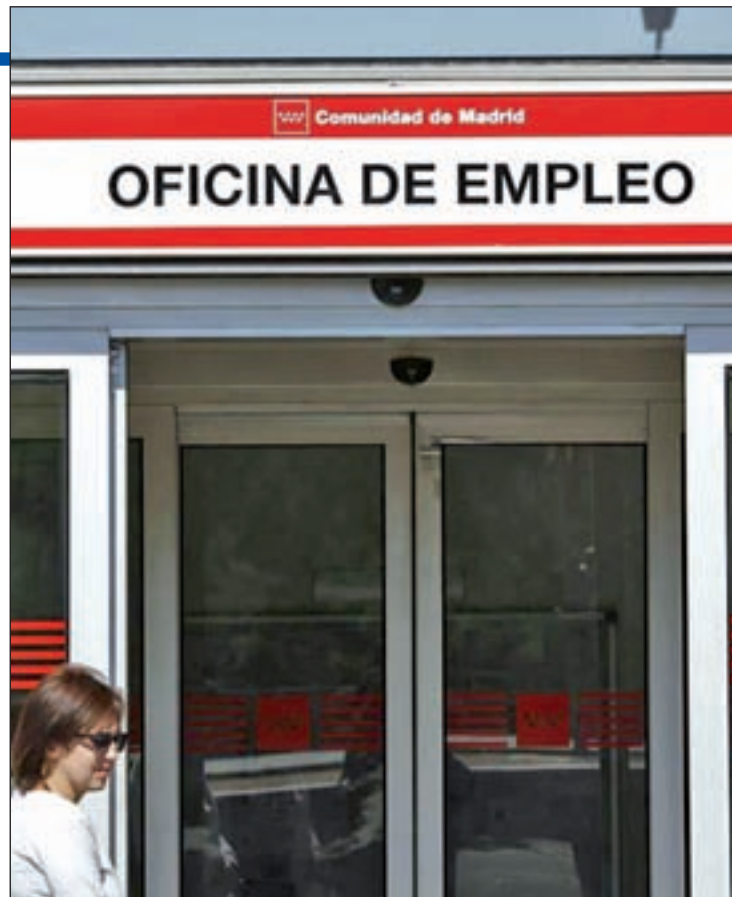
El sector servicios fue donde más bajada de desempleo se registró

El paro se redujo en abril en todos los sectores, menos en el colectivo sin empleo anterior, donde subió en 1.333 personas (+0,4%). La mayor bajada la registraron los