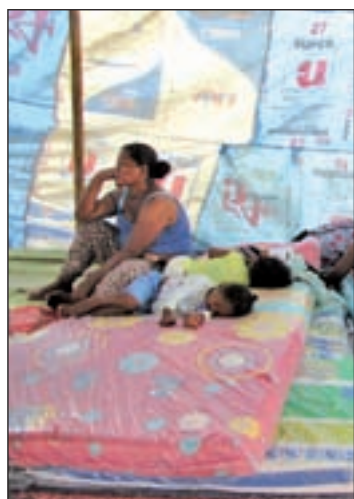
Víctimas del seísmo