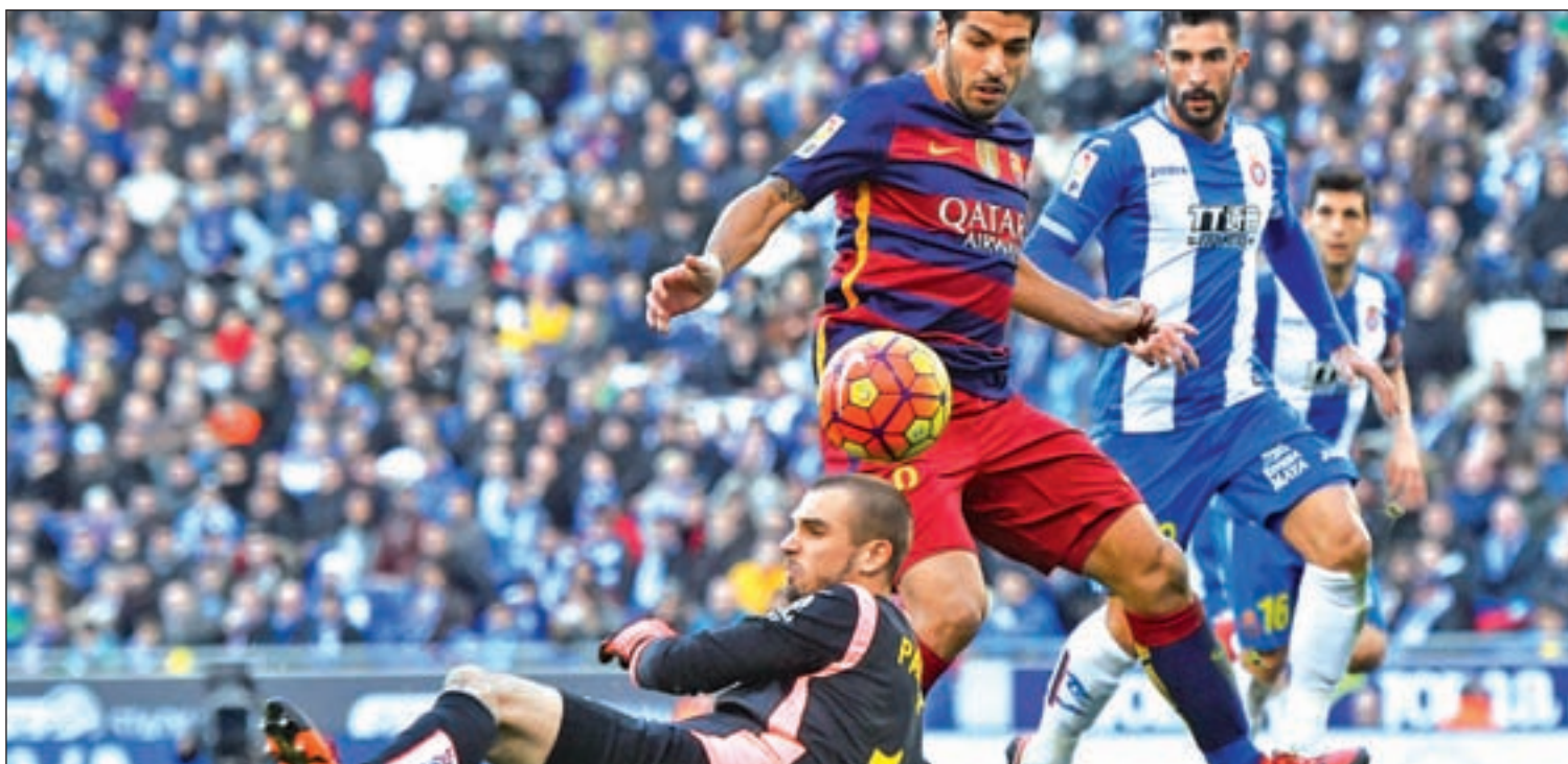
El conjunto de Luis Enrique ha tenido partidos polémicos con sus vecinos 'pericos'