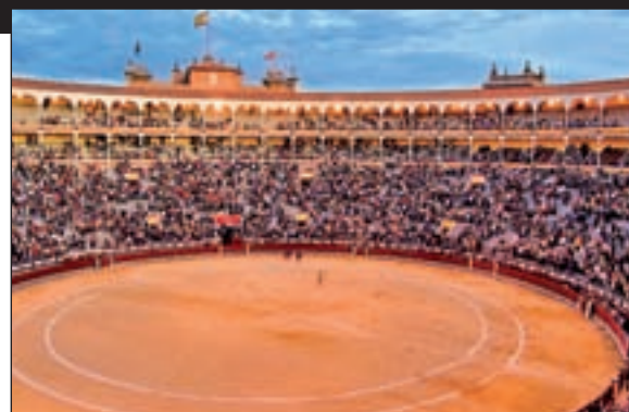
Las Ventas, lista para todo un mes de toros

Sebastián Castella, José María Manzanares y Alberto López Simón