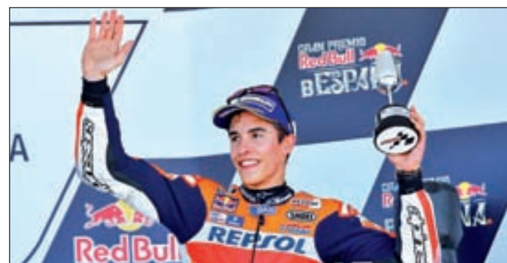
Marc Márquez subió al podio en Jerez

En las categorías de Moto2 y Moto3 las esperanzas españolas están puestas en Alex Rins y Jorge Navarro, respectivamente, segundos clasificados tras Sam Lowes y Brad Binder.