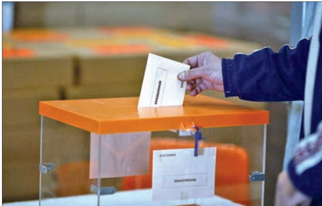
Las próximas elecciones se celebrarán el 26 de junio

Por ello, las principales formaciones ya se han puesto en contacto para que la campaña sea lo más austera posible. Por ejemplo, el líder de Ciudadanos, Albert Rivera, propuso al resto de partidos reducir a la mitad el límite de gasto en el 'mailing' que pasaría a ser