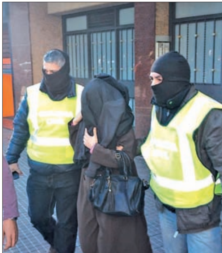
Una de las detenciones que al Guardia Civil ha llevado a cabo

Los detenidos hicieron llegar su mensaje a miles de personas. Además, se concentraban en grupos de su entorno, lo que aceleraba el proceso de radicalización, ya que la información dejaba de transmitirse de forma virtual y se realizaba mediante encuentros personales. Los sospechosos ejercían sobre sus objetivos un control férreo de sus actividades y les llegaban a interpelar no sólo sobre la forma en la que debían interpretarse las noticias sino sobre