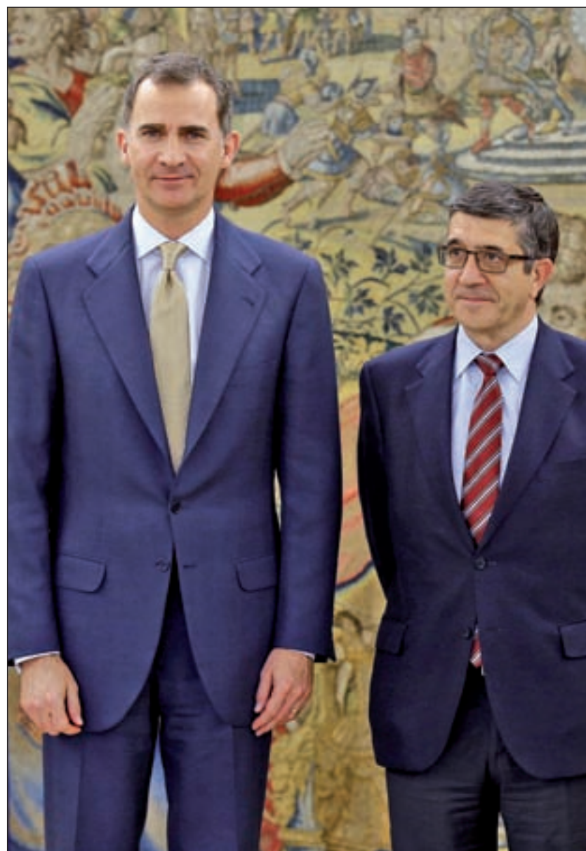
El Rey Felipe VI, junto a Patxi López

Todo esto para afrontar unos comicios en los que el panorama puede ser muy similar. De hecho, según la última encuesta del CIS, el 78,4% de los electores no habría cambiado de papeleta aunque