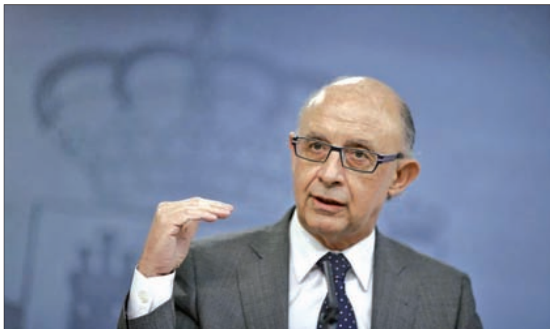
El ministro de Hacienda, Cristóbal Montoro