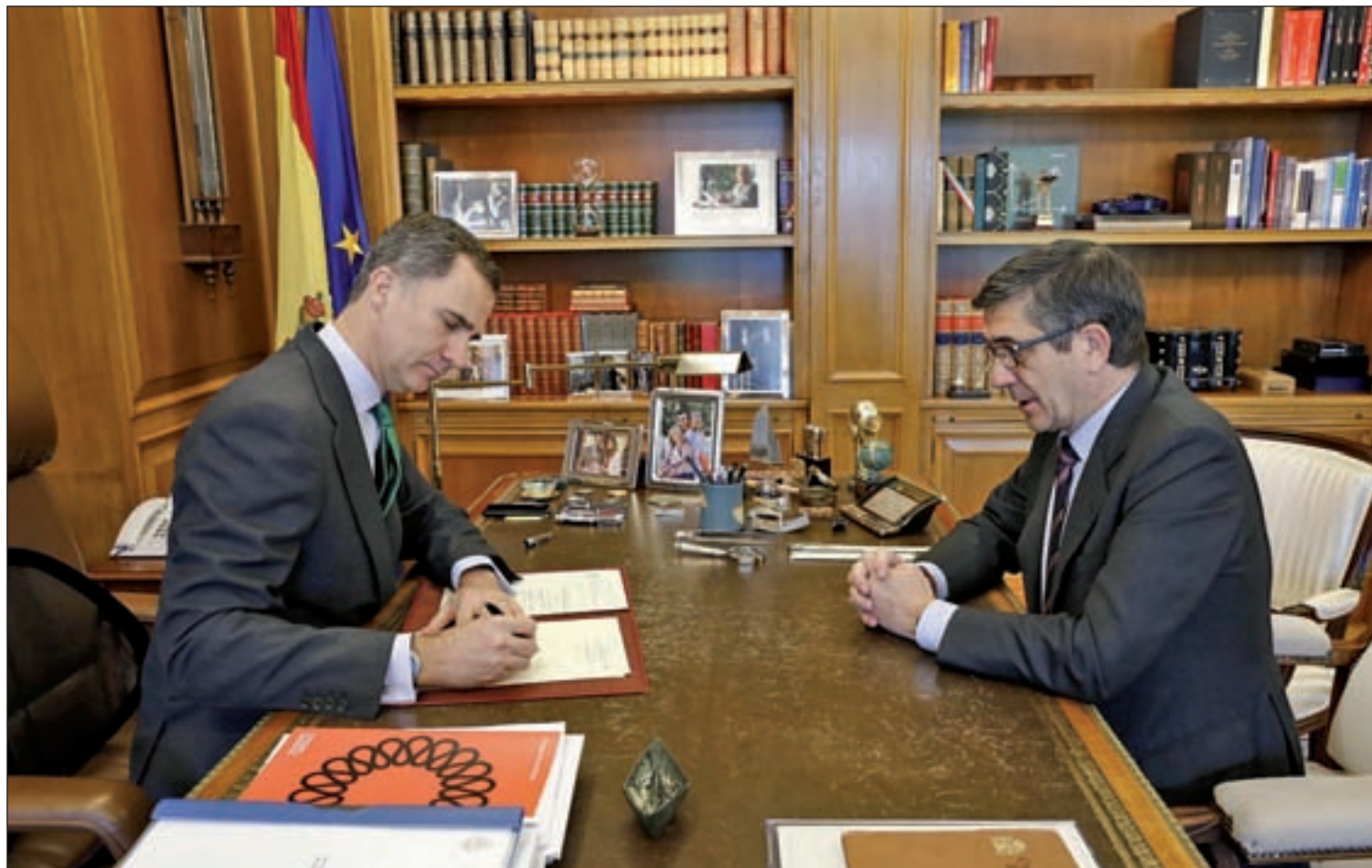
Felipe VI firmó el decreto en presencia de Patxi López, presidente del Congreso

Los españoles vivirán la repetición de la campaña y de los comicios después del fracaso de los partidos en la búsqueda de acuerdos • La cita con las urnas costará 136 millones de euros PÁGS. 2 Y 4