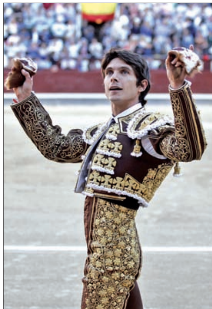
Castella ya sabe lo que es salir por la puerta grande en San Isidro

expectación ha suscitado. Tras su memorable actuación como novillero en abril de 2015, este diestro peruano aparece anunciado en tres festejos, confirmando una alternativa que tomó en la localidad francesa de Nimes el pasado mes de septiembre. Hablando del país galo, Sebastián Castella se presenta como otro de los nombres propios en la previa de San Isidro, al ser el torero con más presencias en la feria. Nada menos que cuatro corridas lidiará el diestro de Béziers, superando a otras figuras consagradas como Alejandro Talavante, Alberto López Simón o Manuel Escribano, uno de los protagonistas de la reciente Feria de Abril tras indultar a un bravo ejemplar de Victorio Martín. El propio Escribano estará en una de las corridas fuera de abono, la de la Beneficencia.