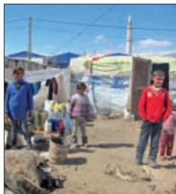
Uno de los campamentos

Con ello Bruselas deja de lado su idea de crear una ventana única para gestionar un sistema de reparto de cuotas de acogida permanente, y propone reformar el reglamento de Dublín, que obliga a resolver el expediente de asi-