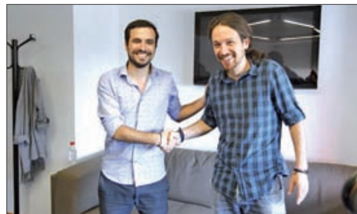
Pablo Iglesias y Alberto Garzón

Para seguir avanzando en el proceso, los representantes de ambos partidos seguirán trabajando durante toda la semana con el objetivo de intentar posibilitar un acuerdo final con el que concurrir a las elecciones generales.