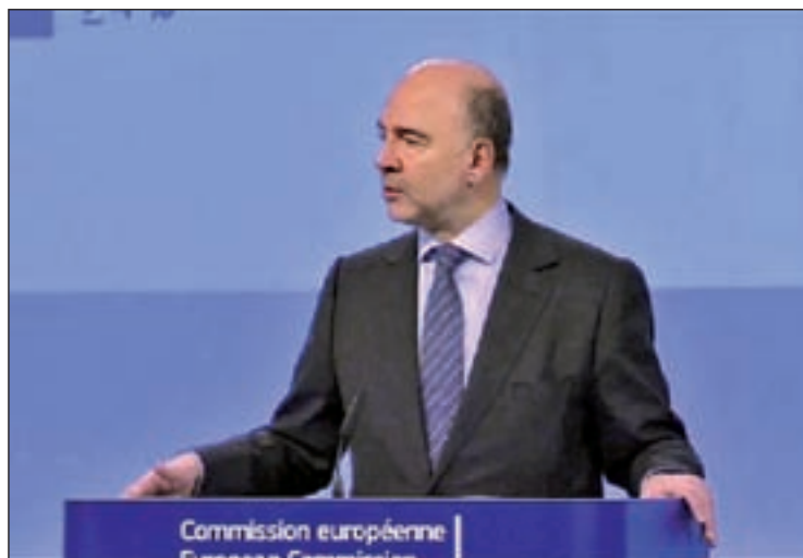
El comisario europeo, Pierre Moscovici

Por último, Moscovici declaró que “en general, las previsiones de la Comisión sobre España son acertadas”.