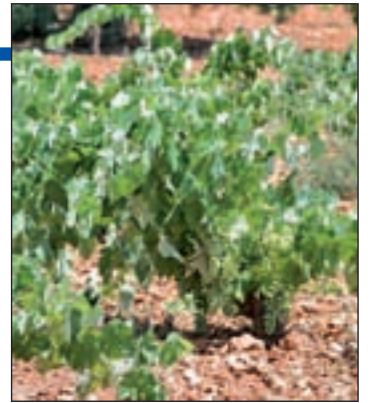
Viñas de Cebreros

En las viñas trabajan 1.600 viticultores y producen 10 millones de kilos de uva y ocho las bodegas existentes, que comercializan en torno a 70.000 hectolitros.